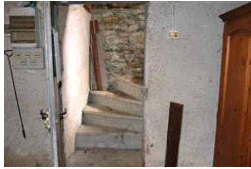
Ingresso piano interrato