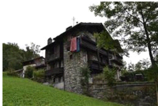
Facciata angolo ovest