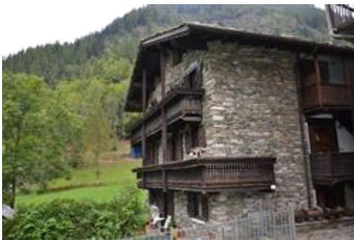
Facciata angolo sud