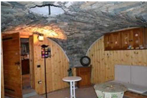
Taverna piano interrato