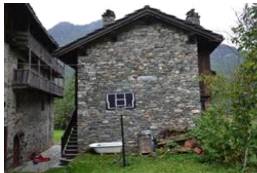
Facciata lato nord-est