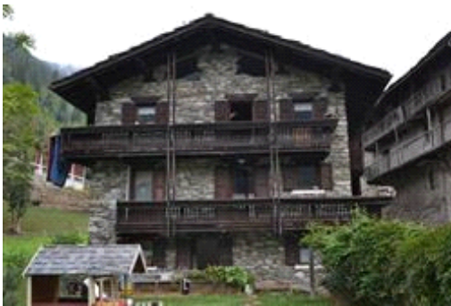
Facciata lato sud-ovest