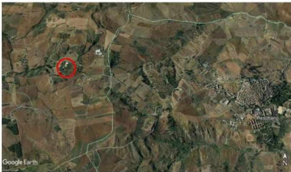
Immagine satellitare con indicato il lotto

Immobile sito in Petralia Sottana nella Contrada Ponte Ciamparella snc - Identificato al N.C.E.U. del Comune di Petralia Sottana al fg.84 p.la.310