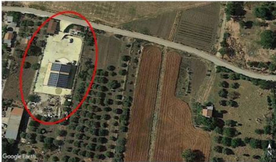
Ingrandimento immagine satellitare con indicato il lotto