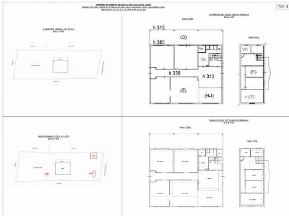
Confronto planimetria catastale con rilievo stato di fatto