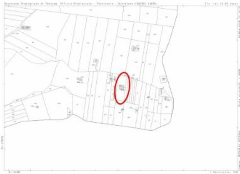
Estratto di mappa con indicato il lotto