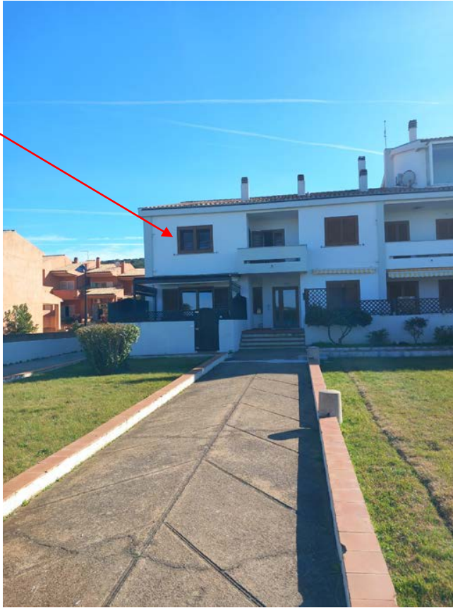
Foto 3 Particolare della vista dell' ingresso principale