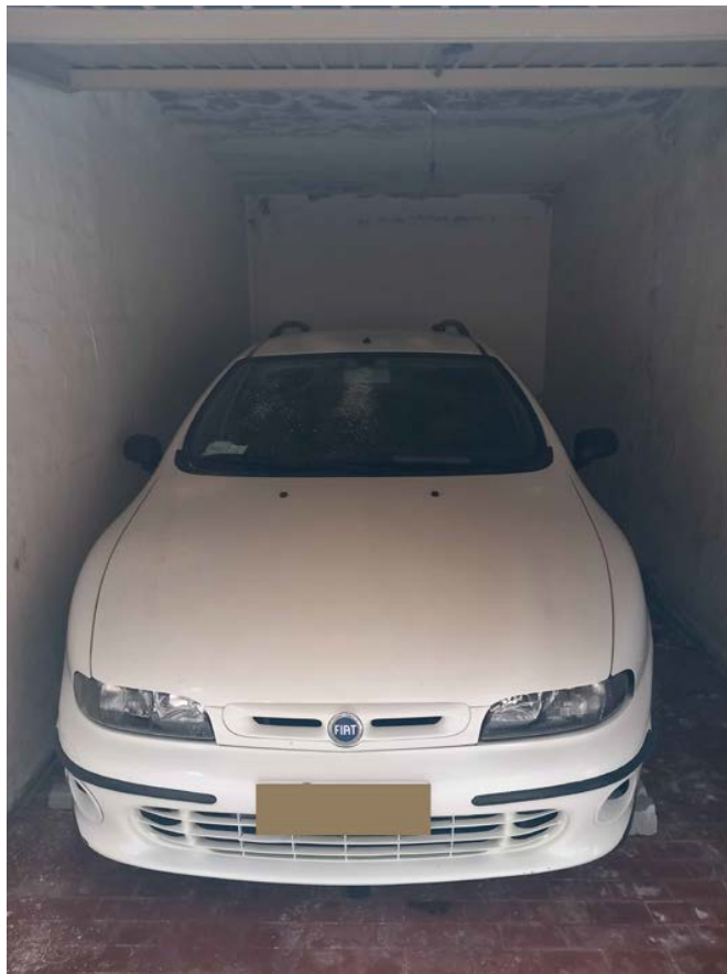
Foto 14 Box auto coperto.