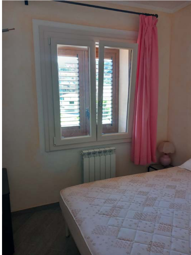
Foto 6 Ambienti della zona notte .