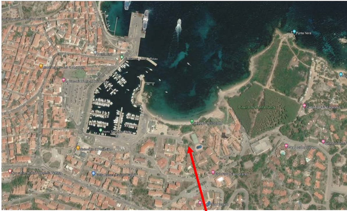
Foto 1 - Ubicazione dell' immobile nel contesto urbano di Palau