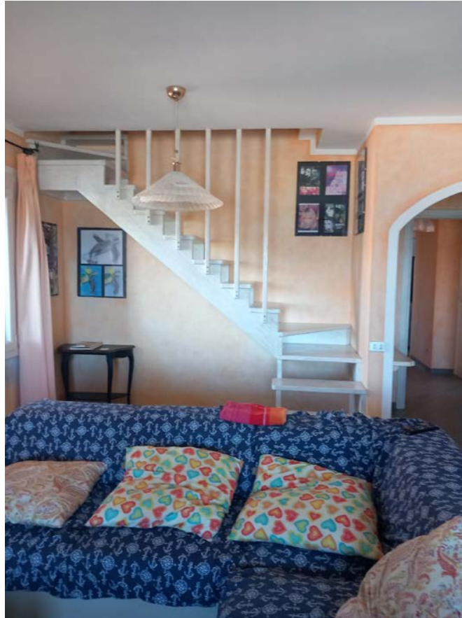
Foto 10 Accesso al piano sottotetto .