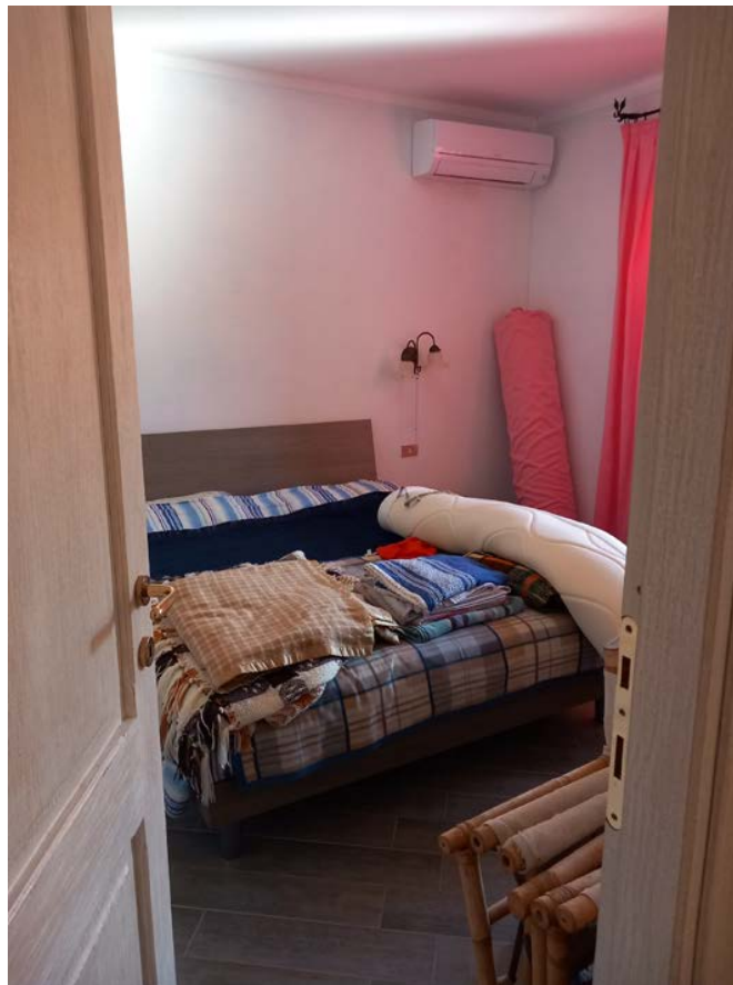
Foto 7 Ambienti della zona notte .