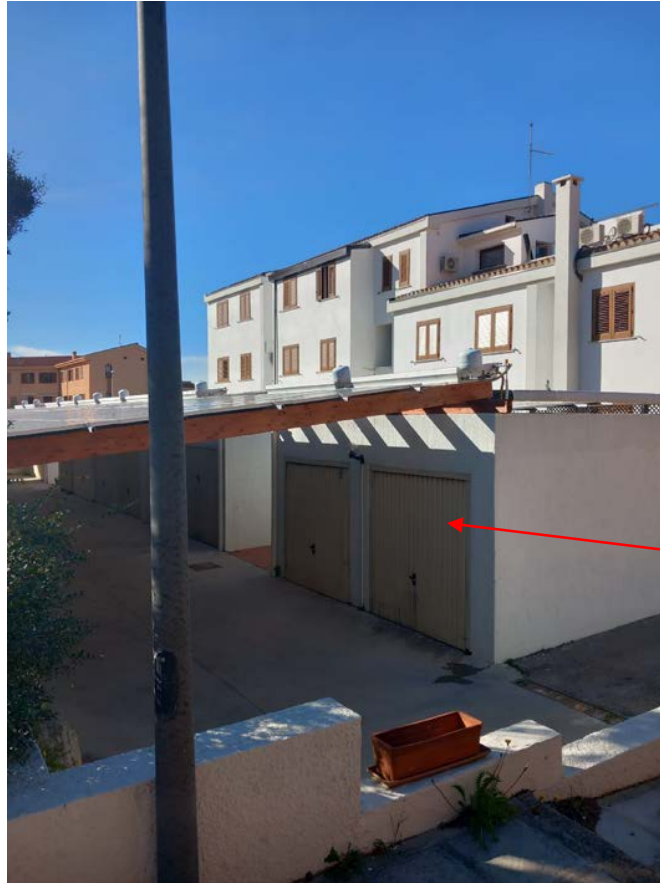
Foto 13 Retro del condominio Box auto coperto .