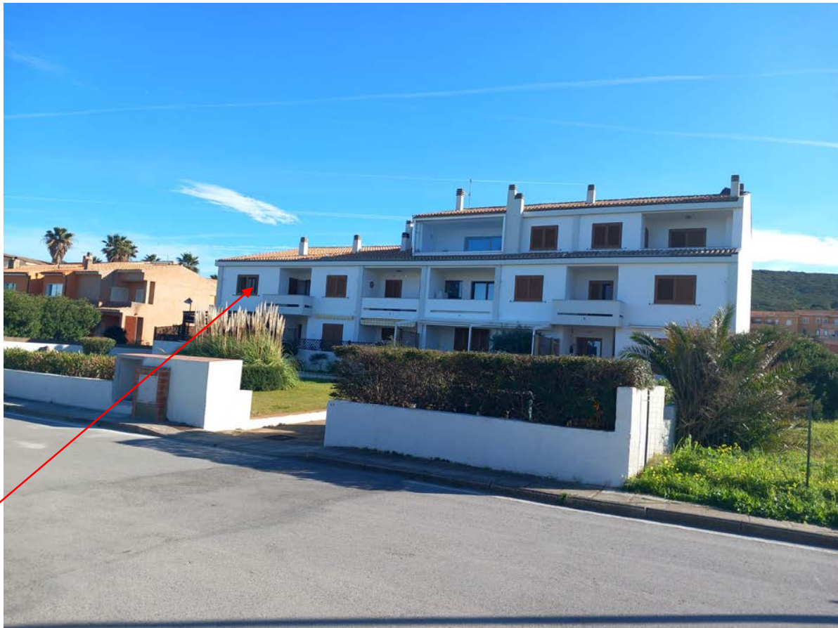
Foto 2 - L' edificio condominio "l'Isolotto" facciata prospiciente la Via di Riva dei Lestrigoni;