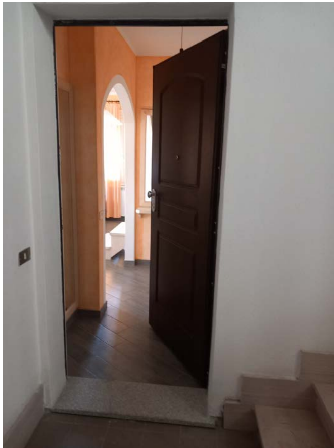
Foto 4 Particolare ingresso