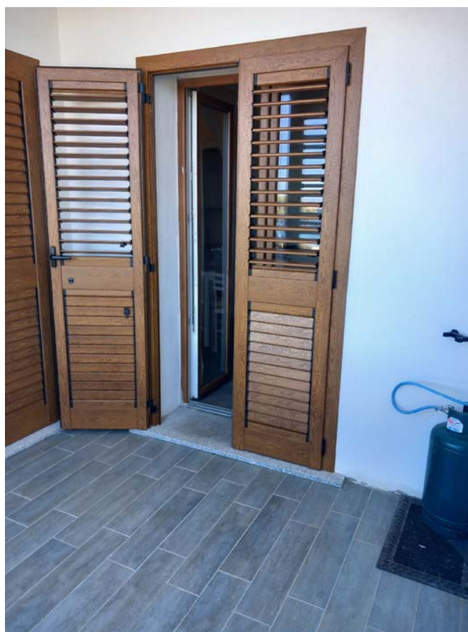
Foto 5 Terrazzo Esterno .