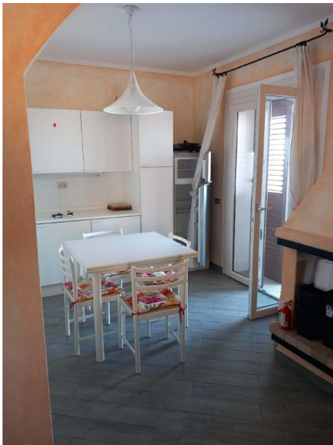
Foto 5 Zona Giorno Cucina .