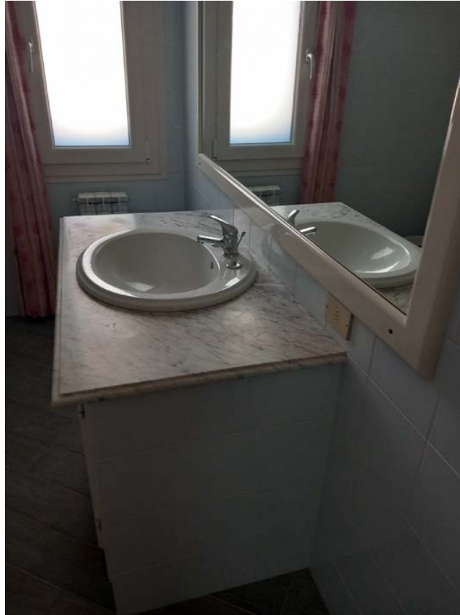
Foto 8 Ambienti della zona notte.