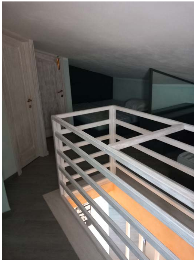
Foto 11 Piano Sottotetto .