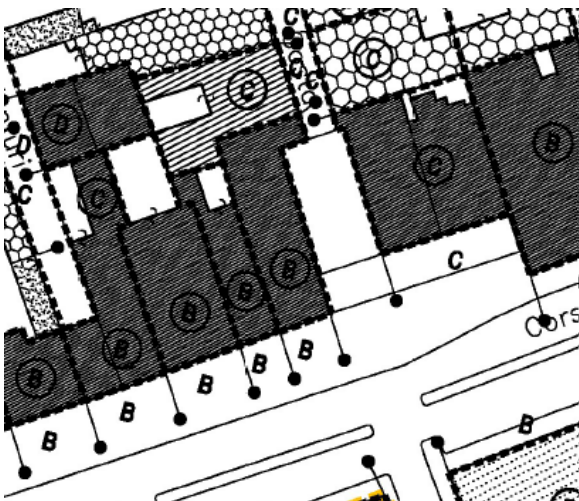
Stralcio di Tav-P1.1 DP Capoluogo-Class tip-Val arch