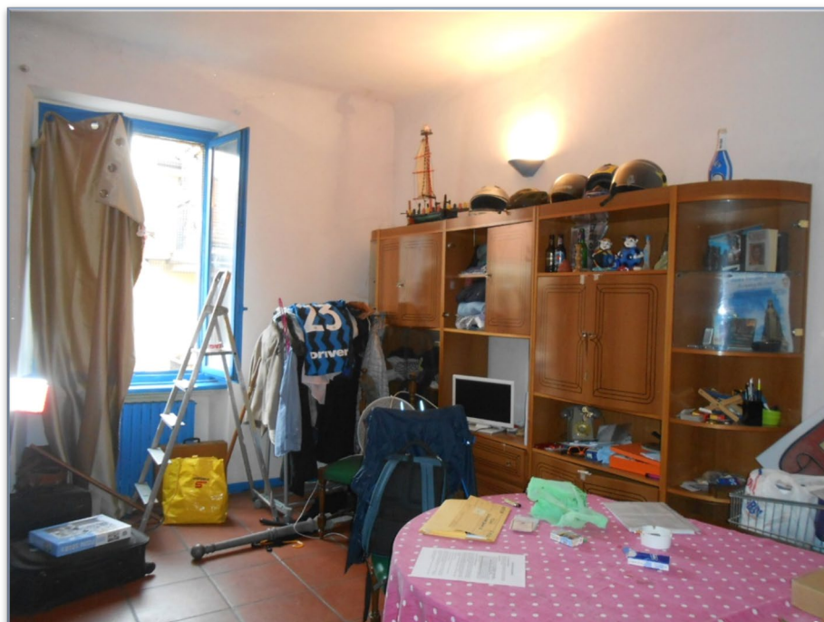
Foto 10 camera