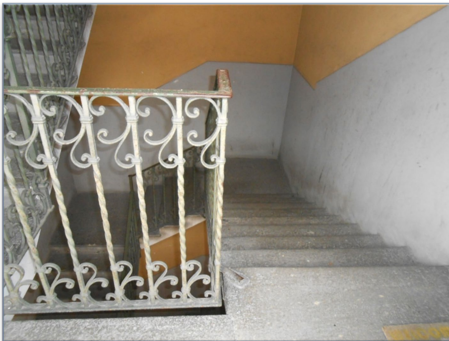
Foto 5 parti comuni