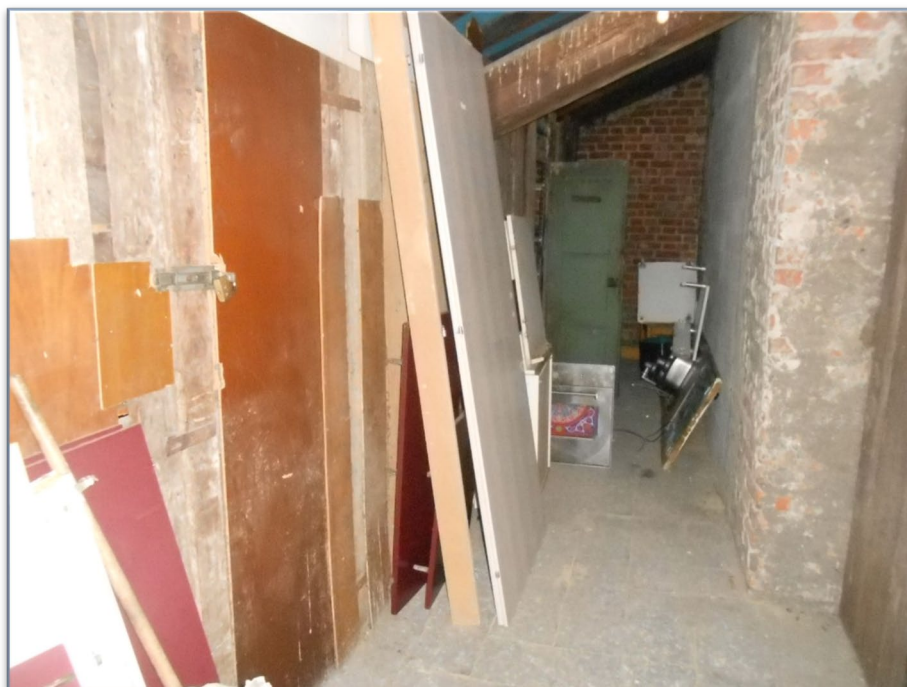
Foto 16 parti comuni