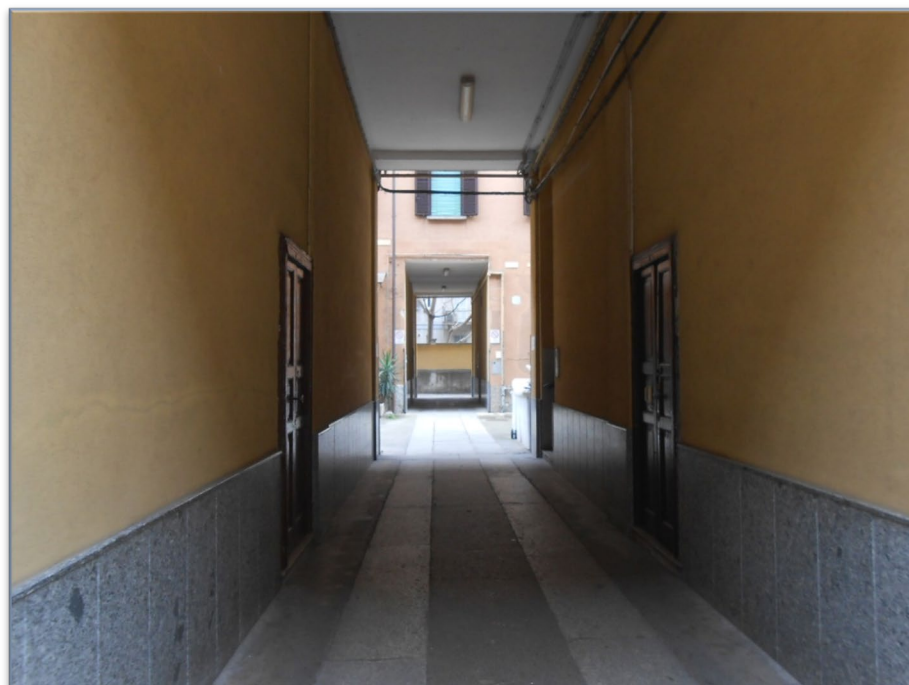
Foto 2 parti comuni