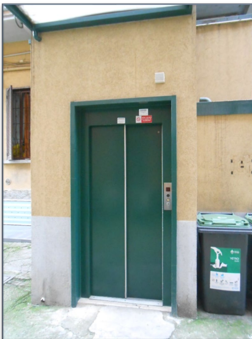
Foto 4 parti comuni