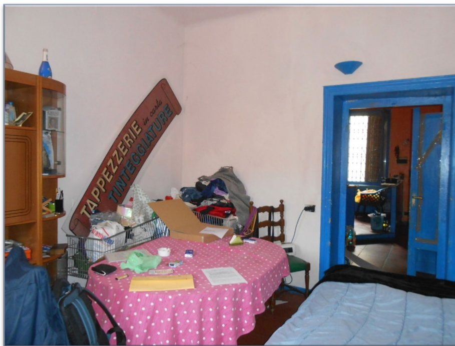
Foto 11 camera