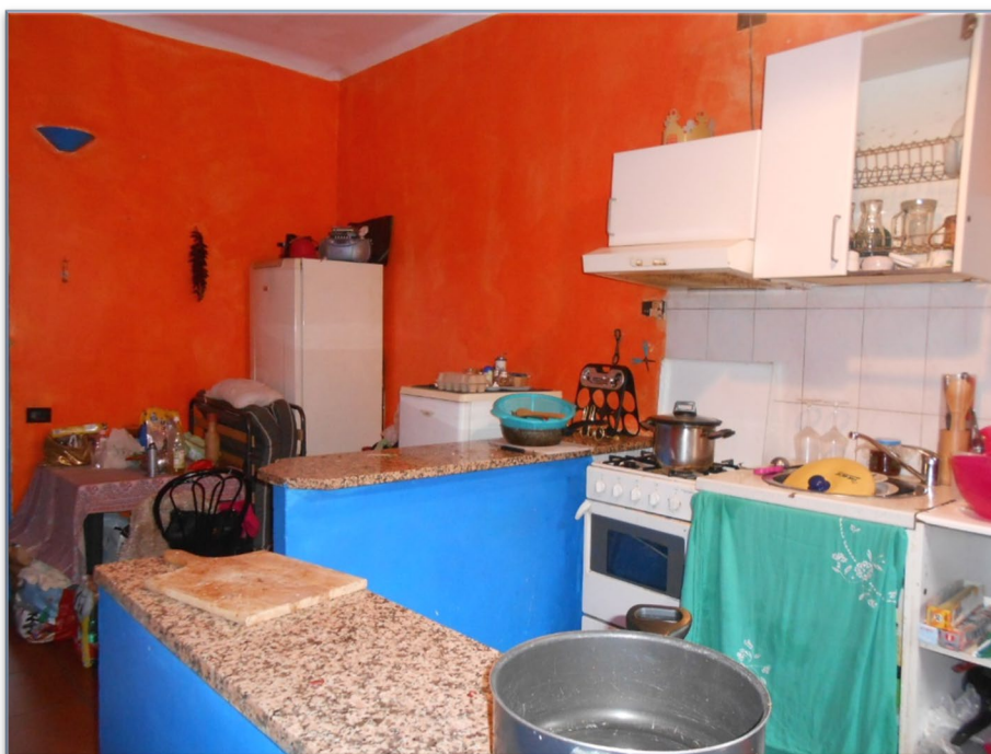
Foto 9 soggiorno/cucina