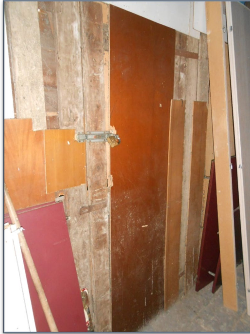
Foto 17 porta ingresso solaio