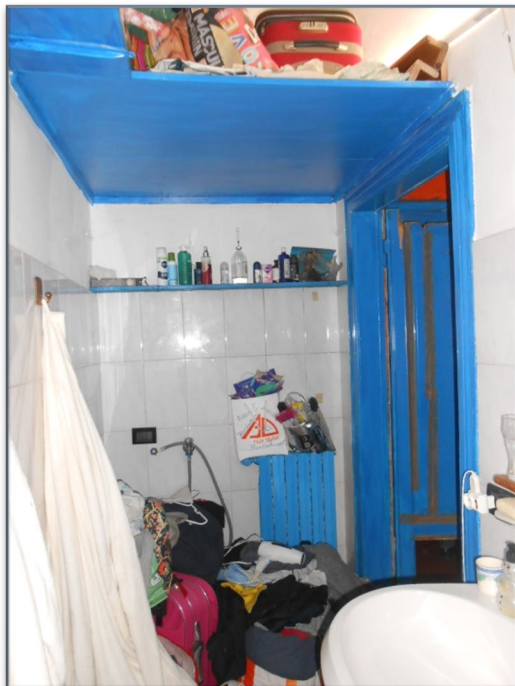
Foto 13 bagno