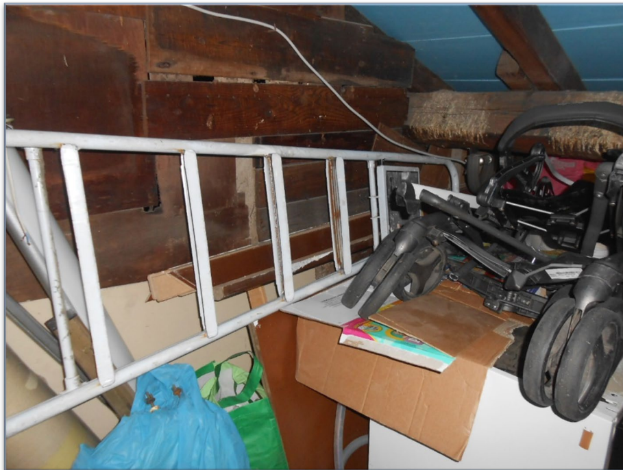
Foto 18 solaio