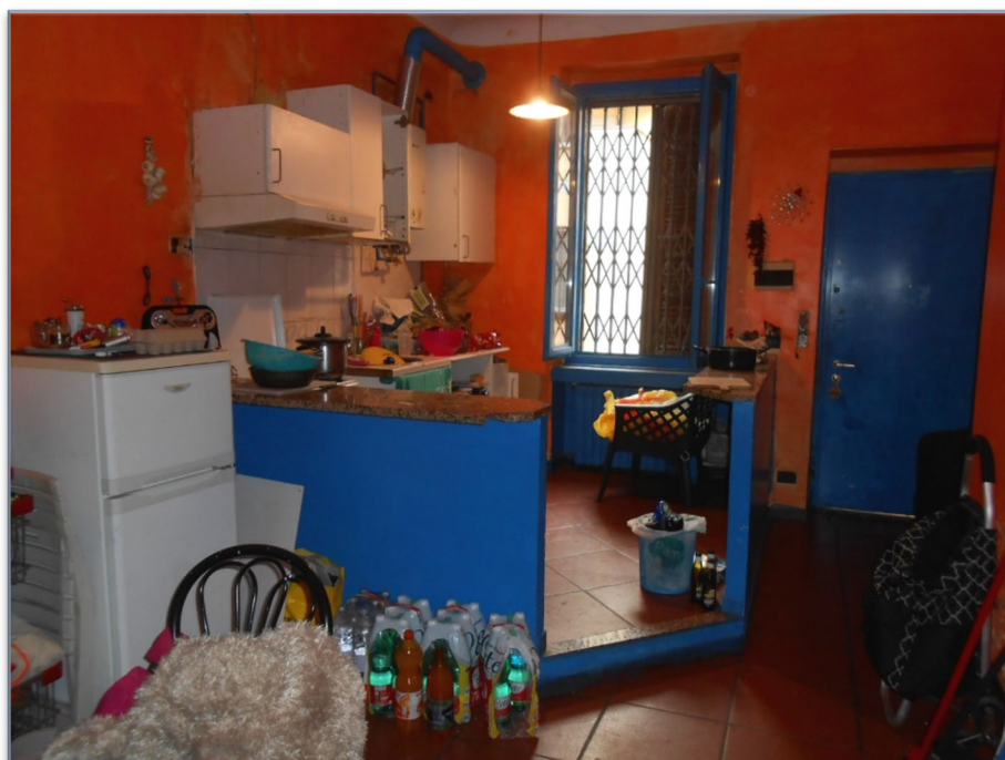
Foto 8 soggiorno/cucina