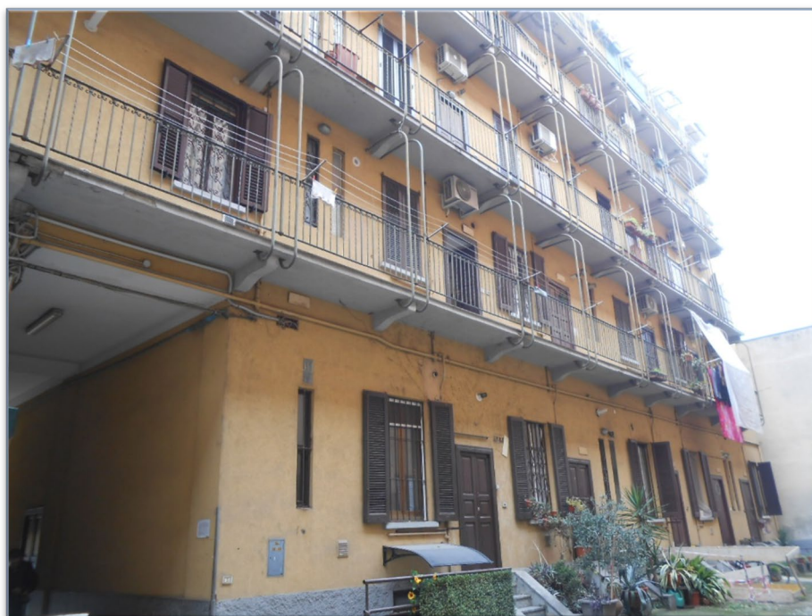
Foto 1 Corpo interno scala B