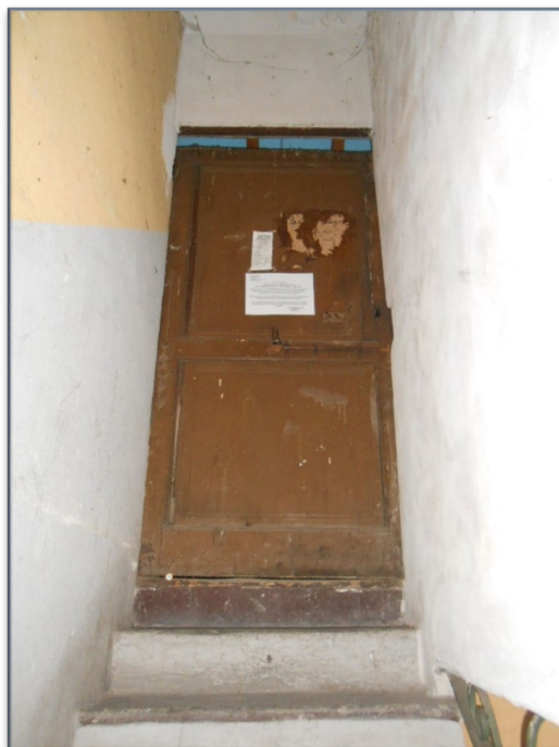
Foto 15 porta ingresso zona solai