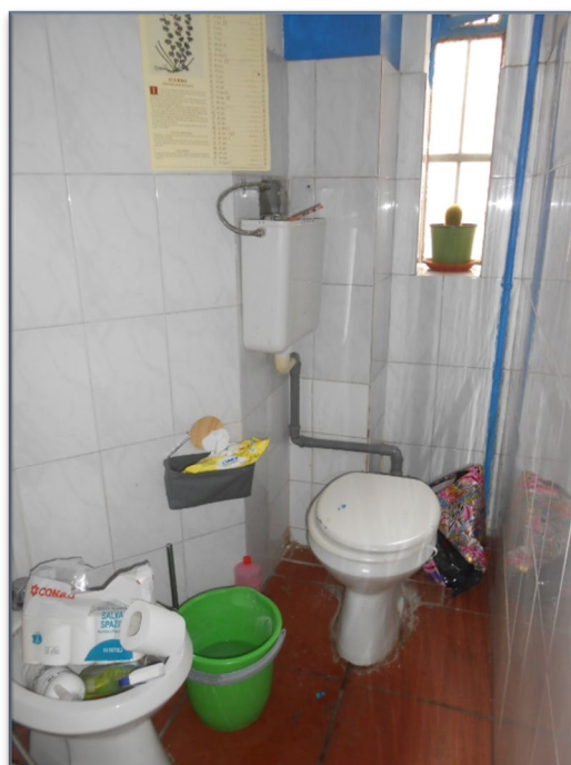
Foto 12 bagno