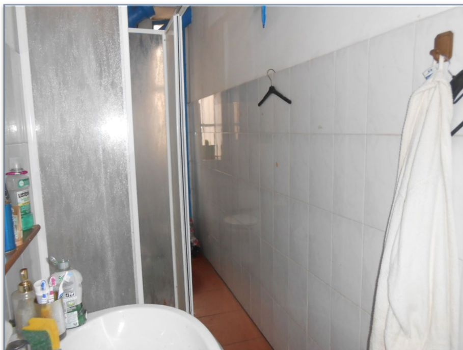
Foto 14 bagno