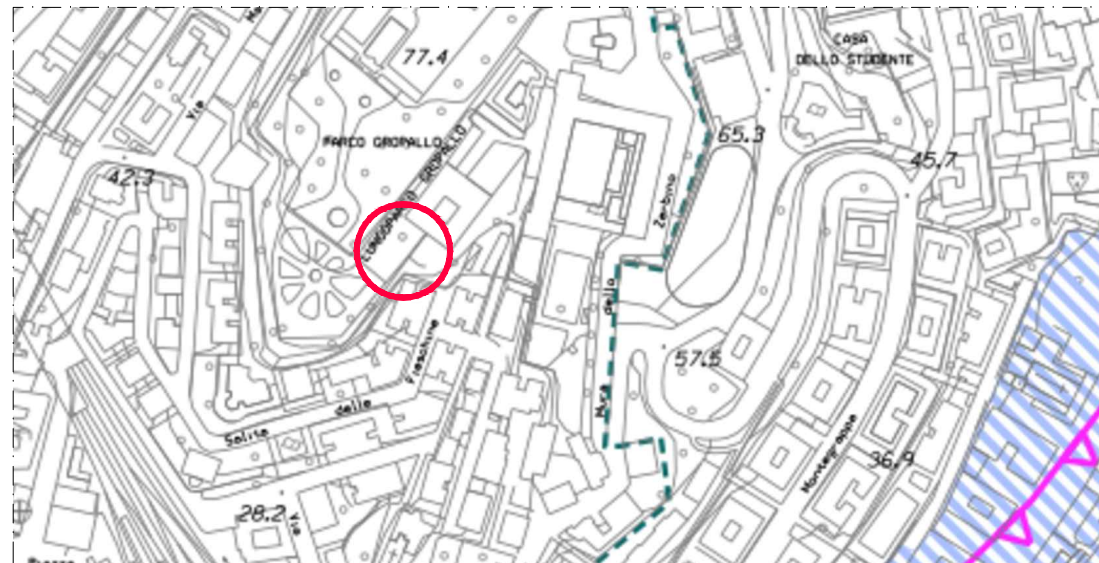
Stralcio PUC VIGENTE COMPONENTE GEOLOGICA - TAV 38

oggetto : FALLIMENTO IMMOBILIARE N.F.25/2021 - LOTTO n. 3