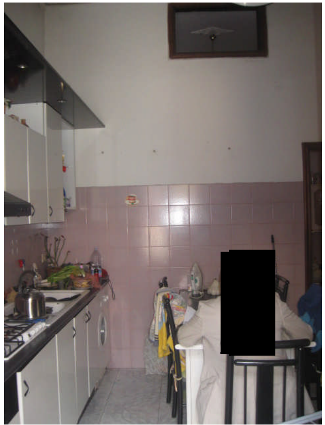
viste cucina pranzo