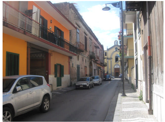
viste dalla strada