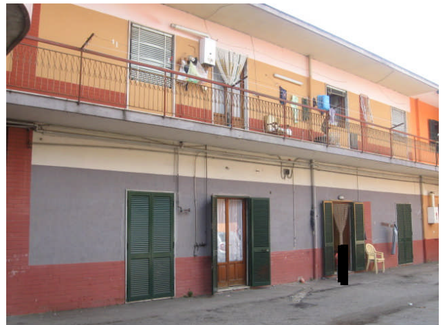
viste dal cortile