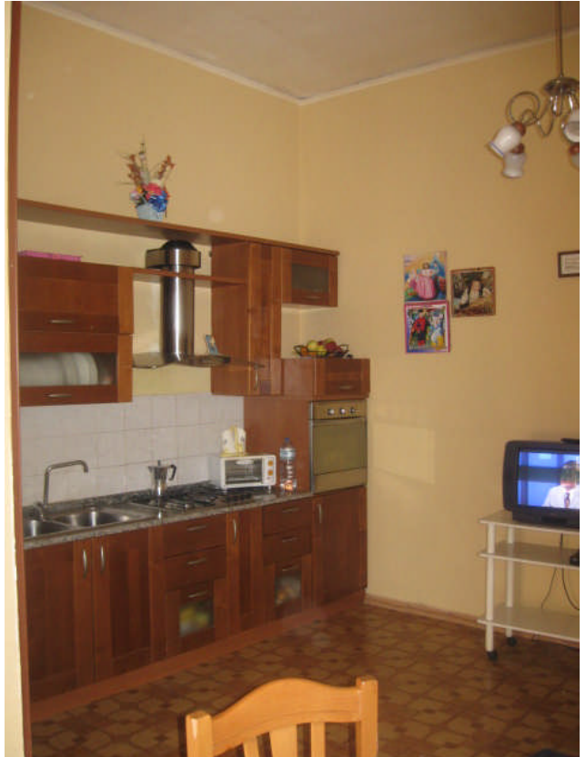
viste cucina pranzo