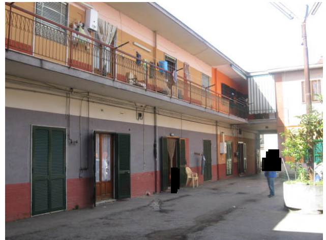
beni pignorati visti dal cortile verso la strada