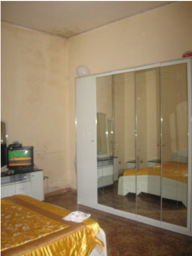
viste camera da letto