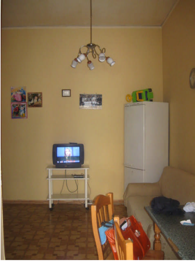
altra vista zona pranzo