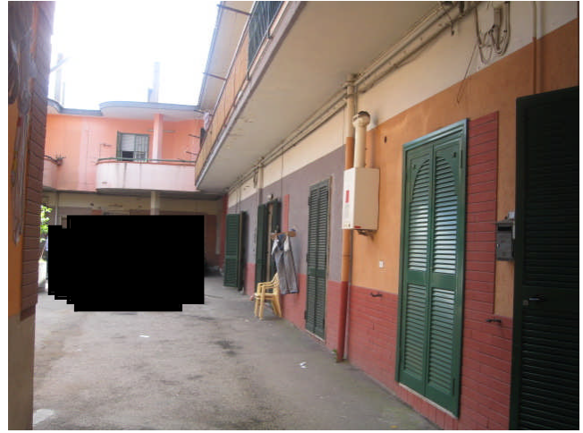
alloggio visto dal cortile