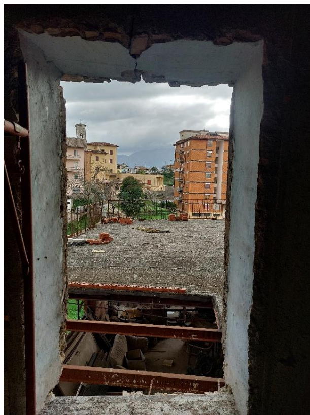
Porzione del solaio di copertura della veranda da ripristinare