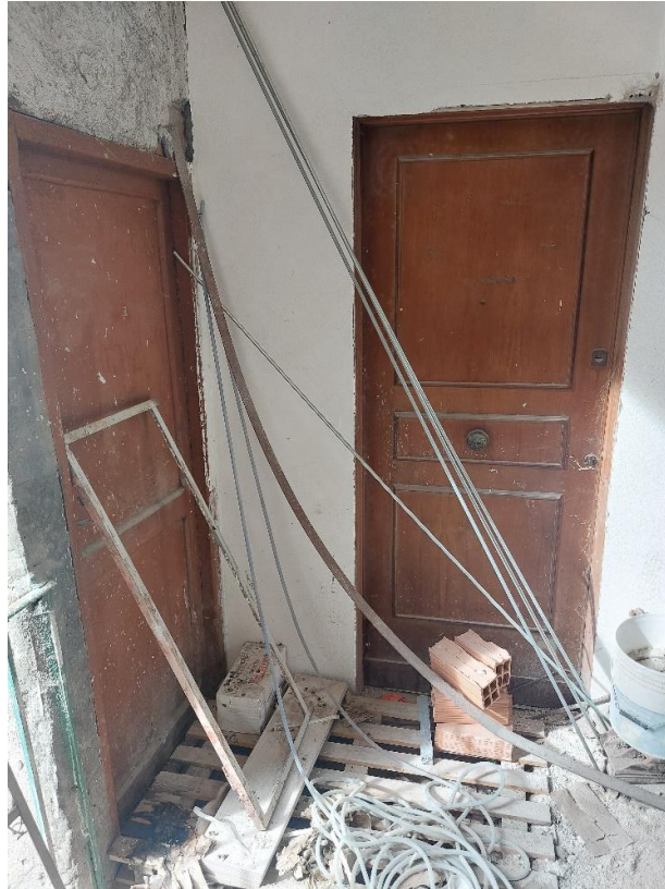
Porta di accesso dal vano scale comune all'unità immobiliare e al locale ripostiglio