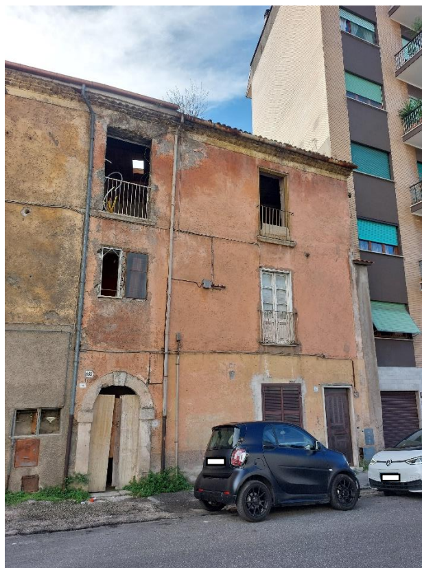
Accesso nel fabbricato e prospetto da via Casilina Nord