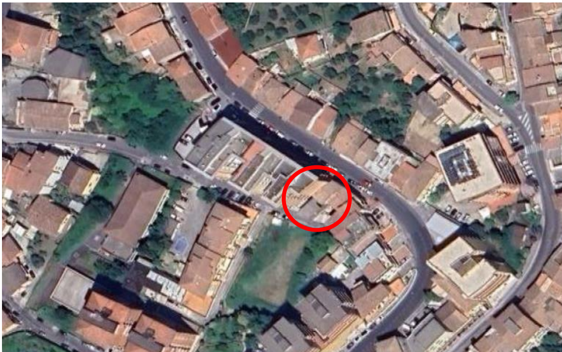
Ubicazione urbana del fabbricato