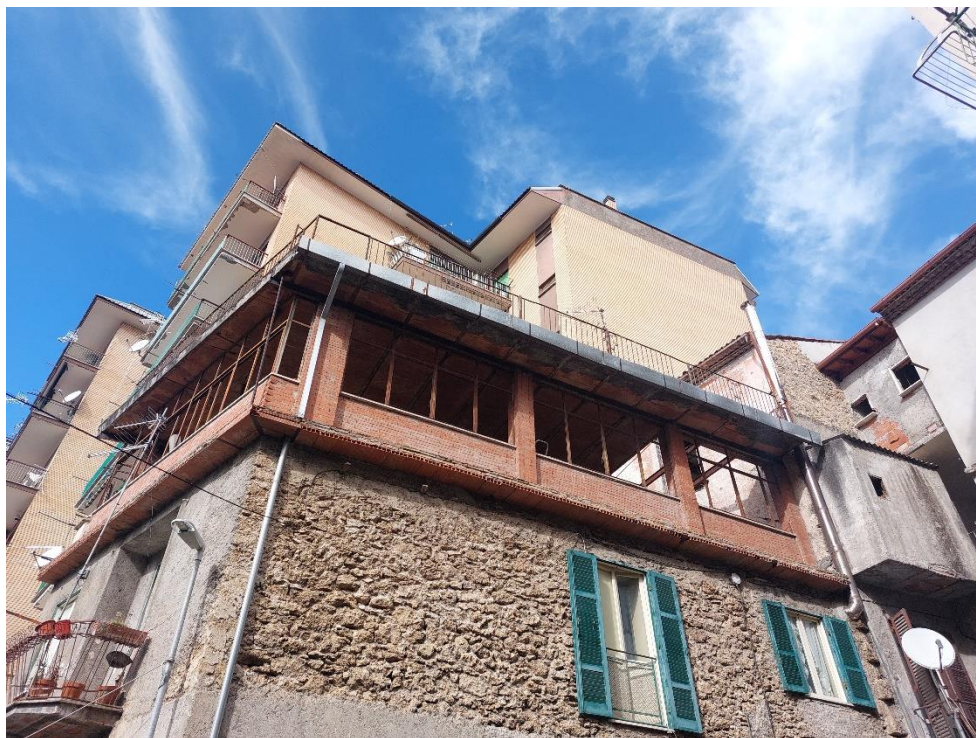
Vista esterna della veranda