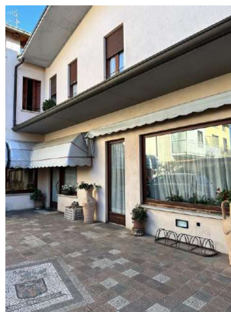
ingresso negozio laboratorio