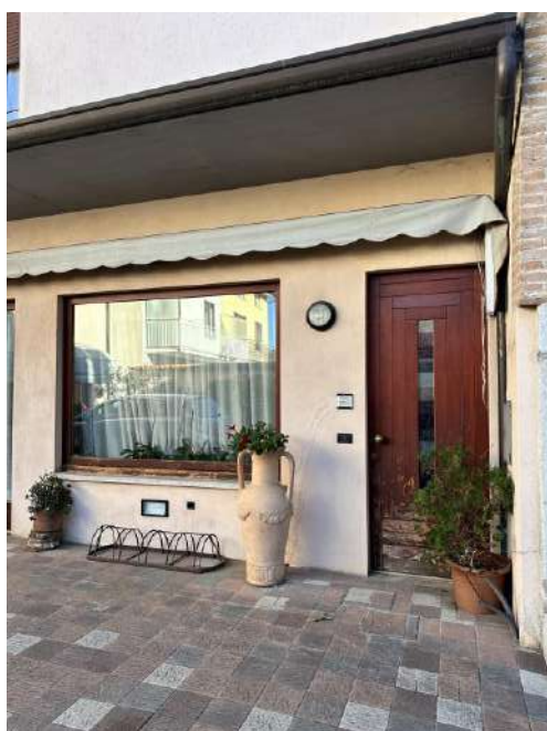
Ingresso appartamento dalla corte comune