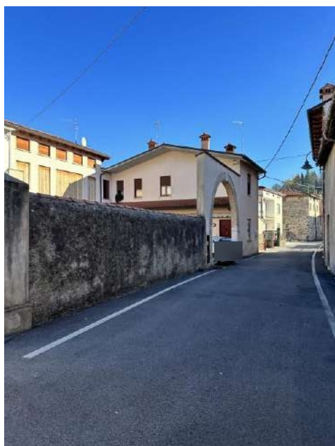
accesso dalla stara alla corte comune