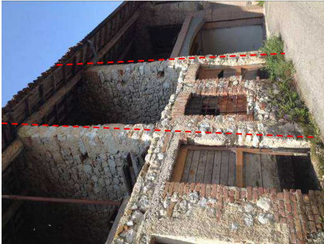
FOTO n.1- magazzino