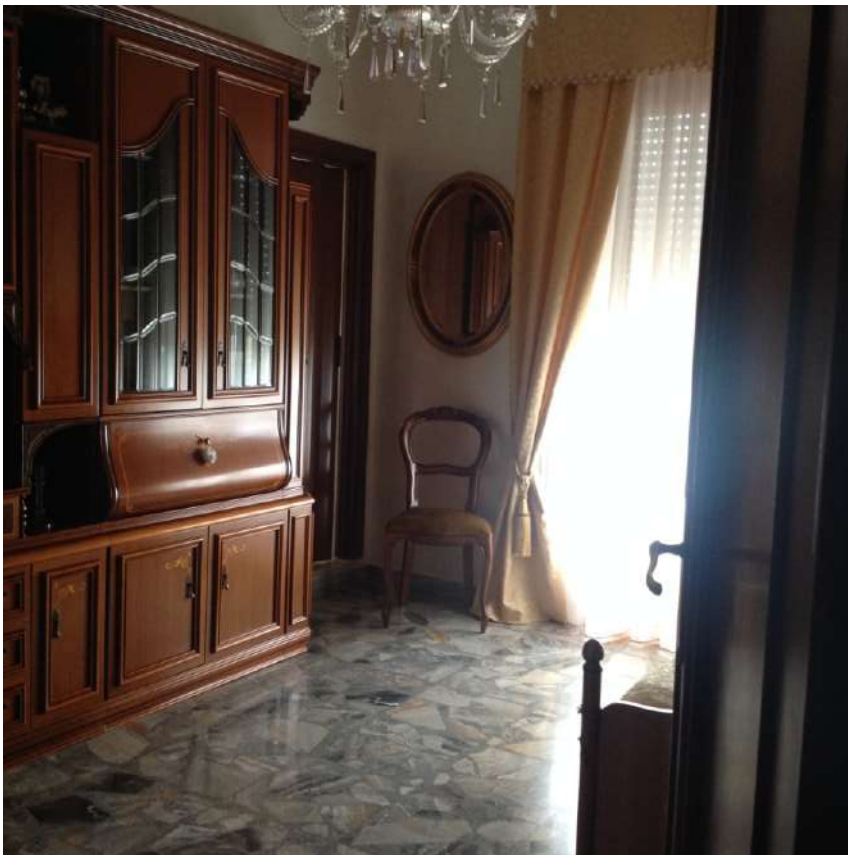
Figura 11. LOTTO UNICO: Immobile pignorato al F. 94, P.IIa 3069, Sub. 2 ubicato in Torremaggiore tra la Via Gobetti e Via Togliatti (cameretta).