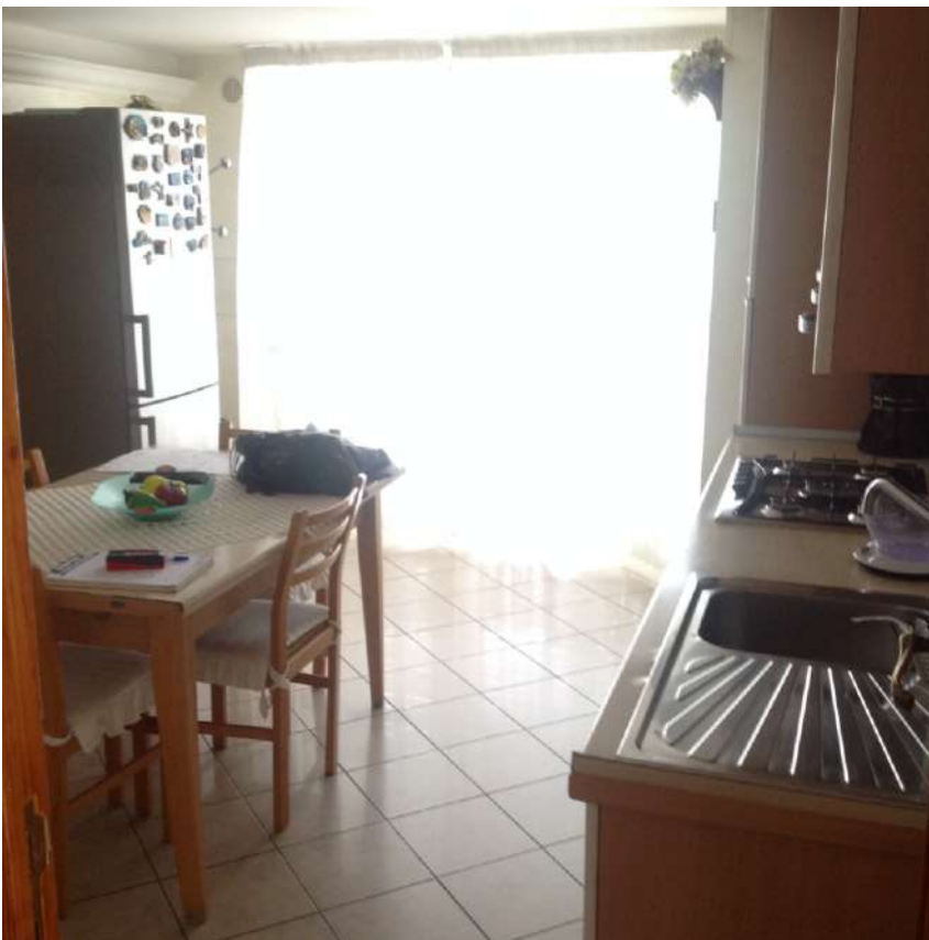
Figura 5. LOTTO UNICO: Immobile pignorato al F. 94, P.IIa 3069, Sub. 2 ubicato in Torremaggiore tra la Via Gobetti e Via Togliatti (cucina al piano terra).