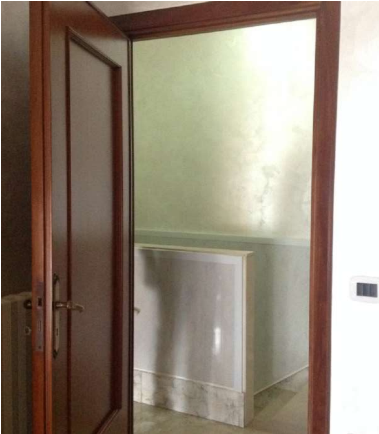
Figura 8. LOTTO UNICO: Immobile pignorato al F. 94, P.IIa 3069, Sub. 2 ubicato in Torremaggiore tra la Via Gobetti e Via Togliatti (disimpegno).