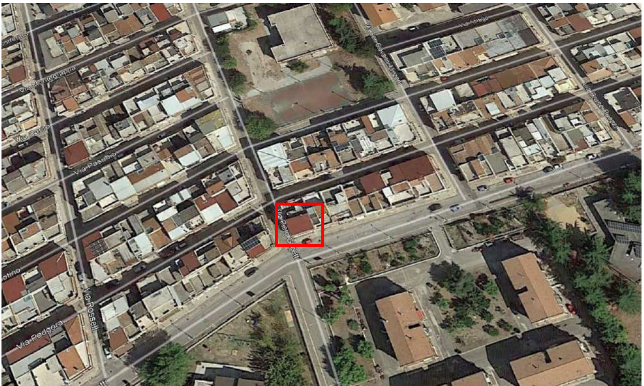
Figura 2. LOTTO UNICO: Ortofoto dell'immobile pignorato al F. 94, P.Illa 3069, Sub. 2 ubicato in Torremaggiore tra la Via Gobetti e Via Togliatti.