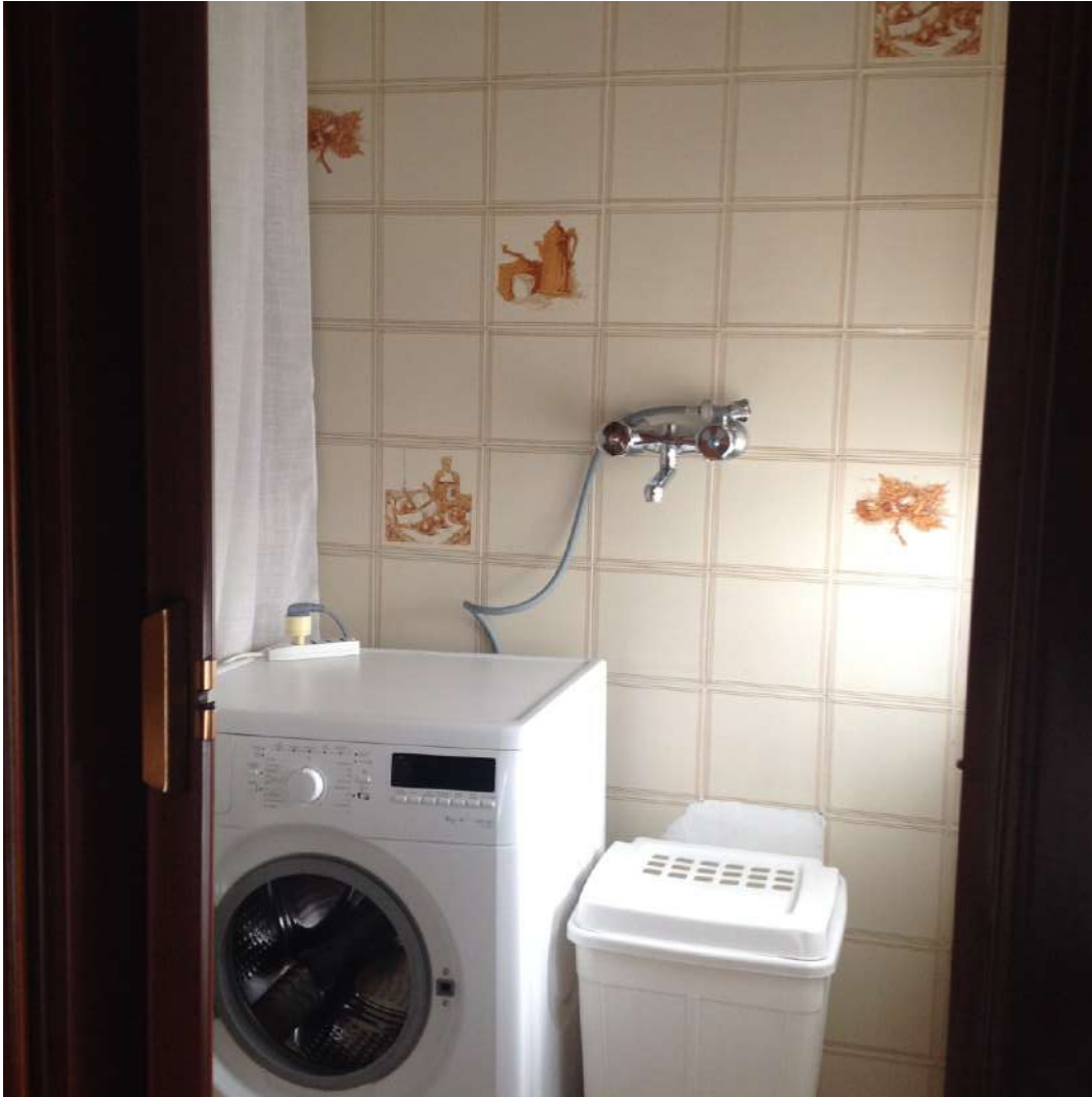
Figura 12. LOTTO UNICO: Immobile pignorato al F. 94, P.IIa 3069, Sub. 2 ubicato in Torremaggiore tra la Via Gobetti e Via Togliatti (locale lavanderia).