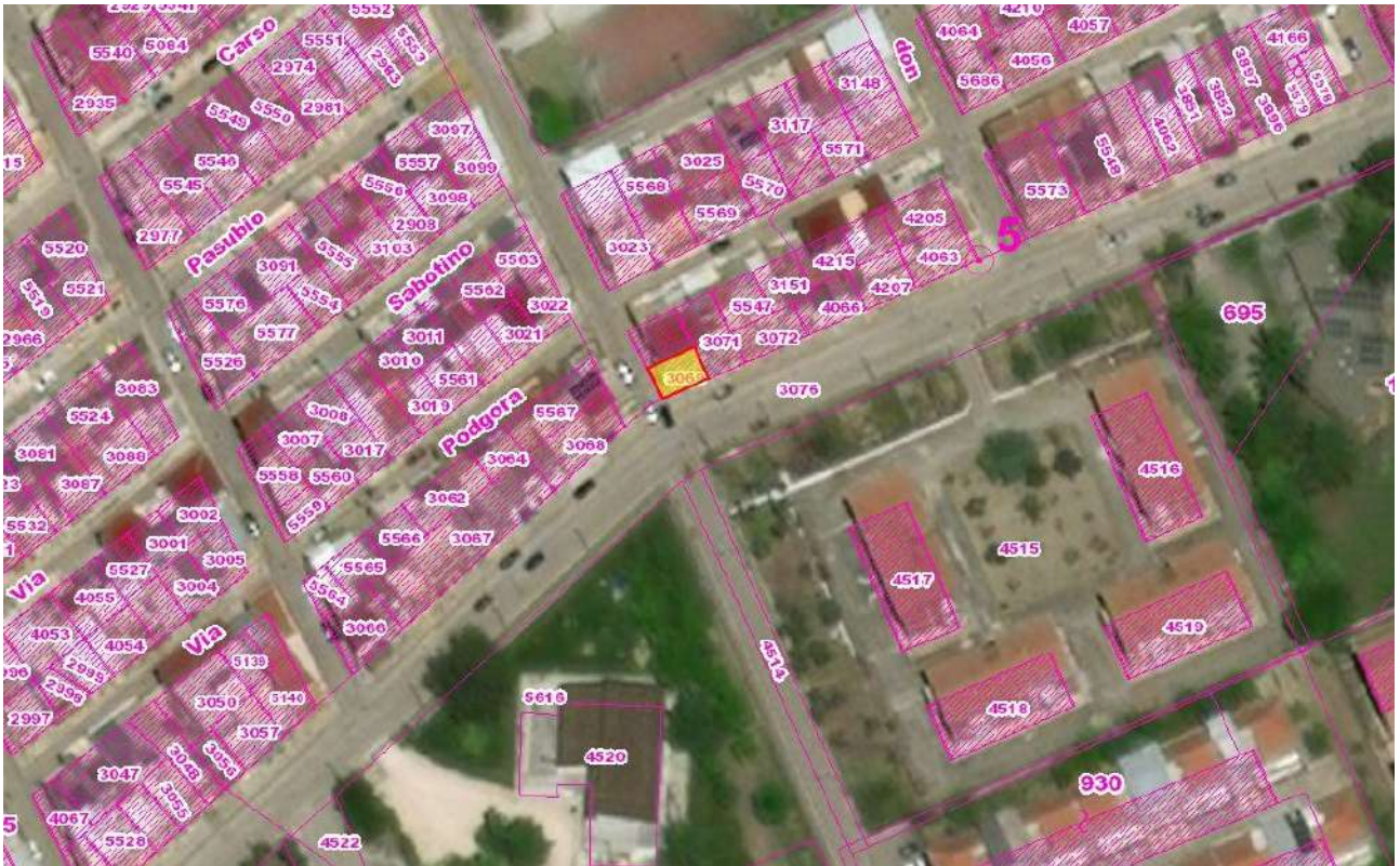
Figura 1. LOTTO UNICO: Ortofoto catastale dell'immobile pignorato al F. 94, P.Illa 3069, Sub. 2 ubicato in Torremaggiore tra la Via Gobetti e Via Togliatti.