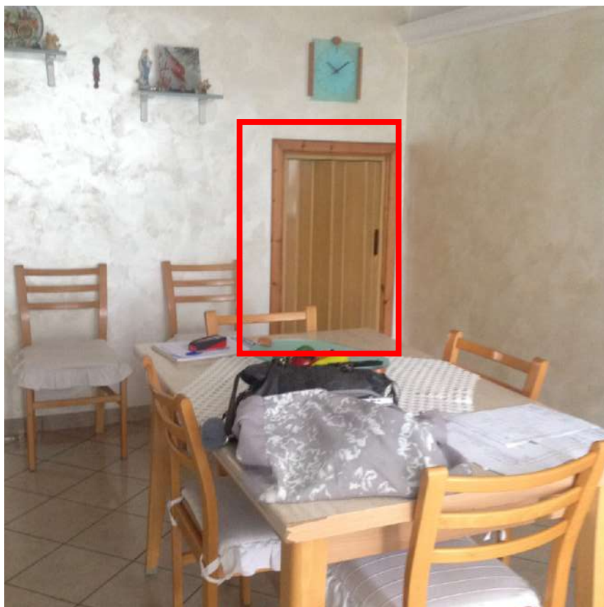
Figura 6. LOTTO UNICO: INGRESSO IMMOBILE NON PIGNORATO al F. 94, P.IIa 3069, Sub. 5 unito economicamente all'immobile oggetto di perizia, ubicato in Torremaggiore tra la Via Gobetti e Via Togliatti.