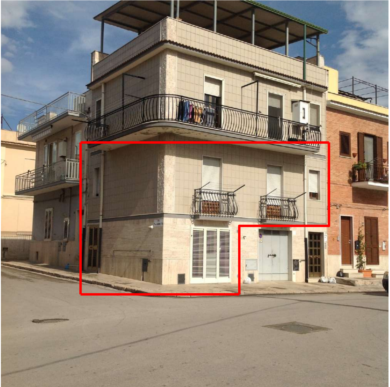
Figura 3. LOTTO UNICO: Fabbricato in cui si trova l'immobile pignorato al F. 94, P.IIa 3069, Sub. 2 ubicato in Torremaggiore tra la Via Gobetti e Via Togliatti.