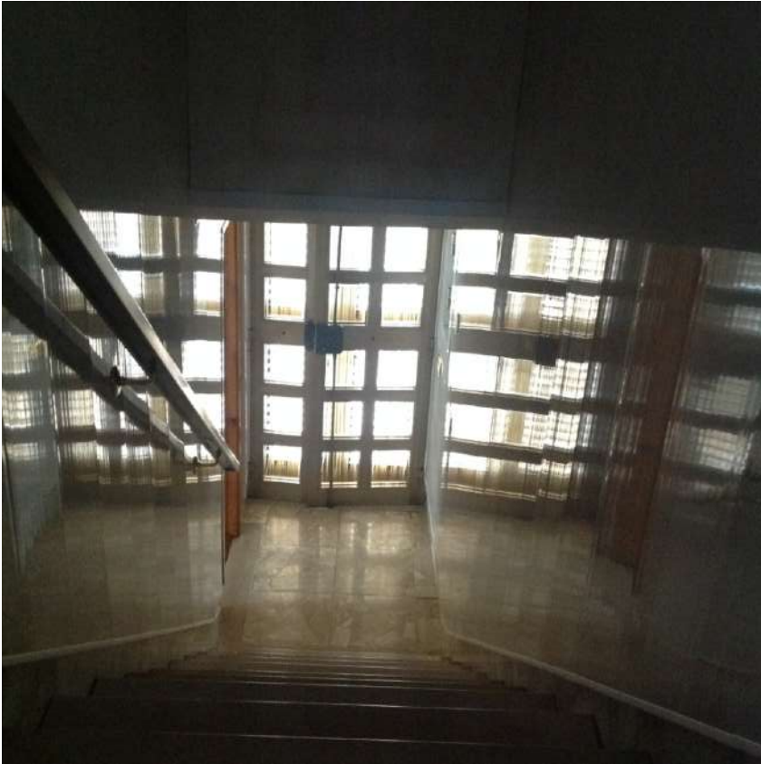
Figura 4. LOTTO UNICO: Immobile pignorato al F. 94, P.IIa 3069, Sub. 2 ubicato in Torremaggiore tra la Via Gobetti e Via Togliatti (ingresso).