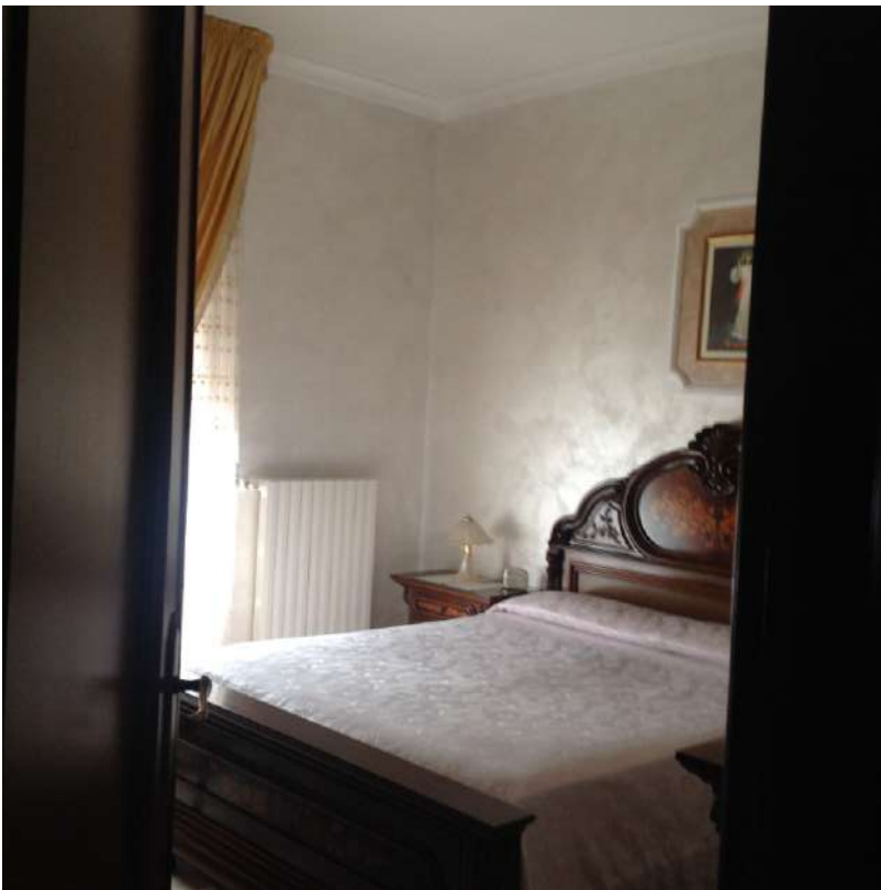
Figura 9. LOTTO UNICO: Immobile pignorato al F. 94, P.IIa 3069, Sub. 2 ubicato in Torremaggiore tra la Via Gobetti e Via Togliatti (camera da letto).