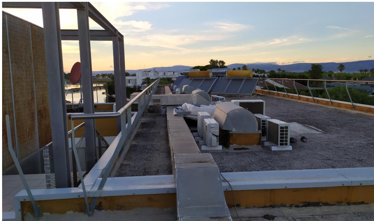
FOTO Imp.11: in evidenza, esternamente sulle coperture piane, parte degli impianti tecnologici di climatizzazione ed i pannelli solari per l'acqua calda sanitaria con serbatoi di accumulo.