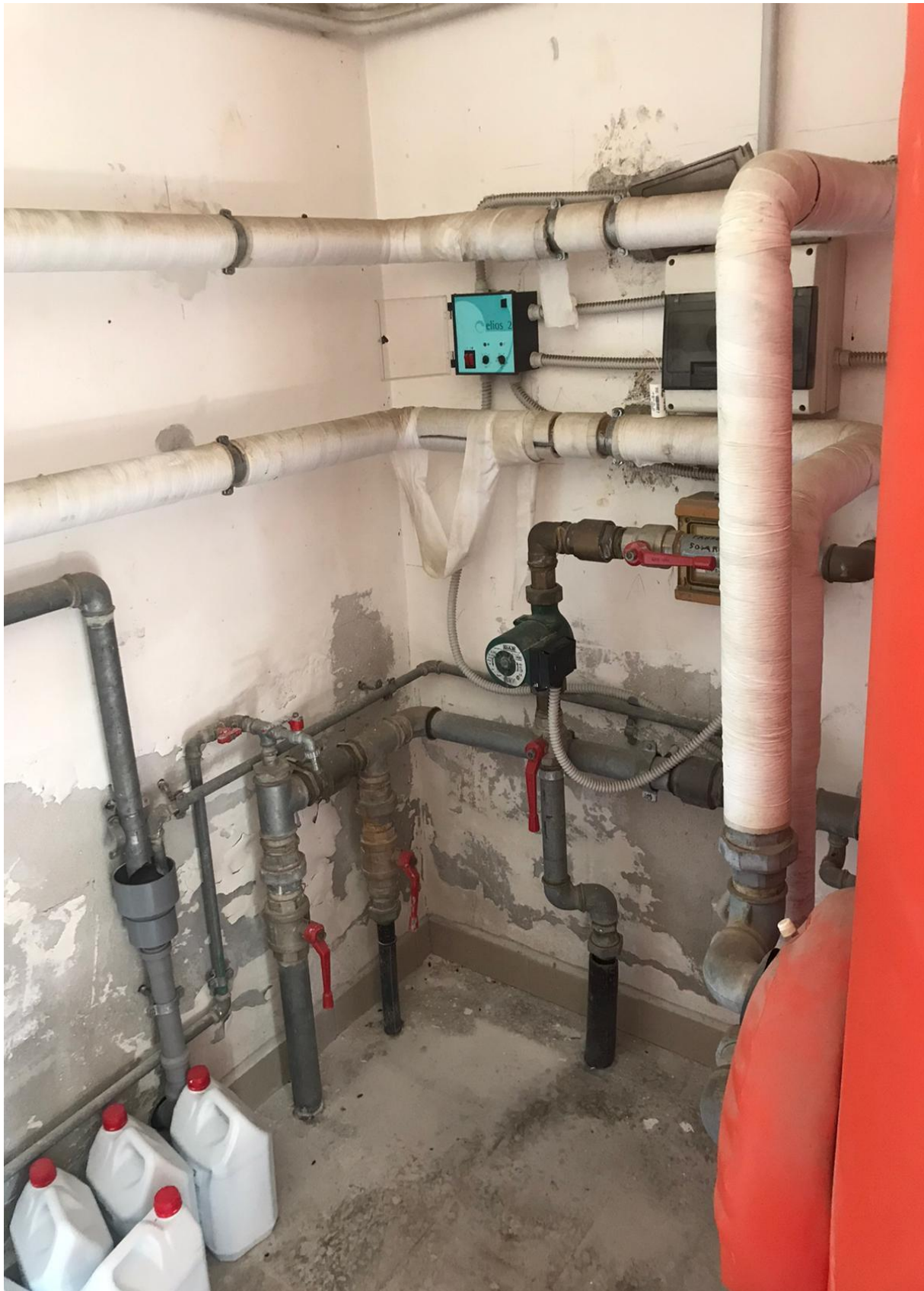
FOTO Imp.4: in evidenza, nel vano Centrale Termica parte degli impianti di riscaldamento ed acqua calda sanitaria.