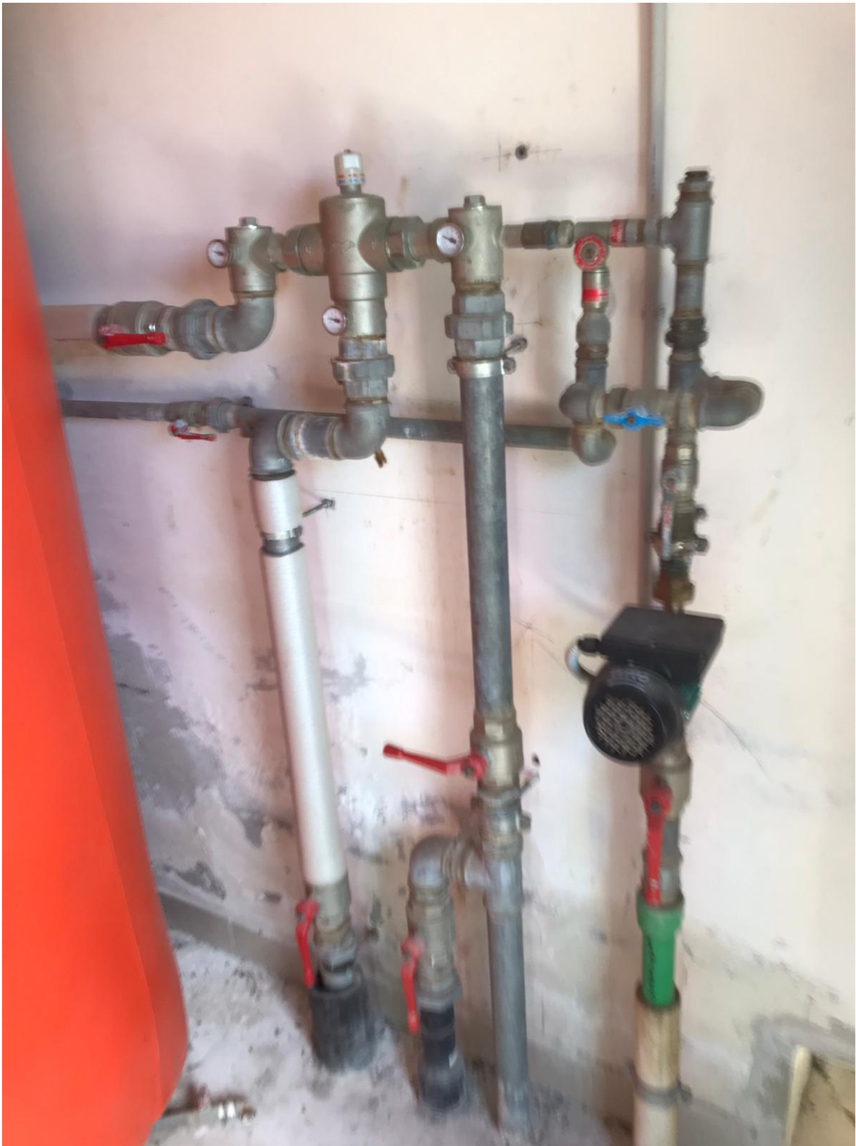
FOTO Imp.5: in evidenza, nel vano Centrale Termica parte degli impianti di riscaldamento ed acqua calda sanitaria.