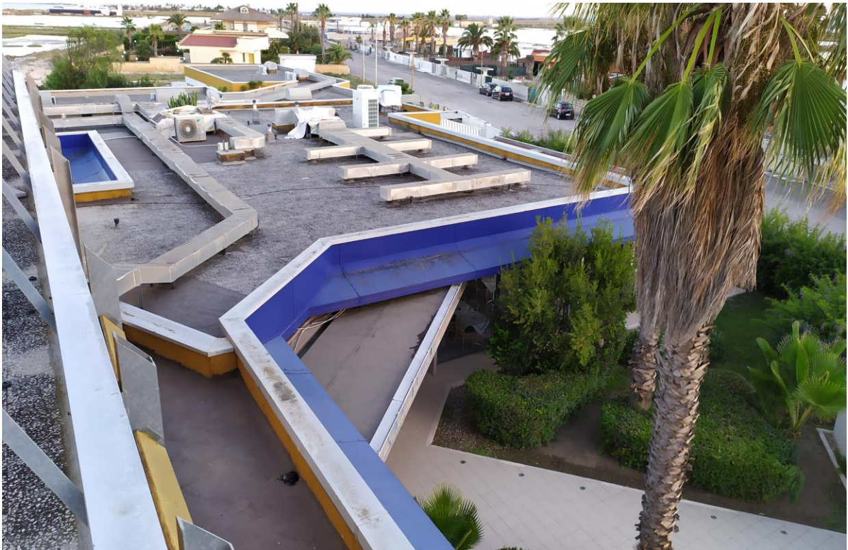
FOTO Imp.9: in evidenza, esternamente sulle coperture piane, parte degli impianti tecnologici di climatizzazione.