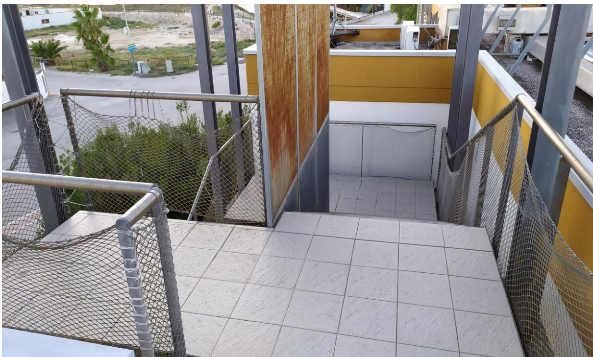
FOTO Imp.18: in evidenza, la scala metallica prefabbricata che consente l'accesso esternamente sulle coperture piane per la manutenzione delle stesse e degli impianti tecnologici ivi installati.