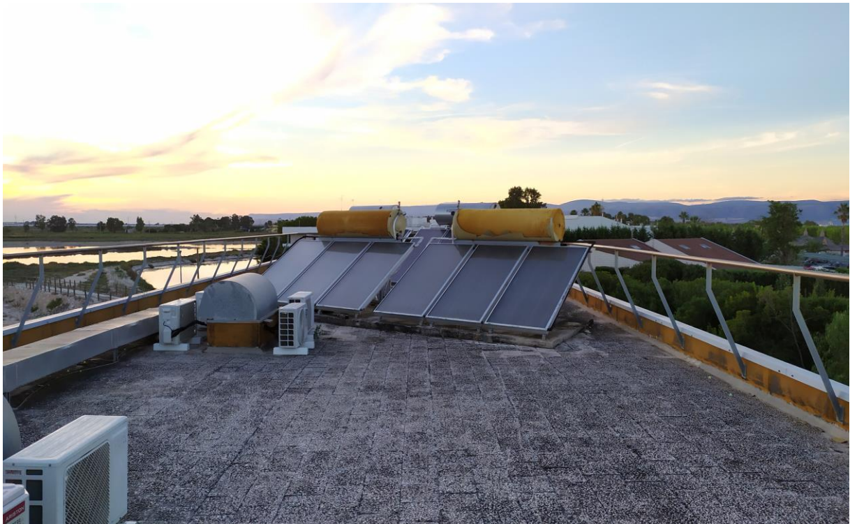
FOTO Imp.17: in evidenza, esternamente sulle coperture piane, parte degli impianti tecnologici di climatizzazione ed i pannelli solari per l'acqua calda sanitaria con serbatoi di accumulo.