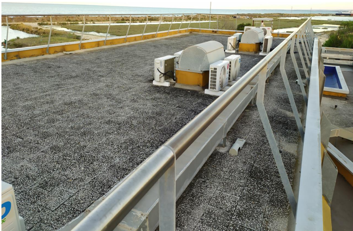
FOTO Imp.10: in evidenza, esternamente sulle coperture piane, parte degli impianti tecnologici di climatizzazione.