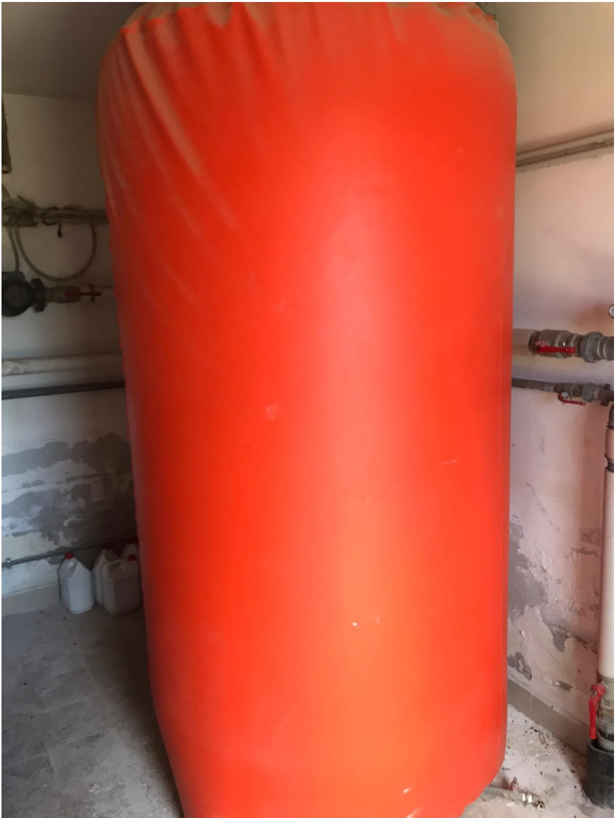
FOTO Imp.6: in evidenza, nel vano Centrale Termica parte degli impianti di riscaldamento ed acqua calda sanitaria ed il serbatoio di accumulo della stessa.