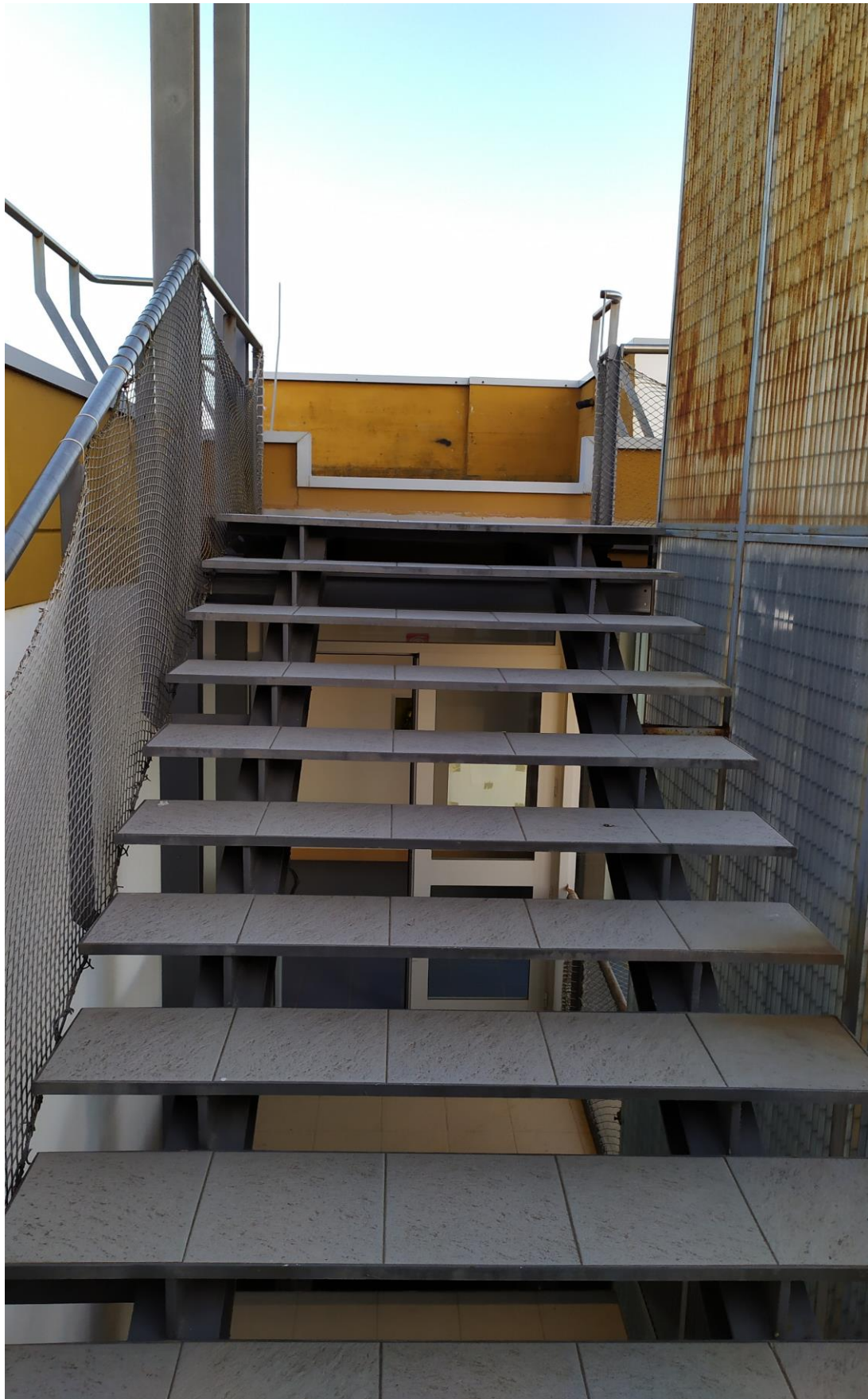
FOTO Imp.19: in evidenza, la scala metallica prefabbricata che consente l'accesso esternamente sulle coperture piane per la manutenzione delle stesse e degli impianti tecnologici ivi installati.