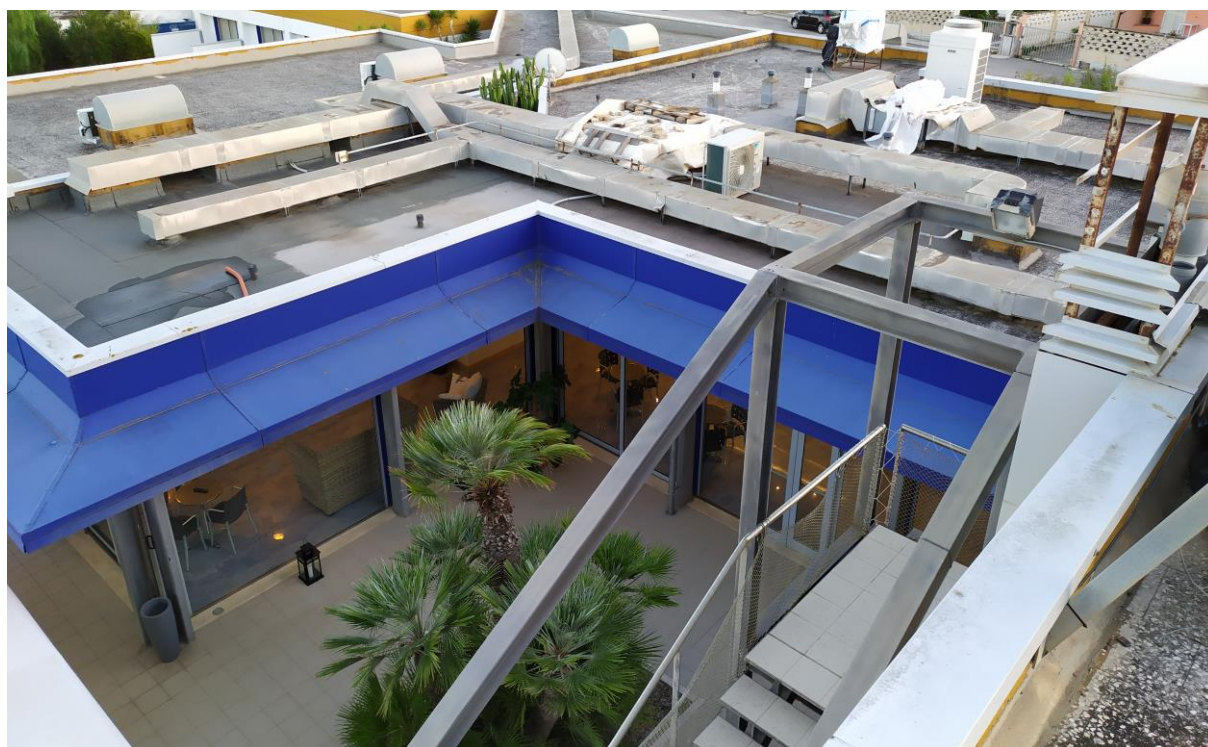
FOTO Imp.14: in evidenza, esternamente sulle coperture piane, parte degli impianti tecnologici di climatizzazione.