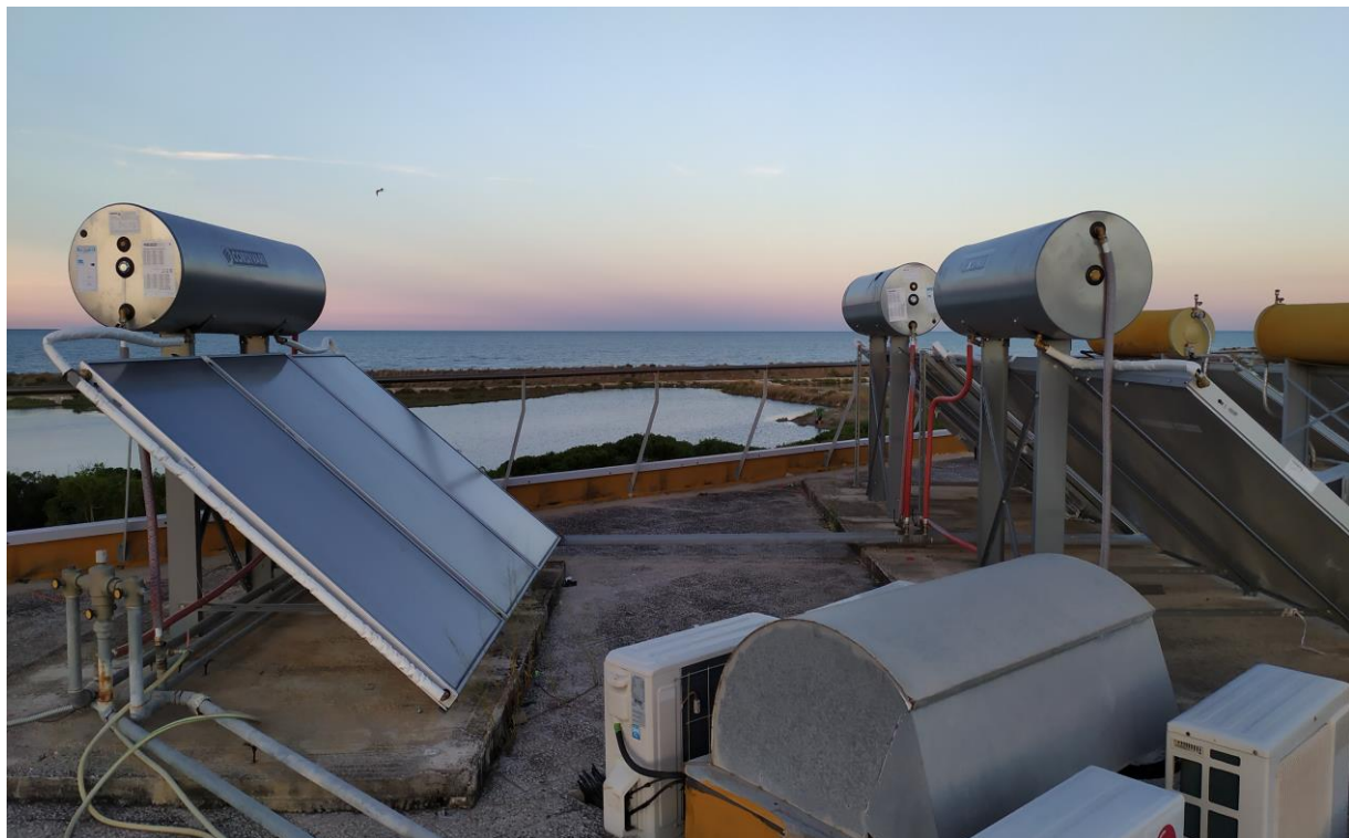
FOTO Imp.15: in evidenza, esternamente sulle coperture piane, parte degli impianti tecnologici di climatizzazione ed i pannelli solari per l'acqua calda sanitaria con serbatoi di accumulo.