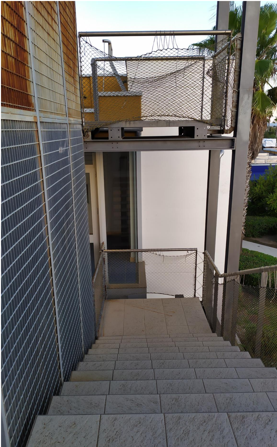
FOTO Imp.20: in evidenza, la scala metallica prefabbricata che consente l'accesso esternamente sulle coperture piane per la manutenzione delle stesse e degli impianti tecnologici ivi installati.