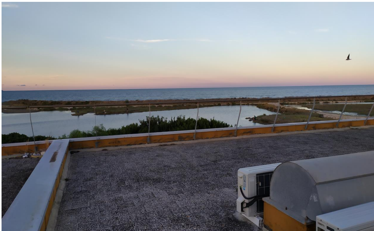
FOTO Imp.13: in evidenza, esternamente sulle coperture piane, parte degli impianti tecnologici di climatizzazione e l'ampia veduta panoramica verso il mare.