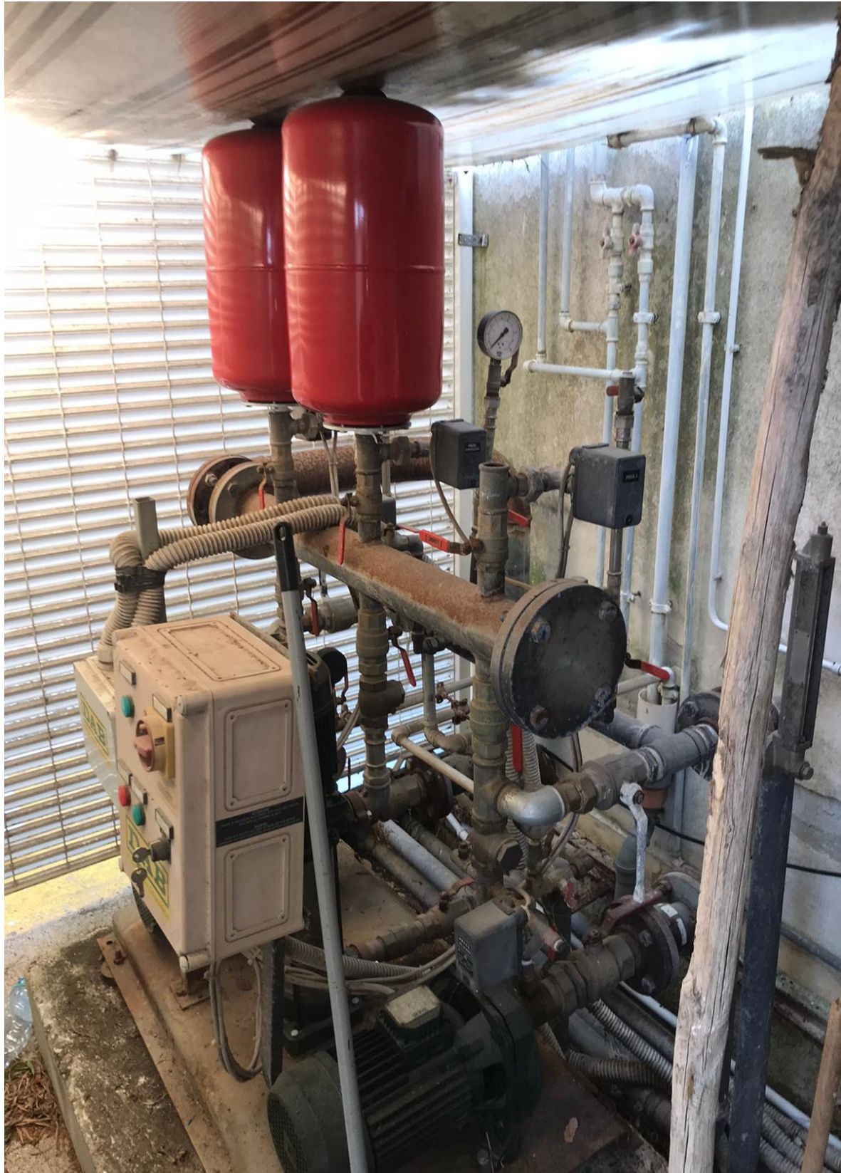
FOTO Imp.1: in evidenza, nel vano contiguo la Centrale Termica parte degli impianti di autoclave/antincendio.