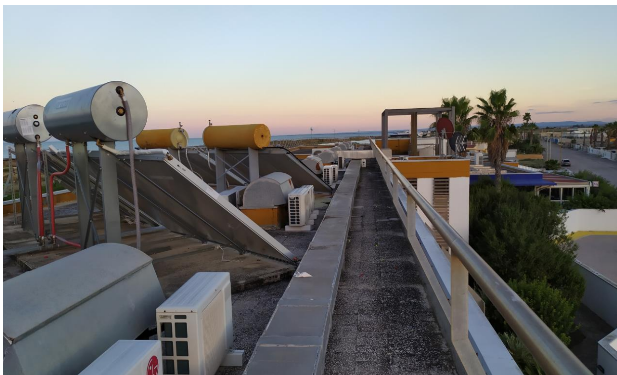
FOTO Imp.16: in evidenza, esternamente sulle coperture piane, parte degli impianti tecnologici di climatizzazione ed i pannelli solari per l'acqua calda sanitaria con serbatoi di accumulo.