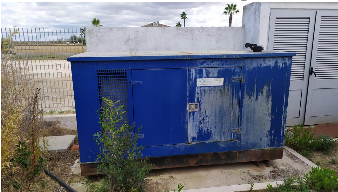
FOTO Imp.7: in evidenza, esternamente a sud e nei pressi dell'Hotel internamente all'area recintata, il gruppo elettrogeno ed i contigui quadri elettrici.