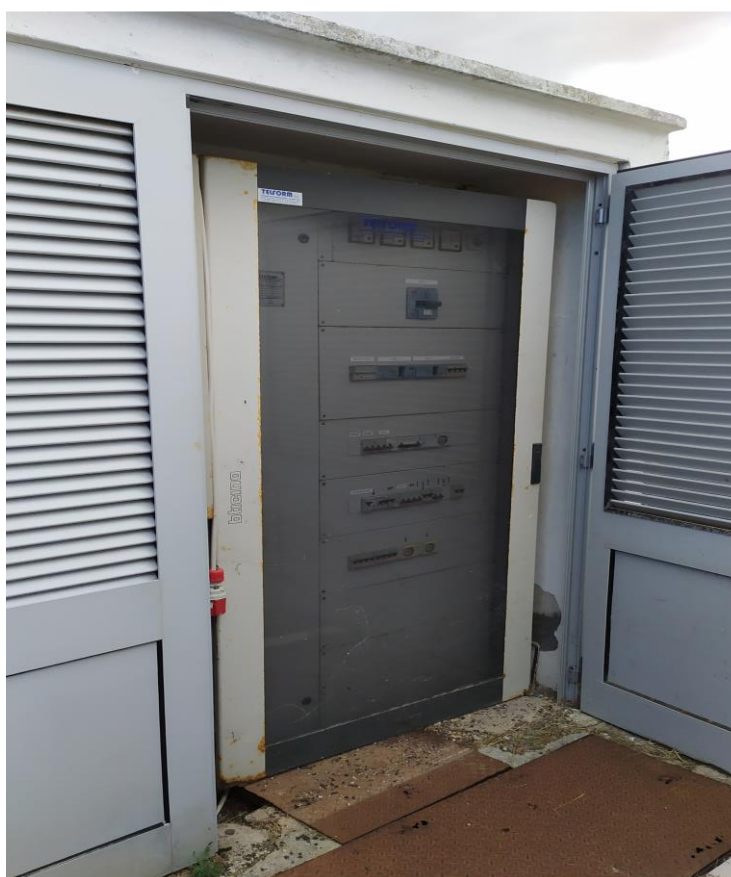
FOTO Imp.8: in evidenza, esternamente a sud e nei pressi dell'Hotel internamente all'area recintata, i quadri elettrici annessi al gruppo elettrogeno contiguo.