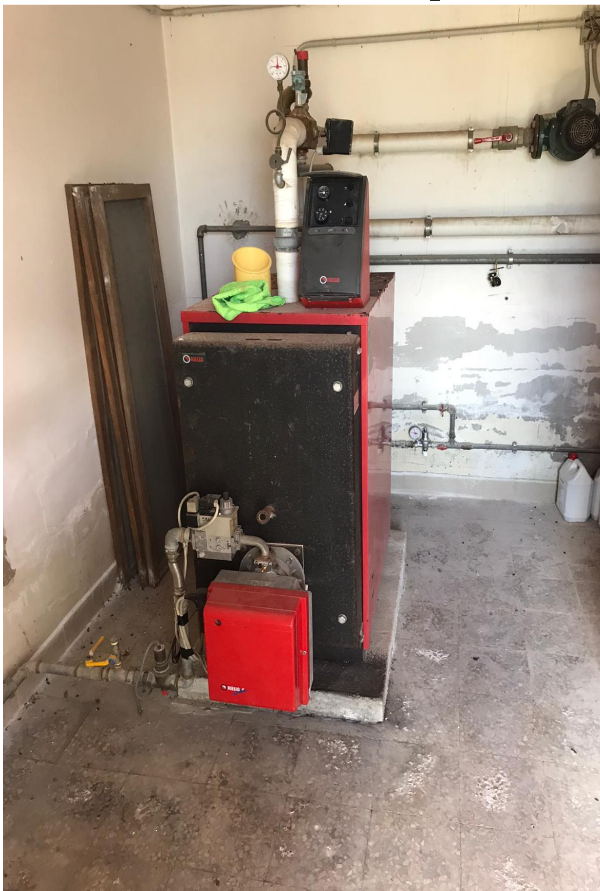
FOTO Imp.3: in evidenza, nel vano Centrale Termica il generatore termico e parte degli impianti di riscaldamento ed acqua calda sanitaria.