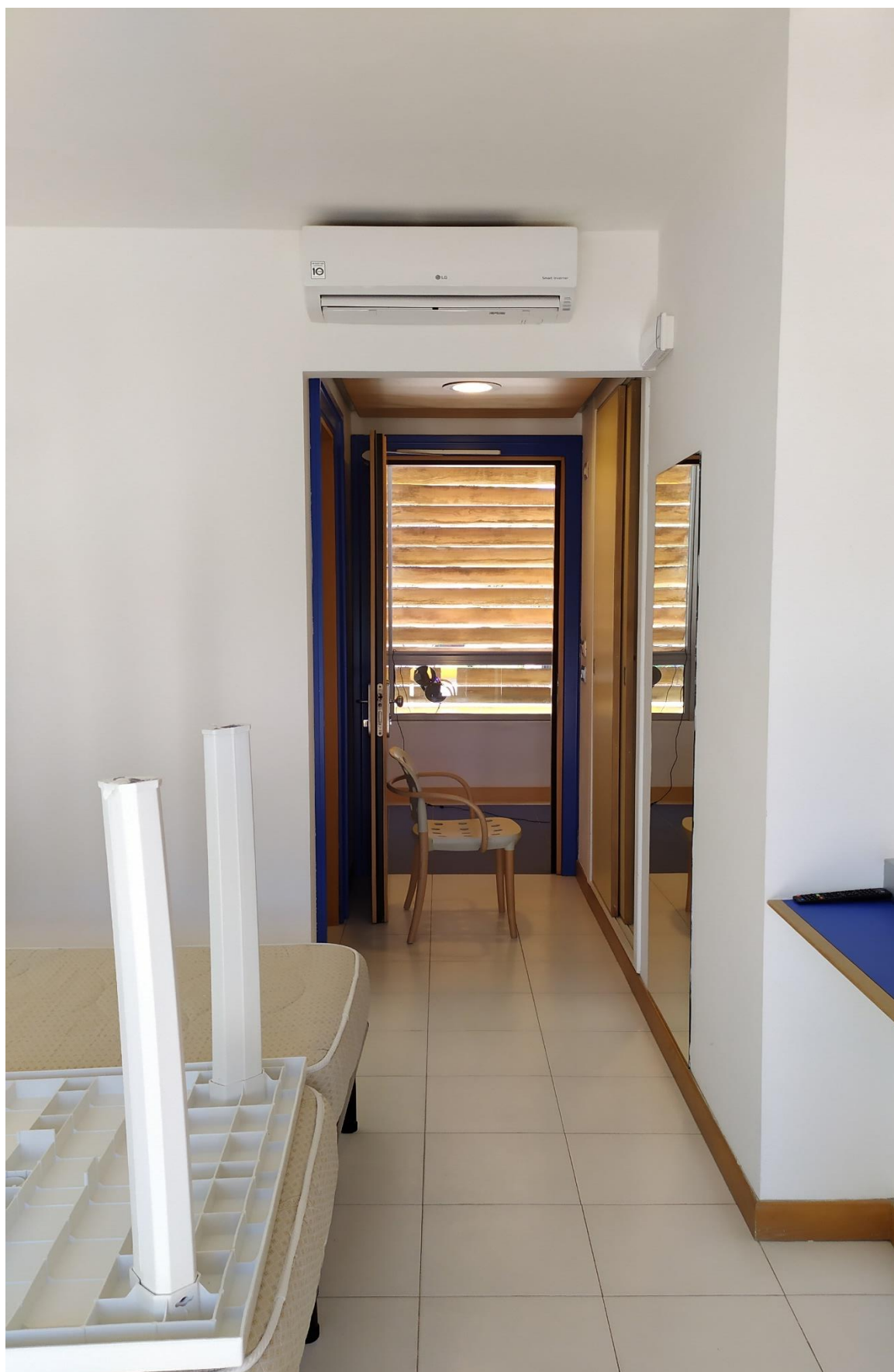
FOTO I.73: in evidenza, la zona d'ingresso della camera 27, pressoché identica alle altre camere dell'Hotel.