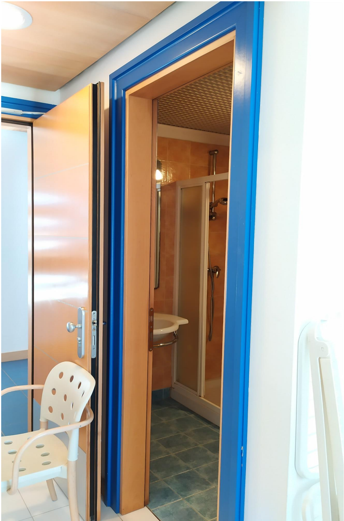
FOTO I.93: in evidenza, il bagno della camera 30, pressoché identica alle altre camere dell'Hotel.