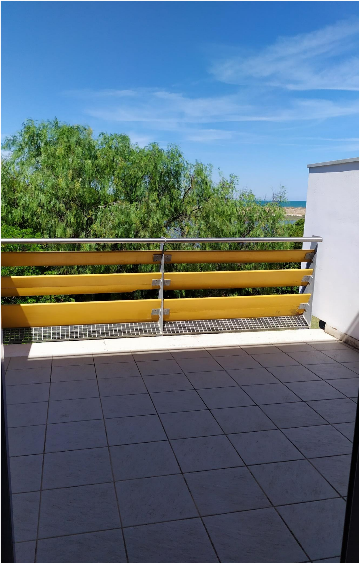
FOTO I.109: in evidenza, la veranda della camera 41, pressoché identica alle altre camere dell'Hotel.