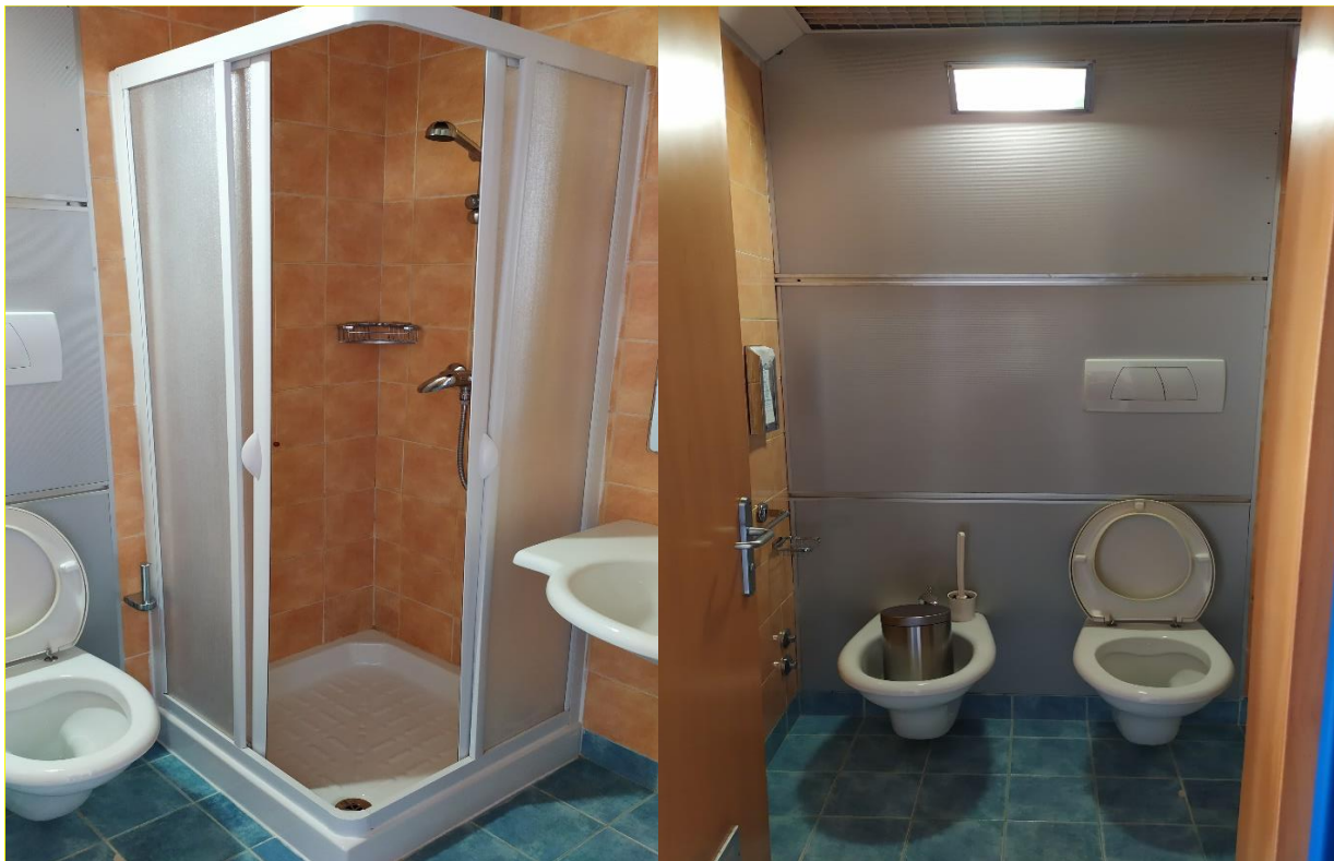
FOTO I.125-126: in evidenza, il bagno della camera 43, pressoché identica alle altre camere dell'Hotel.