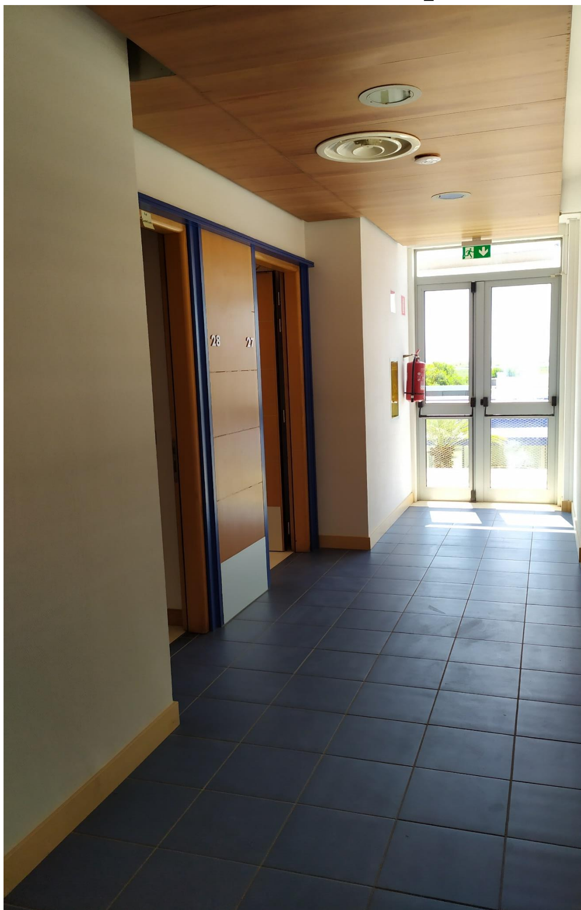
FOTO I.71: in evidenza, il corridoio di disimpegno in prossimità delle camere 27-28.