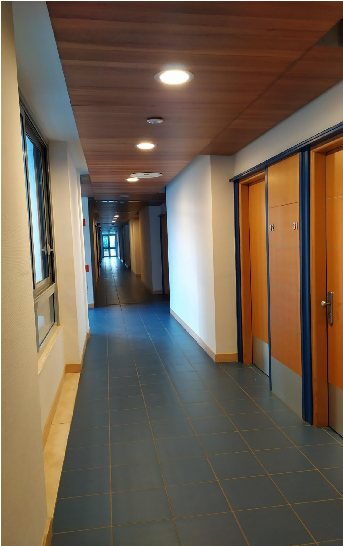
FOTO I.84: in evidenza, il corridoio di disimpegno in prossimità delle camere 31-32.