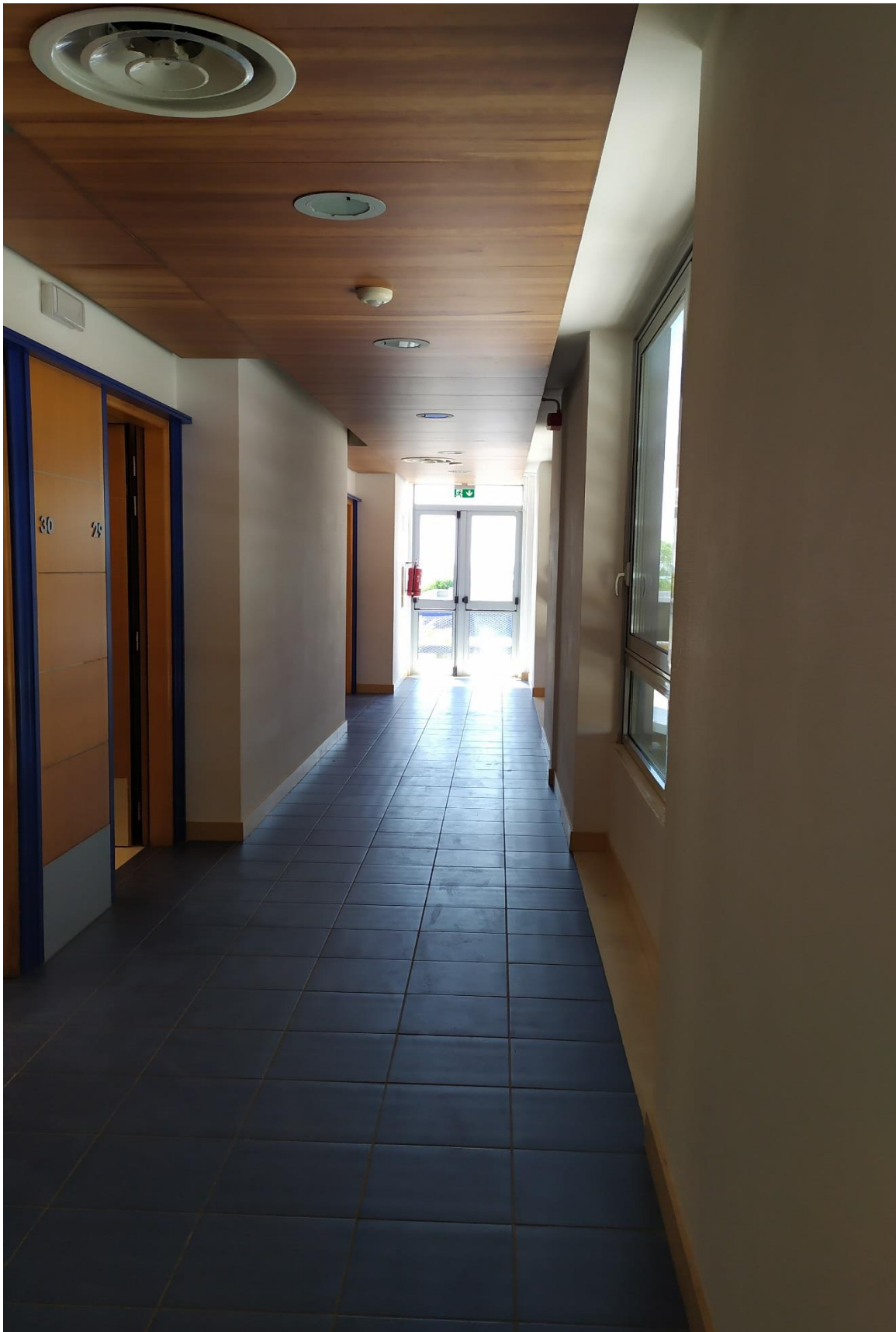
FOTO I.85: in evidenza, il corridoio di disimpegno in prossimità delle camere 29-30.