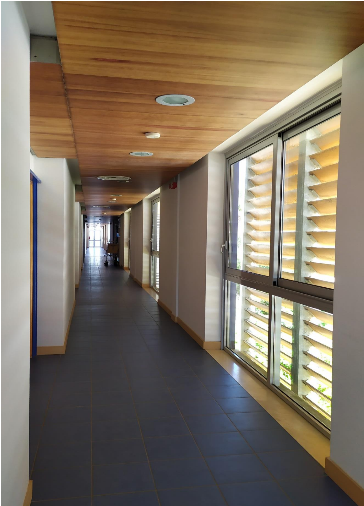
FOTO I.103: in evidenza, il corridoio di disimpegno in prossimità delle camere 41-42.