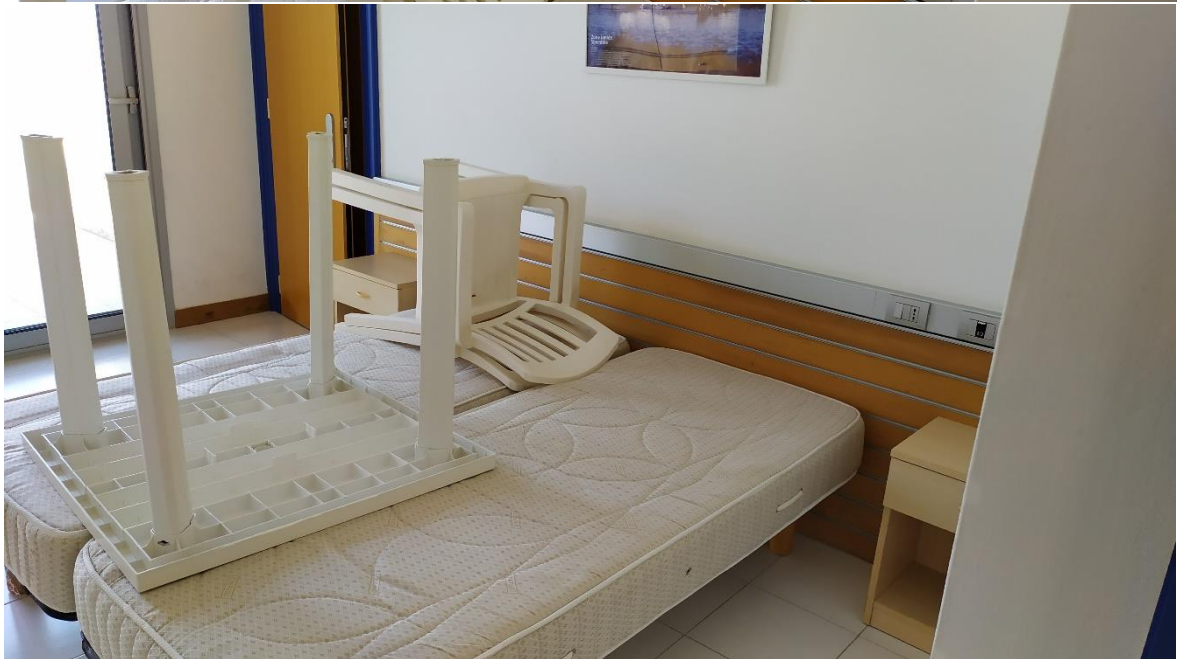
FOTO I.105-106: in evidenza, la zona letto della camera 41, pressoché identica alle altre camere dell'Hotel.