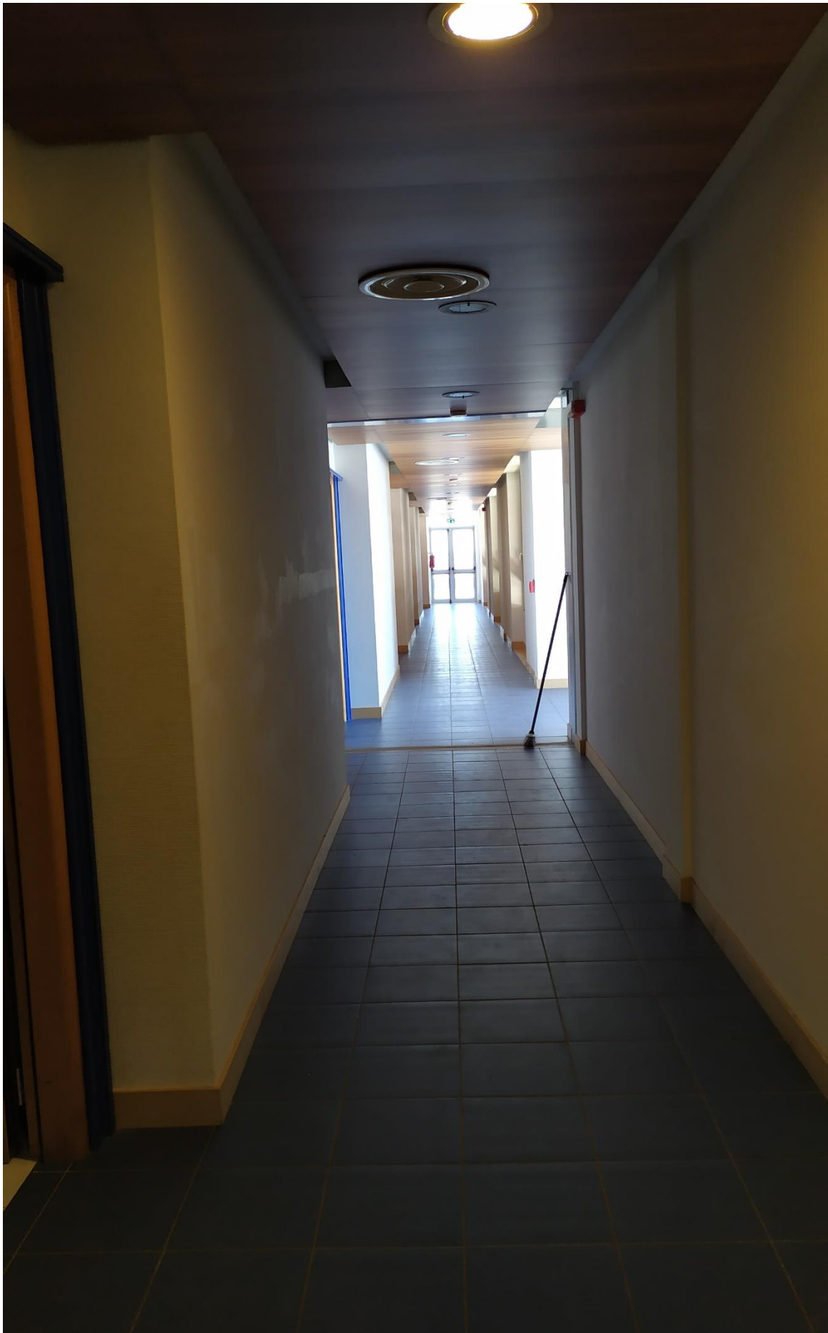
FOTO I.99: in evidenza, il corridoio di disimpegno in prossimità della camera 35.