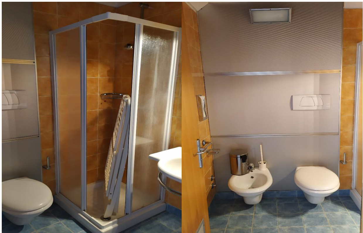
FOTO I.112-113: in evidenza, il bagno della camera 41, pressoché identica alle altre camere dell'Hotel.