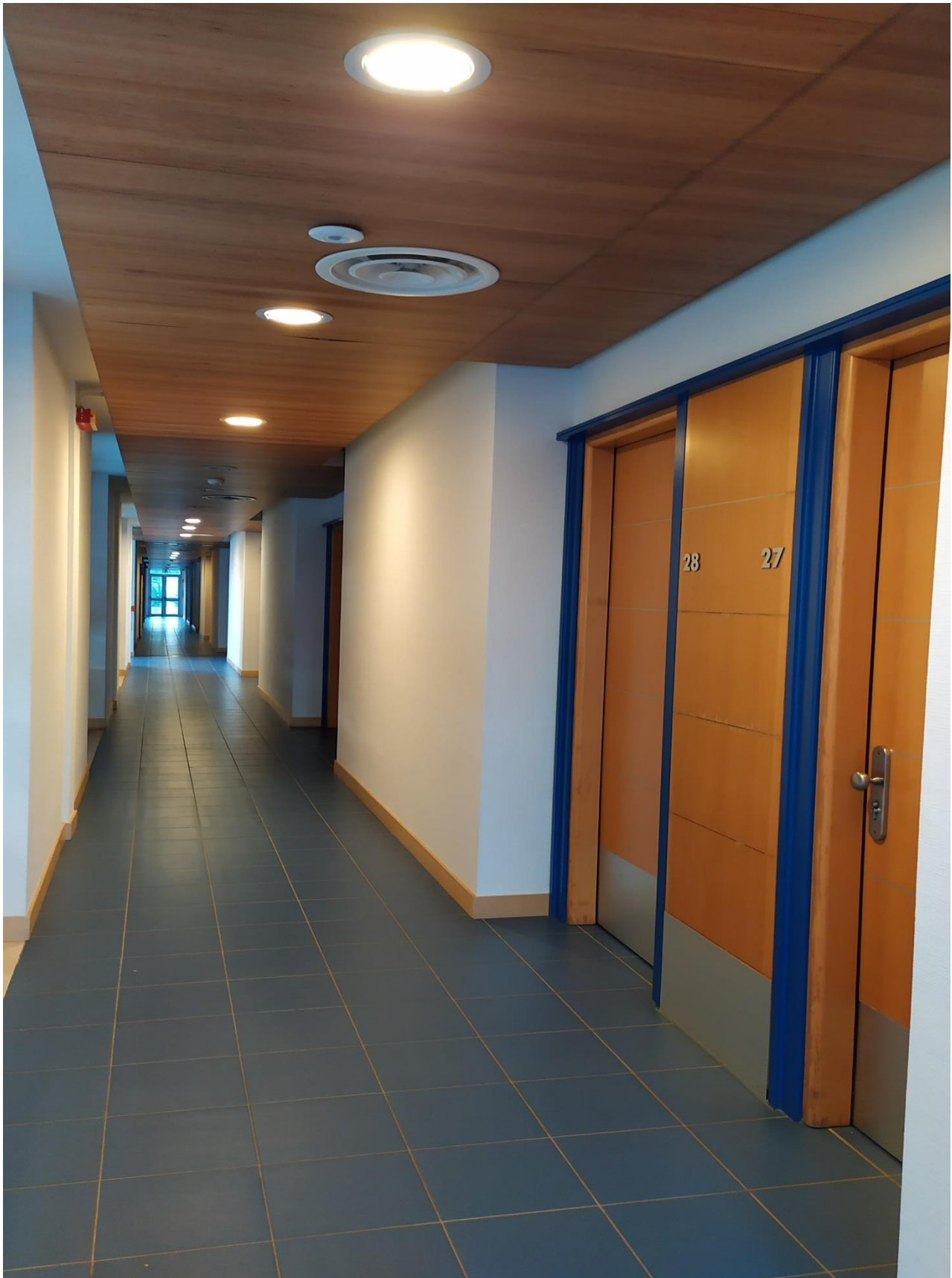
FOTO I.70: in evidenza, il corridoio di disimpegno in prossimità delle camere 27-28.