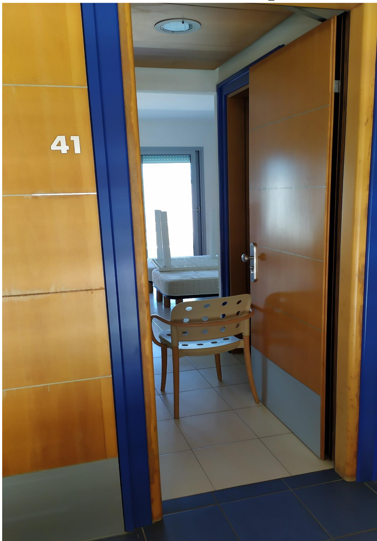
FOTO I.104: in evidenza, la camera 41, pressoché identica alle altre camere dell'Hotel.