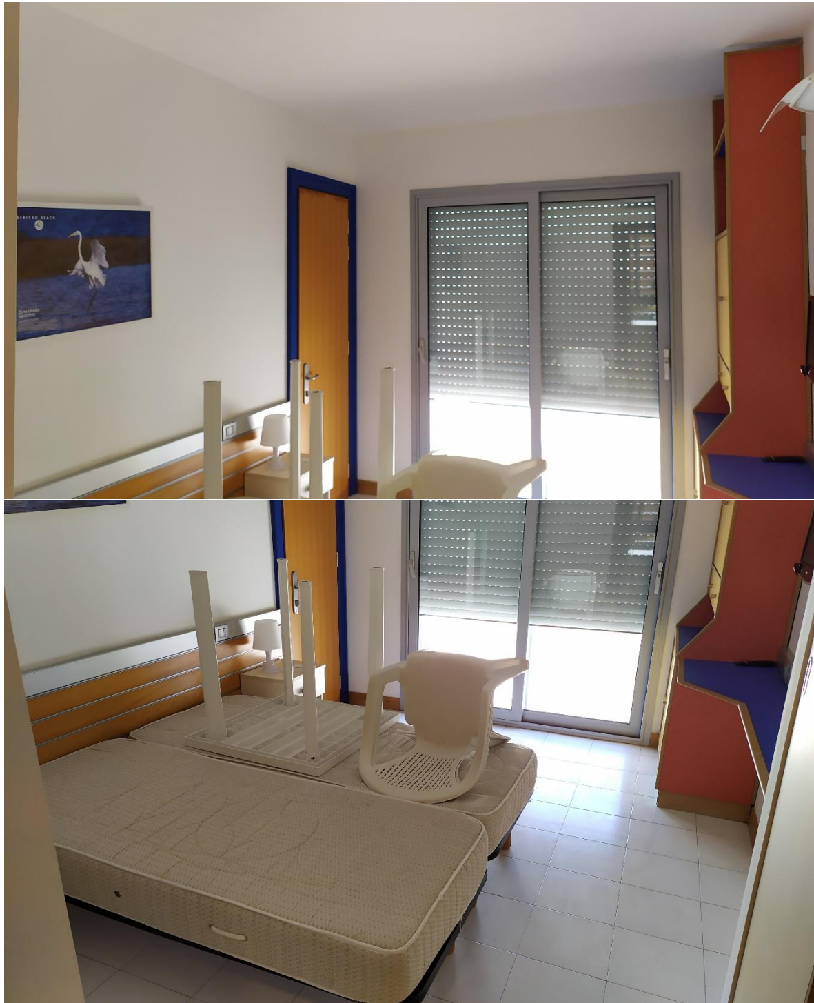
FOTO I.88-89: in evidenza, la zona letto della camera 30, pressoché identica alle altre camere dell'Hotel.