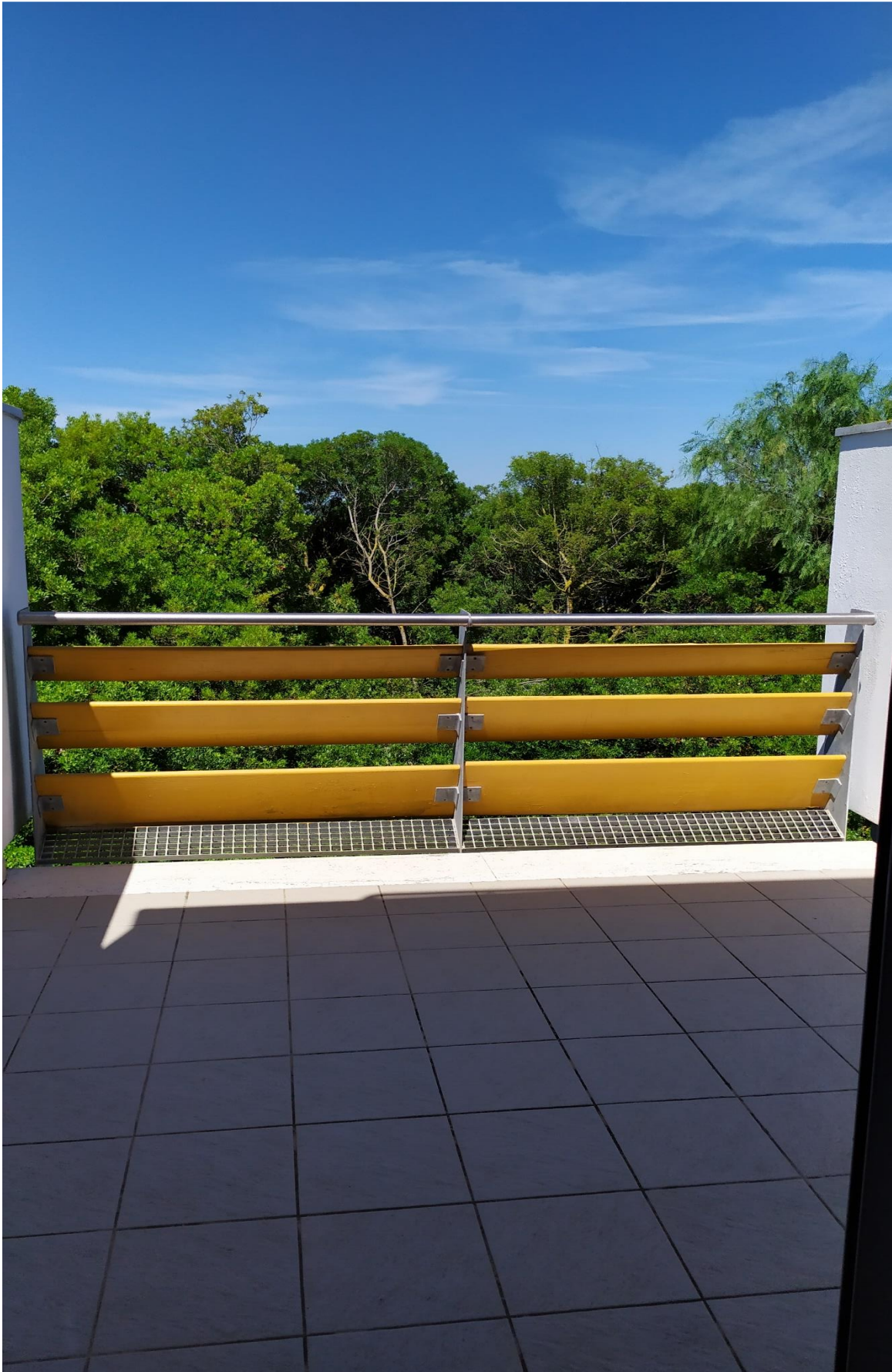
FOTO I.127: in evidenza, la veranda della camera 43, pressoché identica alle altre camere dell'Hotel.