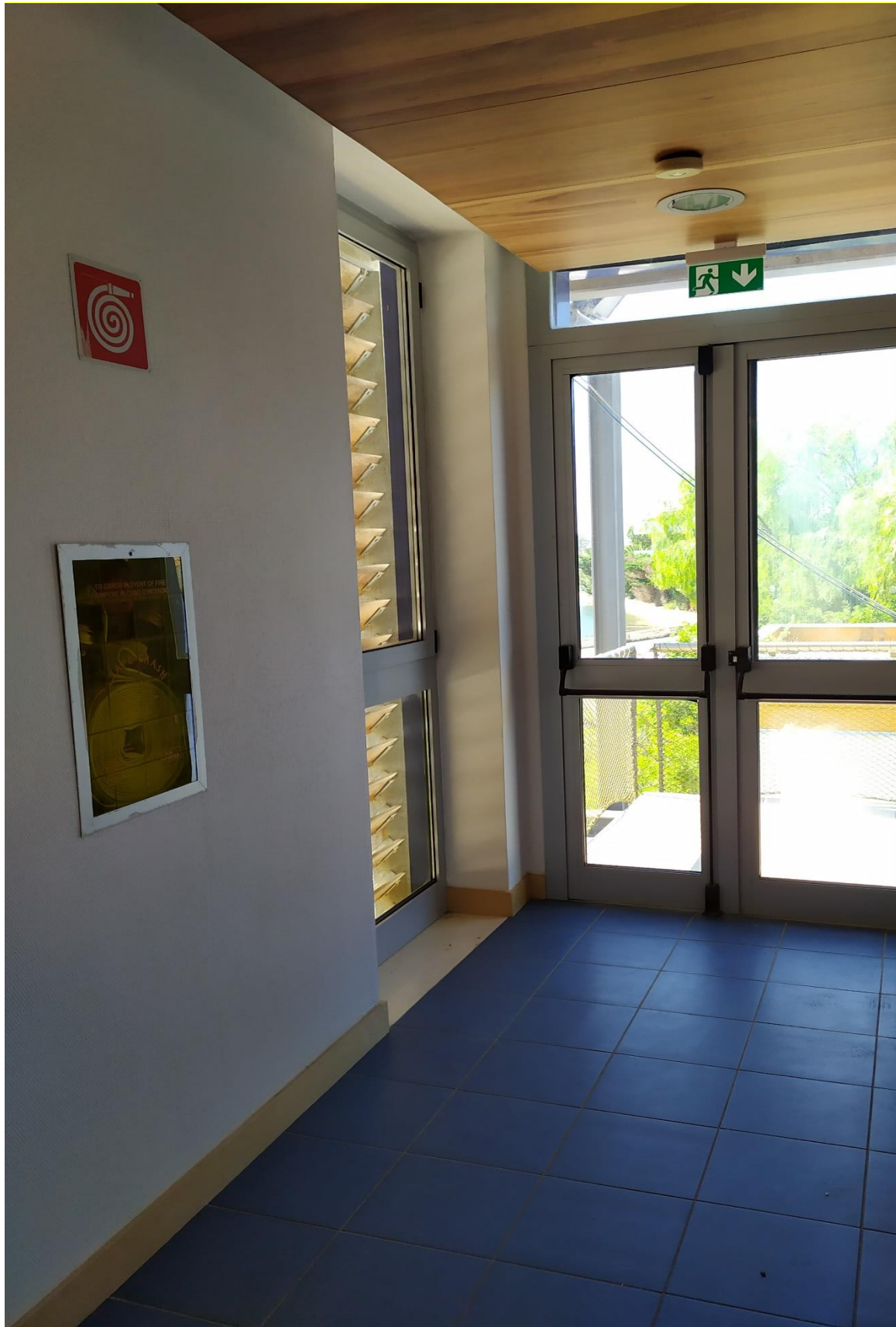
FOTO I.114: in evidenza, il corridoio di disimpegno in prossimità della camera 43.