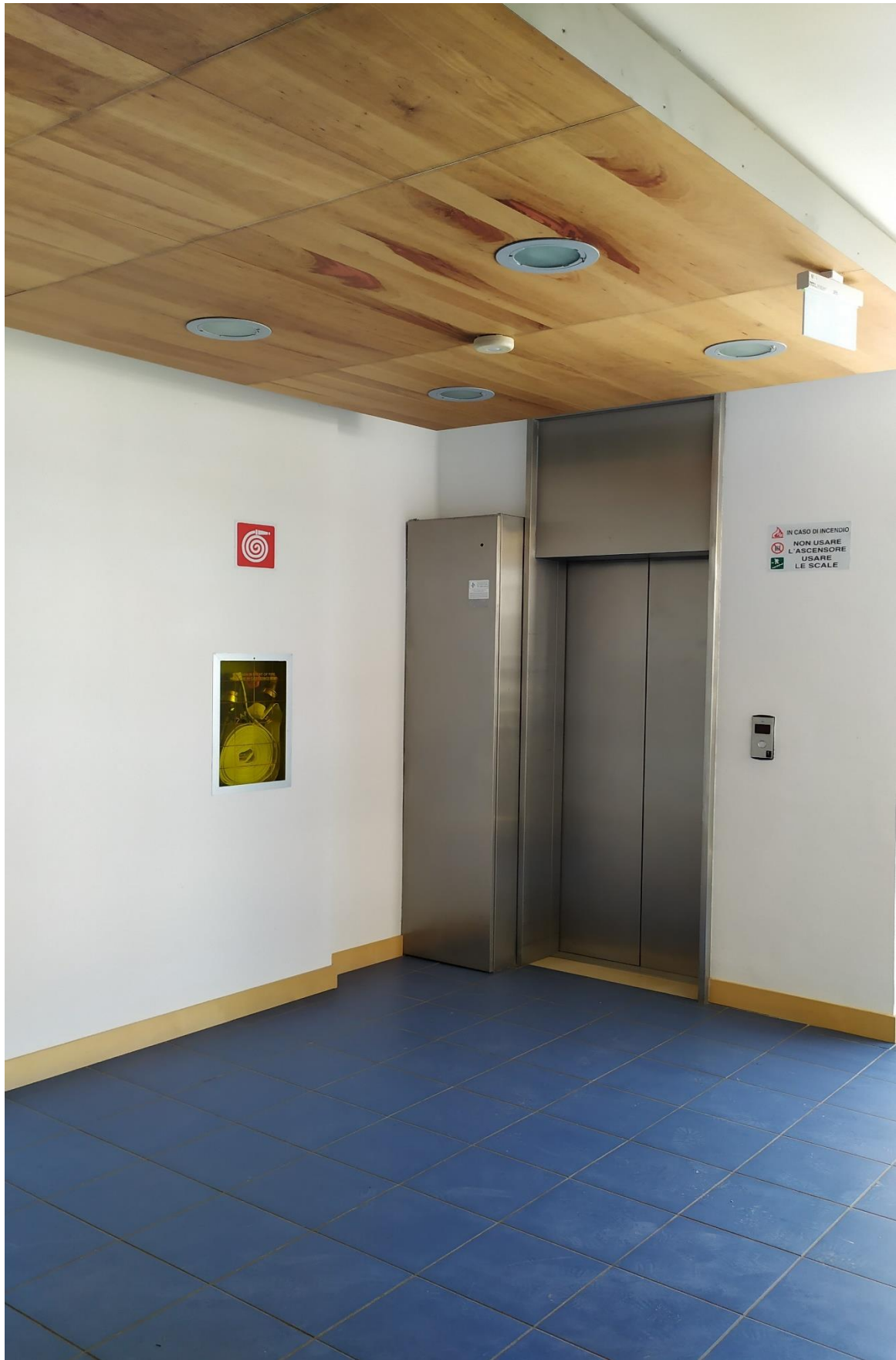
FOTO I.98: in evidenza, il pianerottolo di disimpegno e l'ascensore.