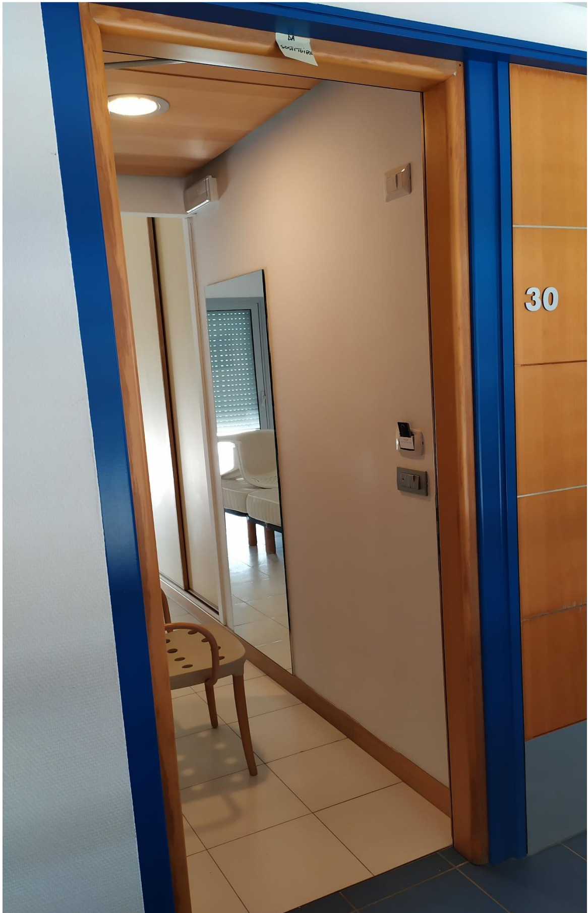
FOTO I.86: in evidenza, la camera 30, pressoché identica alle altre camere dell'Hotel.