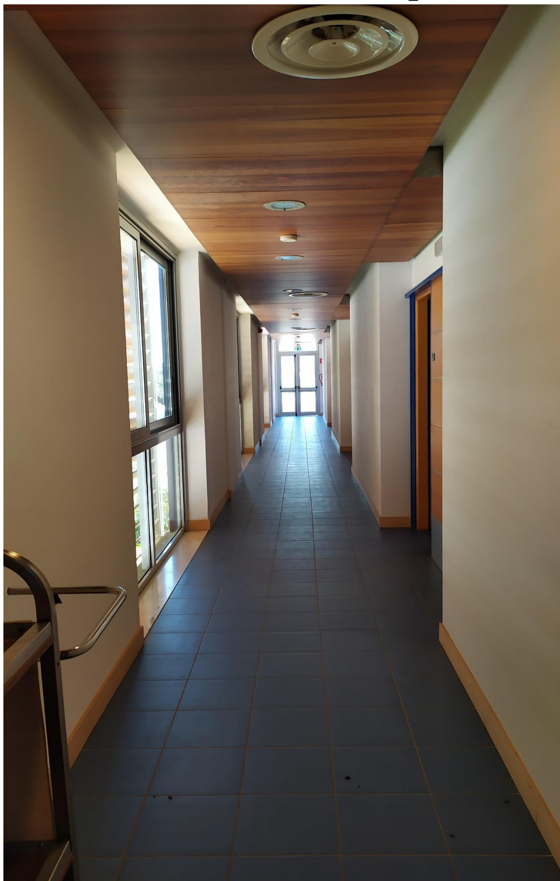
FOTO I.101: in evidenza, il corridoio di disimpegno in prossimità della camera 37.