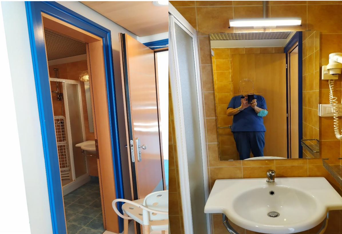
FOTO I.80-81: in evidenza, il bagno della camera 27, pressoché identica alle altre camere dell'Hotel.