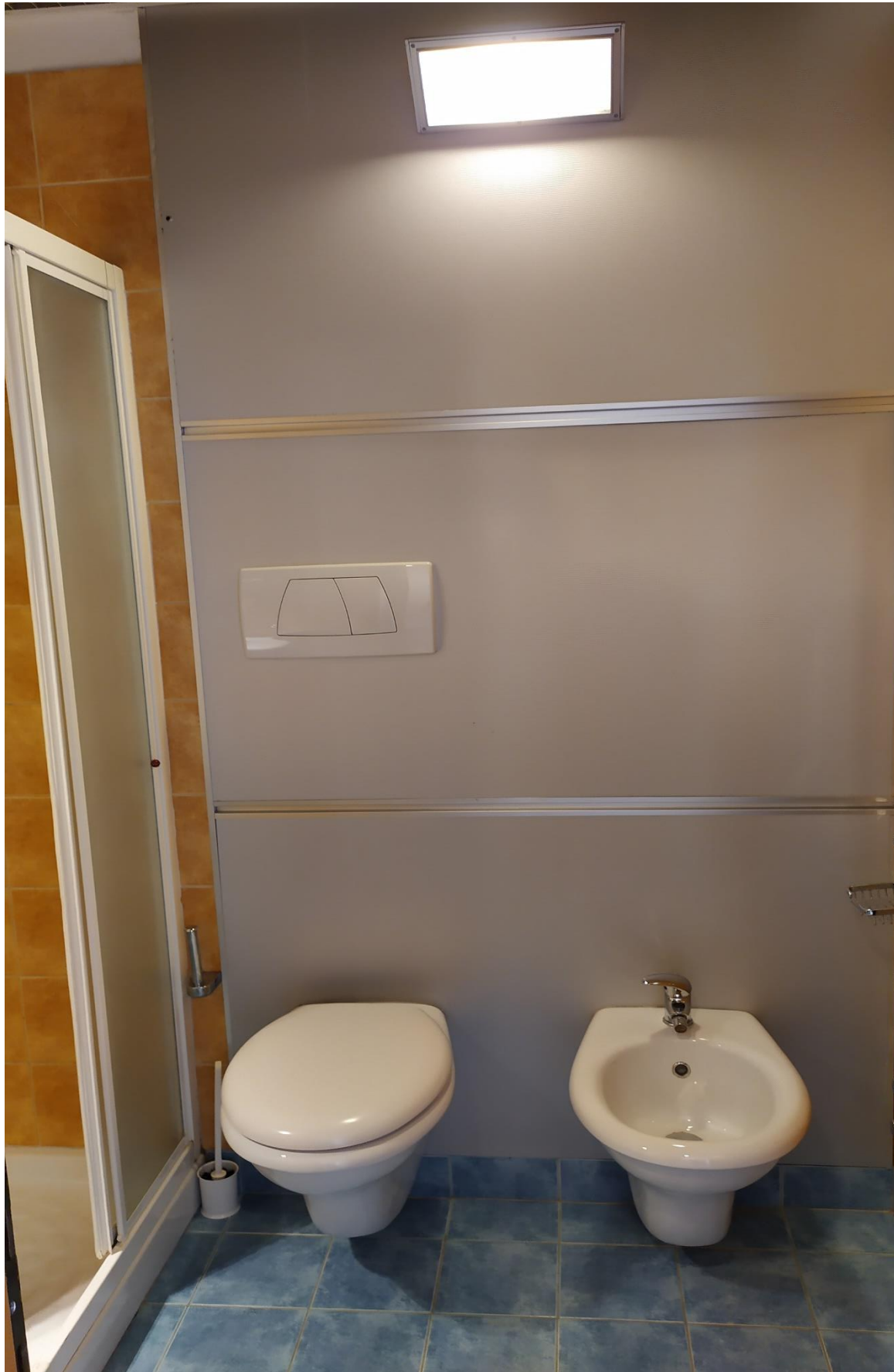
FOTO I.96: in evidenza, il bagno della camera 30, pressoché identica alle altre camere dell'Hotel.