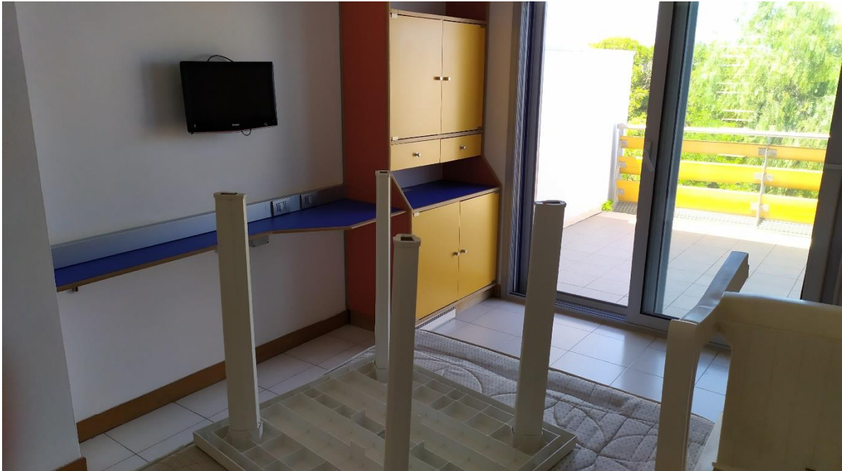
FOTO I.107-108: in evidenza, la zona letto della camera 41, pressoché identica alle altre camere dell'Hotel.