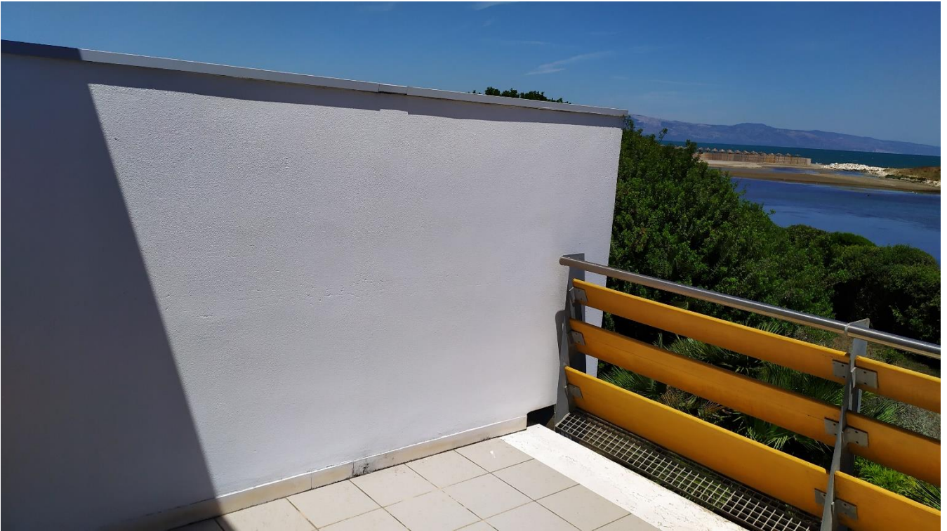
FOTO I.78: in evidenza, la veranda della camera 27, pressoché identica alle altre camere dell'Hotel.