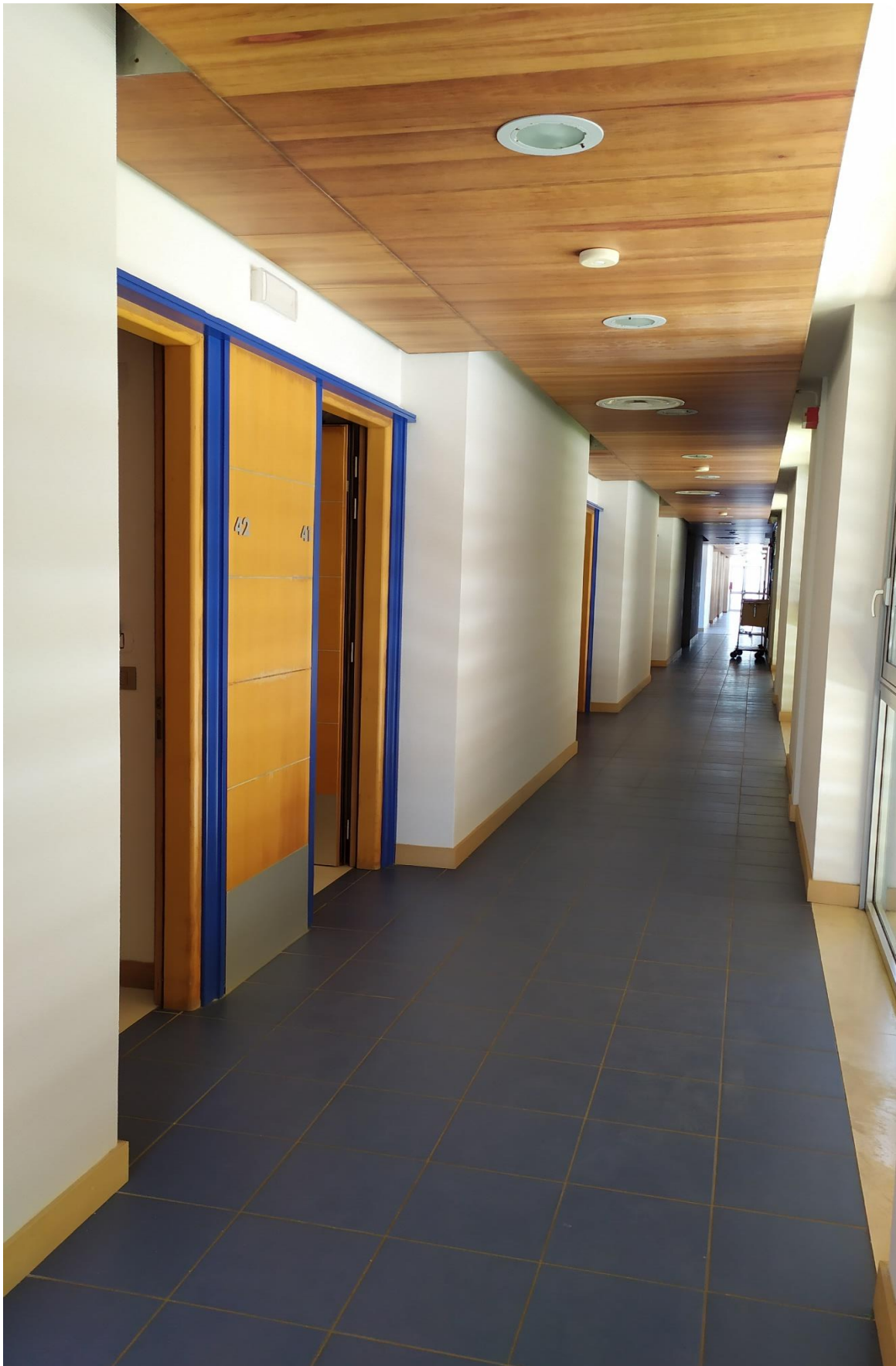
FOTO I.102: in evidenza, il corridoio di disimpegno in prossimità delle camere 41-42.