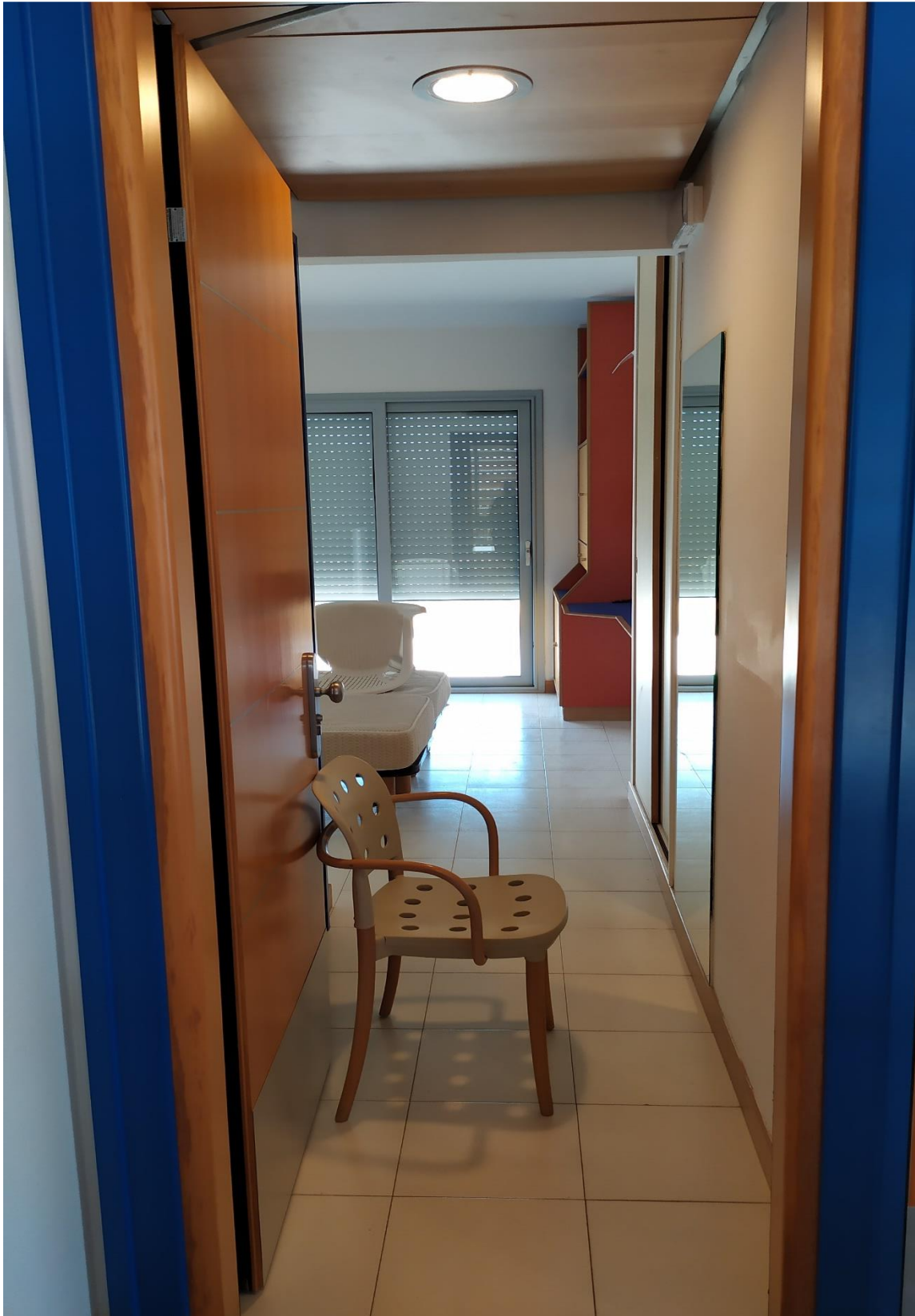
FOTO I.87: in evidenza, la zona d'ingresso della camera 30, pressoché identica alle altre camere dell'Hotel.