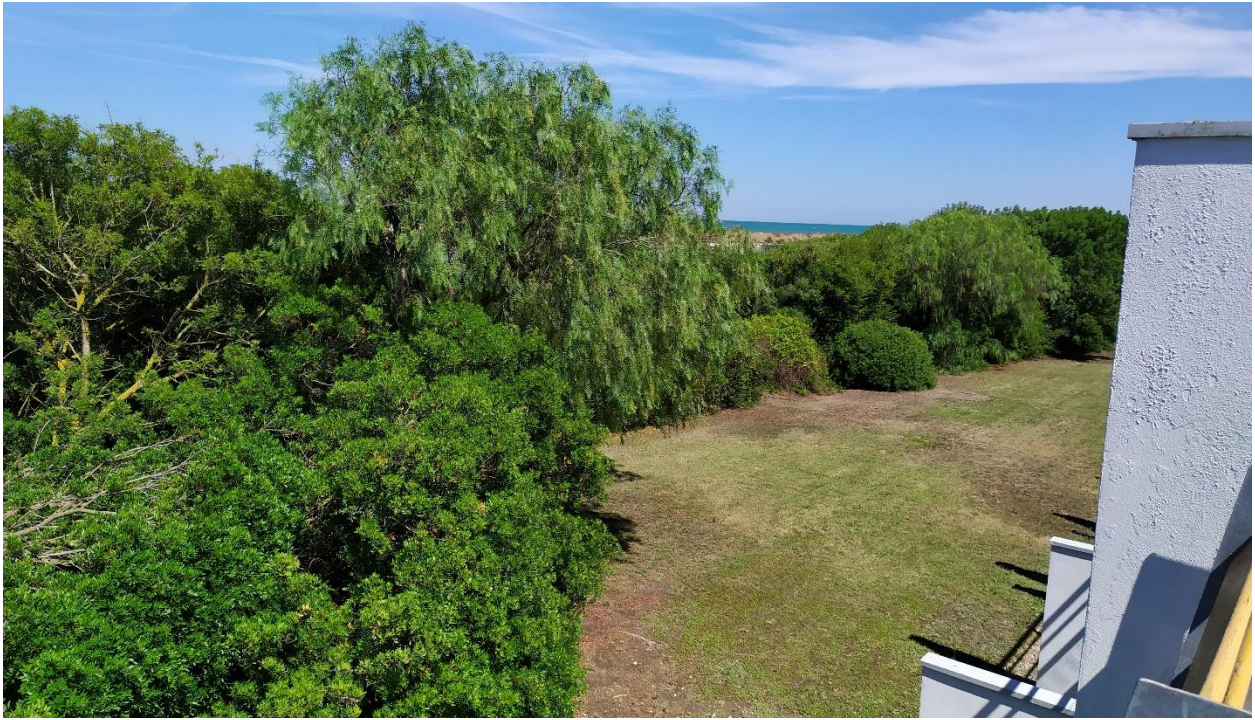
FOTO I.128: in evidenza, il giardino antistante l'Hotel lato mare.