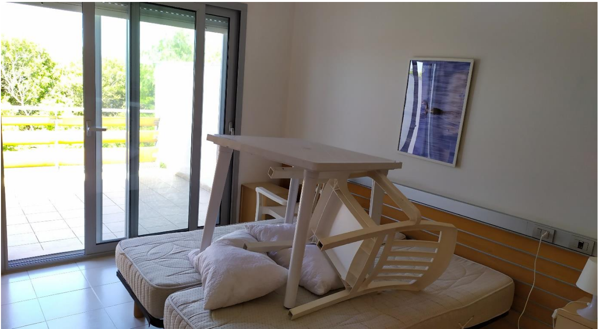
FOTO I.117-118: in evidenza, la zona letto della camera 43, pressoché identica alle altre camere dell'Hotel.