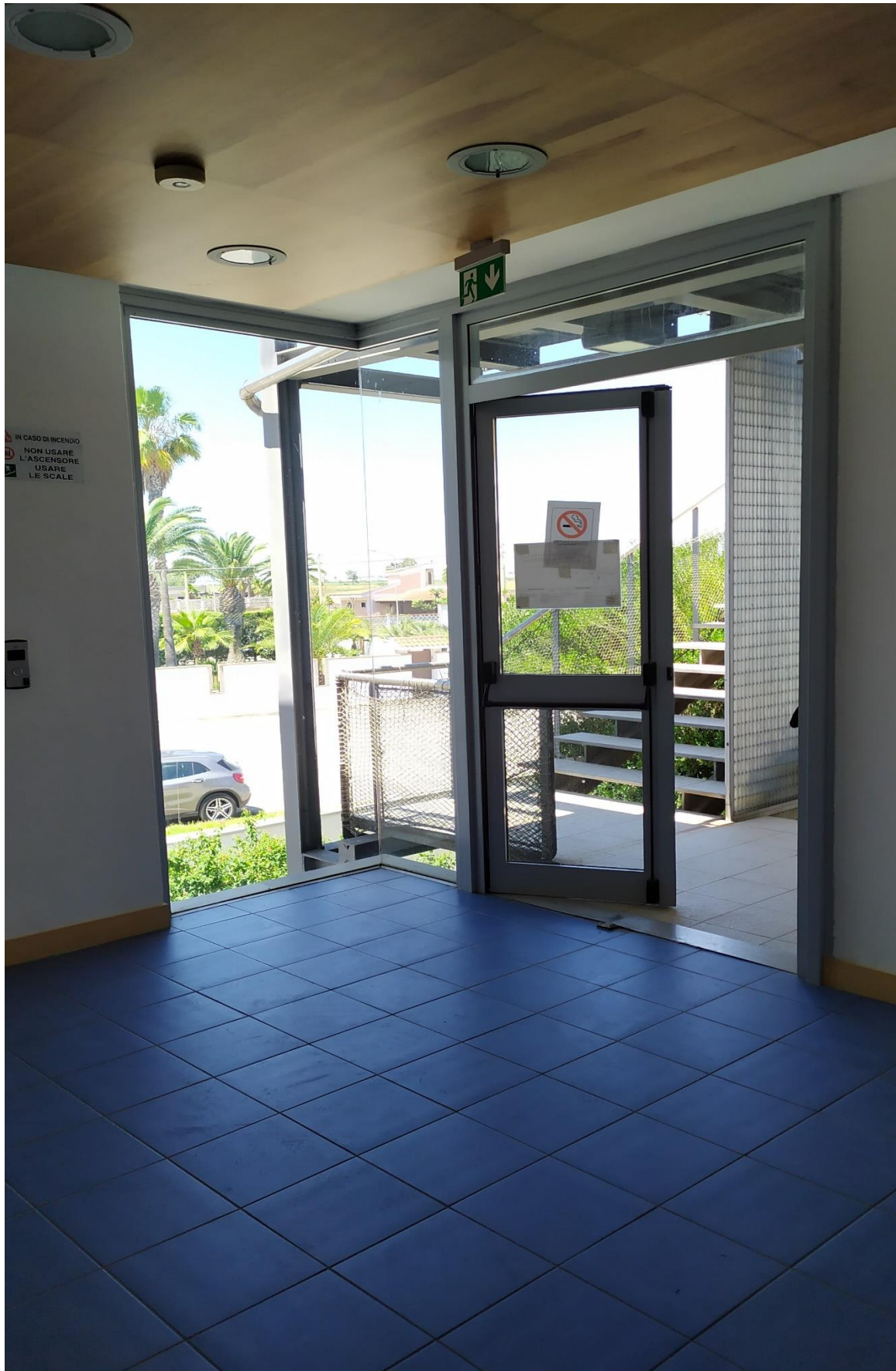
FOTO I.97: in evidenza, il pianerottolo di disimpegno ascensore, le ampie vetrate con uscita di sicurezza e vista sul patio, la scala esterna di accesso al piano superiore ed inferiore, nonché di sicurezza.