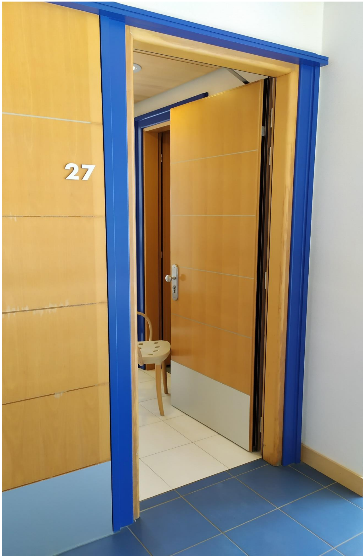
FOTO I.72: in evidenza, la camera 27, pressoché identica alle altre camere dell'Hotel.