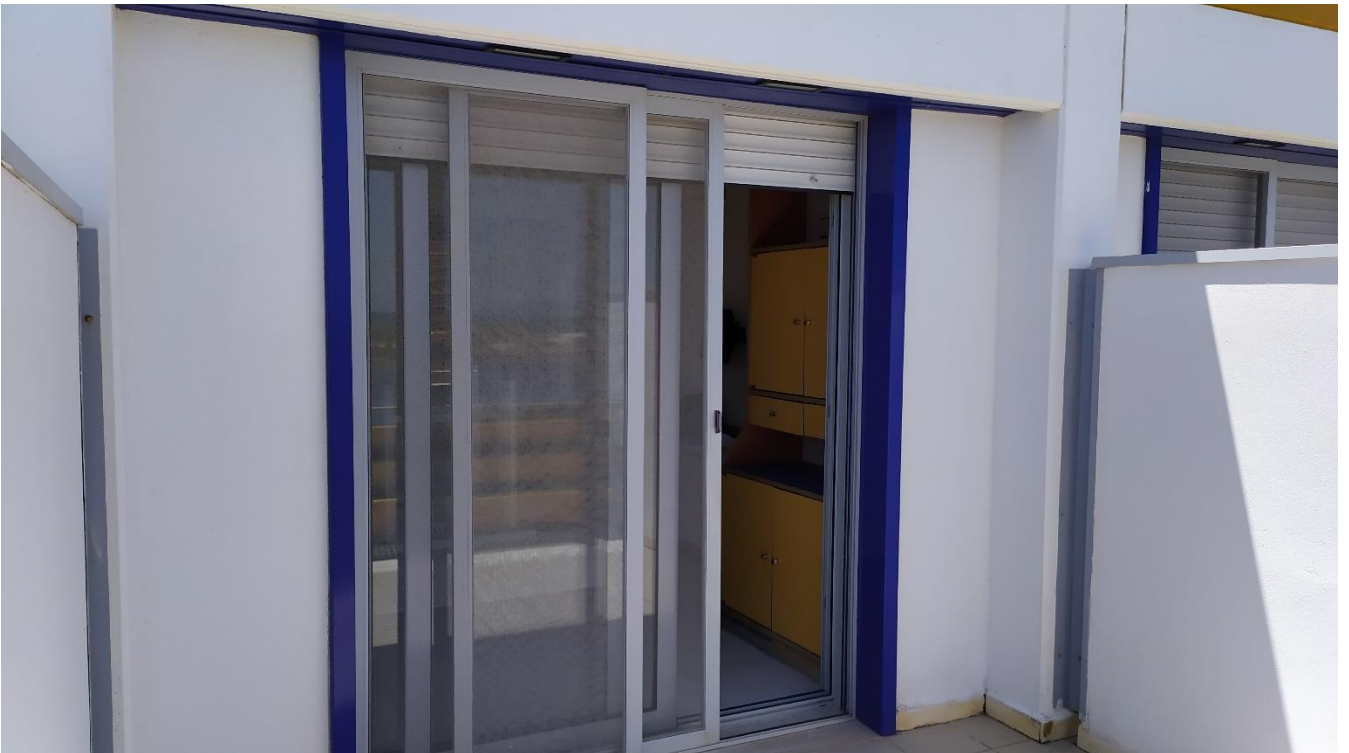
FOTO I.79: in evidenza, la vetrata di accesso alla veranda della camera 27, pressoché identica alle altre camere dell'Hotel.