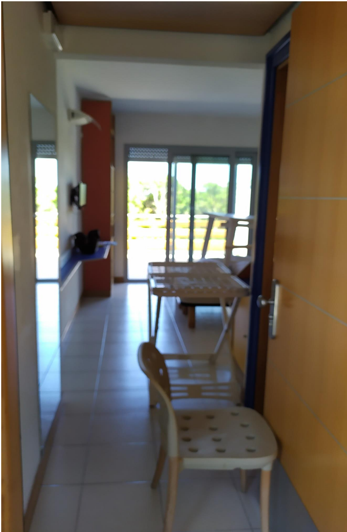
FOTO I.116: in evidenza, la camera 43, pressoché identica alle altre camere dell'Hotel.