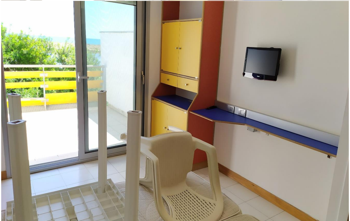
FOTO I.90-91: in evidenza, la zona TV della camera 30, pressoché identica alle altre camere dell'Hotel.