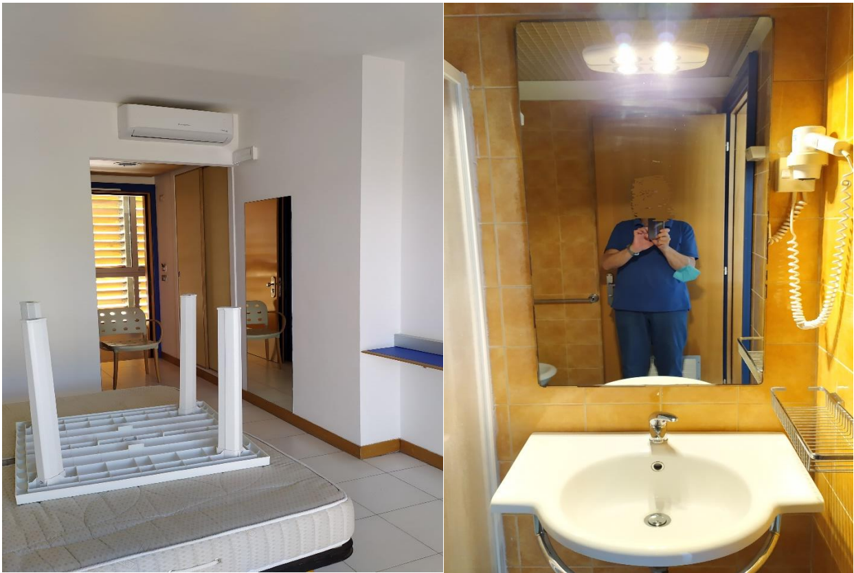
FOTO I.110-111: in evidenza, a sx la zona ingresso alla camera 41, a dx il bagno della stessa, pressoché identica alle altre camere dell'Hotel.