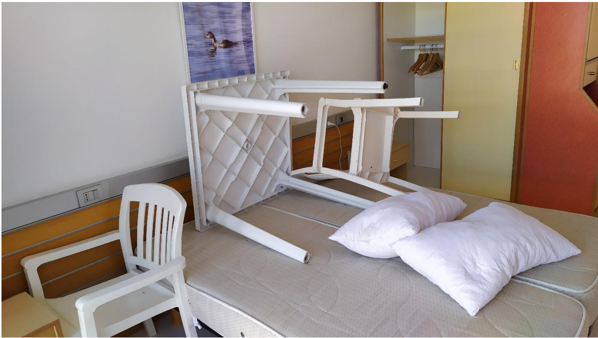
FOTO I.121-122: in evidenza, la zona letto della camera 43, pressoché identica alle altre camere dell'Hotel.