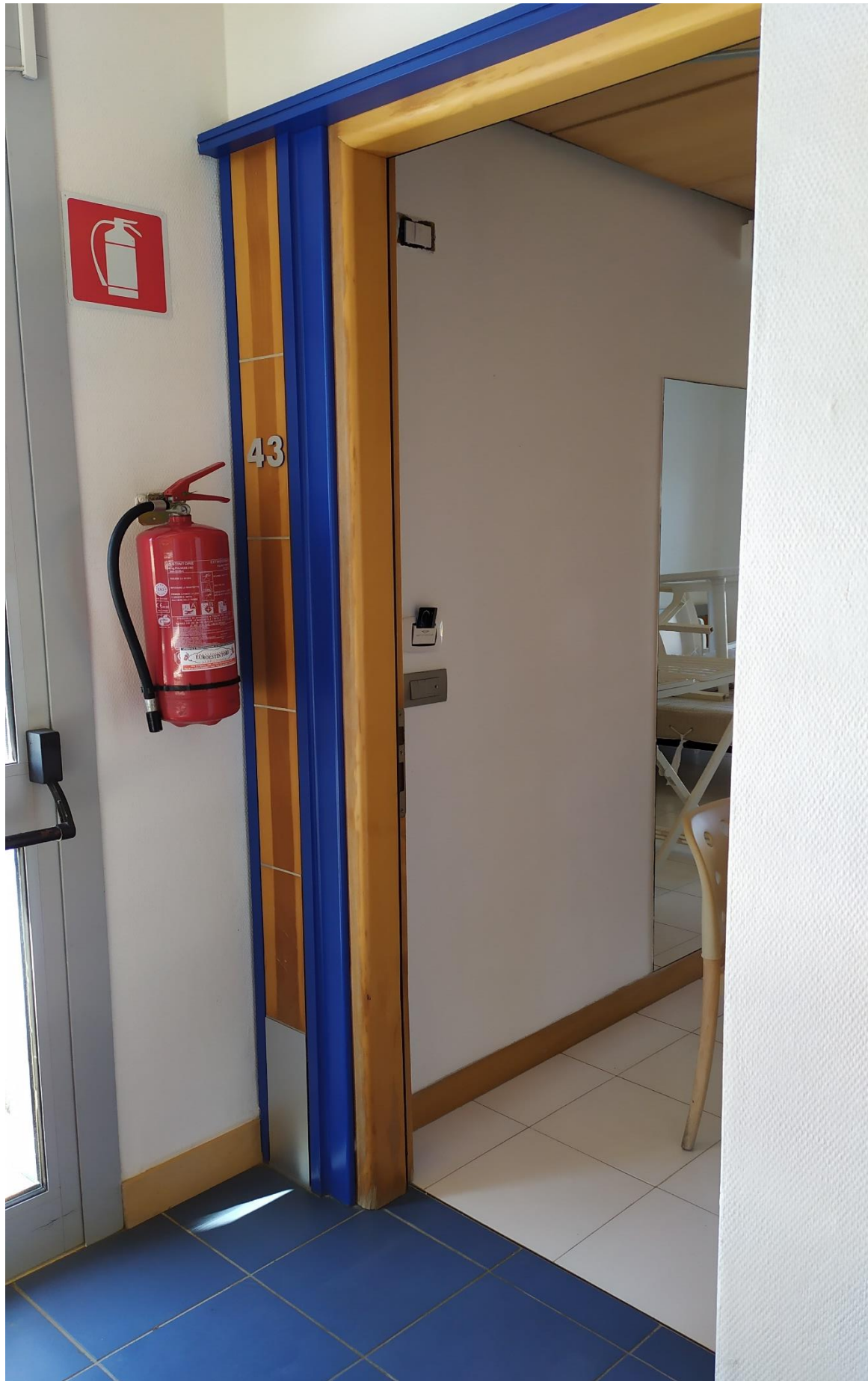
FOTO I.115: in evidenza, la camera 43, pressoché identica alle altre camere dell'Hotel.