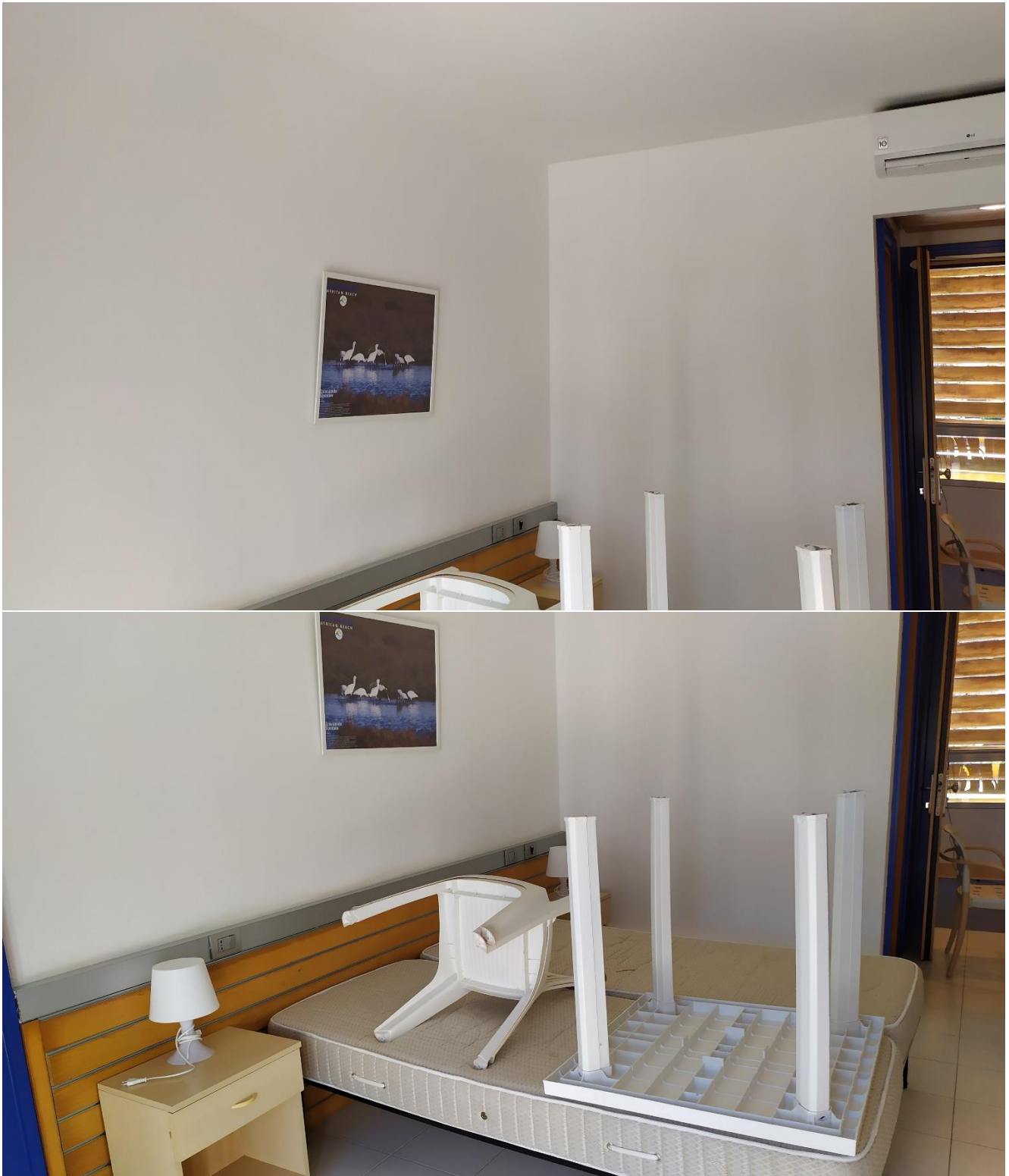
FOTO I.74-75: in evidenza, la zona letto della camera 27, pressoché identica alle altre camere dell'Hotel.