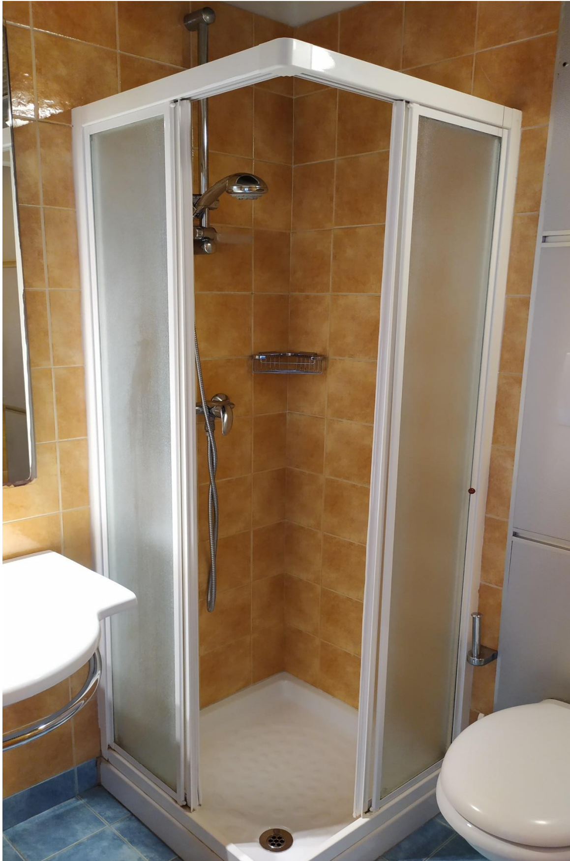
FOTO I.95: in evidenza, il bagno della camera 30, pressoché identica alle altre camere dell'Hotel.