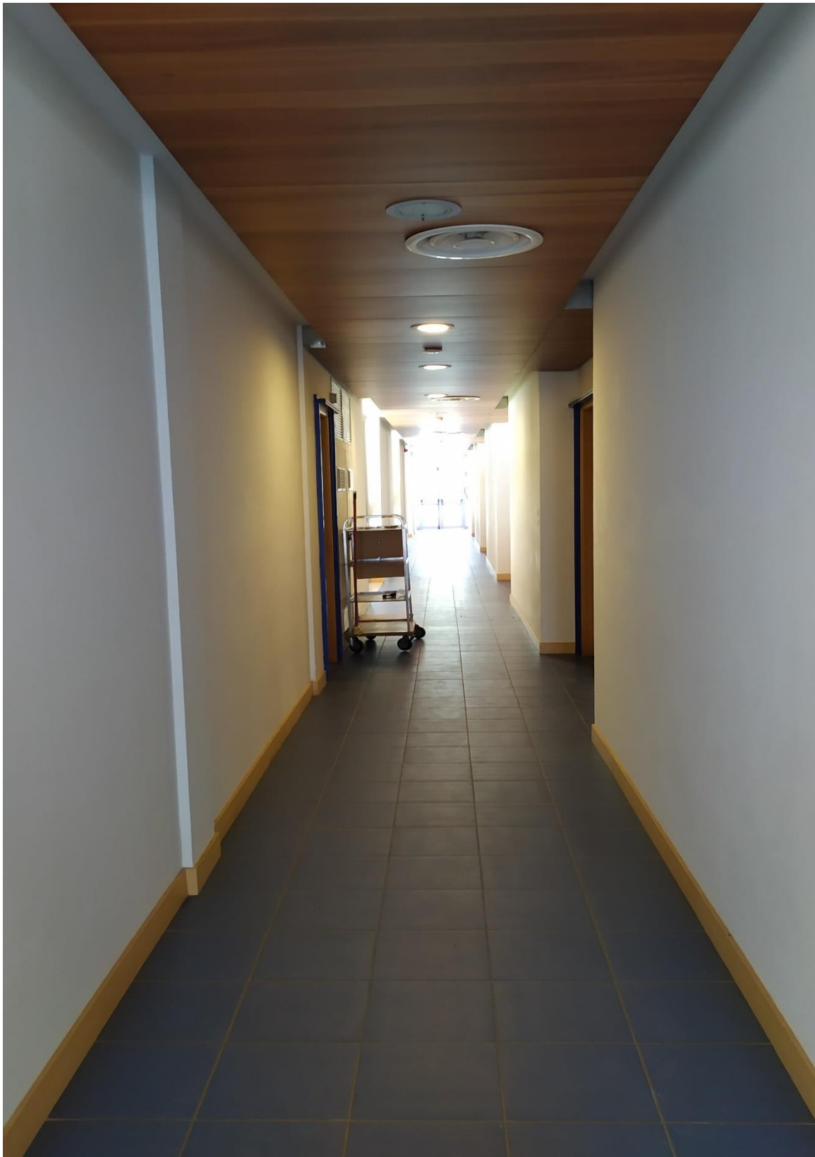
FOTO I.100: in evidenza, il corridoio di disimpegno in prossimità della camera 34.