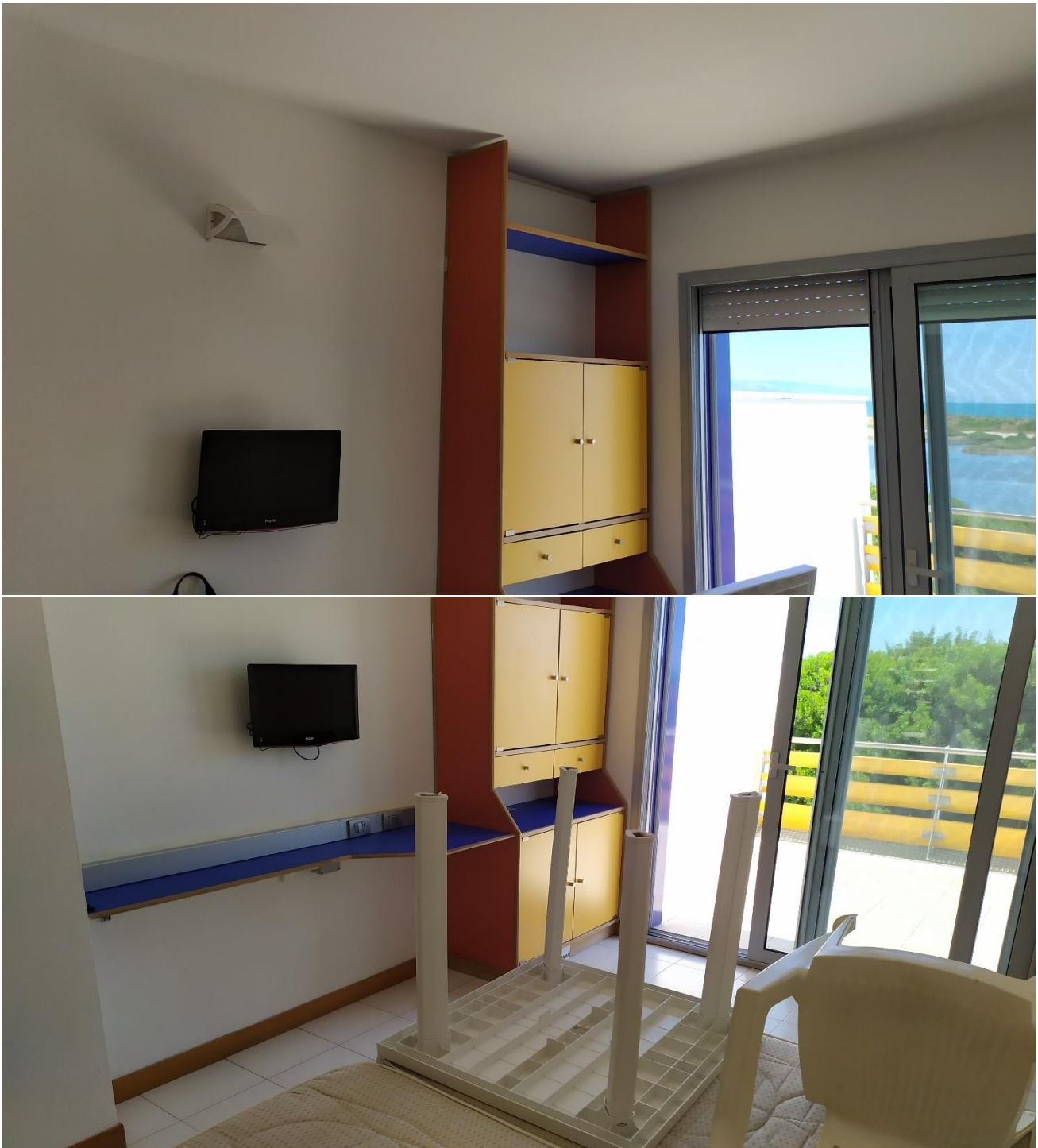
FOTO I.76-77: in evidenza, la zona TV della camera 27, pressoché identica alle altre camere dell'Hotel.