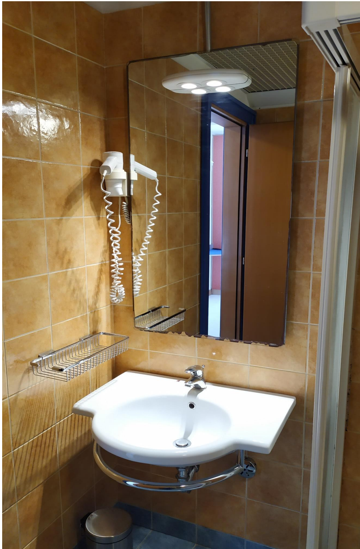
FOTO I.94: in evidenza, il bagno della camera 30, pressoché identica alle altre camere dell'Hotel.