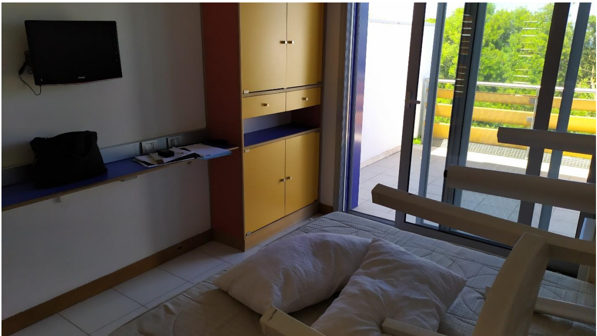
FOTO I.119-120: in evidenza, la zona TV della camera 43, pressoché identica alle altre camere dell'Hotel.