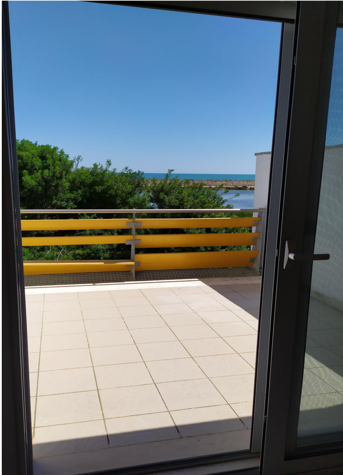
FOTO I.92: in evidenza, la veranda della camera 30, pressoché identica alle altre camere dell'Hotel.