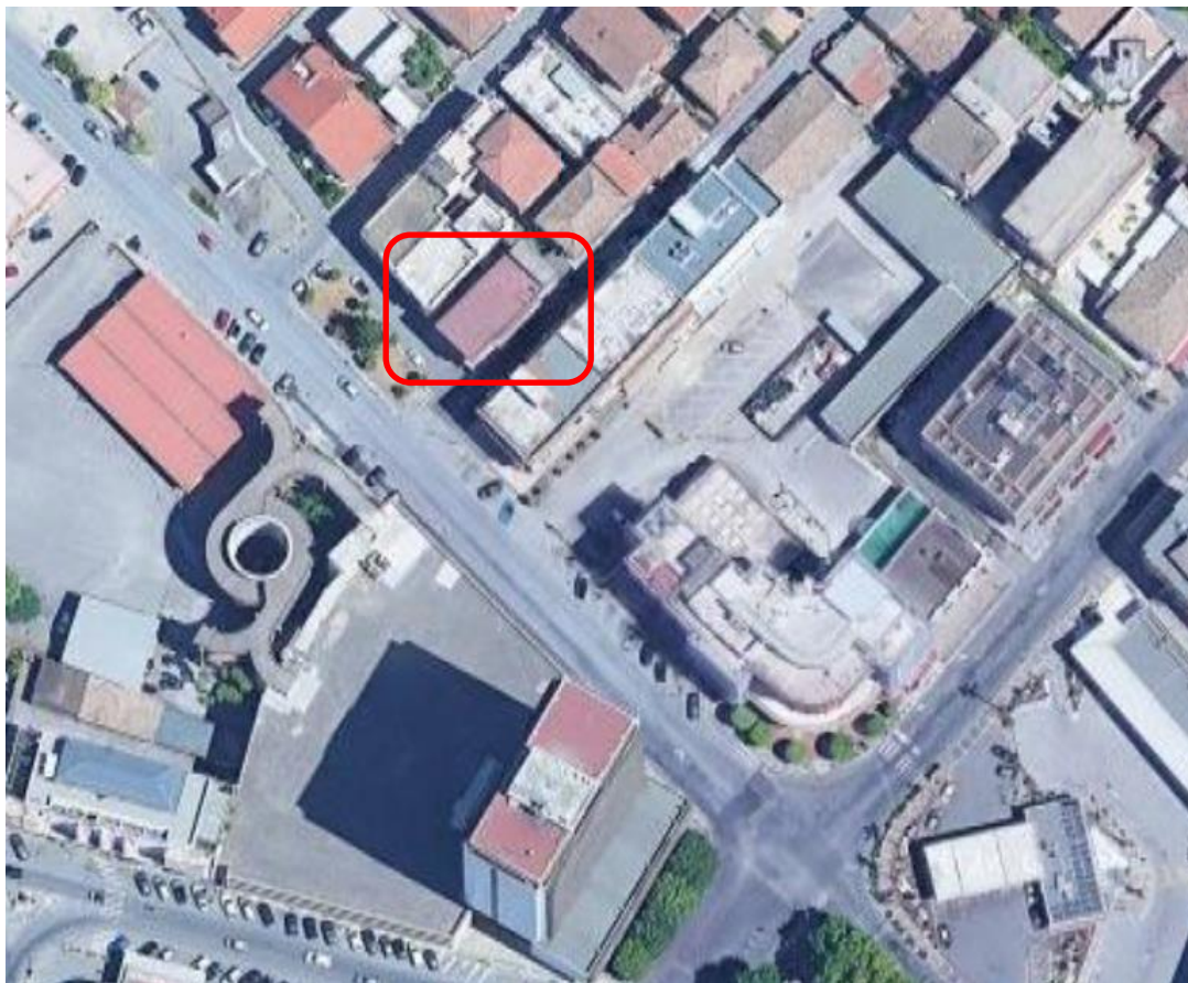
FOTO AEREA INDIVIDUAZIONE DEI BENI OGGETTO DI PIGNORAMENTO LOTTO 8: Comune di Frosinone - Fg. 55, Part. 320, Sub. 4