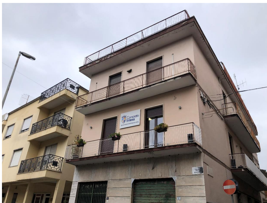
VISTA ESTERNA DEL FABBRICATO LOTTO 8: Comune di Frosinone - Fg. 55, Part. 320, Sub. 4