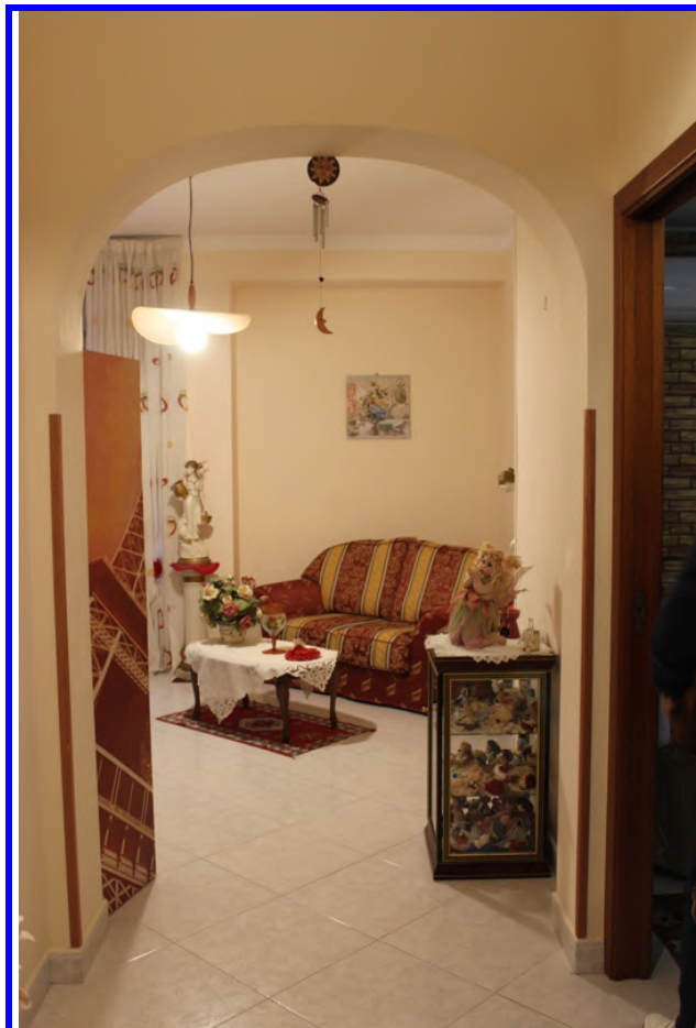
Foto 2 - salone