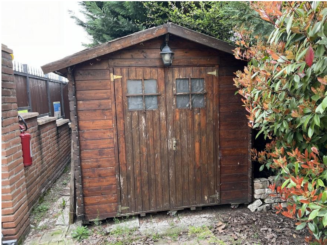
casetta su ruote