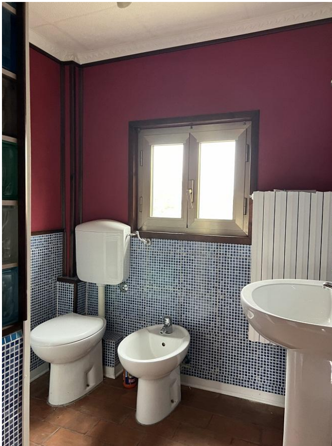
bagno illegittimo piano primo