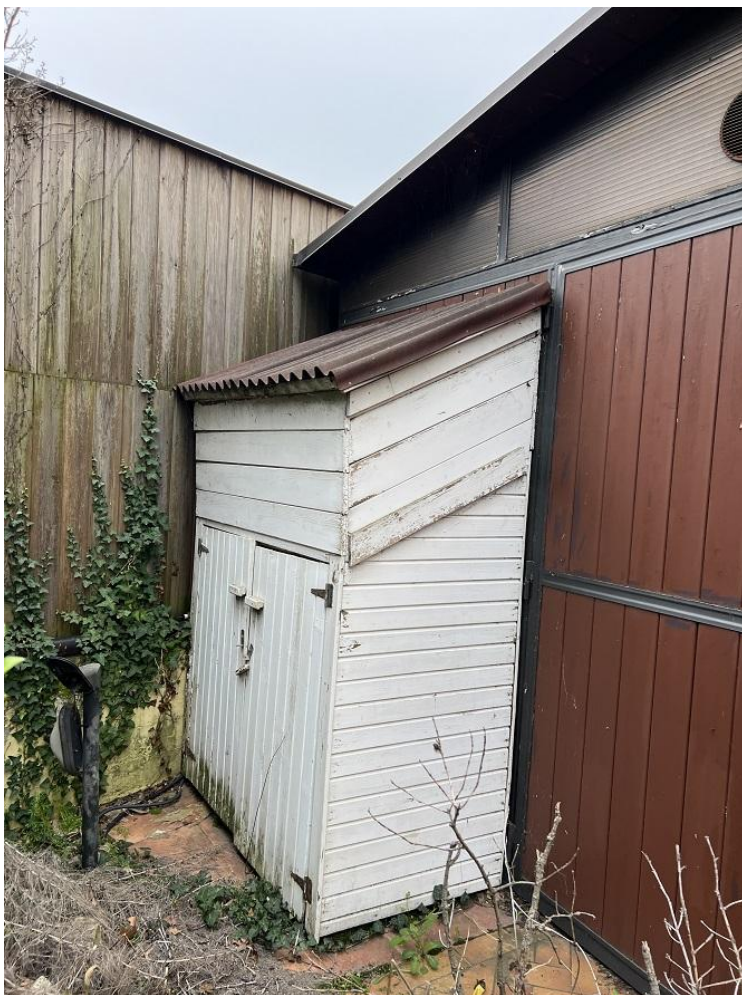
ripostiglio esterno lato est