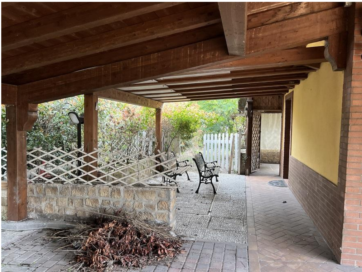
Porticato con una porzione illegittima