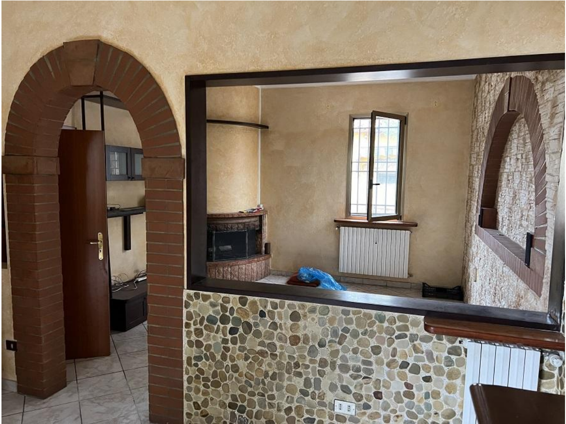
piano terra abitazione