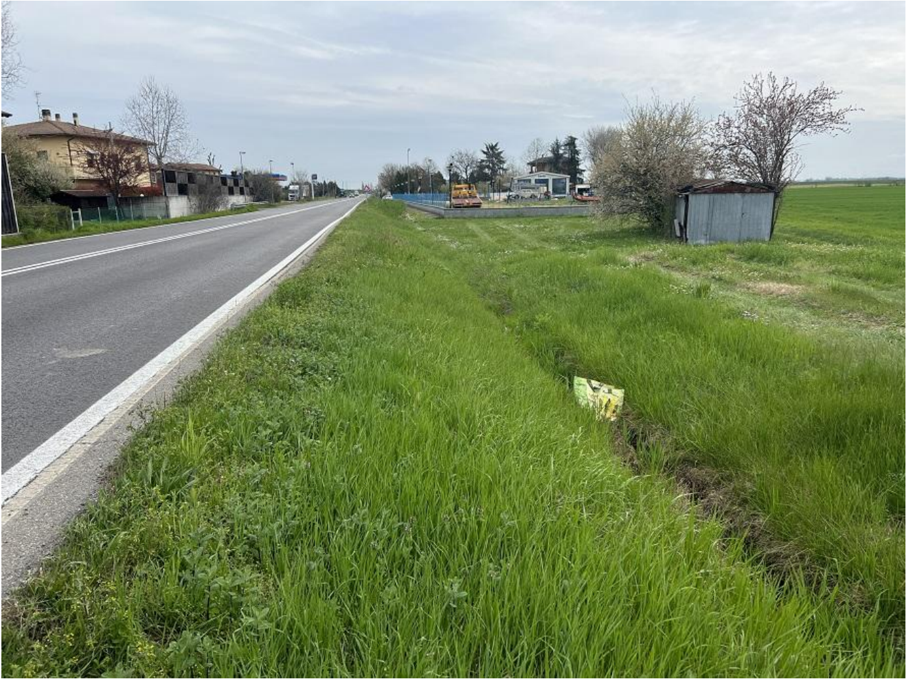
terreno mappale 66