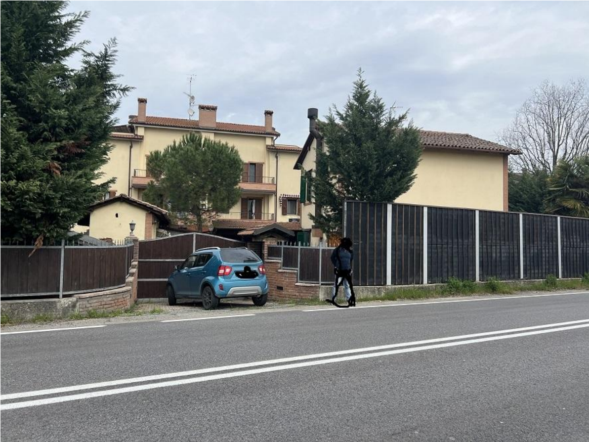
Sala Bolognese via Gramsci n.35