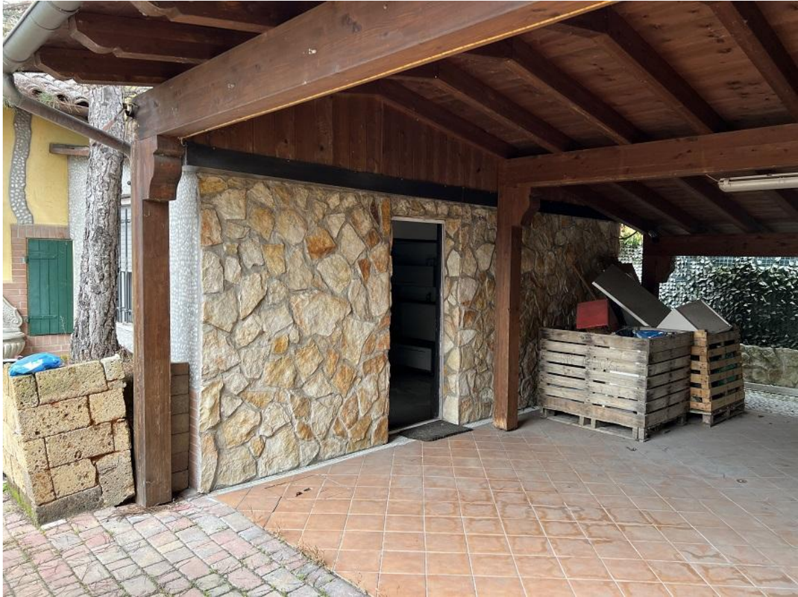
Accesso corpo accessorio trasformato senza titolo in abitazione