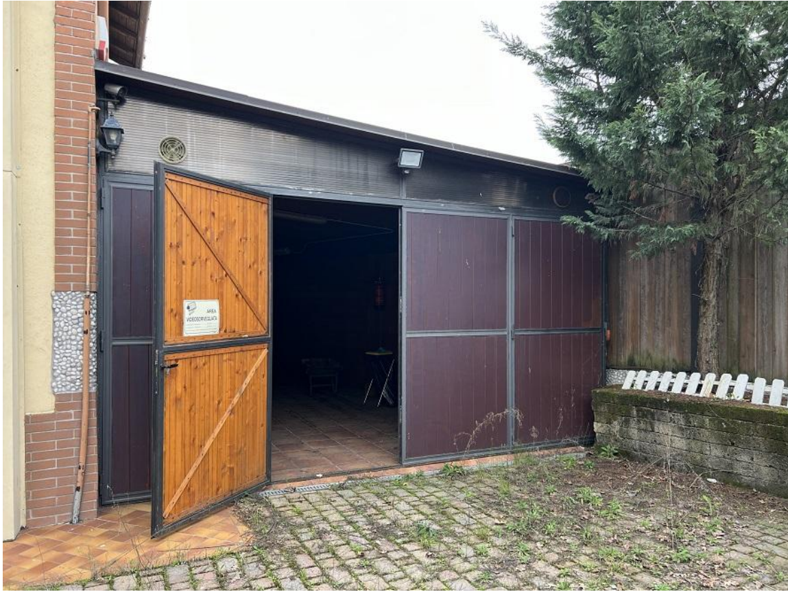
ex pergolato ora chiuso