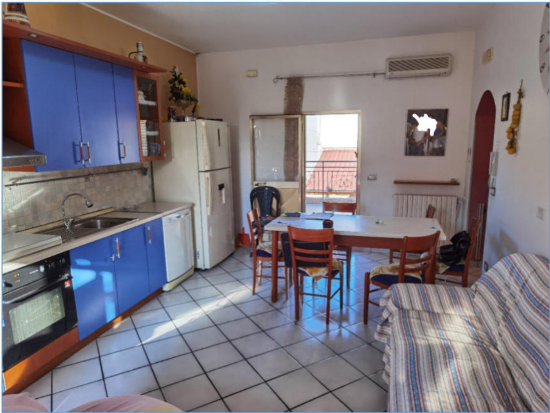
SUB. 2 PIANO SECONDO – Cucina