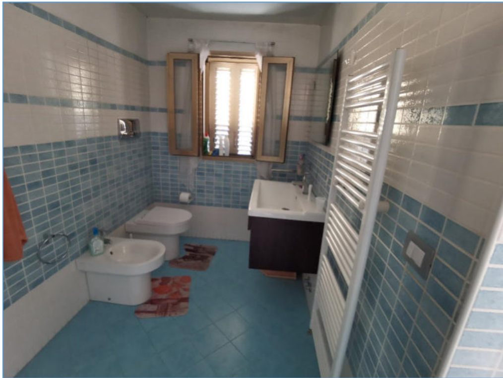
SUB. 2 PIANO SECONDO – Bagno