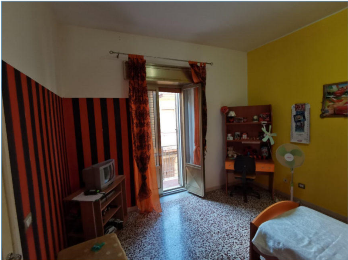
SUB. 2 PIANO PRIMO – Camera da Letto 3