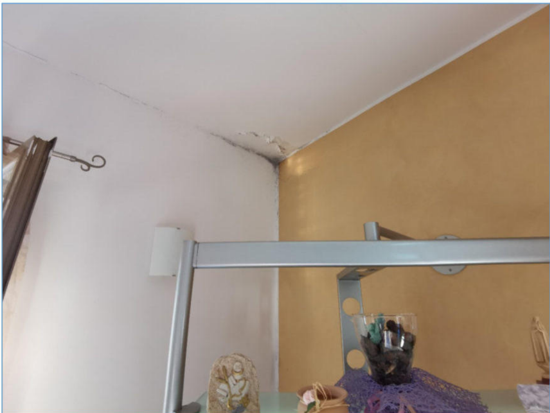
SUB. 2 PIANO SECONDO – Infiltrazioni Cucina