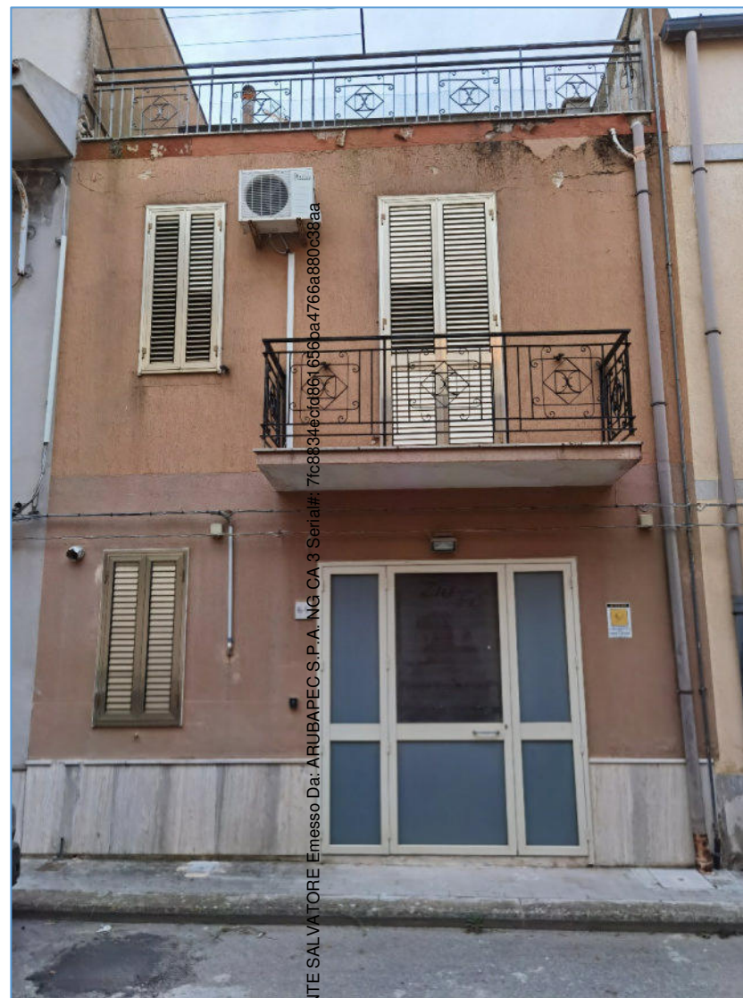
PROSPETTO DI VIA MARIO ANGELICO

Firmato Da: COPIRENTE SALVATORE Emesso Da: ARUBAPEC S.P.A. NG CA 3 Serial#: 7fc8834ecf48676566a4766a880c38aa