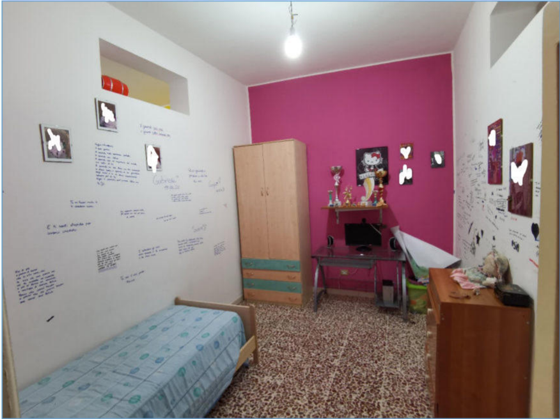
SUB. 2 PIANO PRIMO – Camera da Letto 2