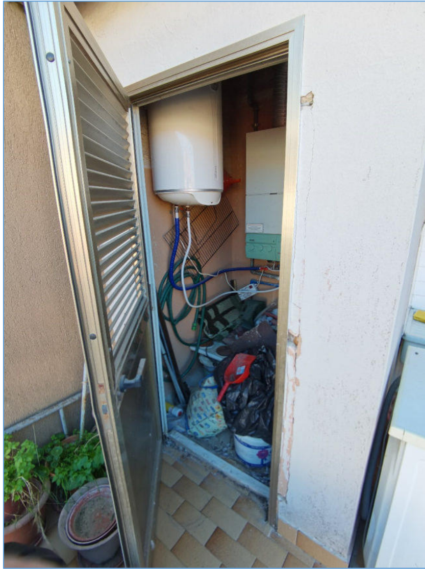
SUB. 2 PIANO SECONDO – Locale Tecnico