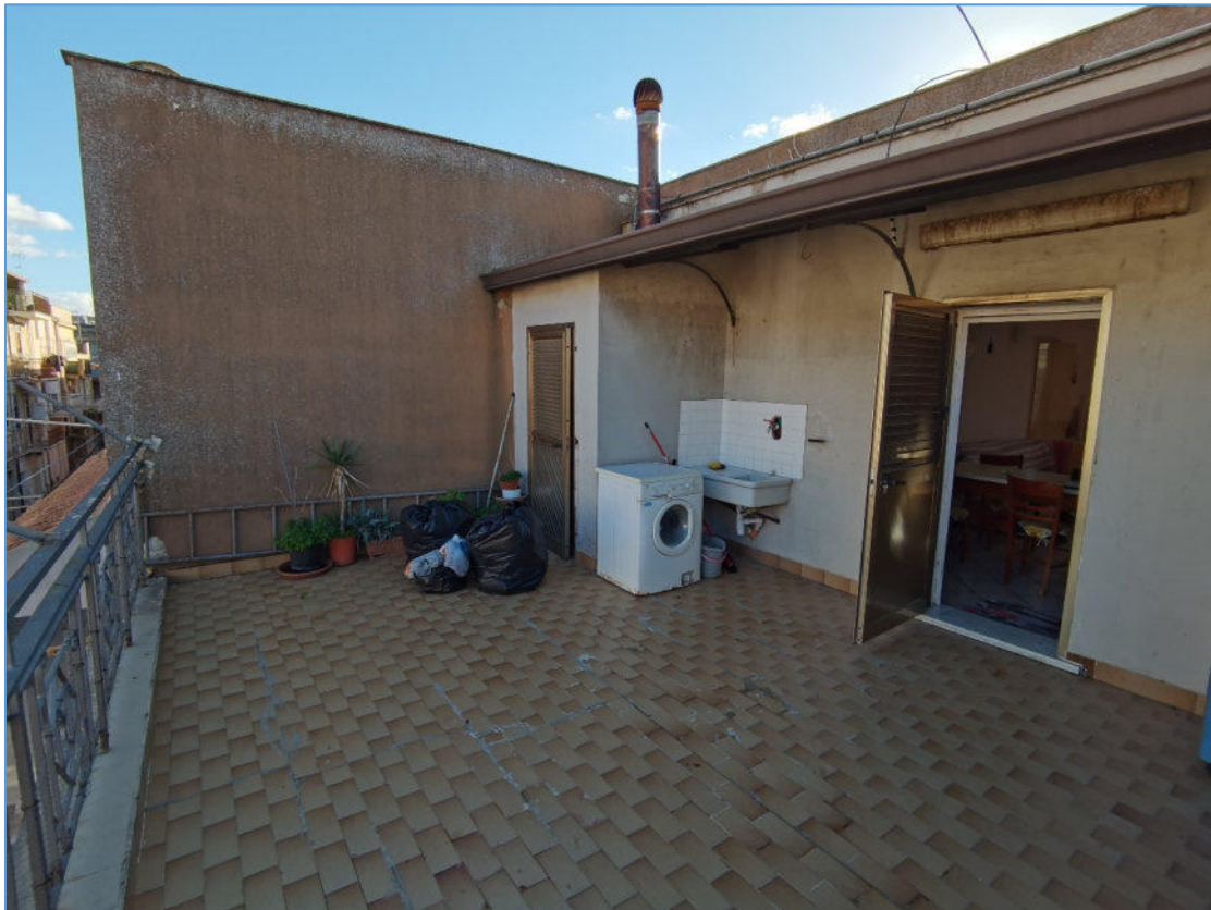
SUB. 2 PIANO SECONDO – Terrazza su via Mario Angelico