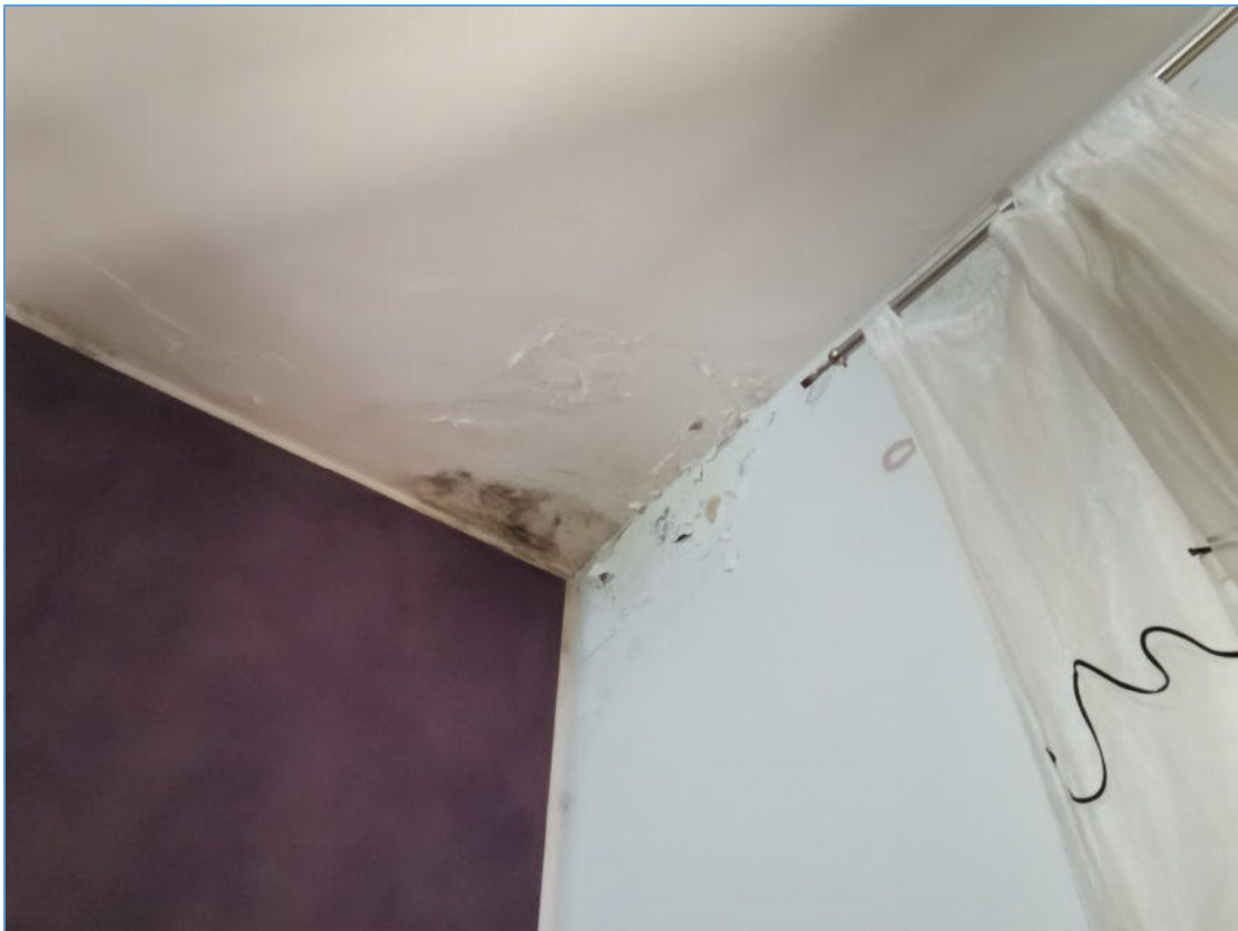
SUB. 2 PIANO PRIMO – Infiltrazioni Camera da Letto 1