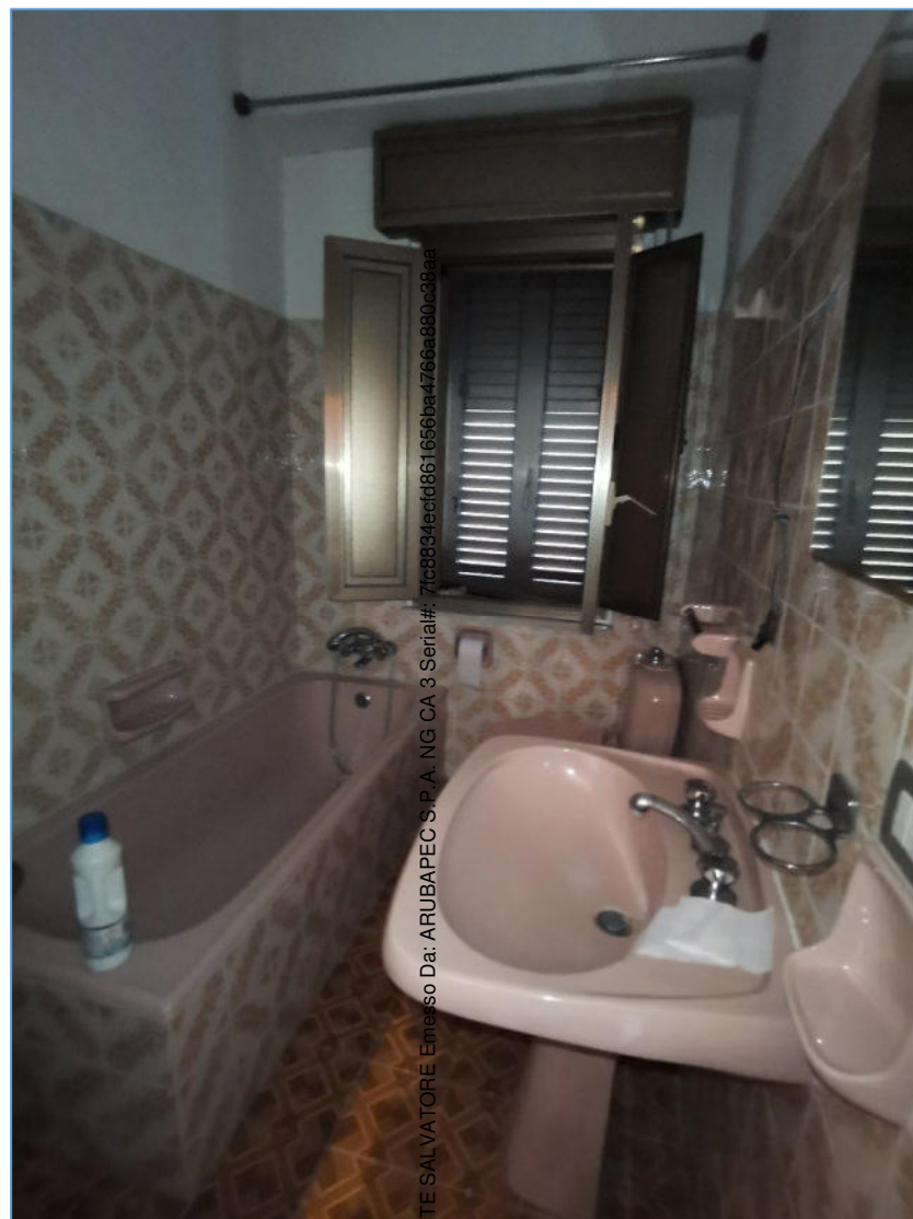
SUB. 2 PIANO PRIMO – bagno

Firmato Da: COPIRENTE SALVATORE Emergenso Da: ARUBAPEC S.P.A. NG CA 3 Serial#: 71c8894eef6861656ba4766a880c38aa