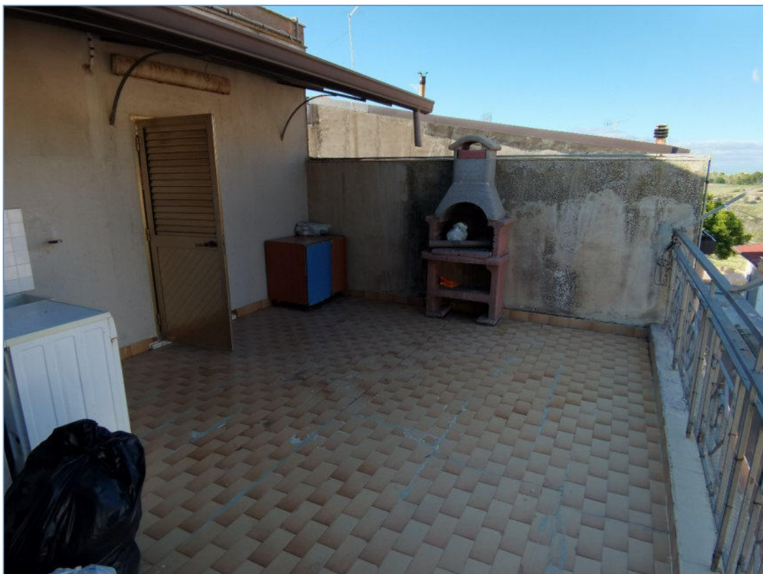
SUB. 2 PIANO SECONDO – Terrazza su via Mario Angelico