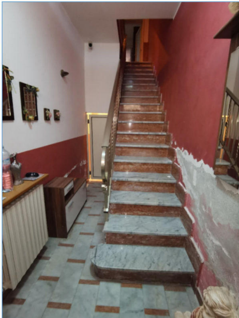
SUB. 2 PIANO TERRA – Ingresso