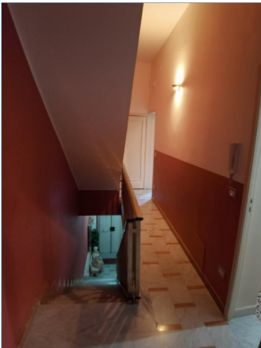
SUB. 2 PIANO PRIMO – scala e corridoio