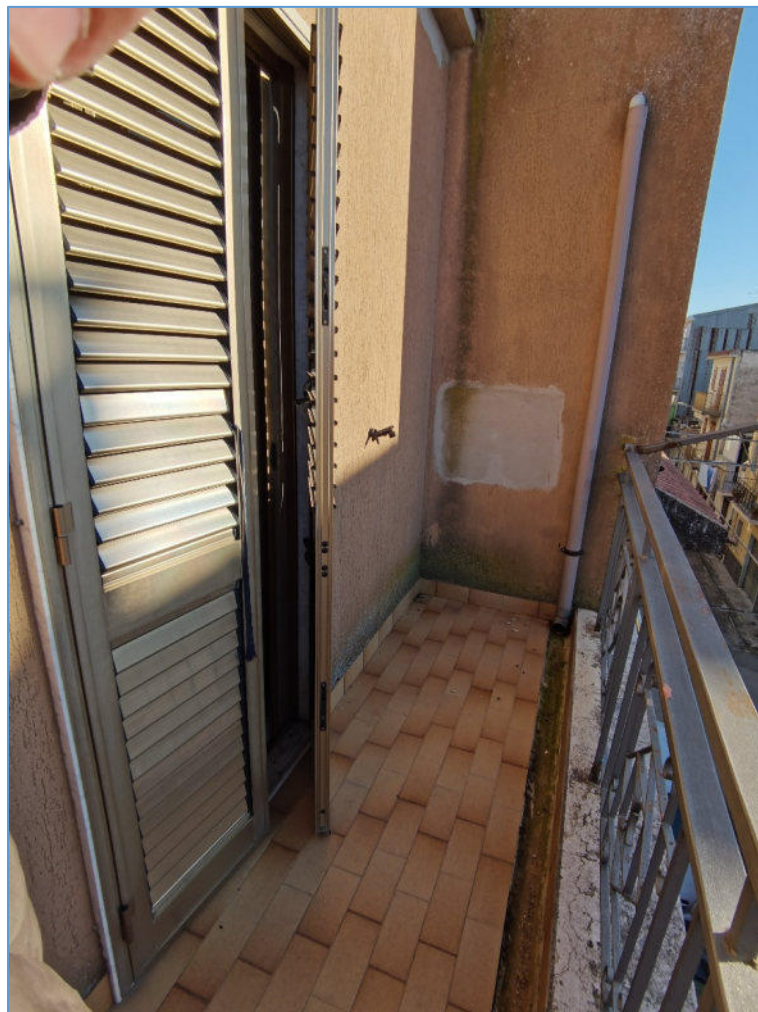
SUB. 2 PIANO SECONDO – Terrazzino su via Libertà