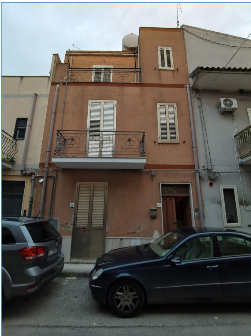
PROSPETTO DI VIA LIBERTÀ'