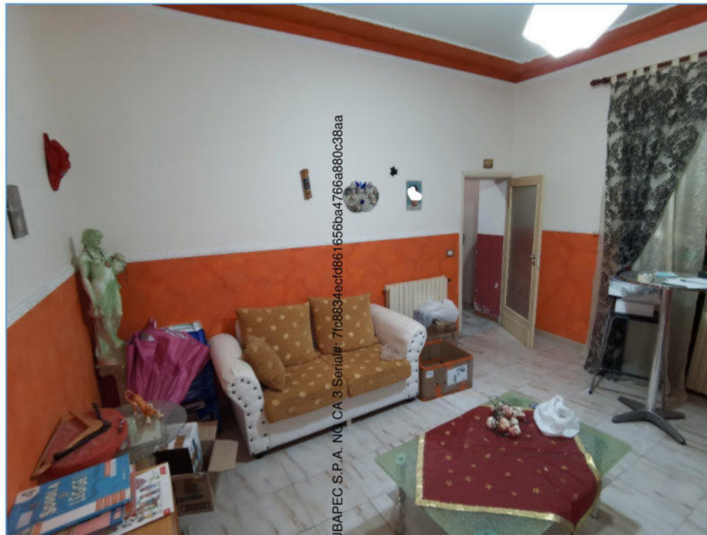
SUB. 2 PIANO TERRA – Salotto

Firmato Da: CORRENTE SALVATORE Emesso Da: ARUBAPEC S.P.A. - NO. CA. 3 Serial#: 71c8834ecid861656ba4766a80c38aa