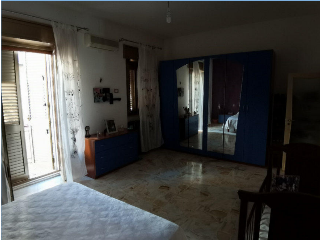
SUB. 2 PIANO PRIMO – Camera da Letto 1