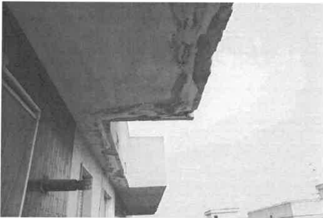
Foto n°8 Intradosso del cornicione del palazzo visto dal balcone dell'esecutato