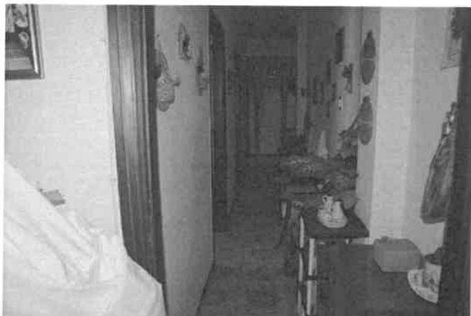
Foto n°22 Il corridoio visto dalla camera della foto n°21. sinistra in successione: la camera da letto, il bagno e la cucina, sul fondo il ripostiglio, alla sua sinistra l'ingresso all'abitazione