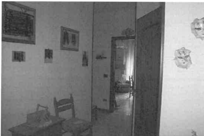
Foto n°12 L'ingresso dell'abitazione, a destra il ripostiglio, frontalmente la cucina