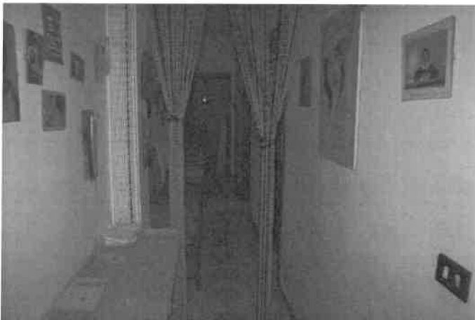
Foto n°14 Il corridoio, a destra in successione, il bagno e la camera da letto, sul fondo altra camera