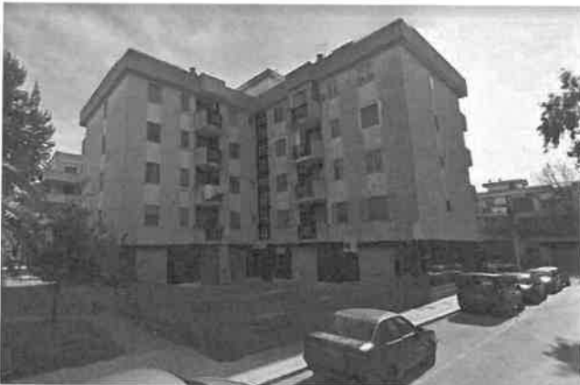
Foto n°1 Il portone di accesso in angolo tra le due ali dell'edificio