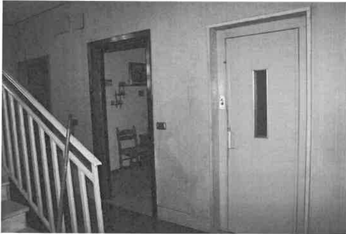
Foto n°10 La porta di ingresso all'unità abitativa in esecuzione, a sinistra di quella dell'ascensore.