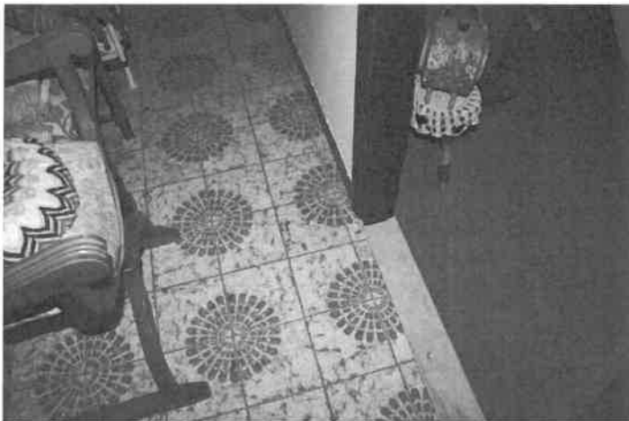
Foto n°18 Il pavimento del corridoio e quello della camera da letto