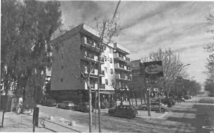
Foto n°1 Fabbricato in angolo tra strada privata (sinistra) e via delle Repubblica (destra)