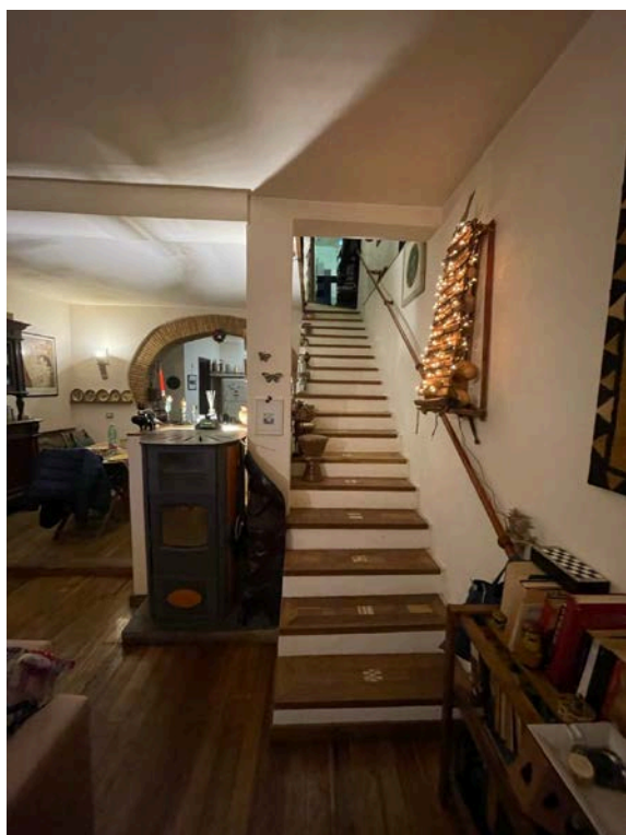
Scala interna tra piano terra e primo.