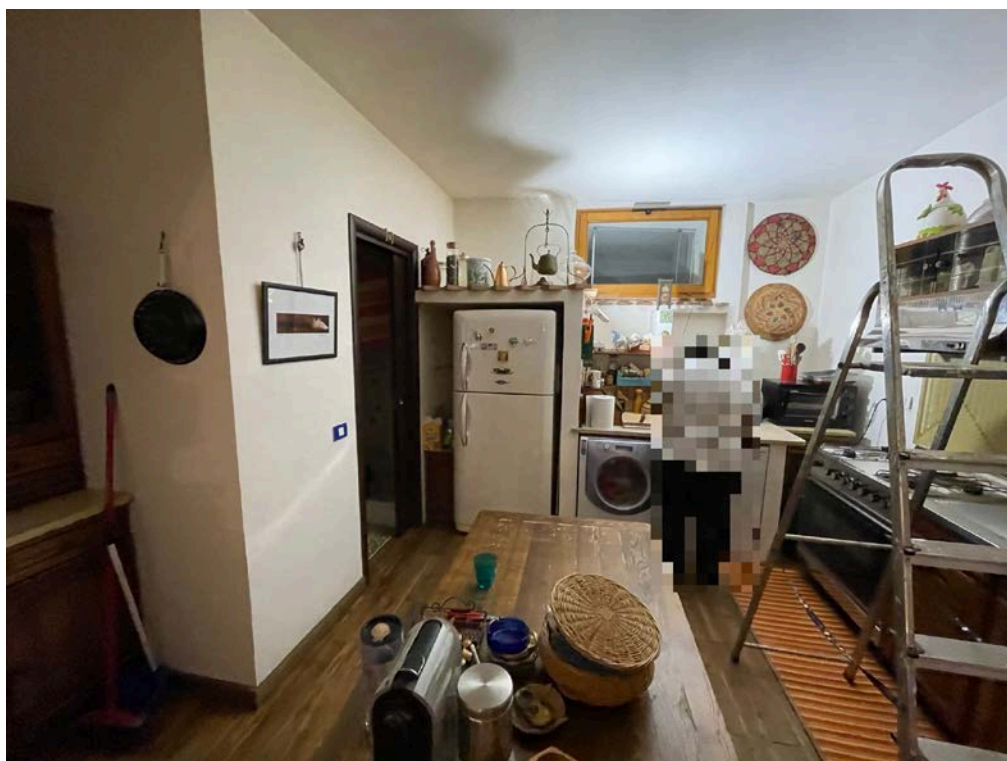
Vista della cucina al piano terra.