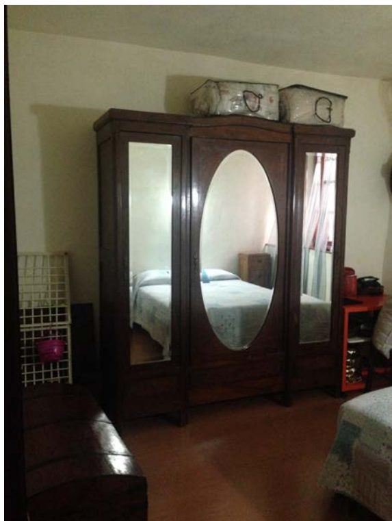
Camera, lato retro, piano primo.