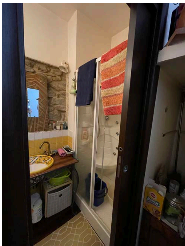
Bagno piano terra.