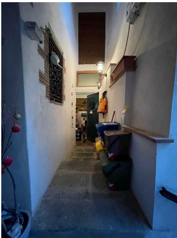
Porzione di atrio esclusivo per l'accesso all'immobile.