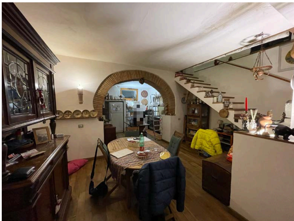
Vista della zona pranzo al piano terra.