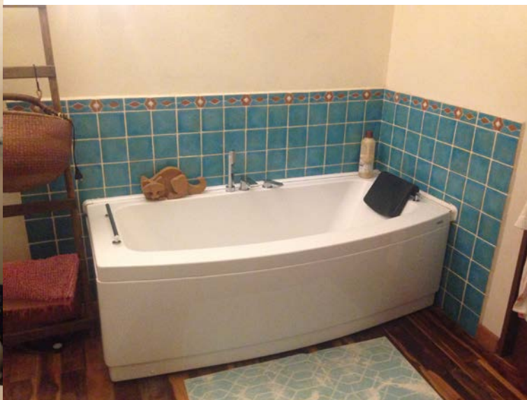
Bagno piano primo.