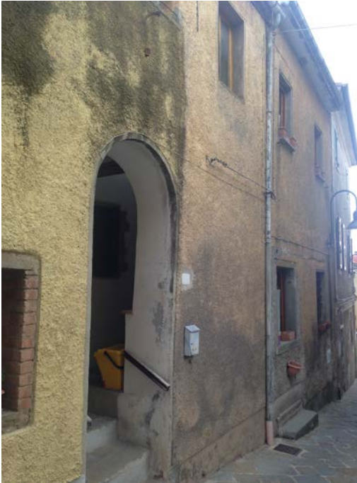
Vista ingresso su via dei Forni n.44