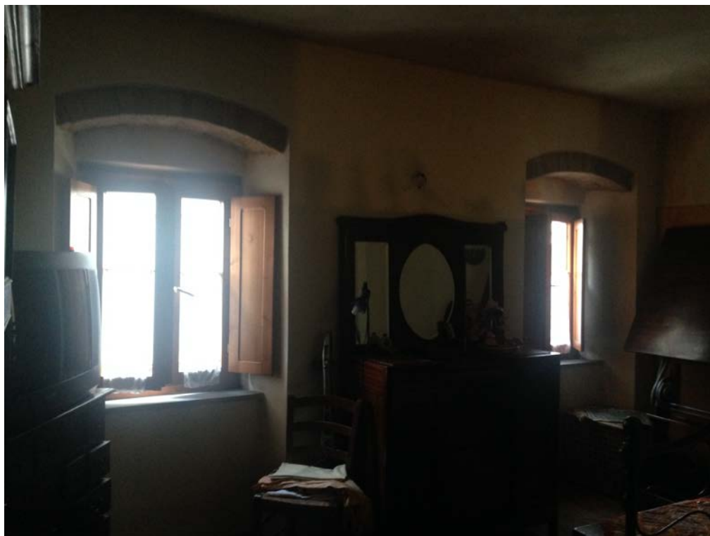
Vista 2 Camera, lato via dei Forni, piano primo.