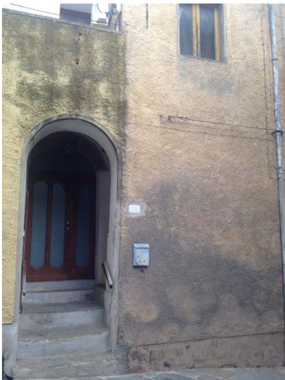
Particolare dell'ingresso dal n. civico 44 di via dei Forni