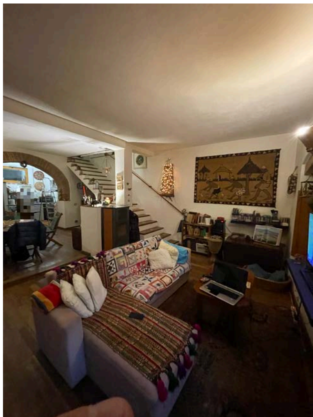
Vista dall'ingresso del soggiorno al piano terra.