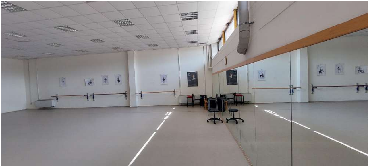
Sala attività n° 1