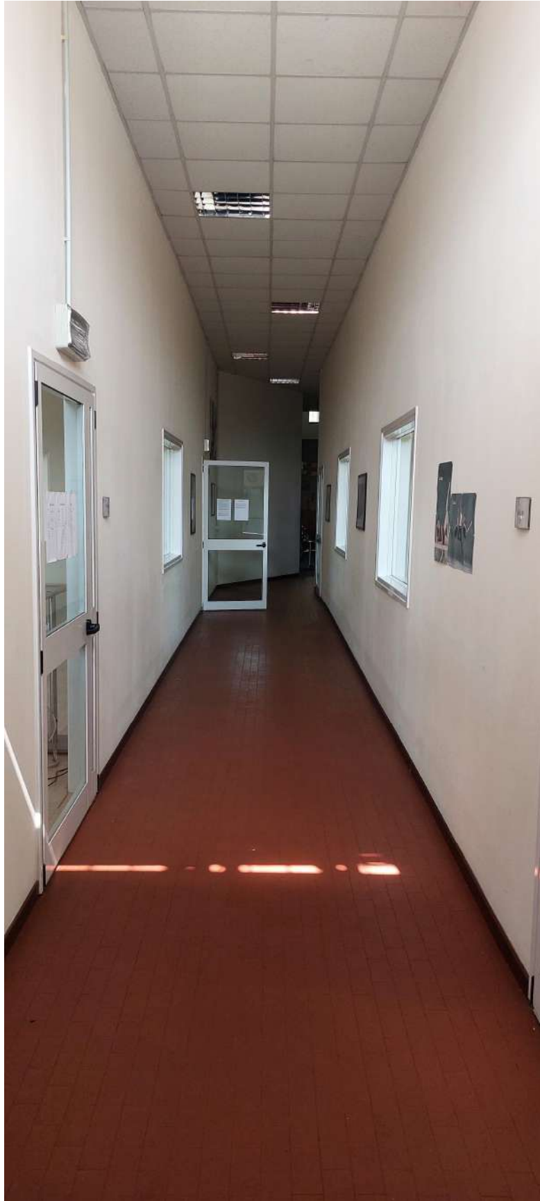
Corridoio centrale di distribuzione sale