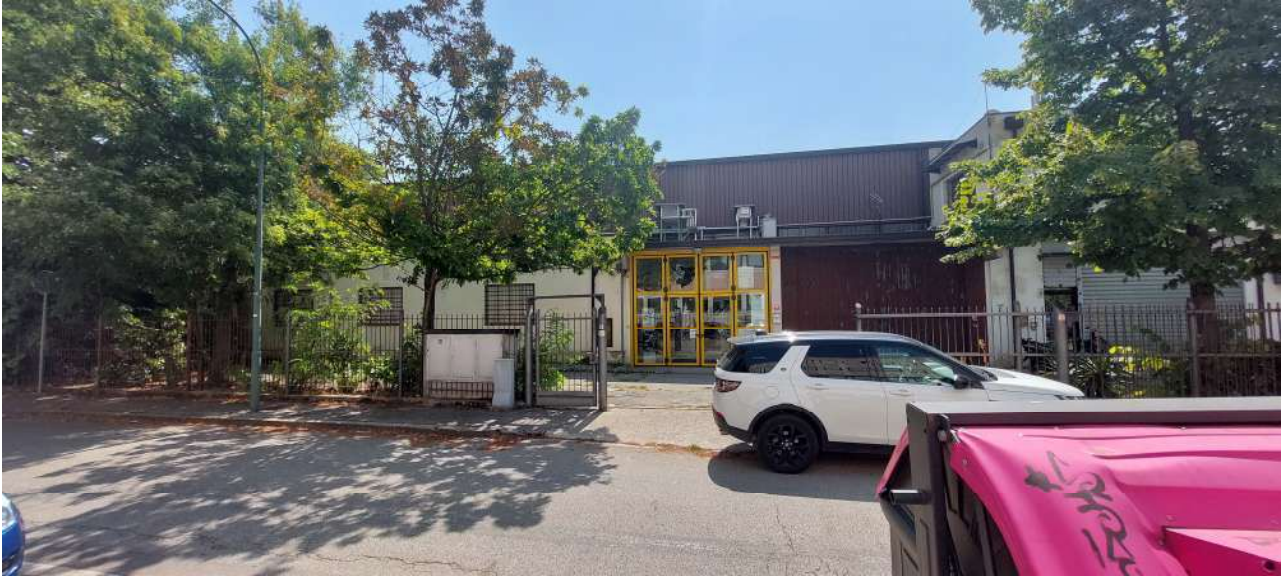
Vista dell'ingresso da Via Rosetto