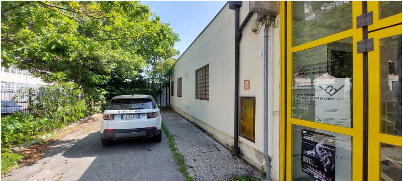
Area scoperta a uso esclusivo