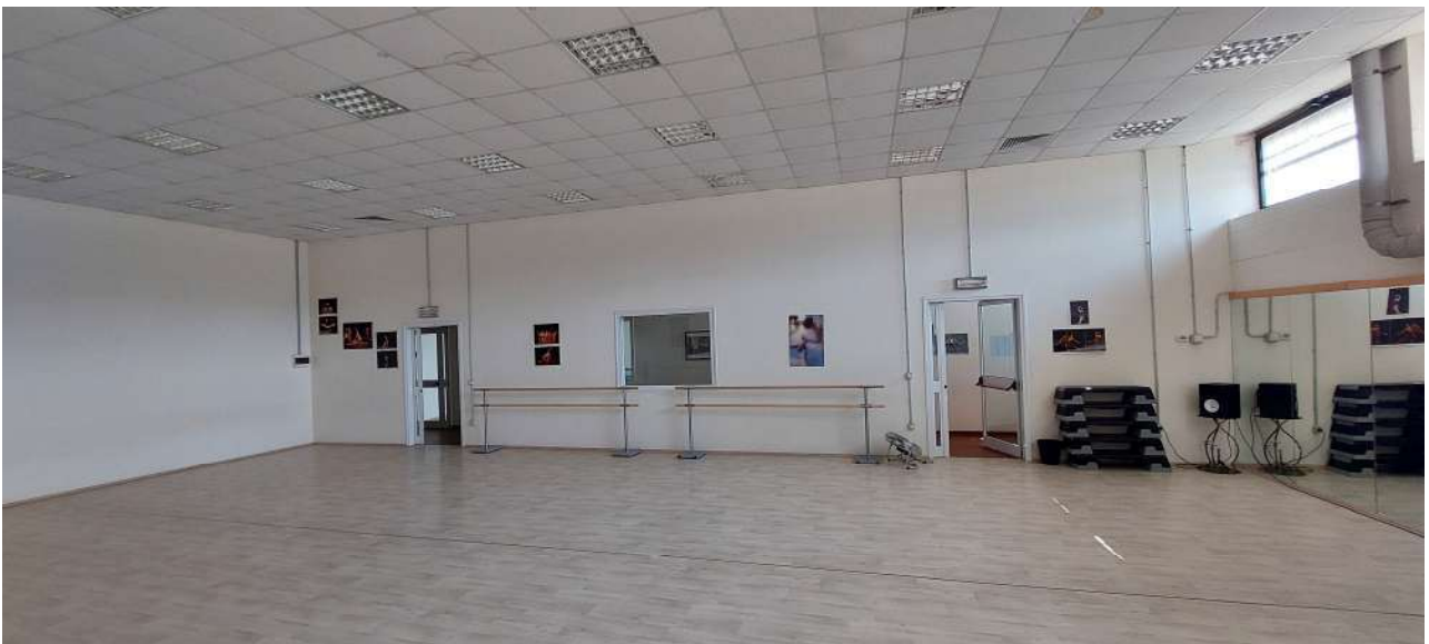
Sala attività n° 2