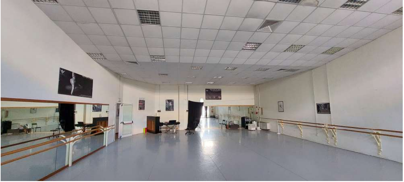
Sala attività n° 3