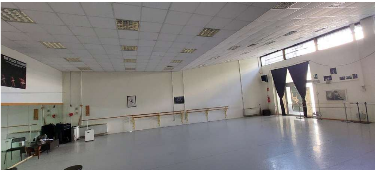
Sala attività n° 3