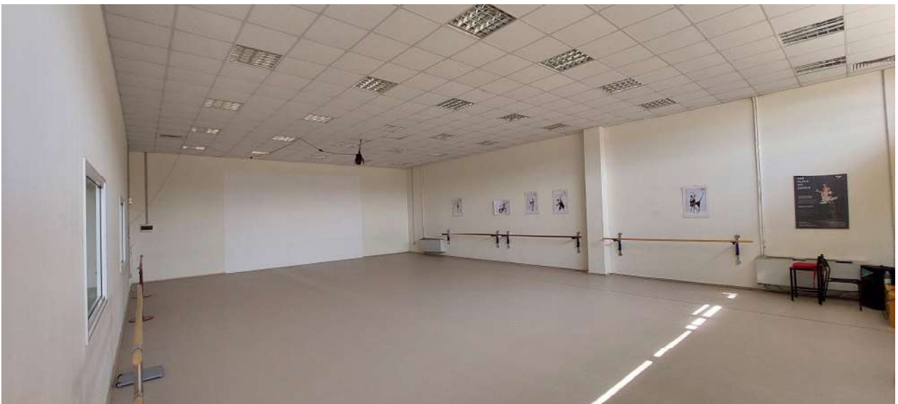
Sala attività n° 1