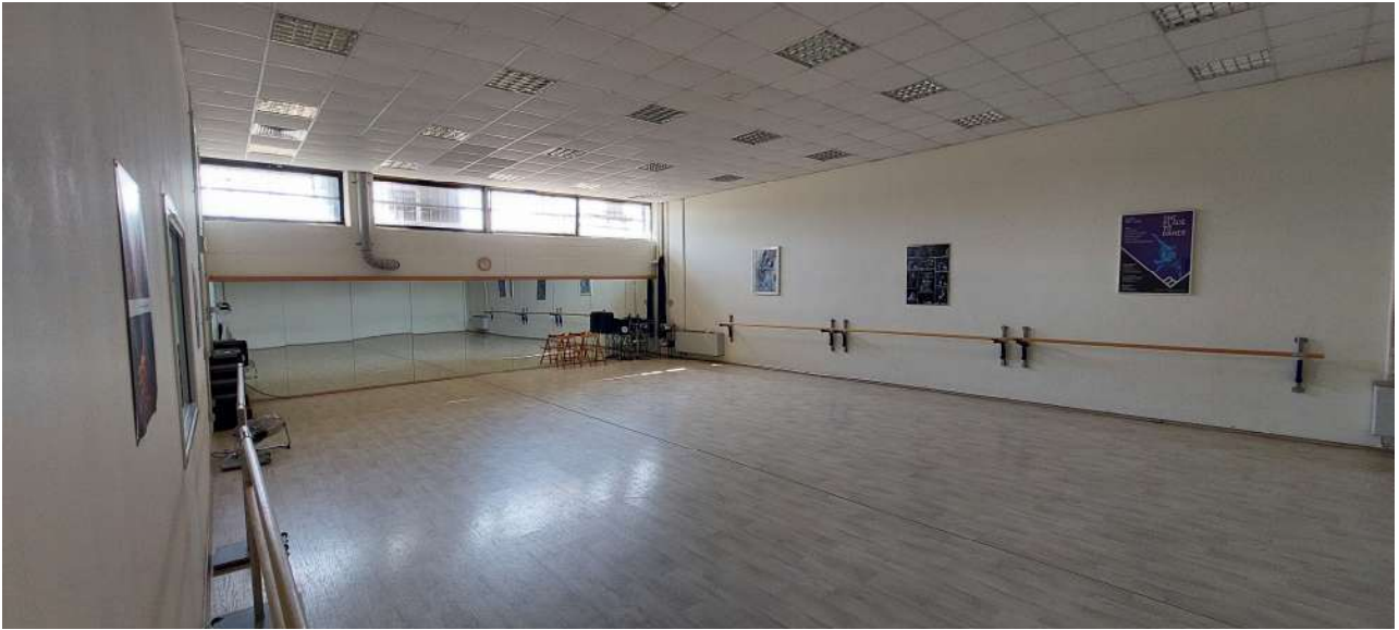
Sala attività n° 2