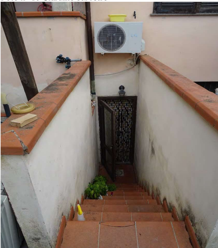
Foto n° 17 Ingresso (Particolare) al piano primo sotto strada, dal retro