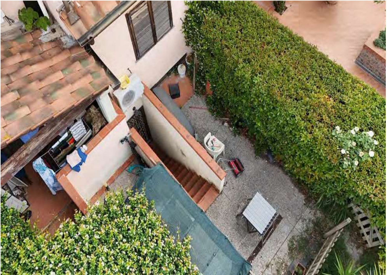
Foto n° 12 ingresso al piano primo sottostrada e al piano terra, dal retro