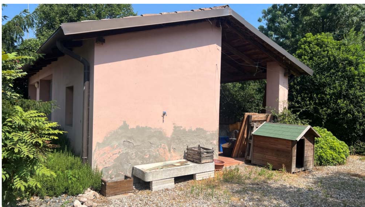
Il fabbricato accessorio