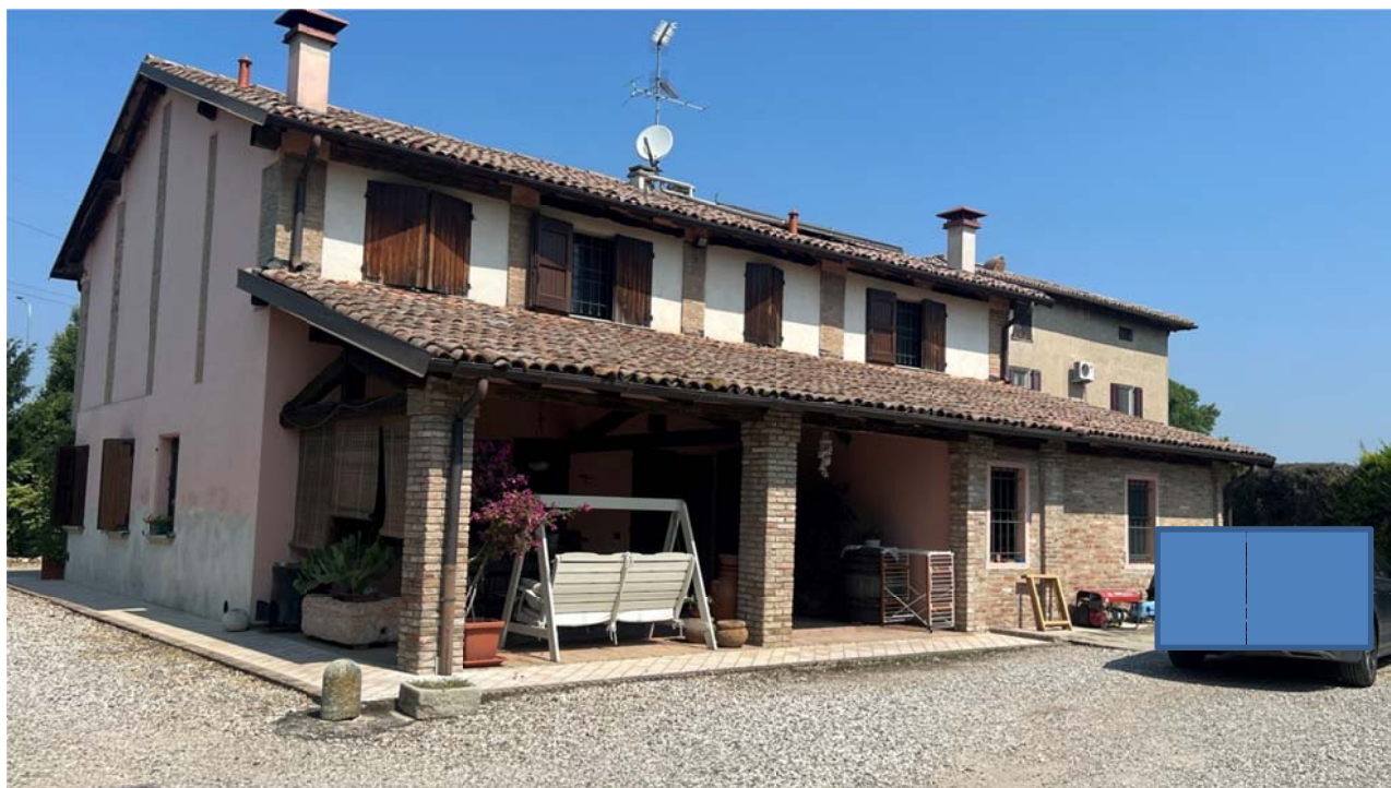
Il fabbricato principale