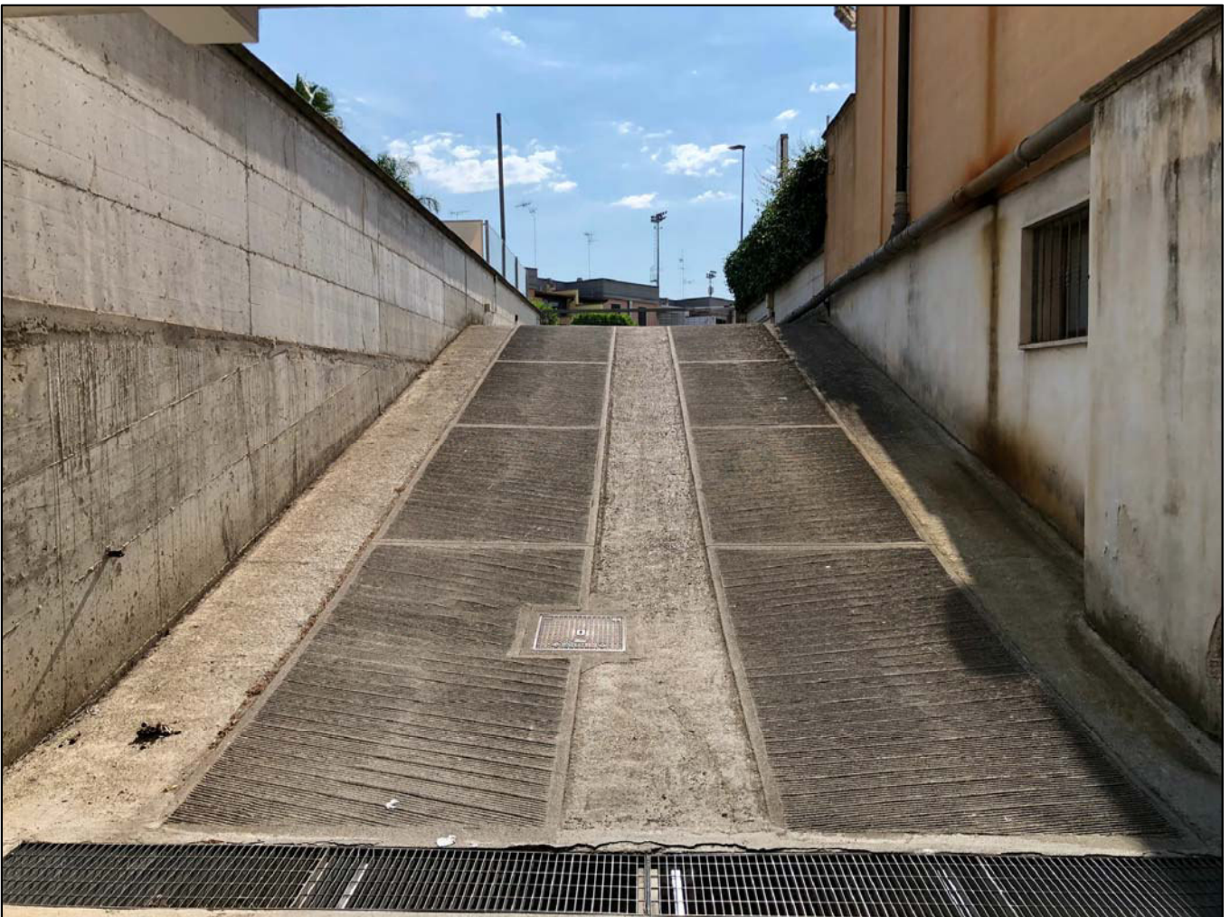
rampa di accesso al box al p. interrato