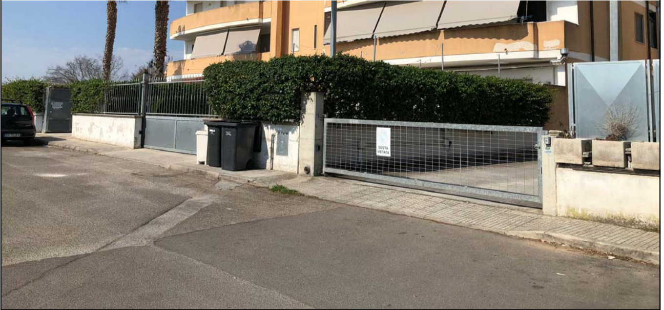
vista parziale del complesso immobiliare e dell'ingresso