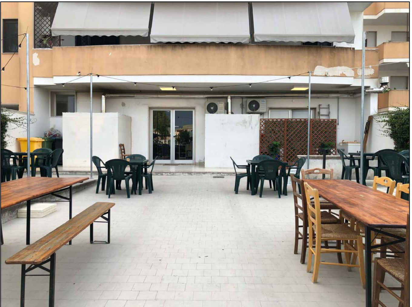
Particolare dello scoperto di pertinenza esclusiva