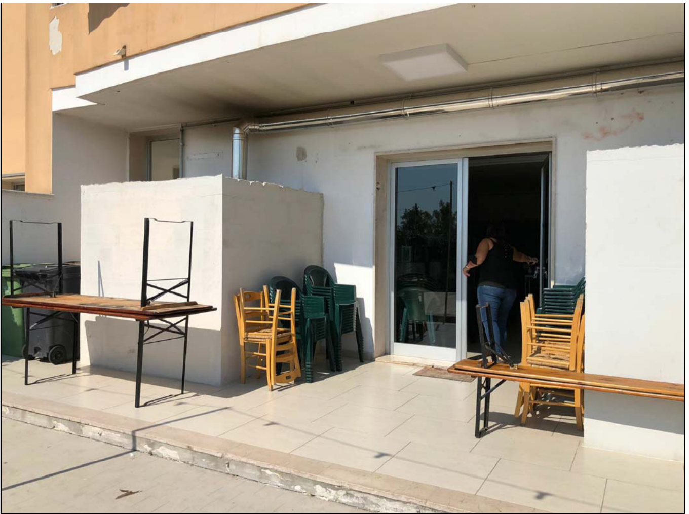
Particolare dello scoperto di pertinenza esclusiva