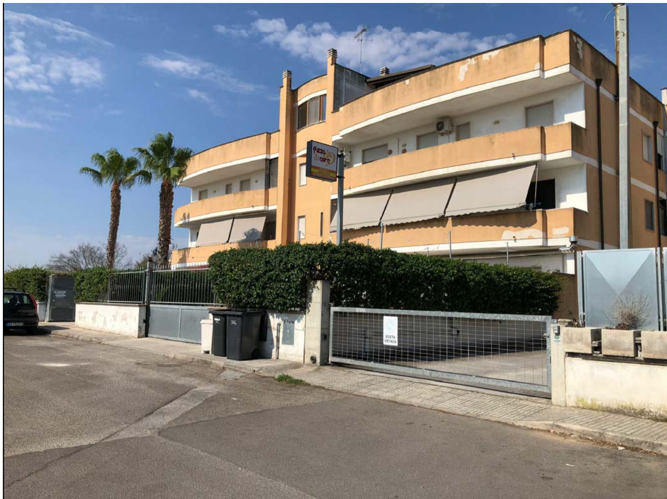
vista parziale del complesso immobiliare