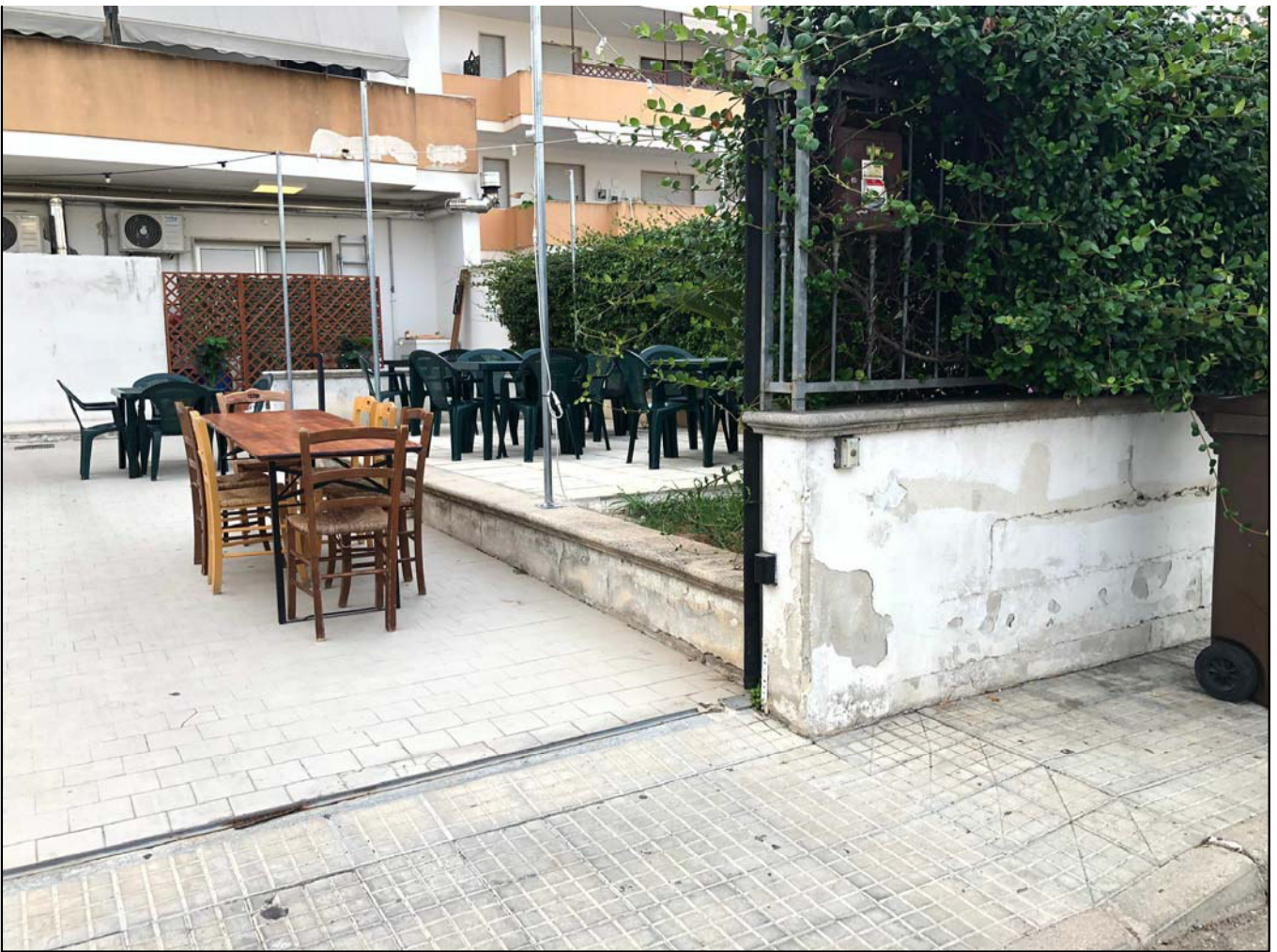
Particolare dello scoperto di pertinenza esclusiva