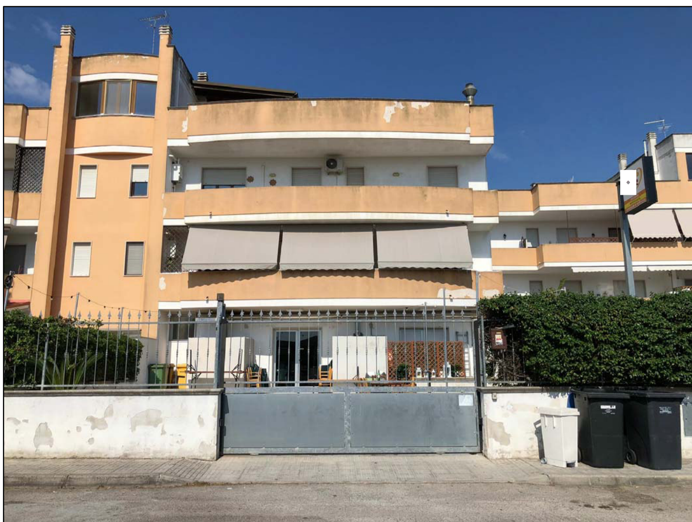
vista del locale commerciale posto a piano terra del complesso immobiliare