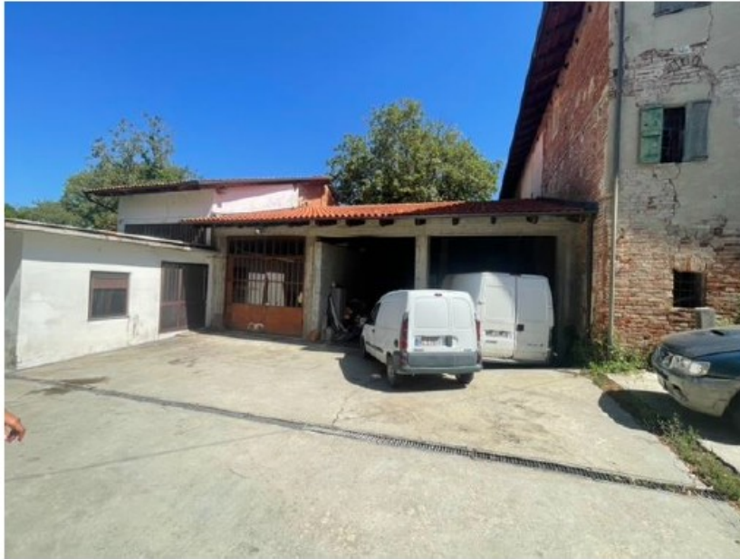
Fig. 1 Accesso a Rico Automezzi–Tettoia cortile retro di Via S Lucia n.18