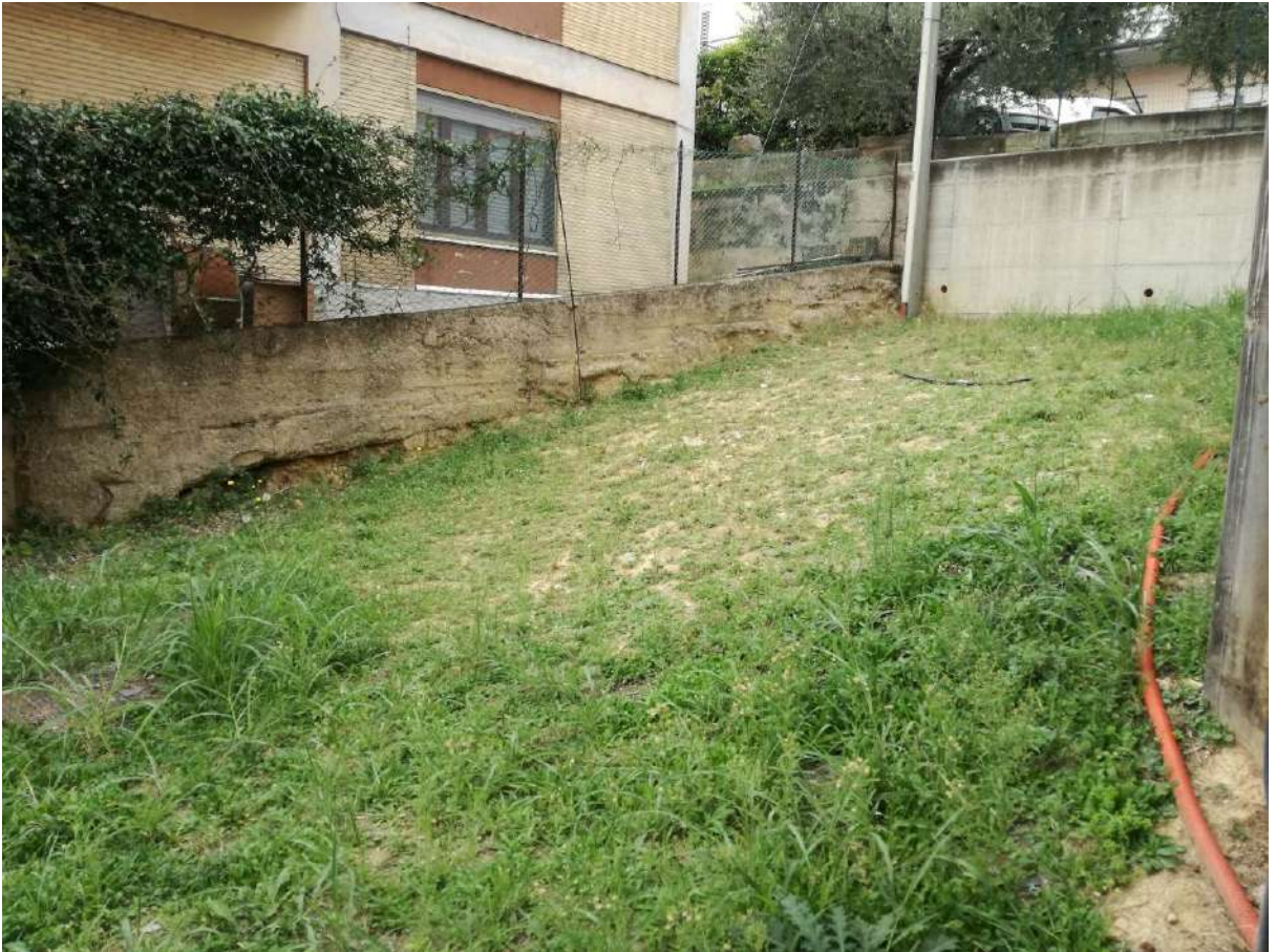
(corte esclusiva comune alle cantine sub35)