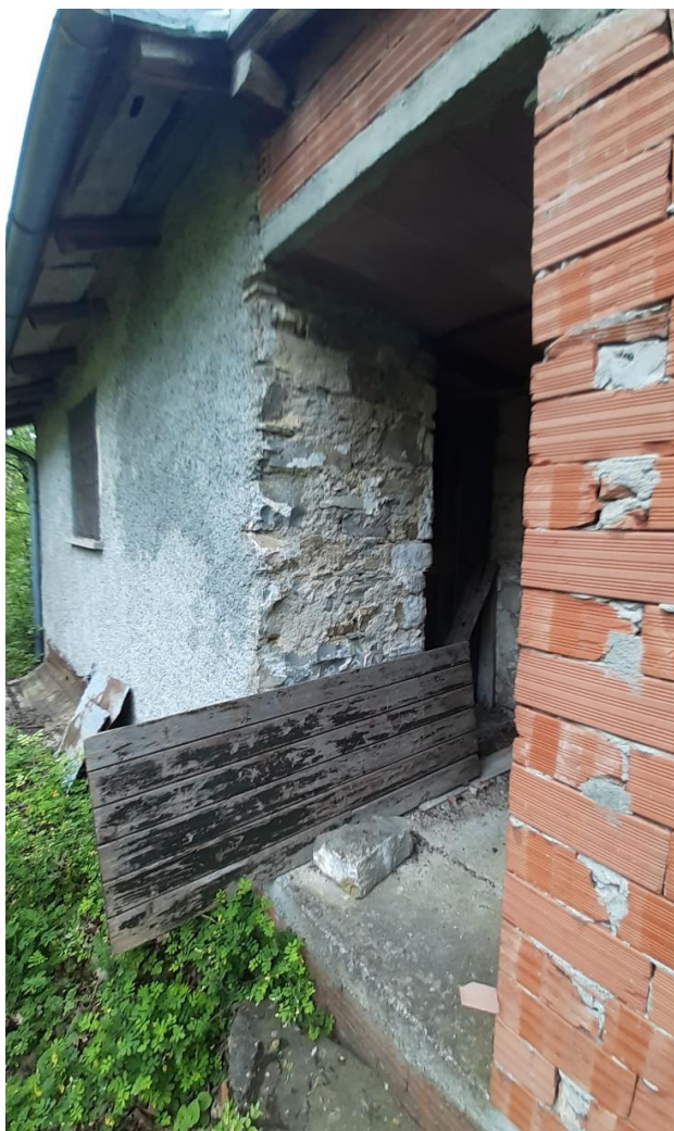
Ingresso al piano superiore