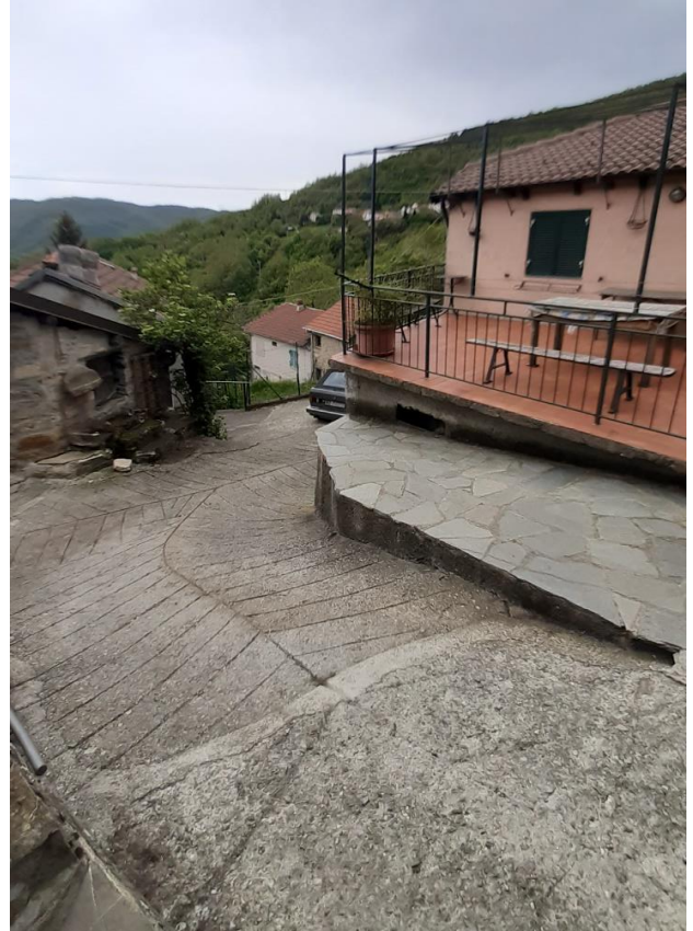
Inbocco della strada dalla fine del paese