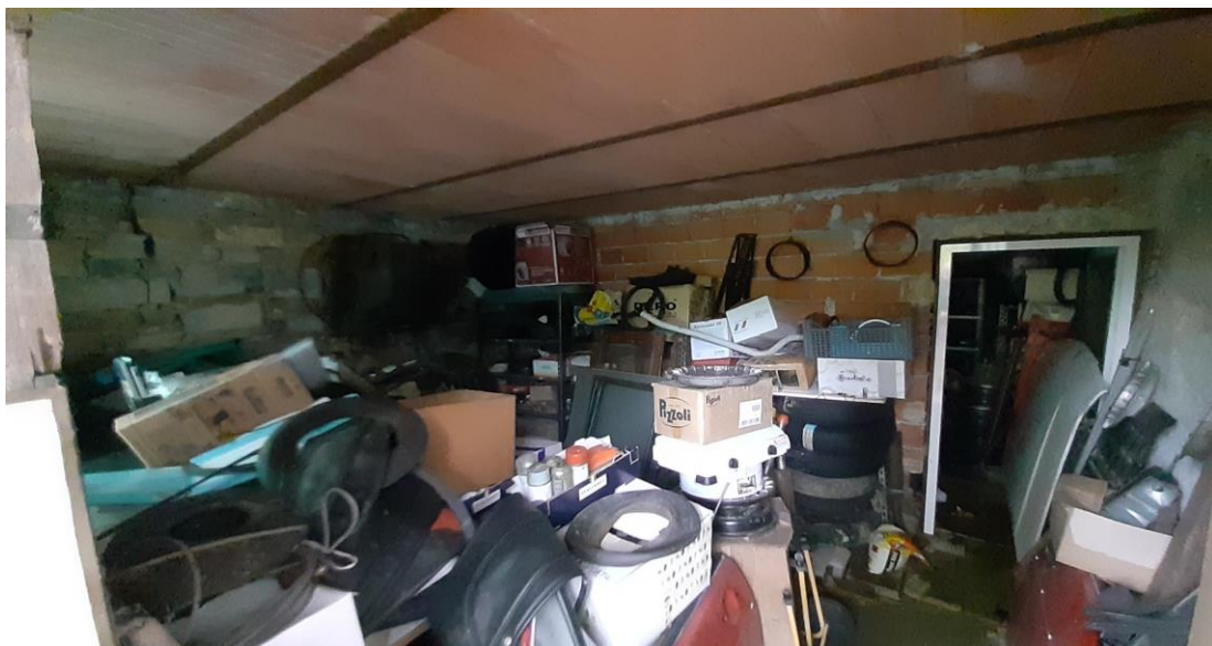
Interno del Piano seminterrato