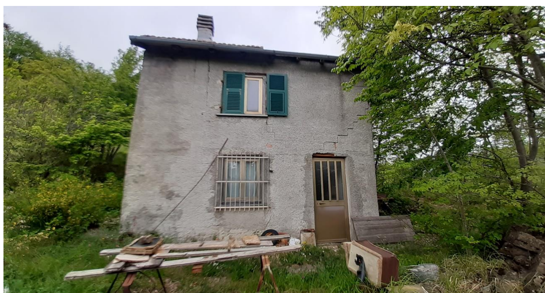
Vista principale dell'abitazione Pagina 2