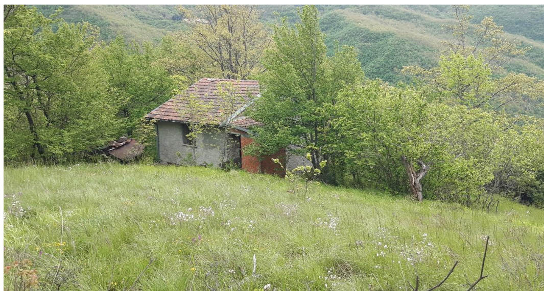
Il fabbricato all'interno della proprietà - vista da monte