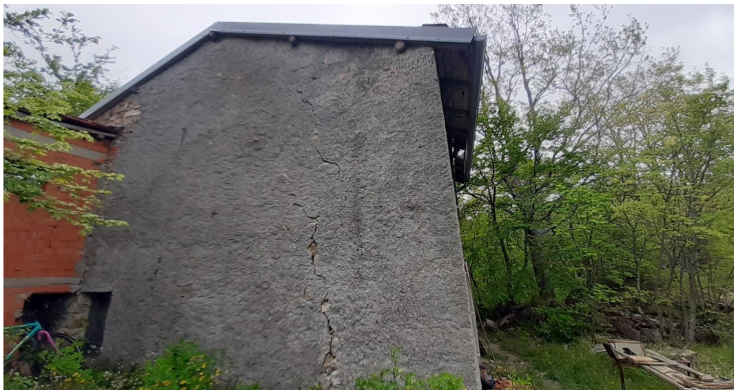
Vista del fabbricato con evidenti problemi strutturali