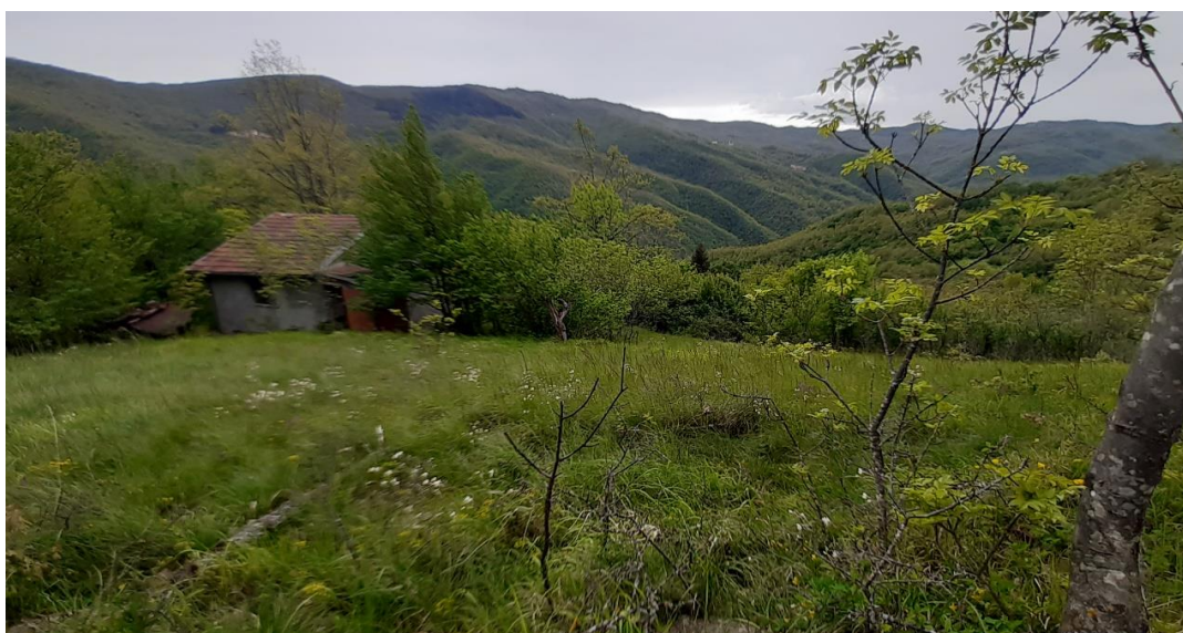
Il terreno (particella 133) adiacente al fabbricato