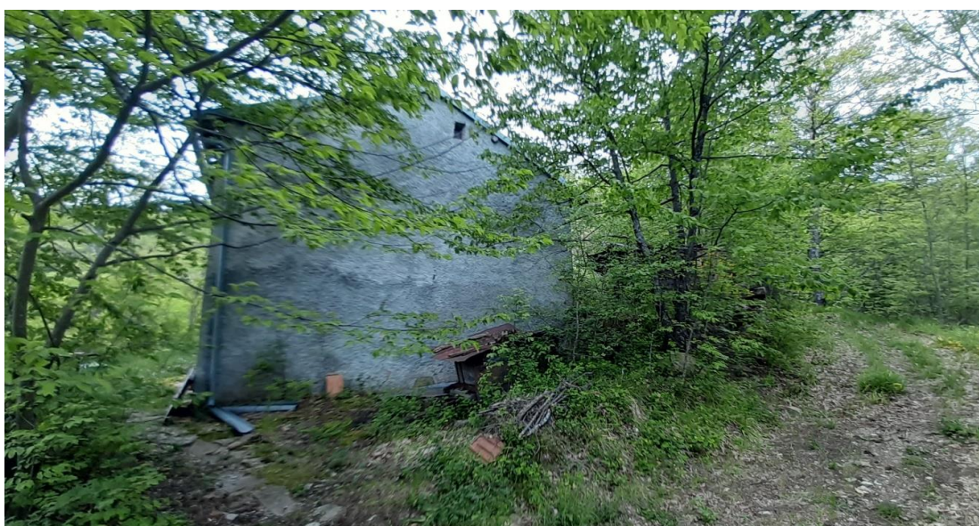
Il fabbricato sul punto di arrivo dalla strada