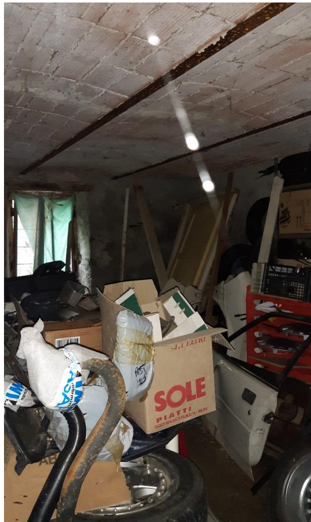
Vista di un interno