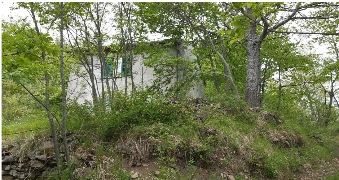
Punto di arrivo alla proprietà