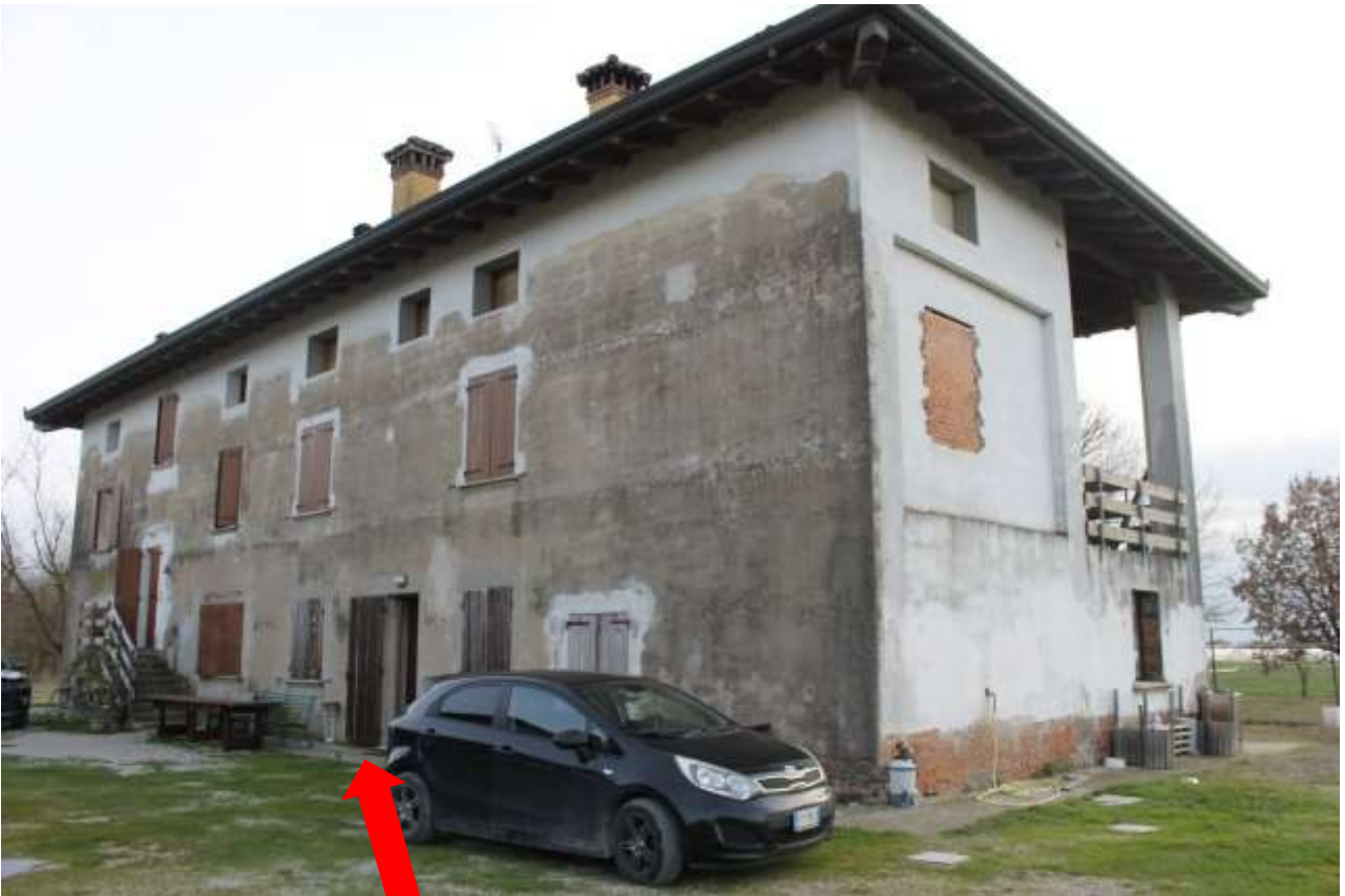
INGRESSO ALLOGGIO ABUSIVO