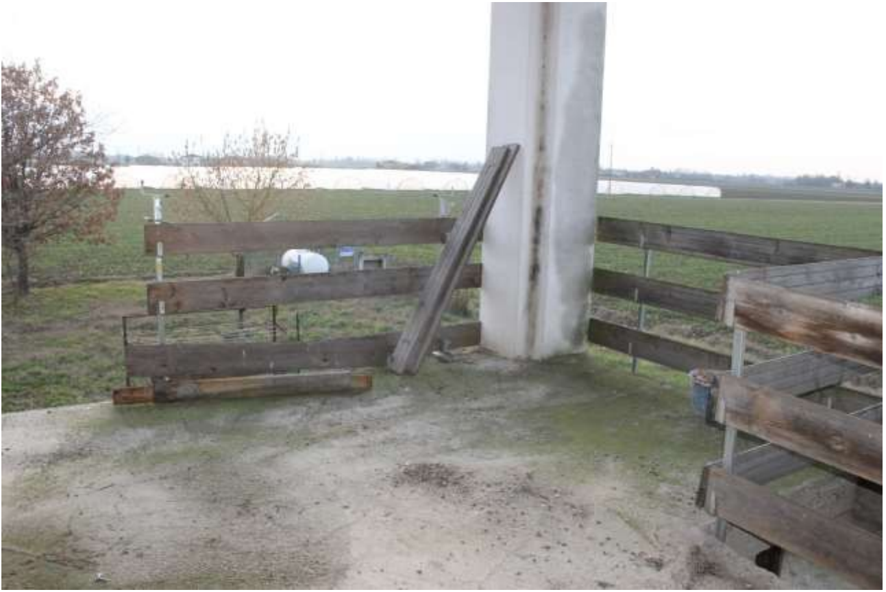
IMMOBILE DA DEMOLIRE