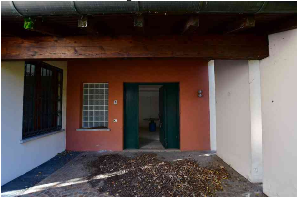
1. Ingresso principale villa.