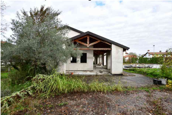
1. Prospetto sud.