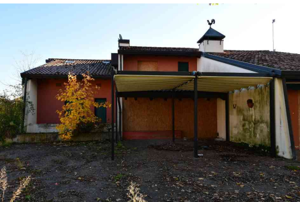
5. Prospetto ovest, pompeiana (1 di 2).