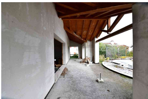
6. Portico, vista verso nord.

Riferimento per l'individuazione dei vani : allegato grafico n. 3 – rilievo stato di fatto.