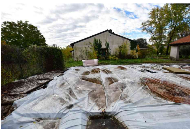
6. Vista verso sud.

Riferimento per l'individuazione dei luoghi: allegato grafico n. 3 – rilievo stato di fatto.