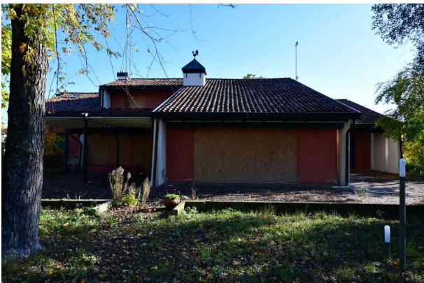
3. Prospetto ovest (1 di 2).