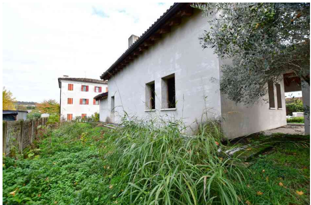
4. Prospetto ovest – area T.