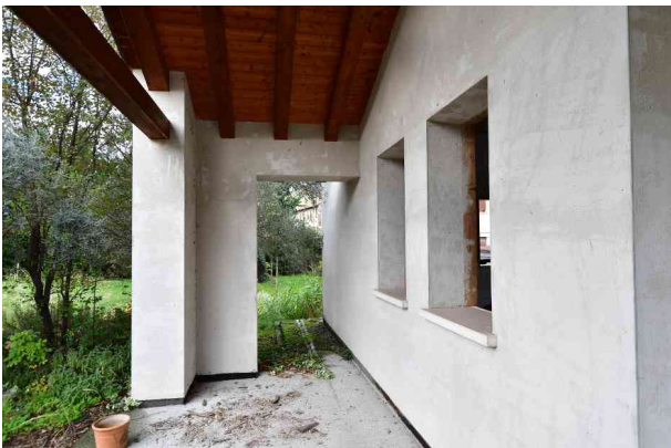
3. Portico, vista verso ovest.