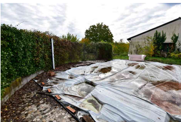
5. Vista verso sud est.