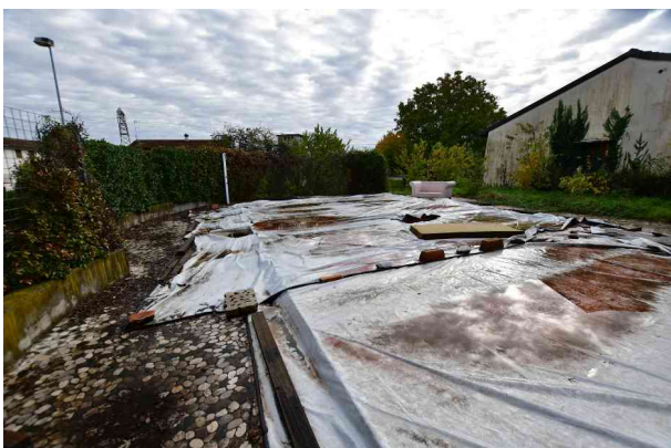
4. Vista verso est, lato nord (2 di 2).