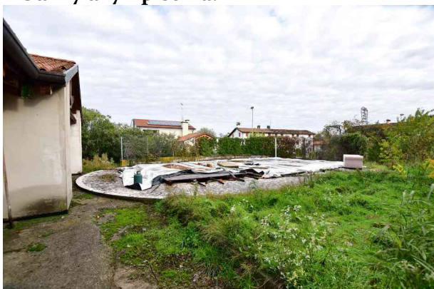
1. Vista verso nord est.