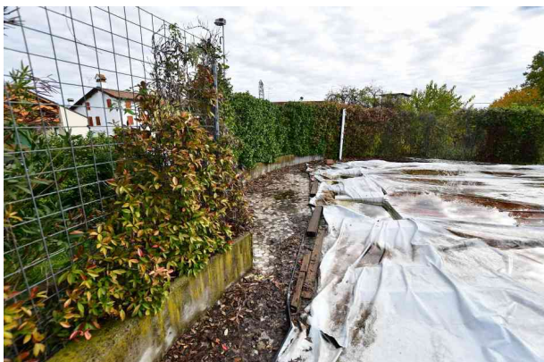
3. Vista verso est, lato nord (1 di 2).