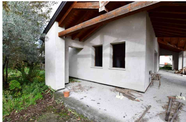
2. Portico a sud.