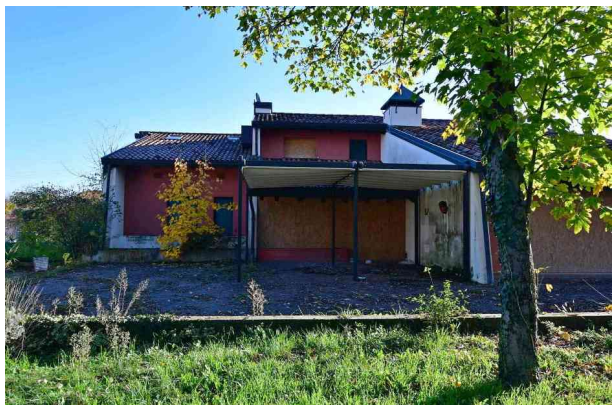
4. Prospetto ovest (2 di 2).