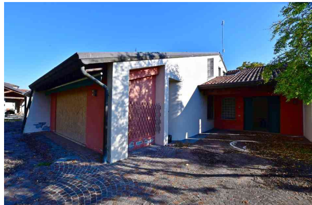
2. Prospetto sud ovest – ingresso principale.