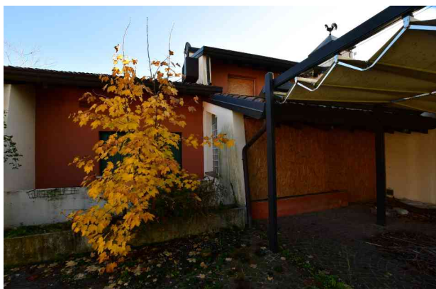
6. Prospetto ovest, pompeiana (1 di 2).