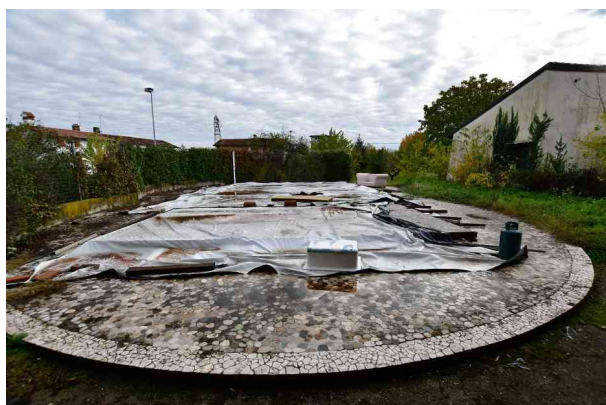
2. Vista verso est.