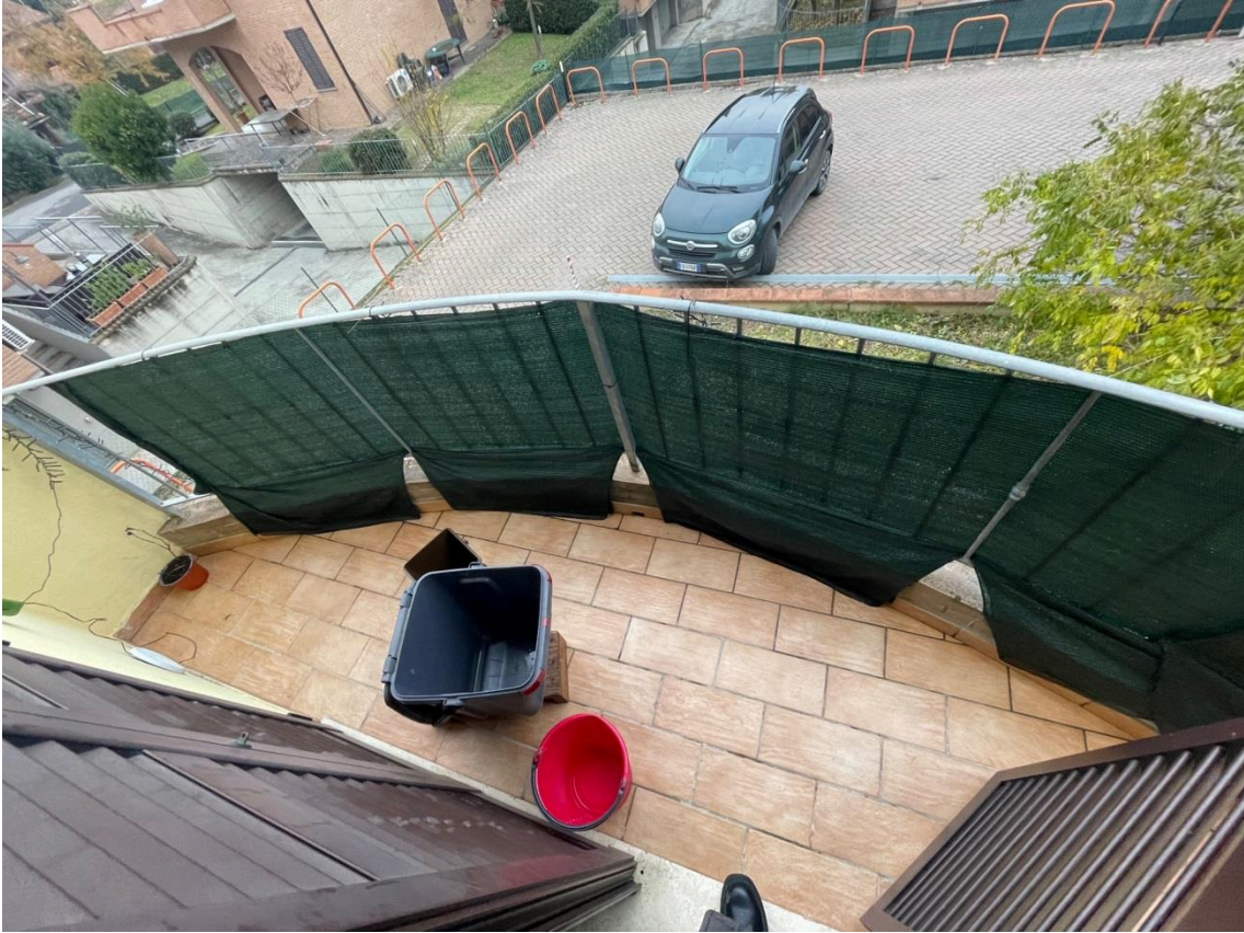
Vista balcone a servizio del soggiorno/K