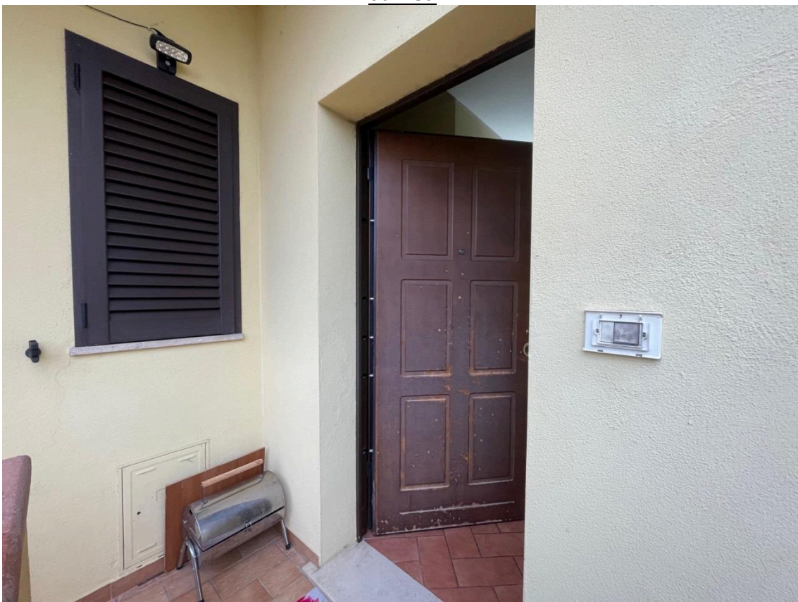
Vista ingresso appartamento sub 39 p.t