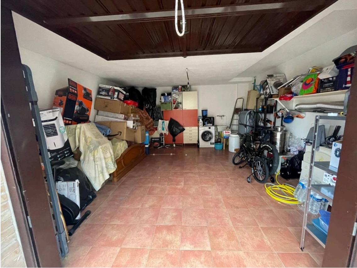
Vista interno garage