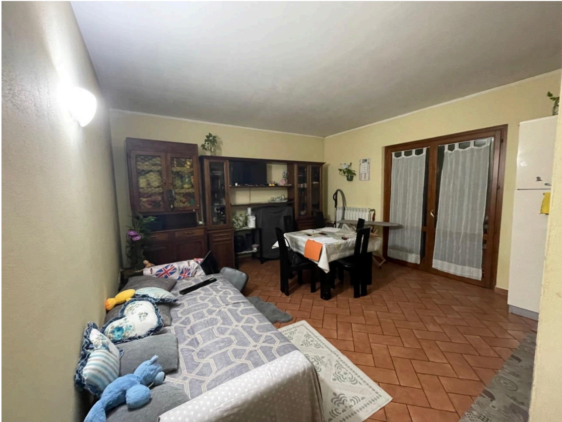
Vista ingresso/soggiorno- pranzo con p.k