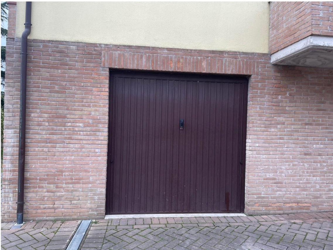
Vista accesso garage p.1s