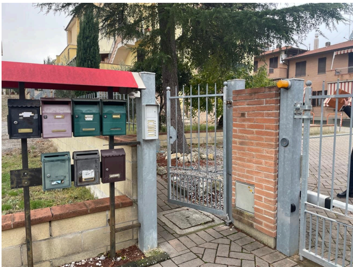
Vista cancello d'ingresso a comune