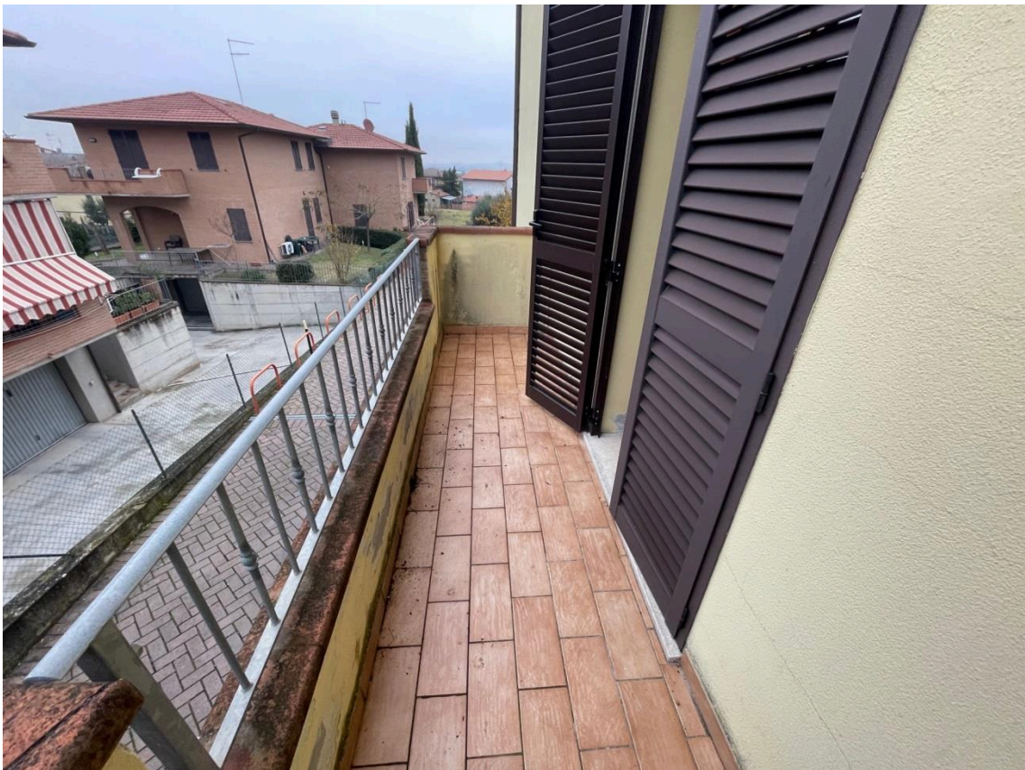
Vista balcone a servizio della camera