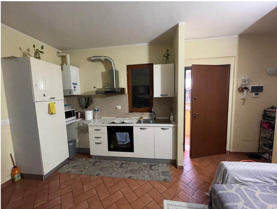
Vista punto K