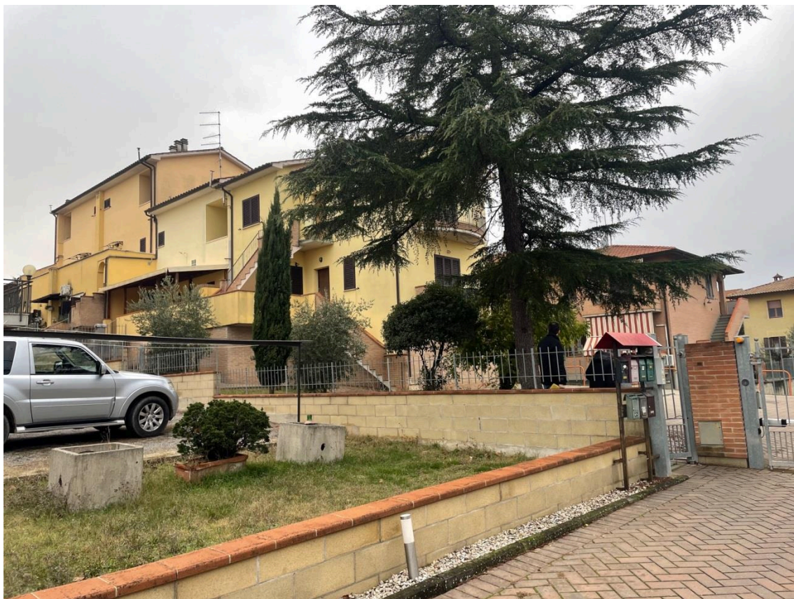
Vista fabbricato ospitante le unità immobiliari oggetto di pignoramento