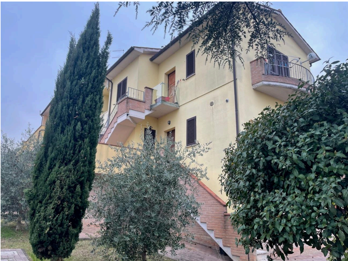
Vista edificio ospitante le u.i.u. oggetto di esecuzione