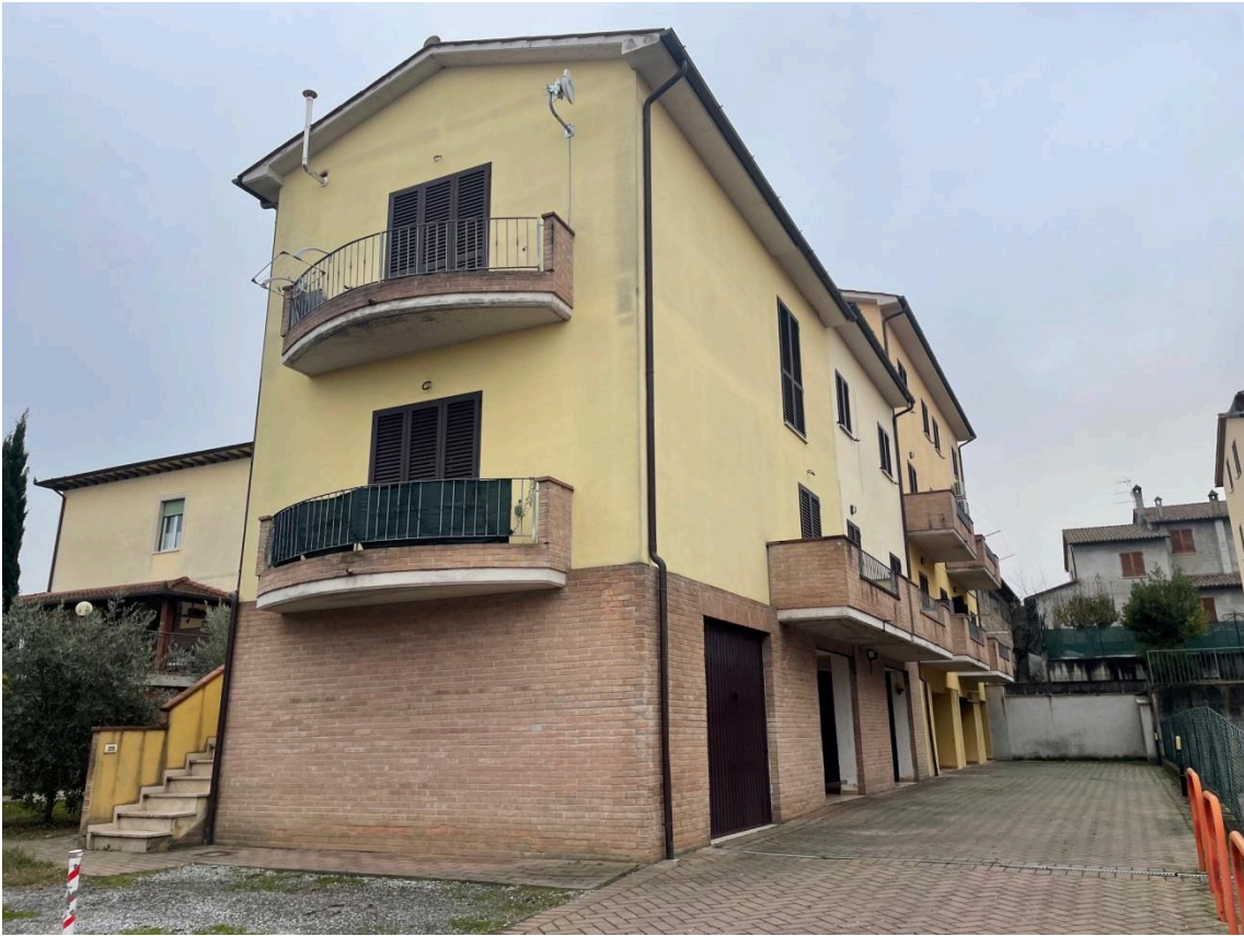
Vista edificio ospitante le u.i.u. oggetto di esecuzione