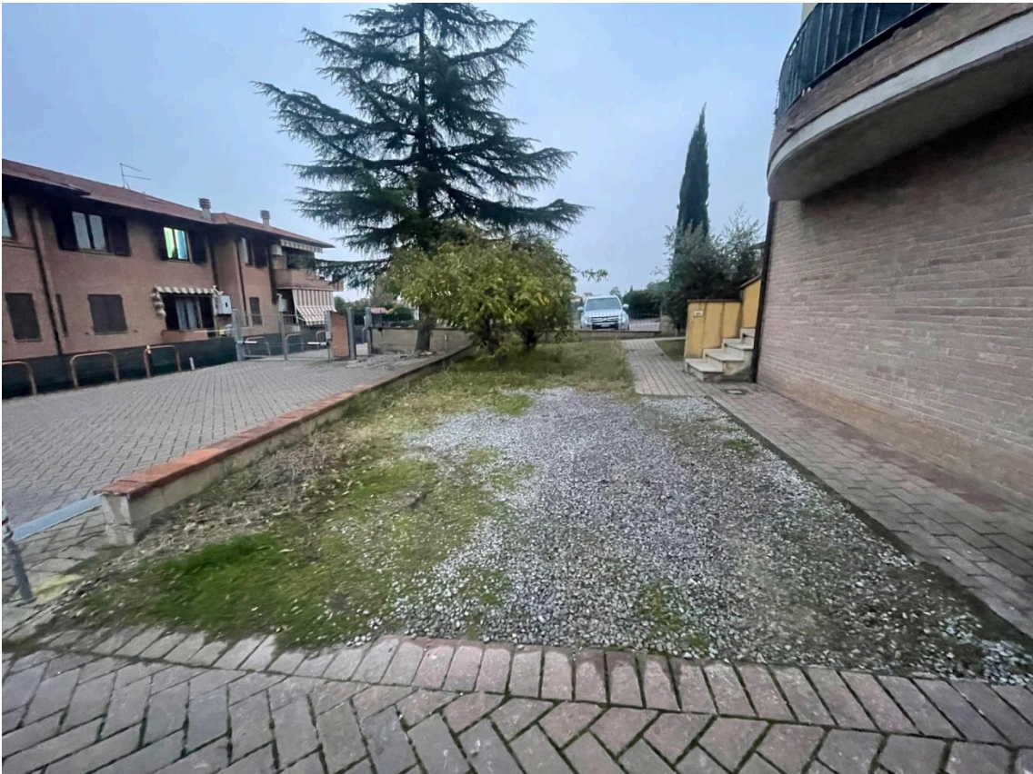
Vista resede sub 35