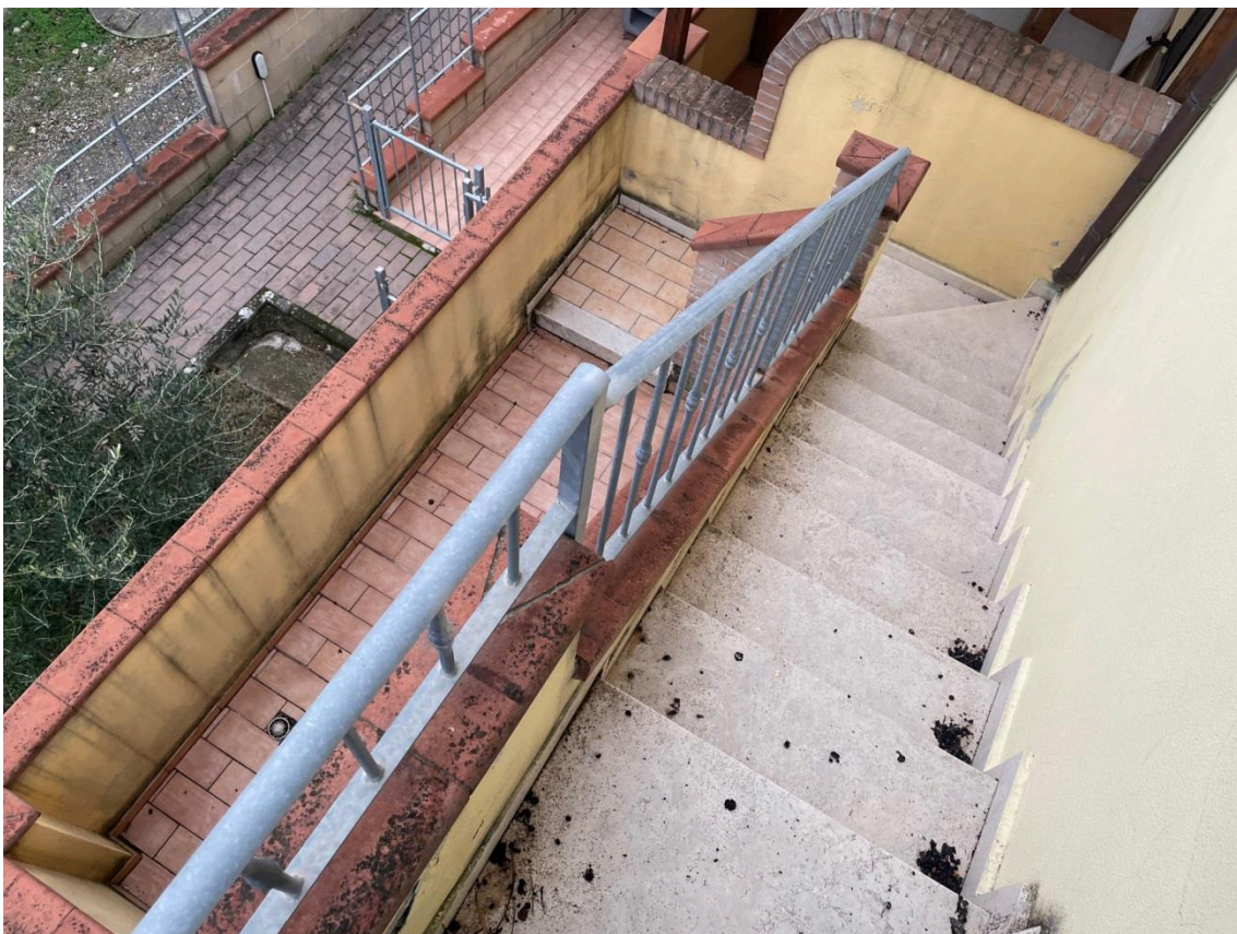
Vista sub 43 (bcnc a servizio del sub 39 e 40) rampa di scale per accesso ai n.2 appartamenti