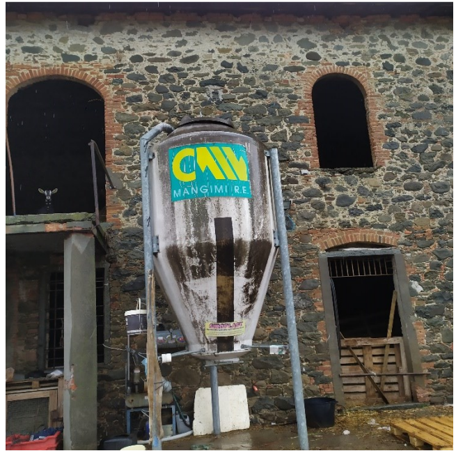
FIENILE – PIANO PRIMO