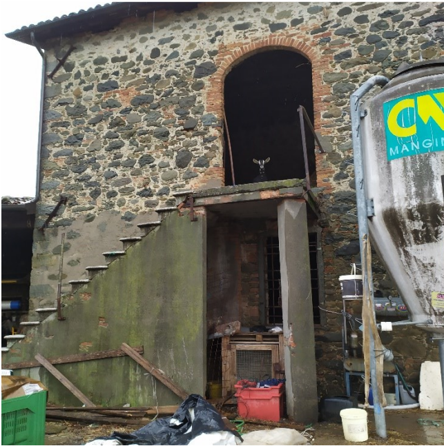
STALLA - PIANO TERRA