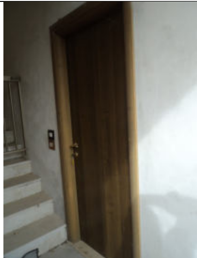
Ingresso abitazione n. 3 P1