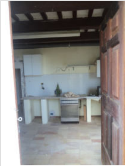
Soggiorno-cucina abitazione n. 6 P1