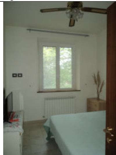
Camera abitazione n. 3 P1