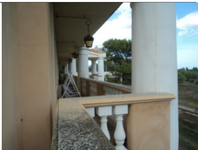
Ballatoio Esterno fabbricato principale P1