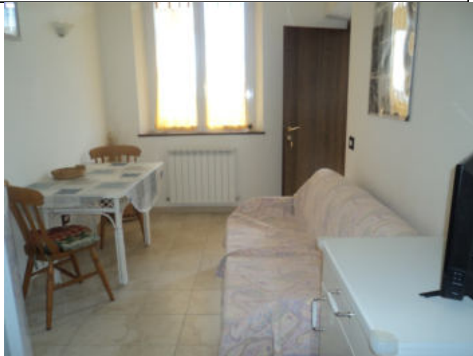
Soggiorno-pranzo abitazione n. 3 P1