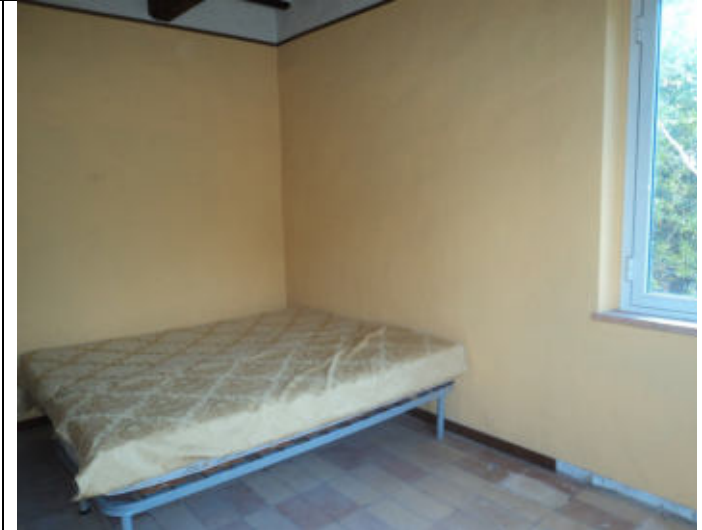
Camera abitazione 6 P1