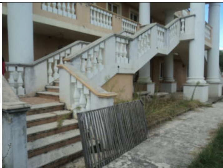
Scala Esterna fabbricato principale