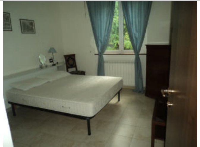
Camera abitazione n. 3 P1