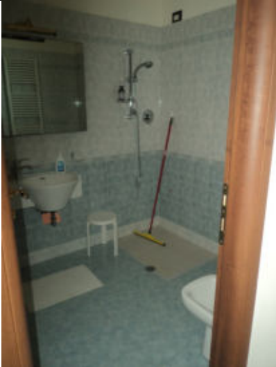
Bagno abitazione n. 3 P1