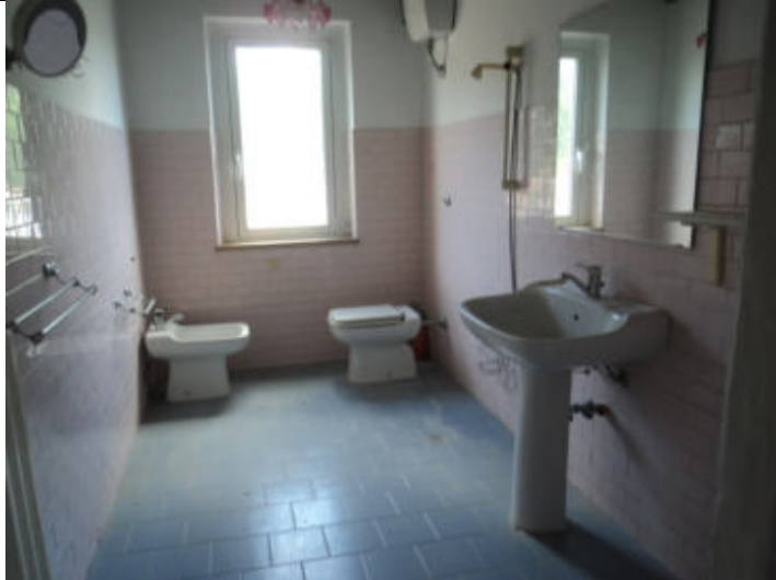
Bagno abitazione n. 6 P2