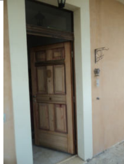
Ingresso abitazione n. 4 P1