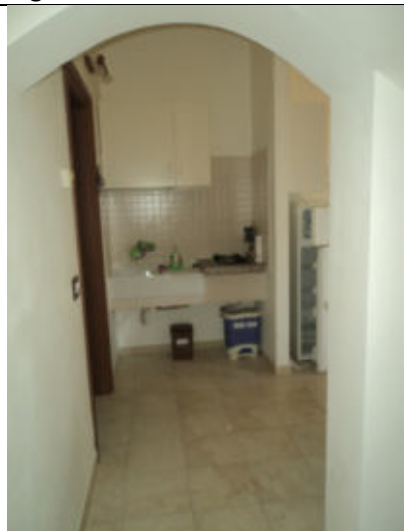
Cucina abitazione n. 3 P1