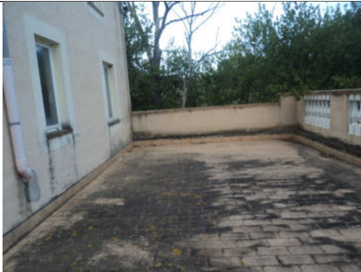
Terrazza esclusiva abitazione n. 6 P1