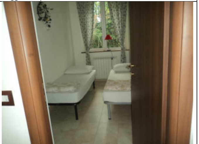
Camera abitazione n. 3 P1