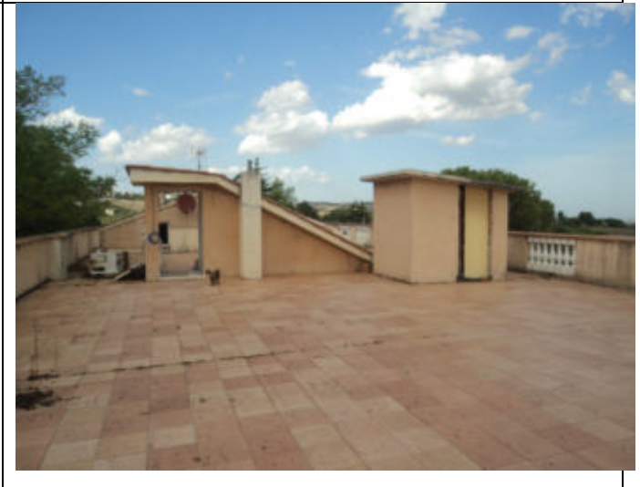
Terrazza di copertura P2 Ascensore e scala