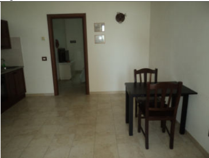
Cucina-pranzo abitazione n. 3 P1