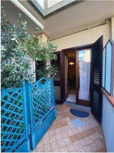
Prospetto principale su corte lato mare costituito da una porta/balcone e una finestra al P.T.