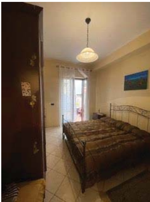
Camera da letto uso doppio