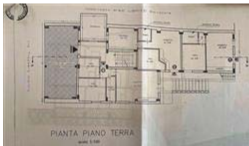
Planimetria appartamento N. 2 posto al P.T. depositata all'U.T.