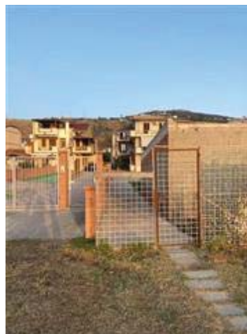
Ingresso lato mare all'unità abitativa posta al P.T. dal lungomare Luciano Ligabue