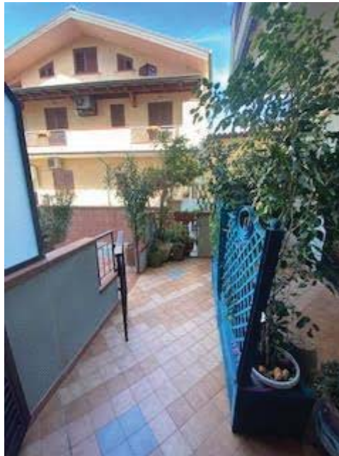
Corte esterna lato mare di accesso all'unità abitativa N. 1 e 2