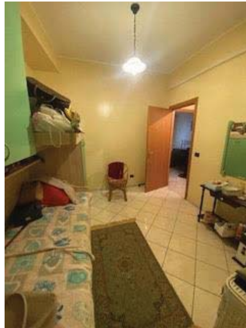
Camera da letto uso singolo