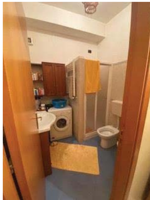
Servizio igienico - lavanderia