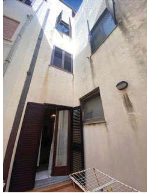
Chiostrina interna ad uso esclusivo