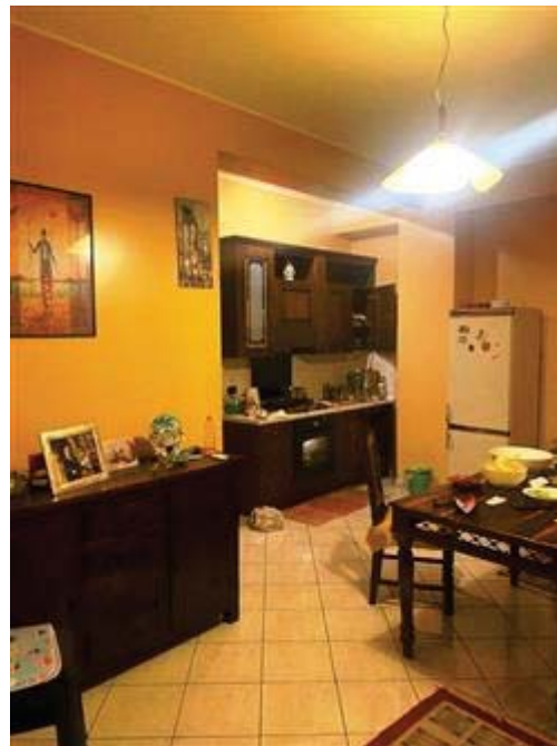
Soggiorno -pranzo -angolo cottura