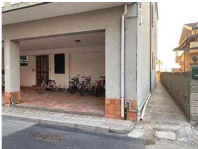
Ingresso lato monte all'unità edilizia N. 2 sita al P.T. mediante via Trazzera Marina

L'intero edificio sviluppa 4 piani, 4 piani fuori terra, . Immobile costruito nel 2003 ristrutturato nel 2004.