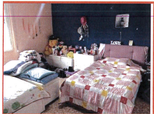
Foto 10 - Camera da letto singolo.

Bene n.2 – Foglio 5 particella 456 – Terreno agricolo ricadente nel P.R.E.: