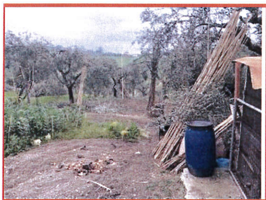
Foto 3 - Terreno particella 456.