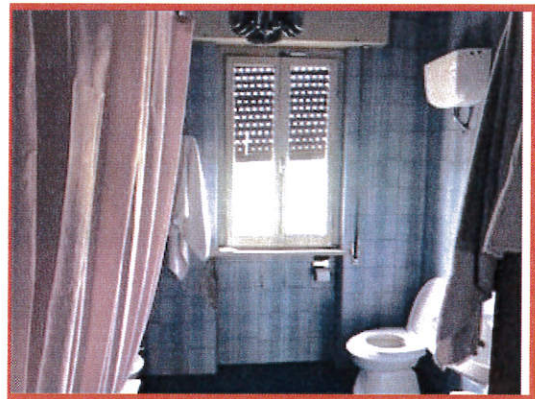
Foto 8 - Bagno principale.