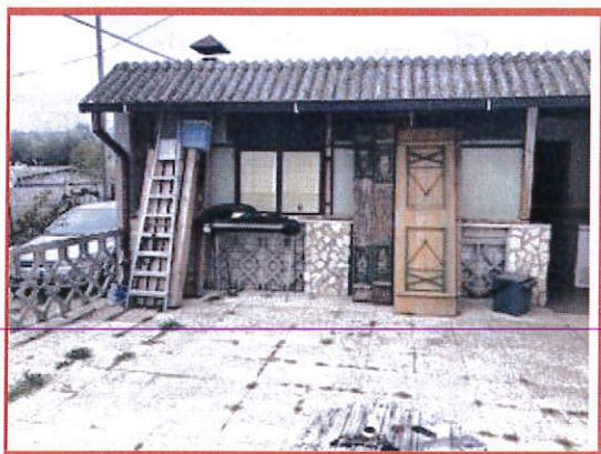
Foto 1 - Lato esterno fabbricato.

Bene n.3 - Terreno agricolo distinto al foglio 5 particella 539 (Cfr. Foto4).