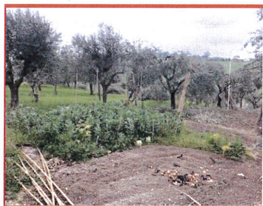
Foto 4 - Terreno particella 539.

In data 30 marzo 2023 hanno avuto avvio le operazioni di accesso e di sopralluogo agli immobili costituenti il compendio pignorato alla presenza delle seguenti persone: