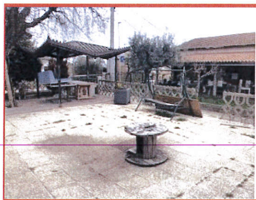
Foto 2 - Panoramica cortile.