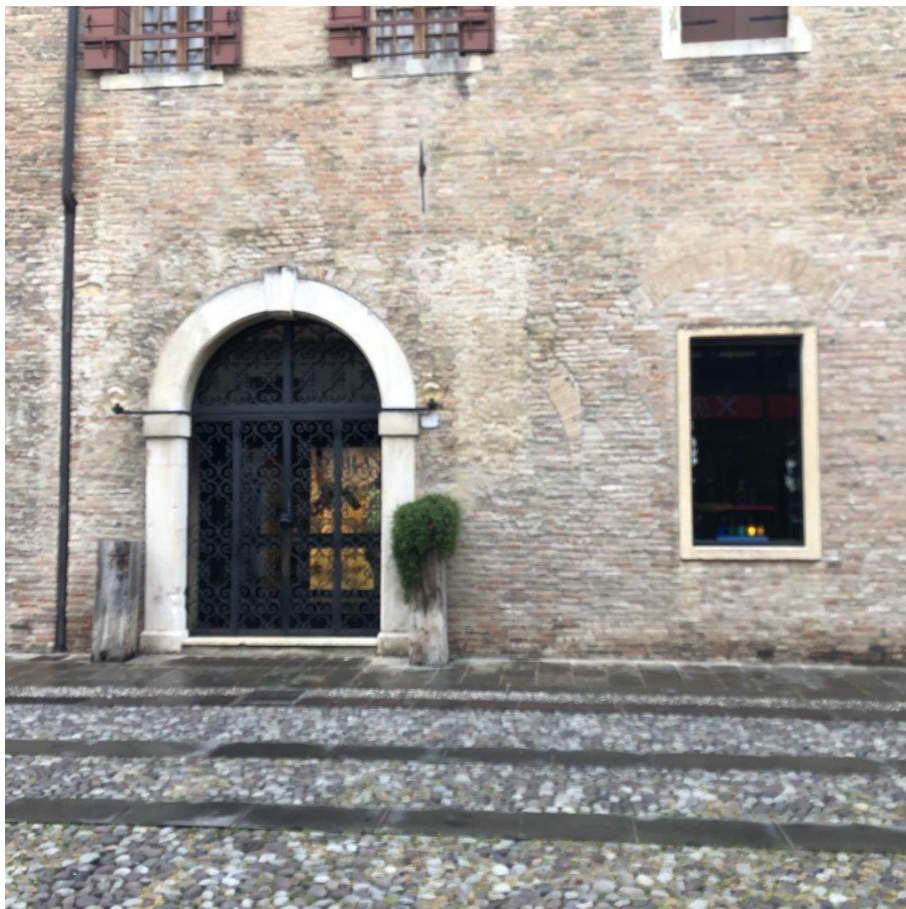
foto n. 4 – particolare facciata nord con accesso al negozio (la finestra è di altra u.i.)