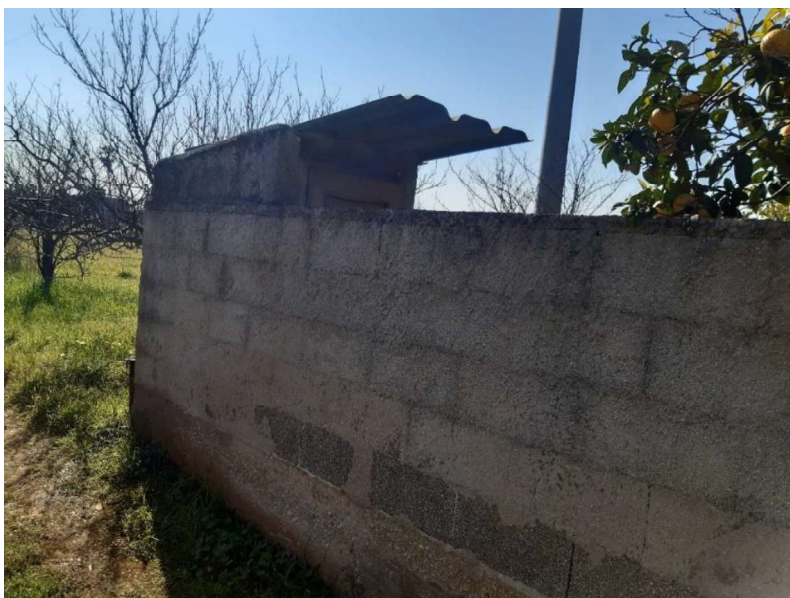
Corpo n.2 – Immobile da Demolire