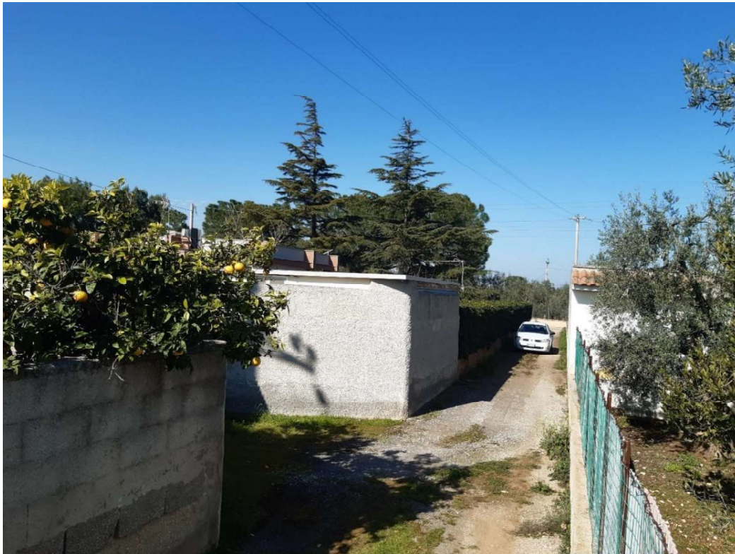
Corpo n.1 – Immobile da Demolire

Isritto Collegio dei Geometri della Provincia di Barletta Andria Trani n. 291 Consulente Tecnico d'Ufficio del Tribunale di Trani n. 218 Isritto nell'elenco del Ministero dell'Interno di Professionisti Antincendio di cui al D.M. 05/08/2011 Codice di Abilitazione BT00291G00066 Via Istria n. 49/b – 76125 – Trani Tel/fax 0883/957636 – 347/6216082 email enricogarro33@gmail.com pec enrico.garro1@geopec.it