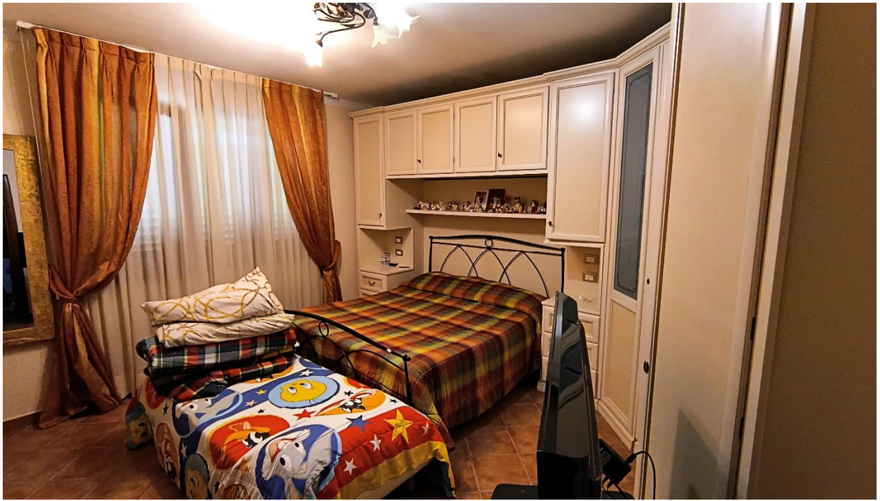
Vista prima camera