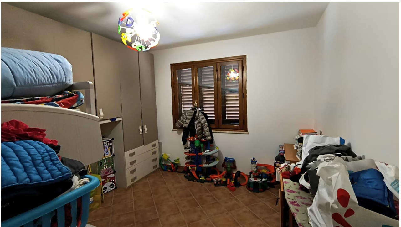
Vista seconda camera