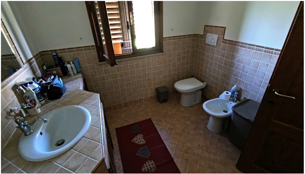
Vista primo bagno