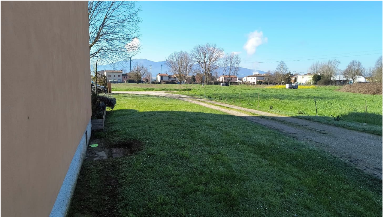
Vista parte terreno verso sud-ovest