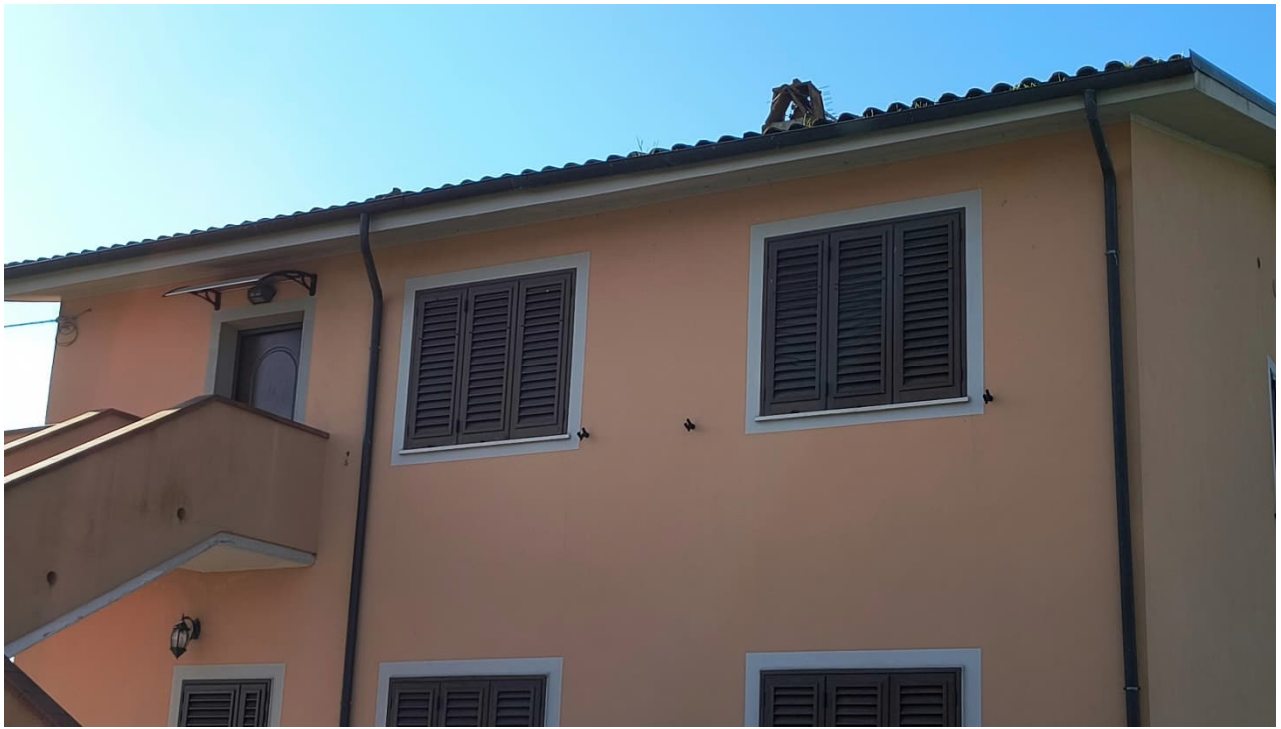
Vista da nord