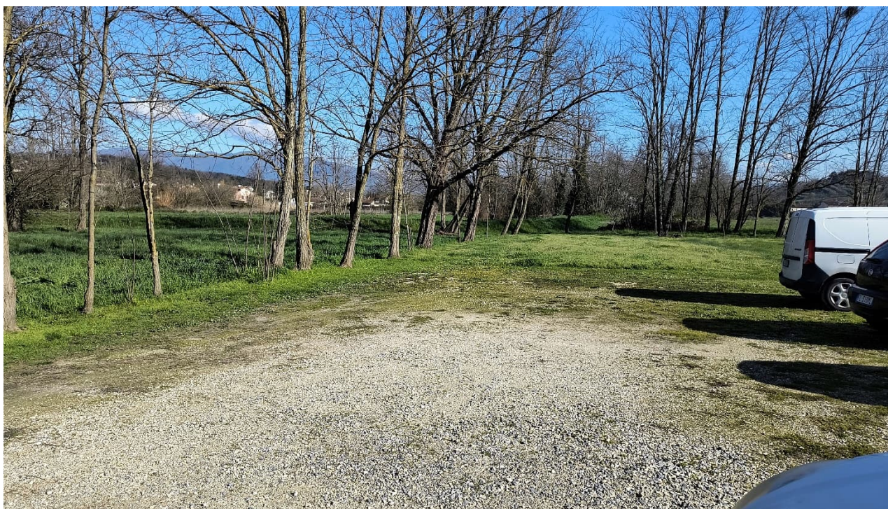
Vista parte terreno verso nord