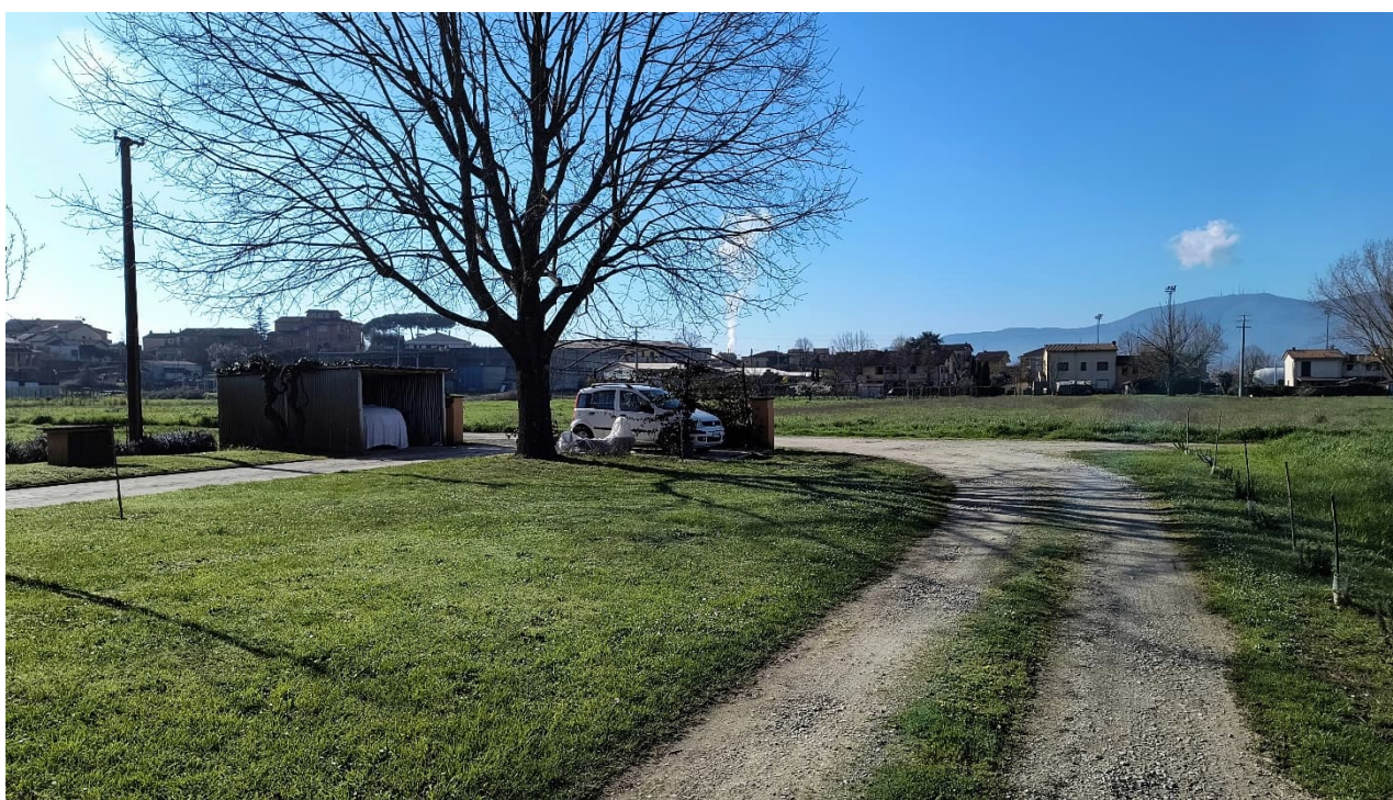
Vista parte terreno verso sud-est