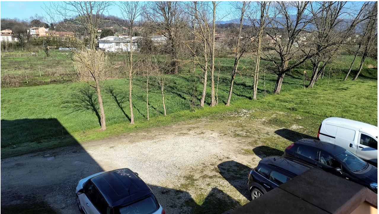
Vista parte terreno dalla scala di accesso