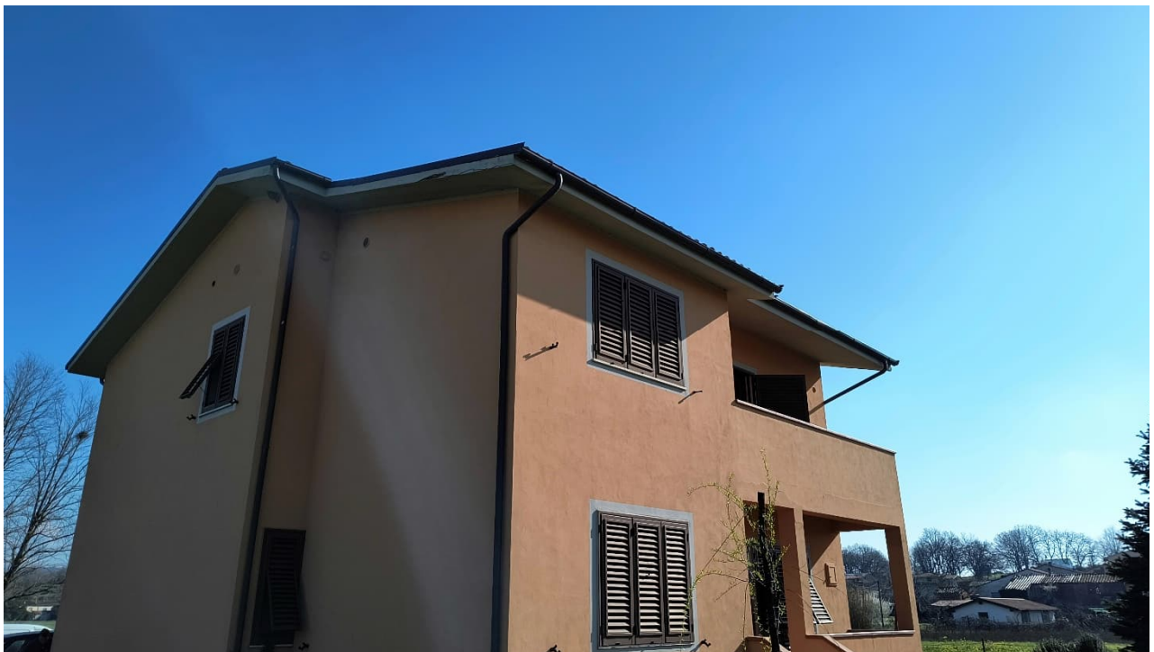
Vista da sud-ovest