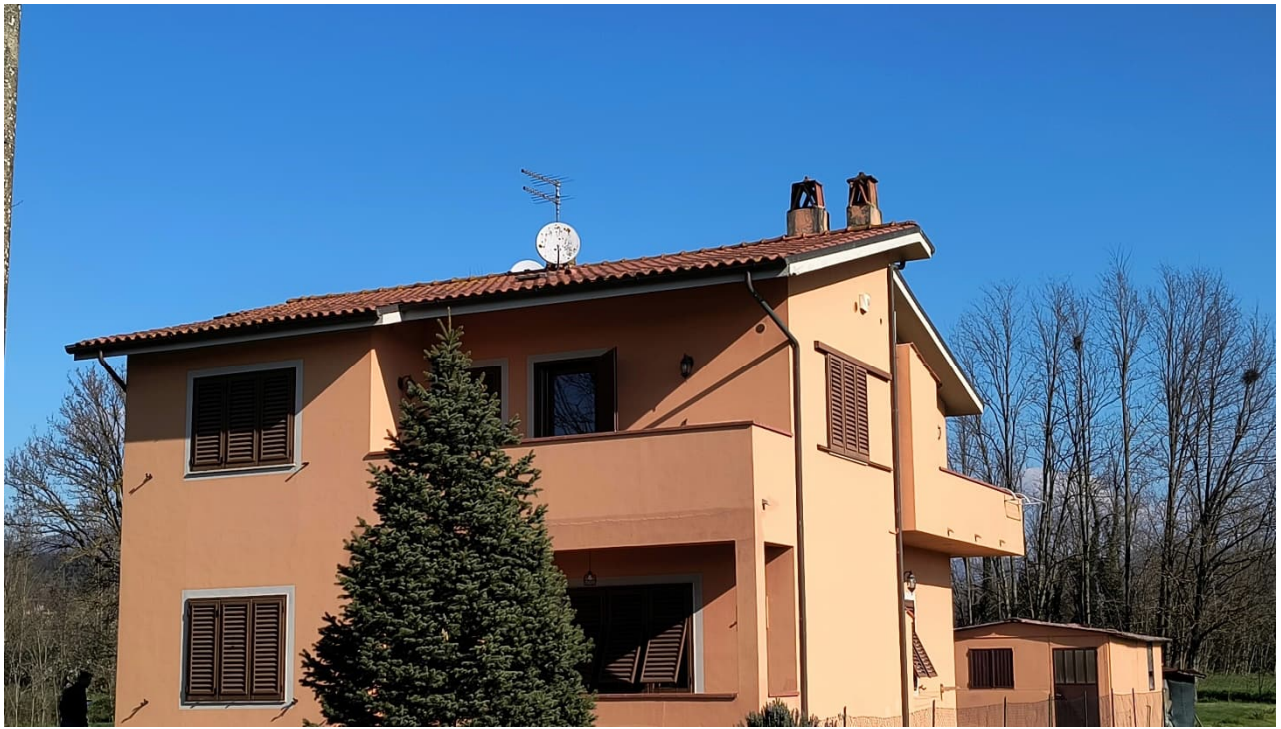
Vista da sud-est