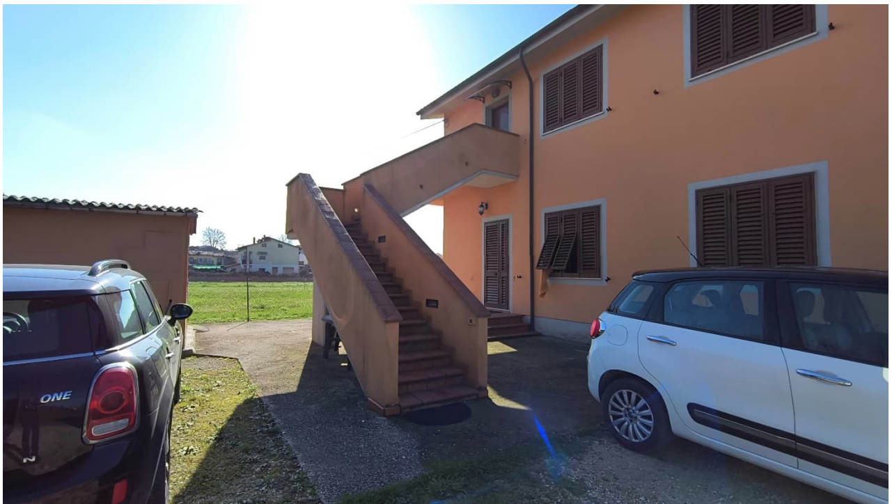
Vista da nord-ovest scala di accesso