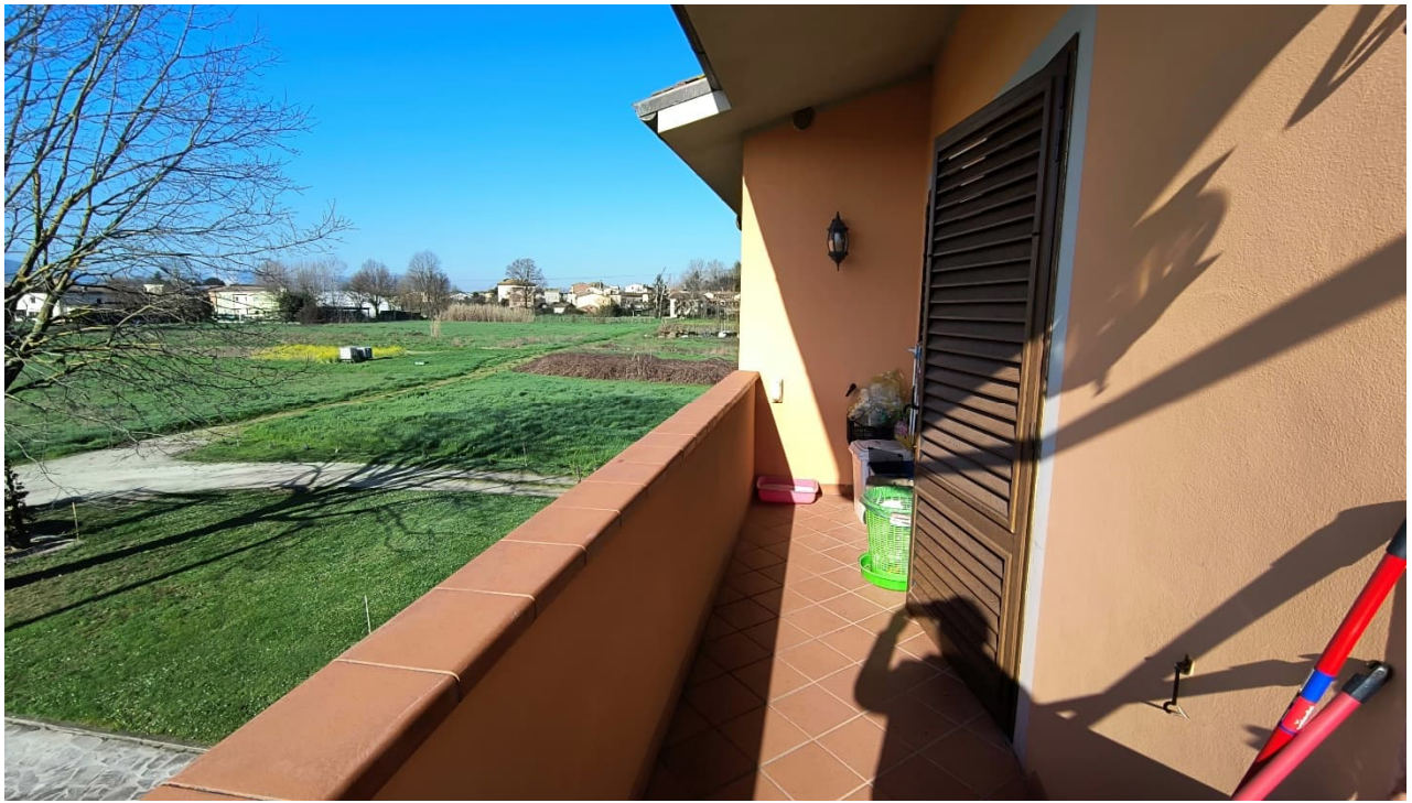
Vista terrazzo lato sud