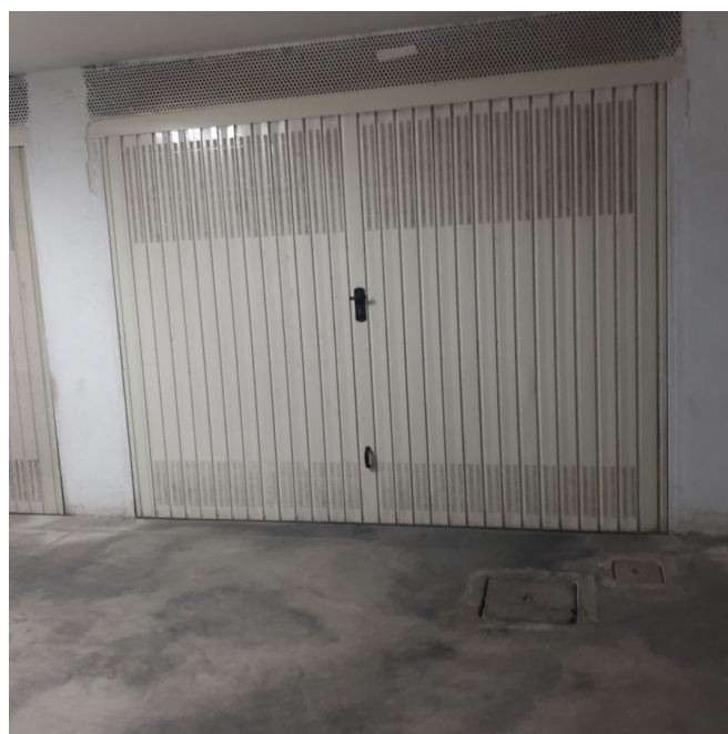
Immagine 4: INGRESSO GARAGE SUB 25