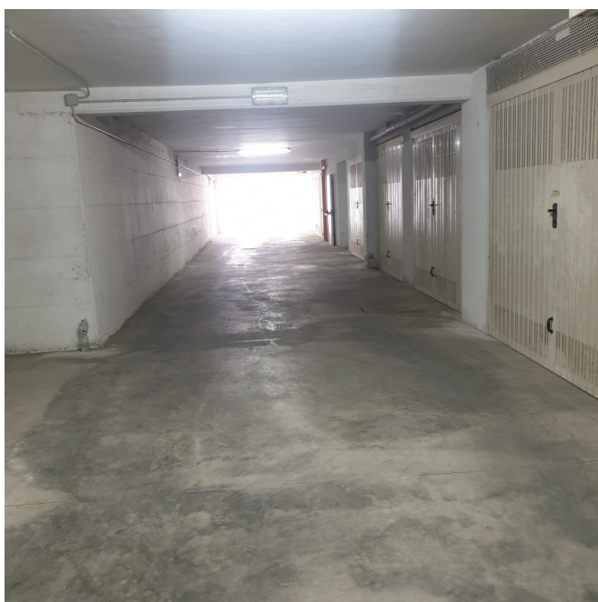
Immagine 3: GALLERIA GARAGES SPAZIO DI MANOVRA