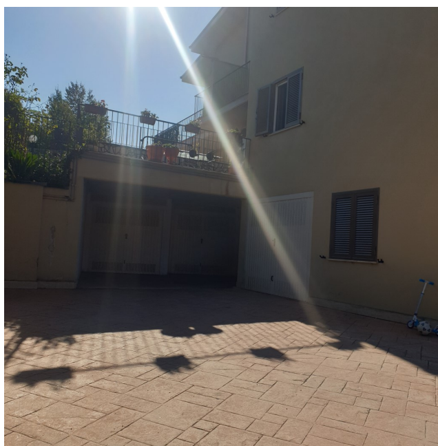
Immagine 2: INGRESSO GALLERIA GARAGE DA CORTILE CONDOMINIALE