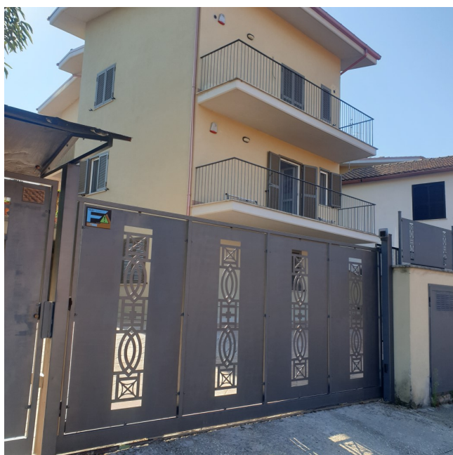
Immagine 1: EDIFICIO CONDOMINIALE ACCESSO SU VVIA DELLE MELE 1 a TRAVERSA 8/A