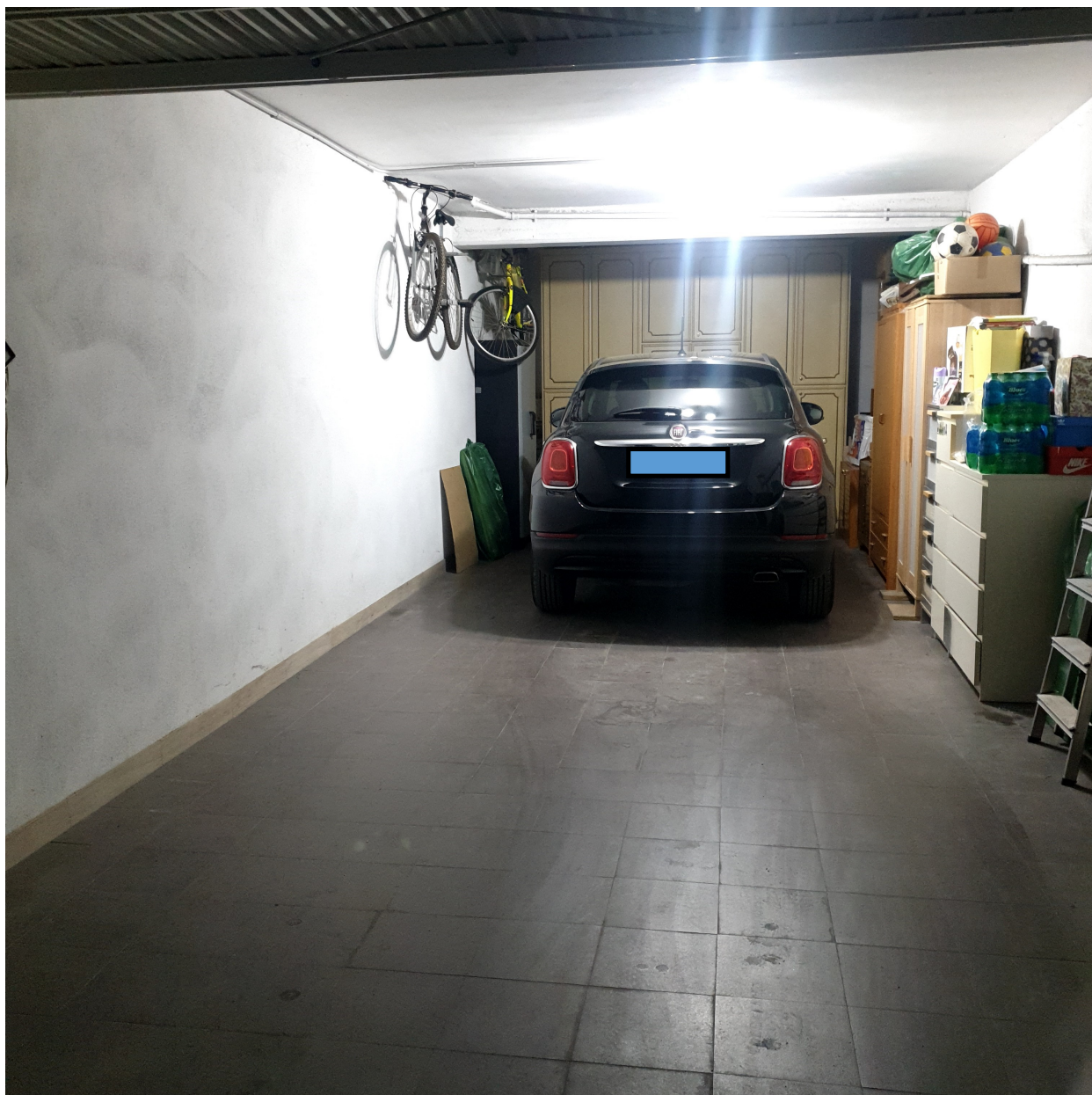
Immagine 5: INTERNO BOX SUB 25