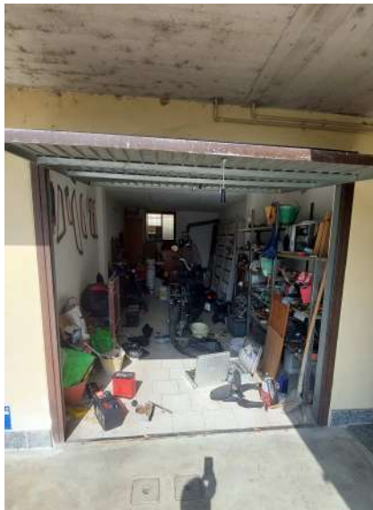
FOTO 8 - Box