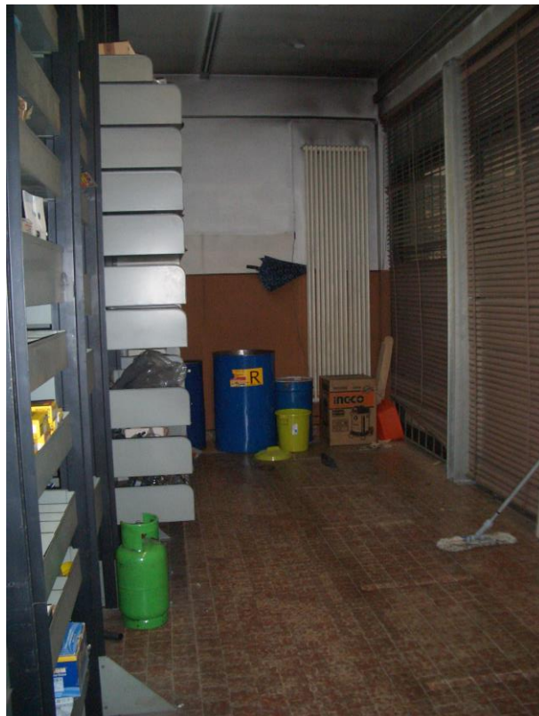
10. Vista del magazzino al piano terra