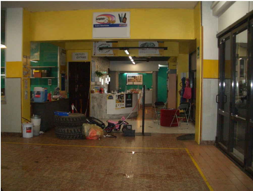
4. Vista dell'officina