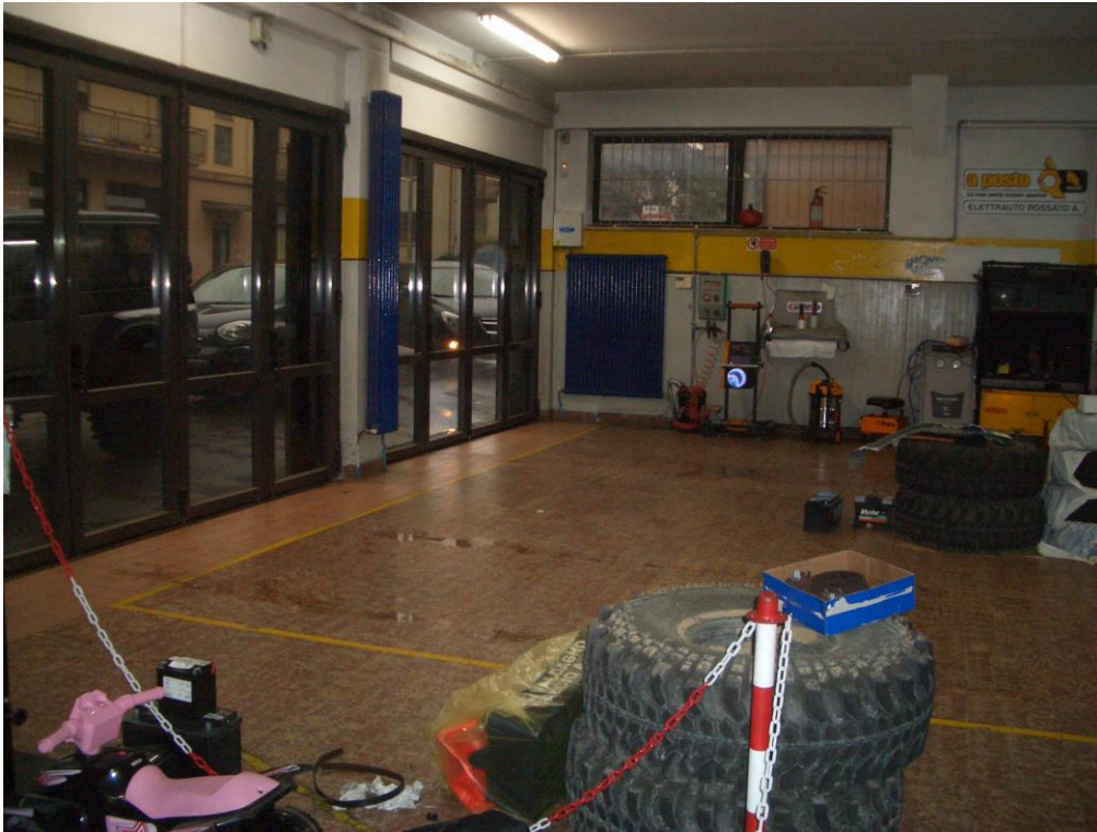
3. Vista dell'officina