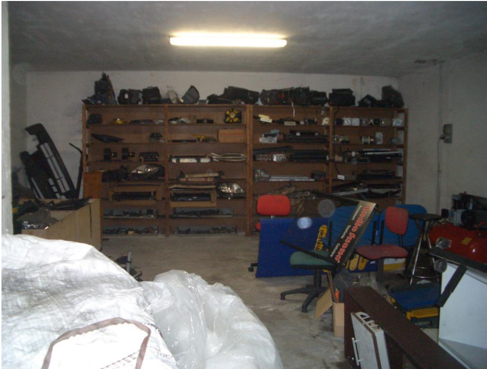
11. Vista del magazzino al piano interrato