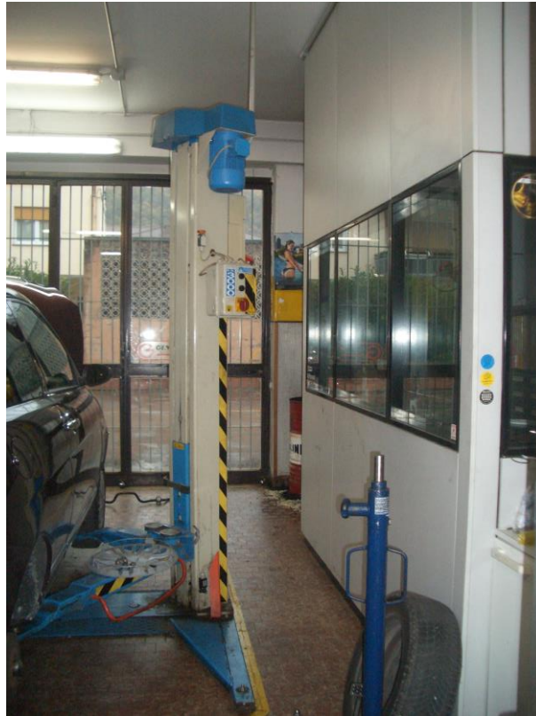
5. Vista dell'officina