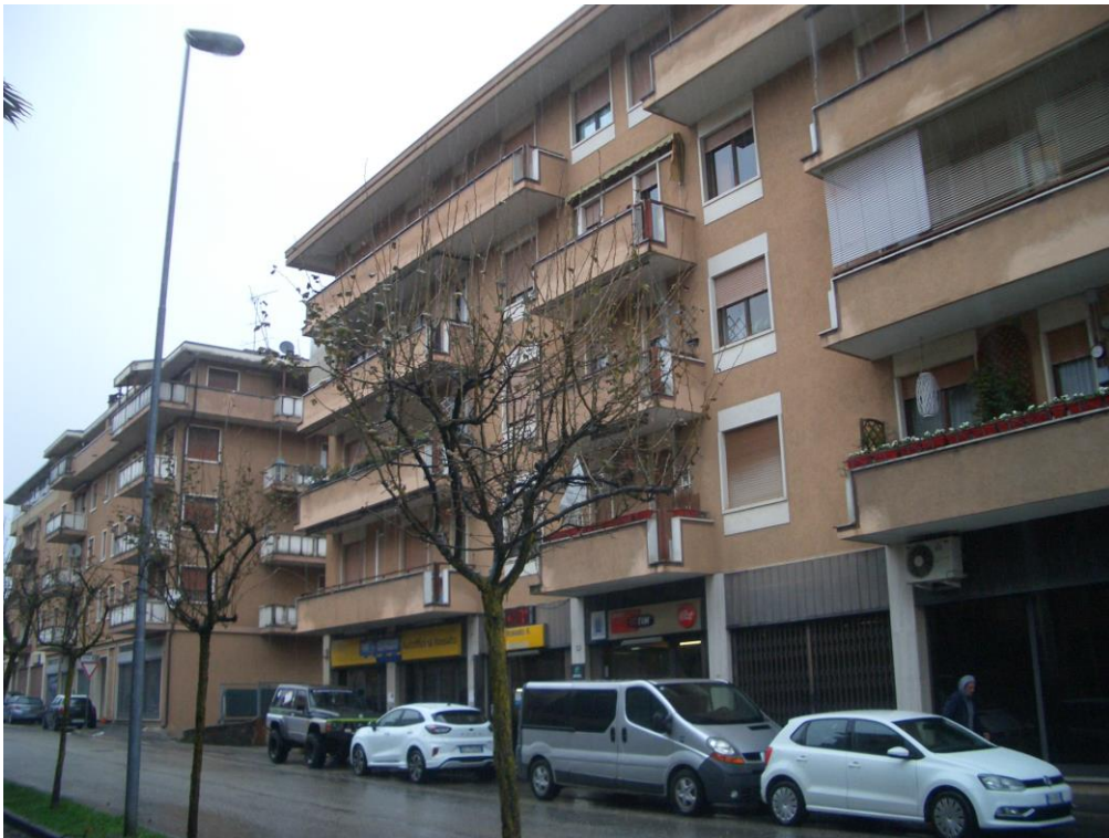
2. Vista generale da Sud - Ovest