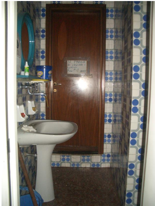
8. Vista del servizio igienico