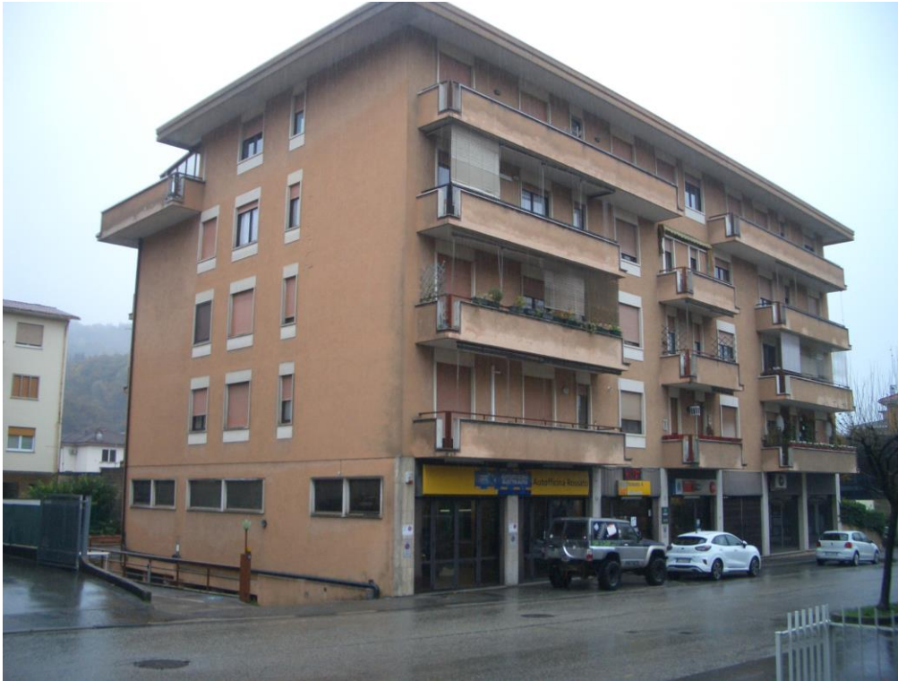
1. Vista generale da Nord-Ovest