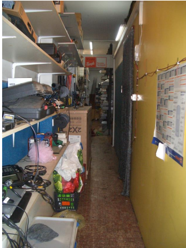
9. Vista del disimpegno