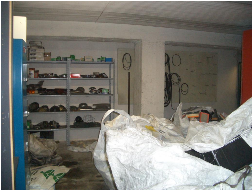
12. Vista del magazzino al piano interrato