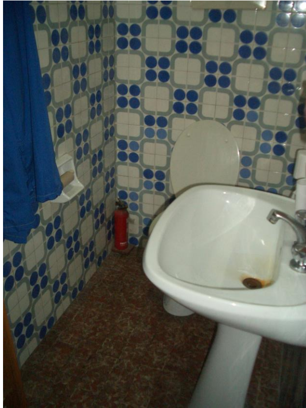
7. Vista del servizio igienico