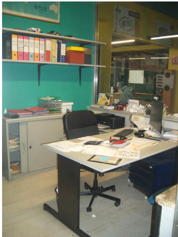
6. Vista dell'ufficio