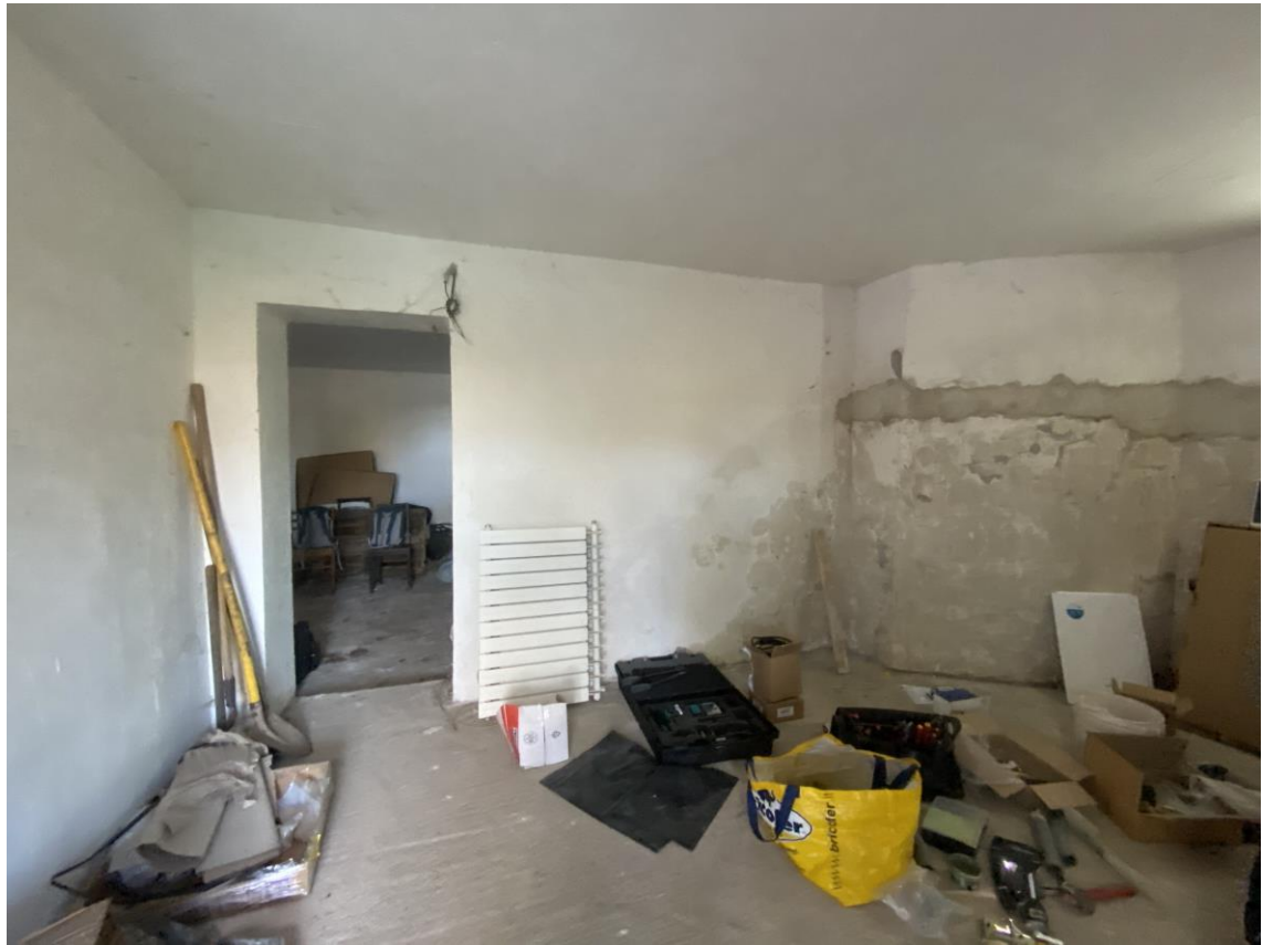
Foto n. 8 Soggiorno/A.c. Piano Terra