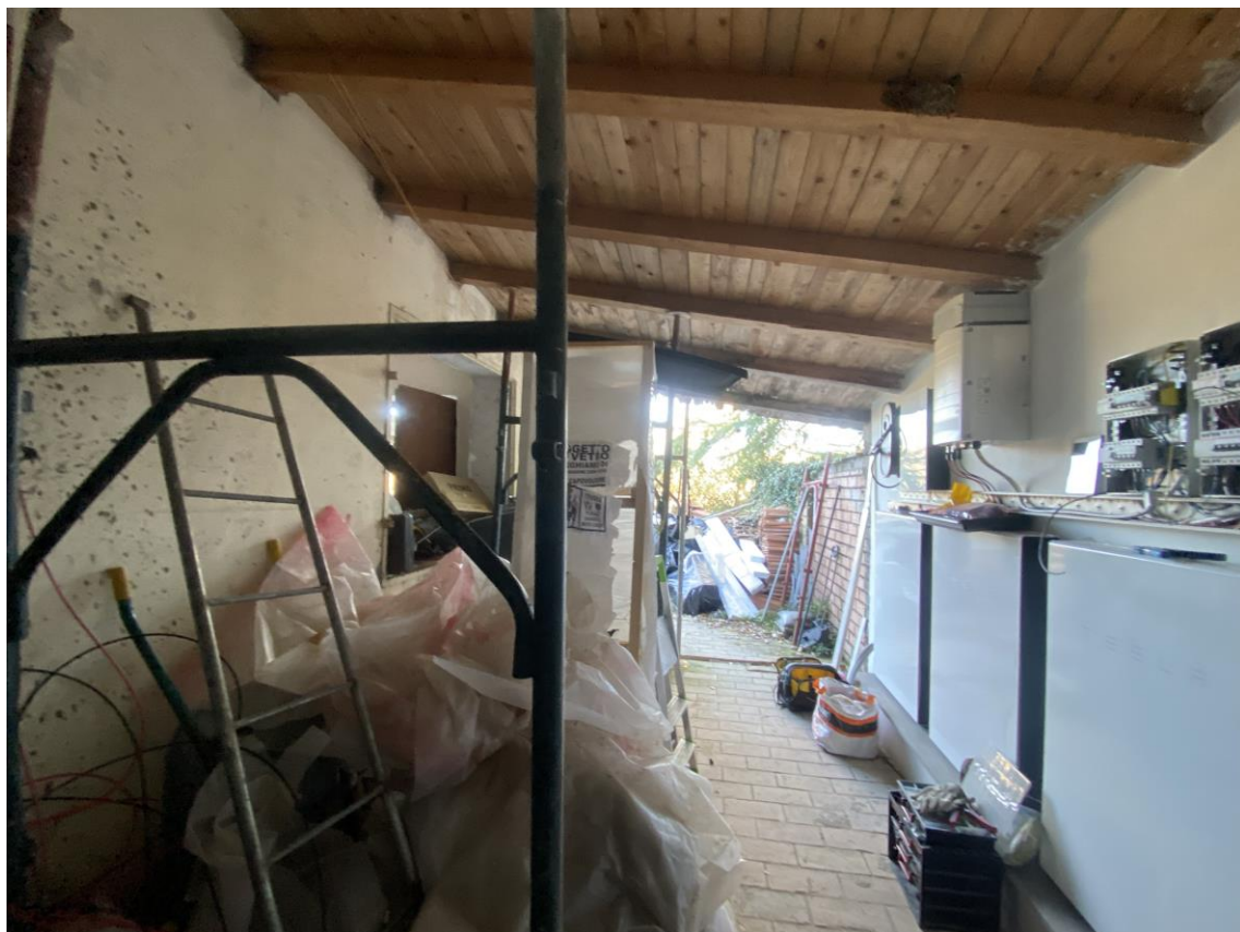
Foto n. 6 Deposito 1 Piano Primo Sottostrada