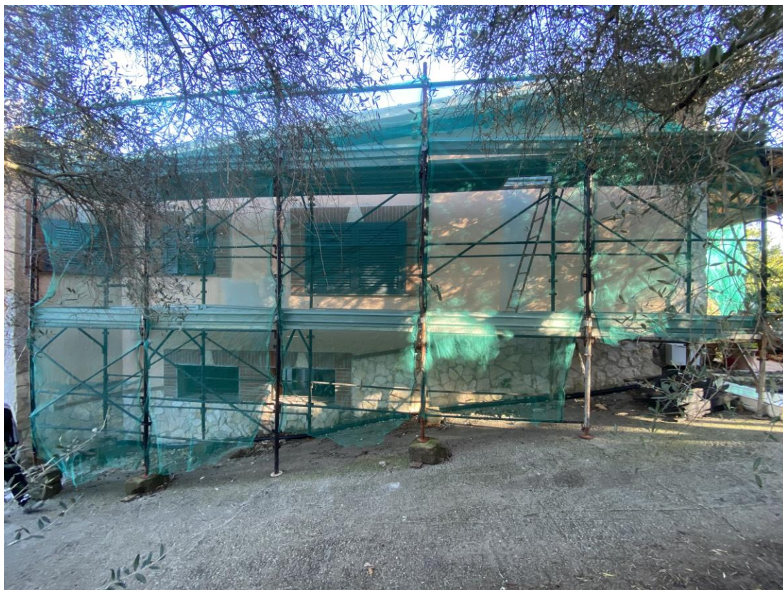
Foto n. 4 Esterno del Fabbricato Prospetto Nord