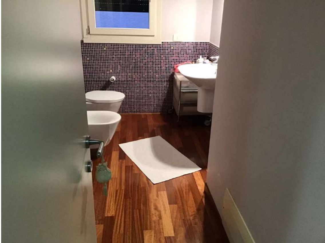
Terzo bagno p. 2