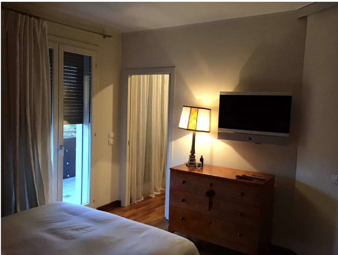
CAMERA P. 2