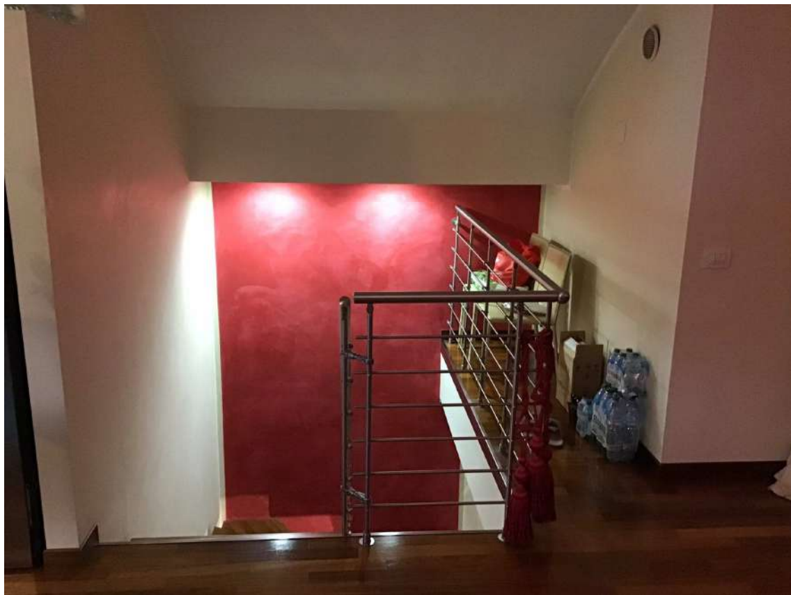
SCALE P. 3