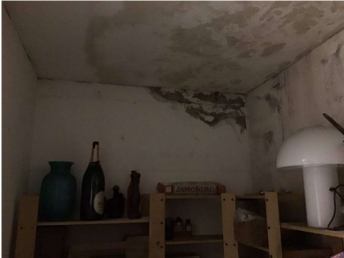
Interno rip-garage infiltrazione