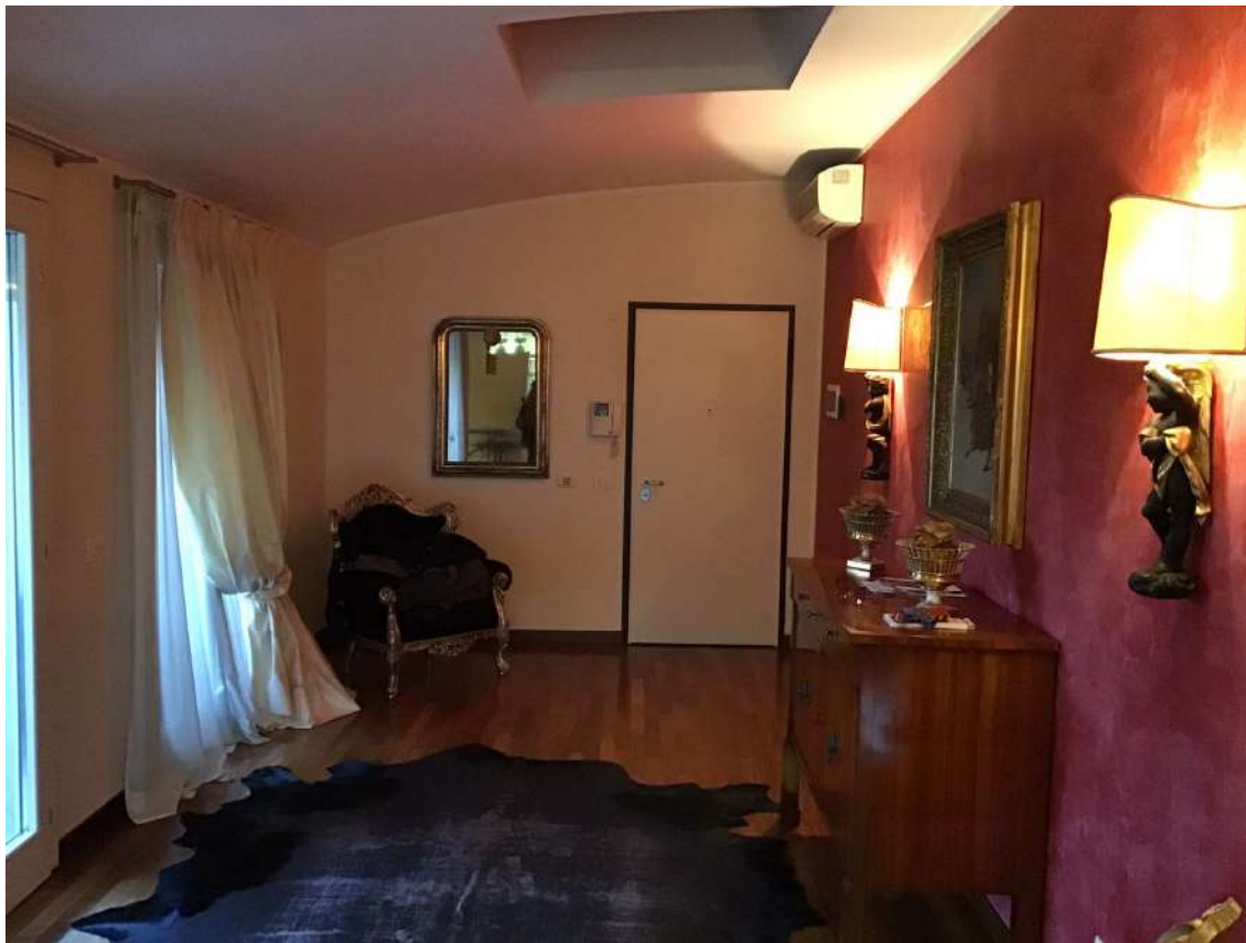
INGRESSO PIANO 3