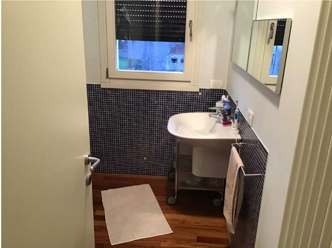
BAGNO P. 2