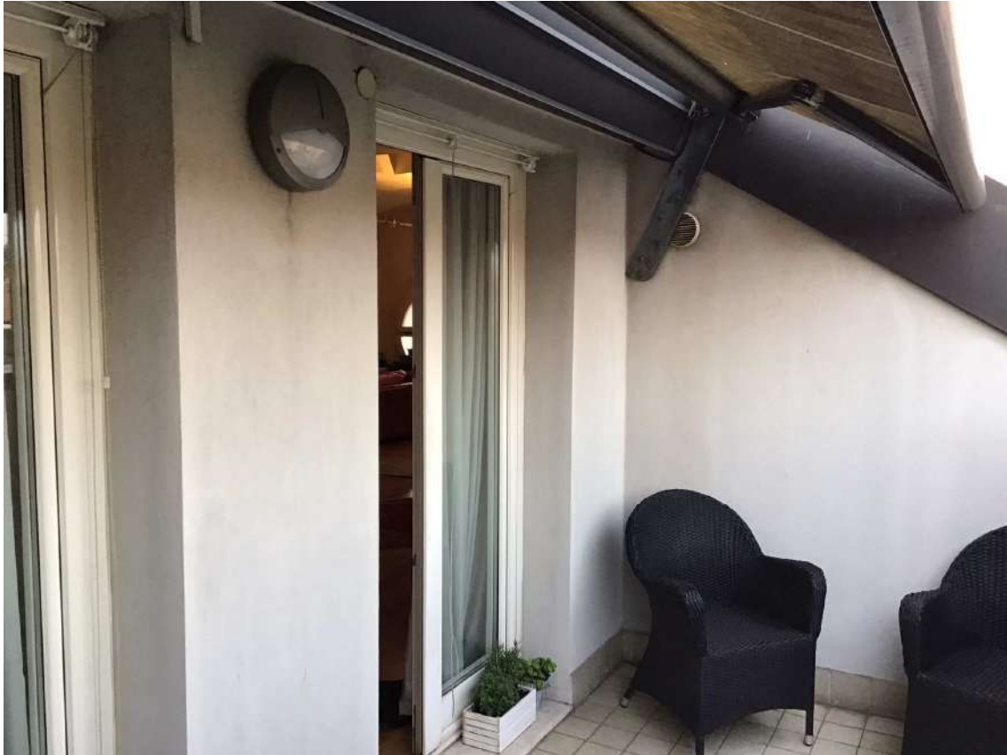
TERRAZZA P. 3