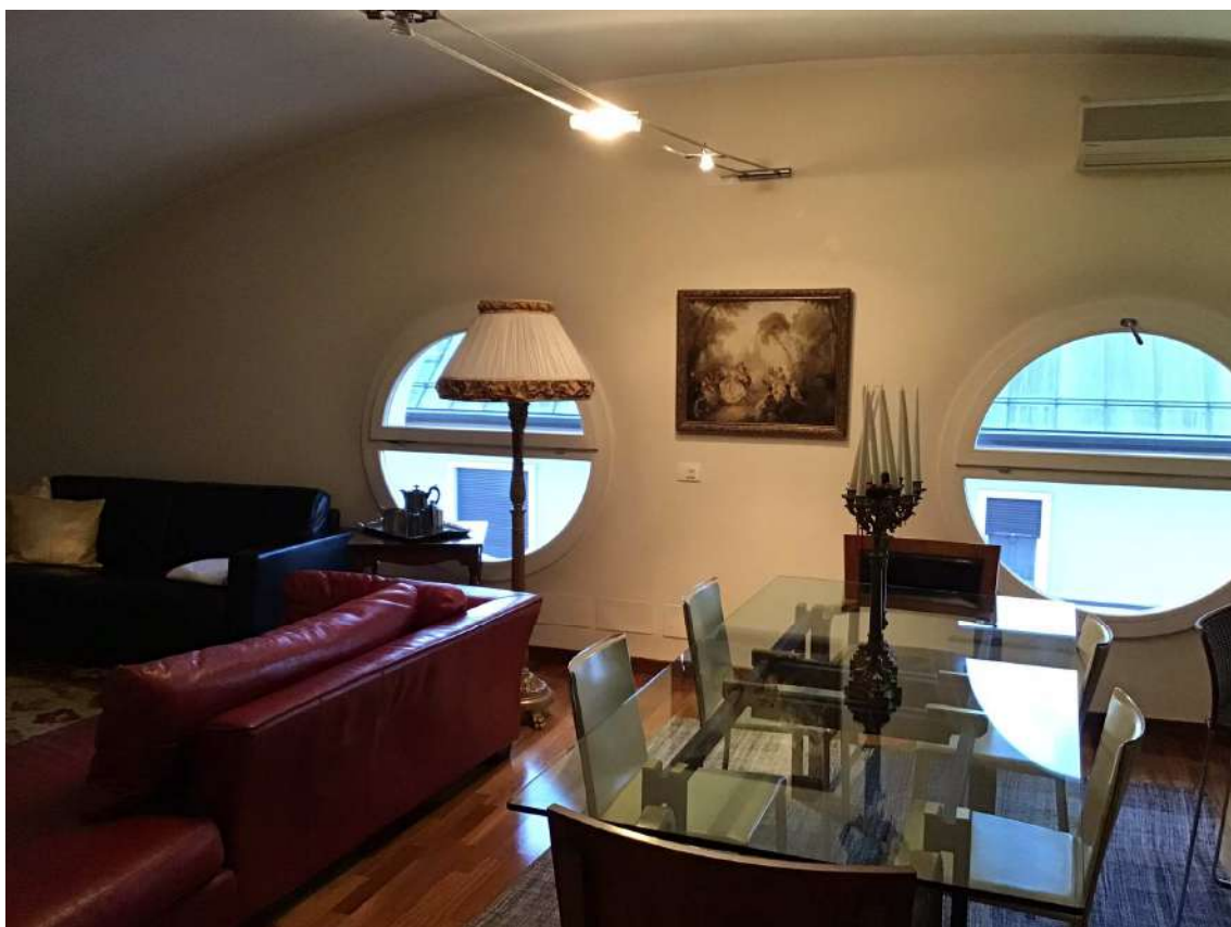
Vista SOGGIORNO – ANG COTTURA