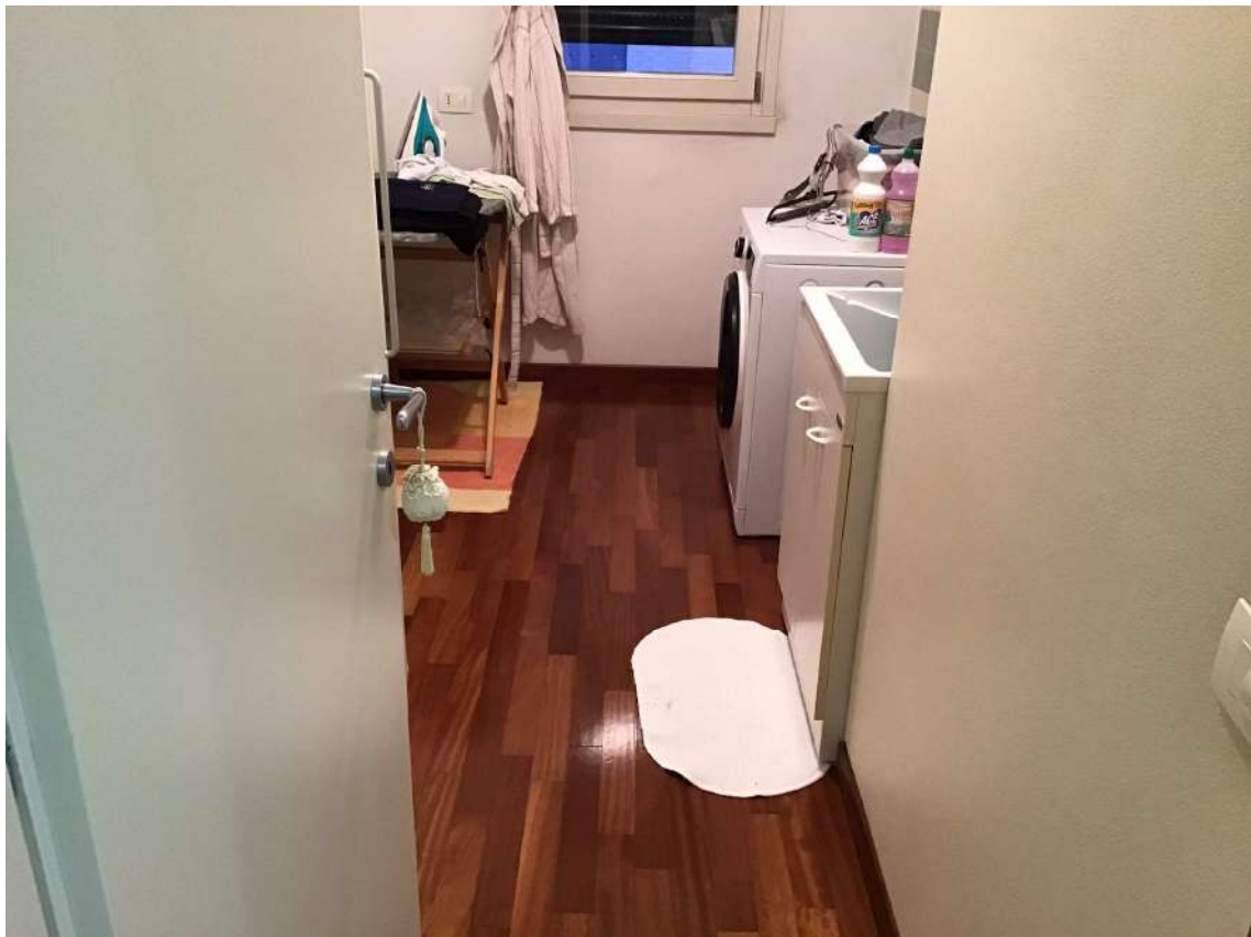
LAVANDERIA P. 2