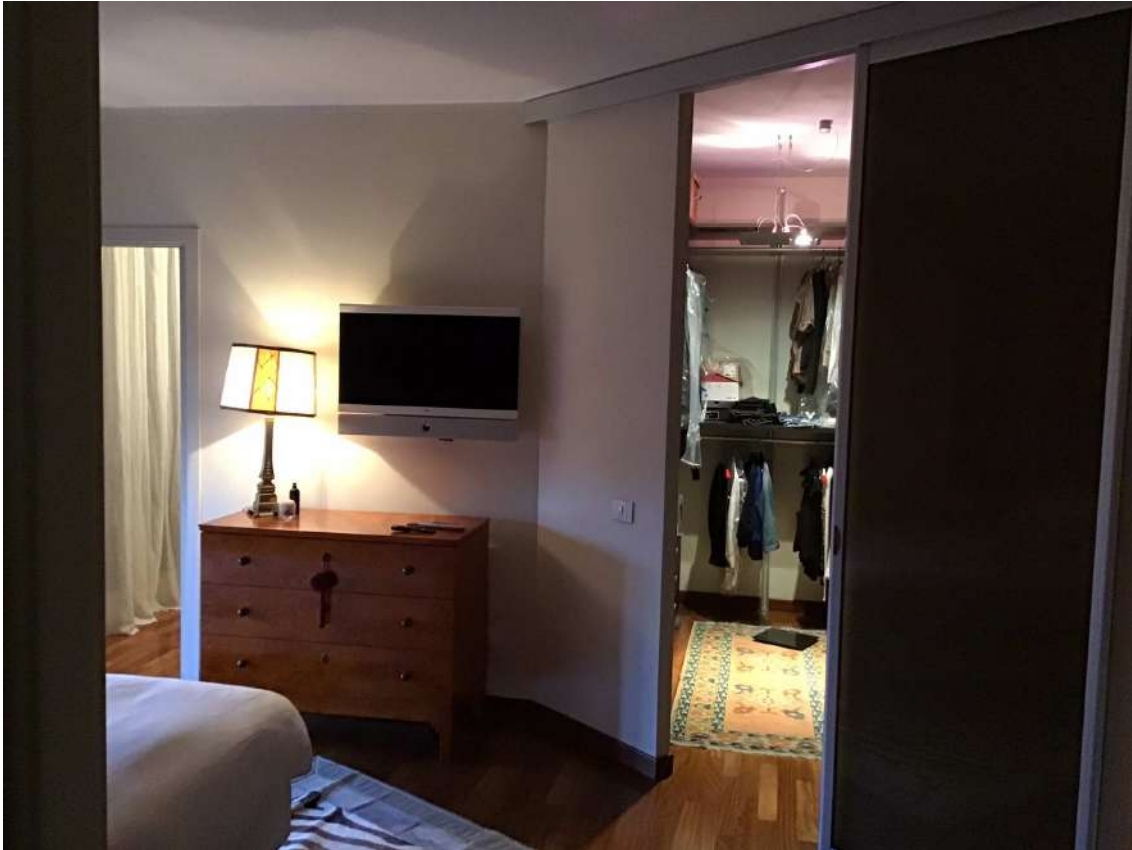
CAMERA- CABINA ARMADIO piano secondo