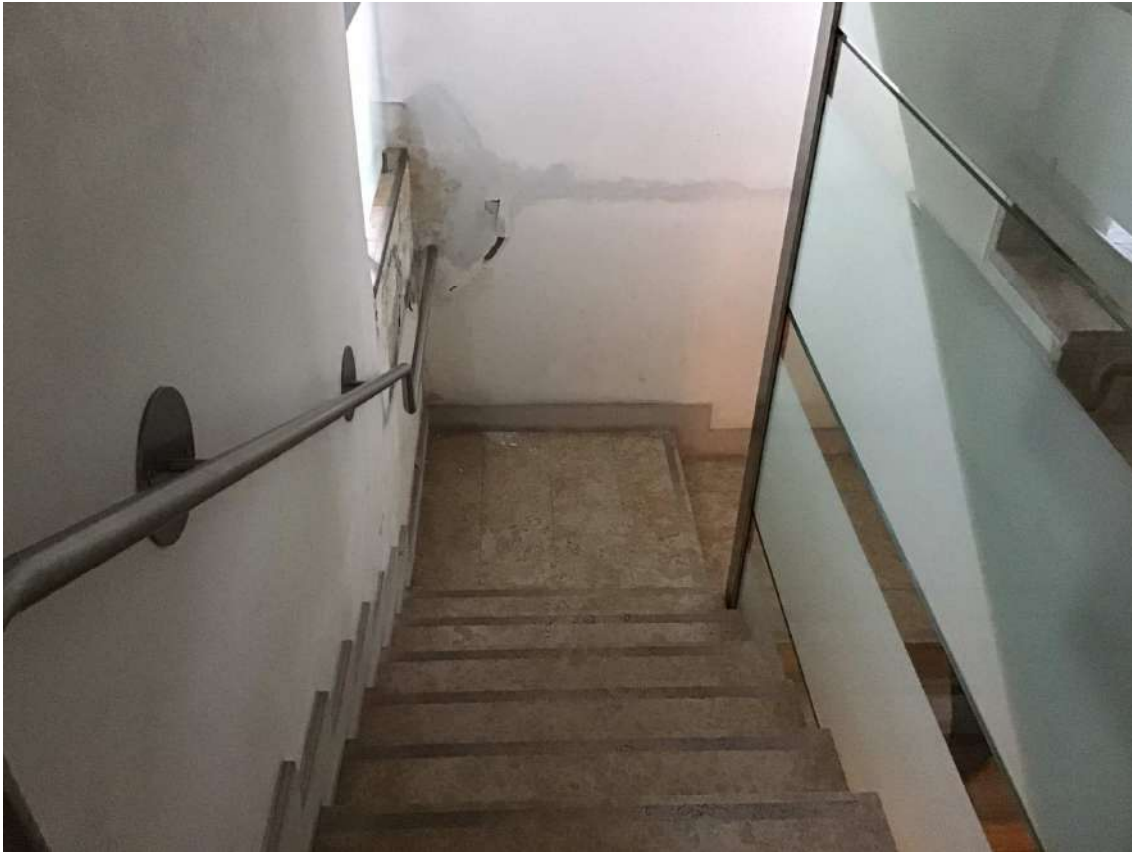
Scala condominiale- infiltrazione