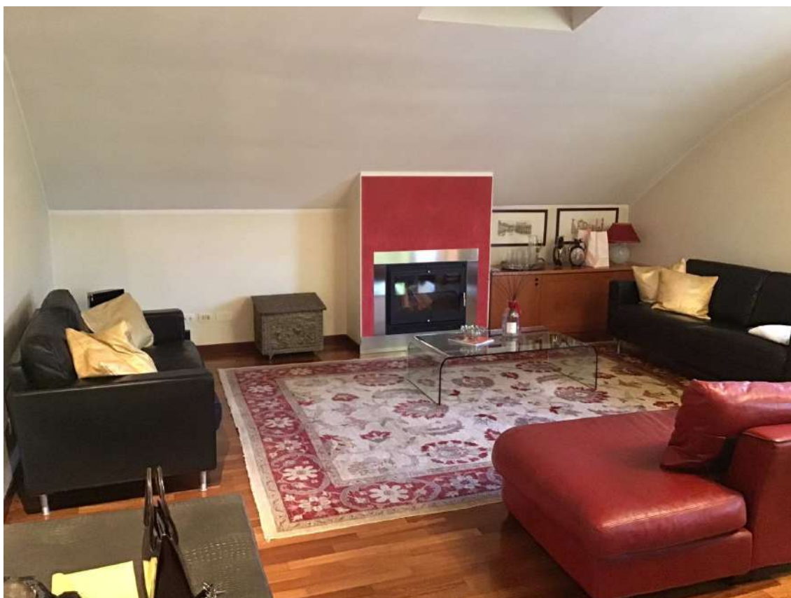
SOGGIORNO PIANO 3