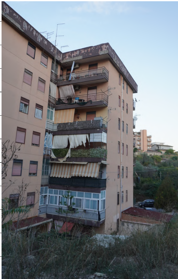
Foto n.2: immagine esterna del lato ovest dell'edificio in cui è ubicato al piano sesto l'appartamento oggetto di pignoramento.