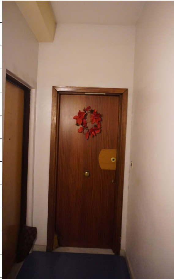
Foto n.5: immagine della porta di ingresso all'appartamento oggetto di pignoramento.