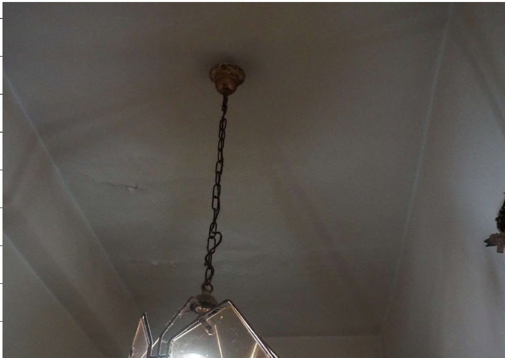
Foto n.22: immagine interna di parte del soffitto del disimpegno.