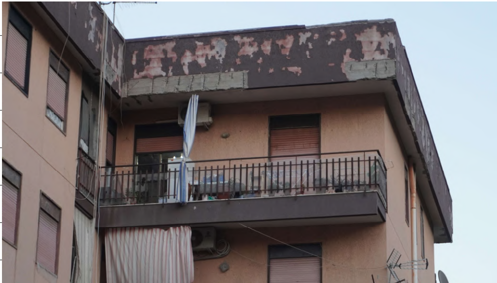
Foto n.3: immagine esterna di particolare del lato ovest dell'edificio in cui è ubicato al piano sesto l'appartamento oggetto di pignoramento.