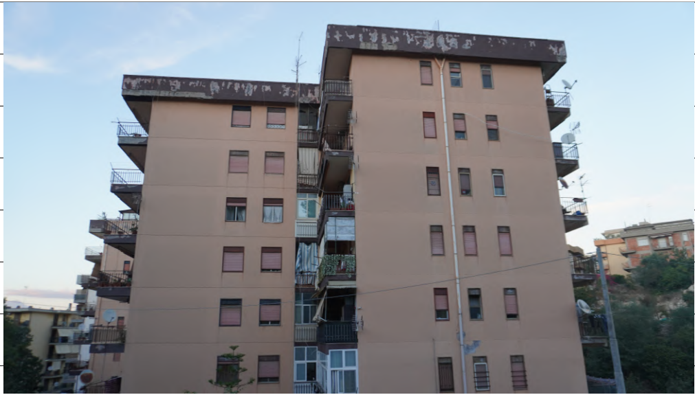
Foto n.1: immagine esterna del lato sud dell'edificio in cui è ubicato al piano sesto l'appartamento oggetto di pignoramento.