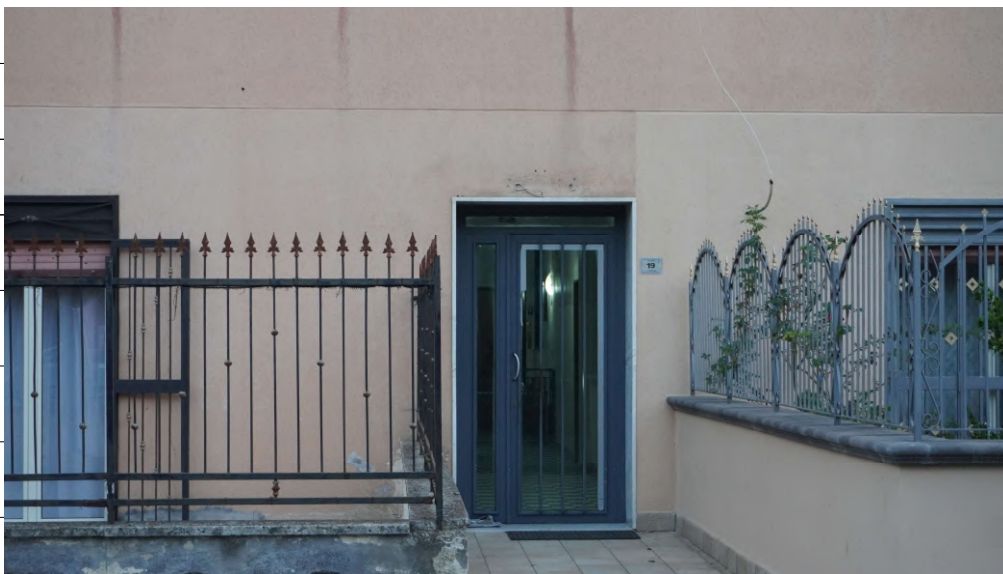
Foto n.4: immagine esterna dell'ingresso al condominio in cui al piano sesto è ubicato l'appartamento oggetto di pignoramento.