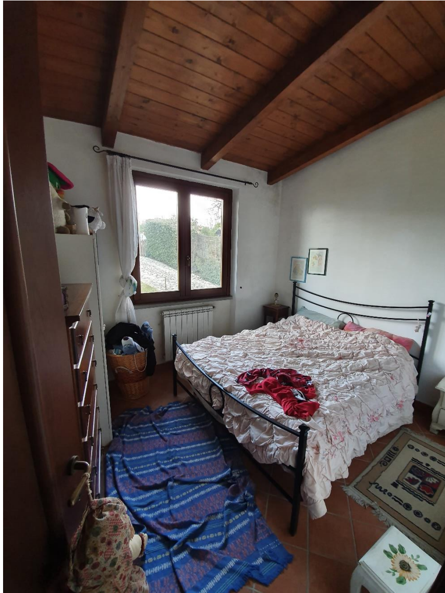
6- Camera piano primo