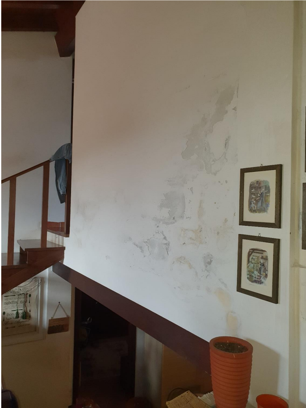
7- Intonaco da ripristinare