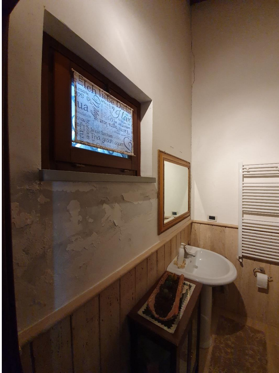
Foto 5- Bagno piano terra