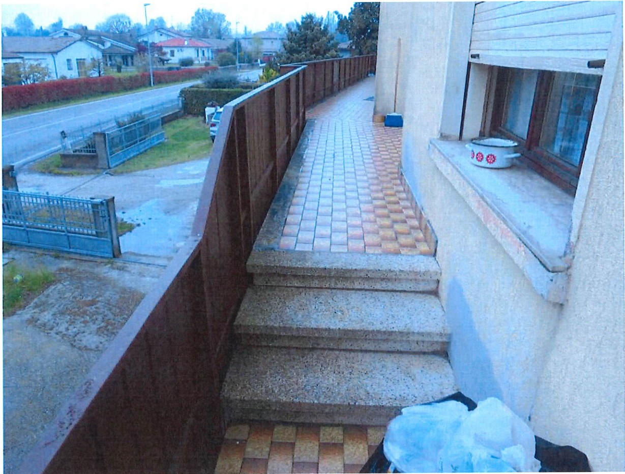
Foto 8. Abitazione. Particolare della terrazza