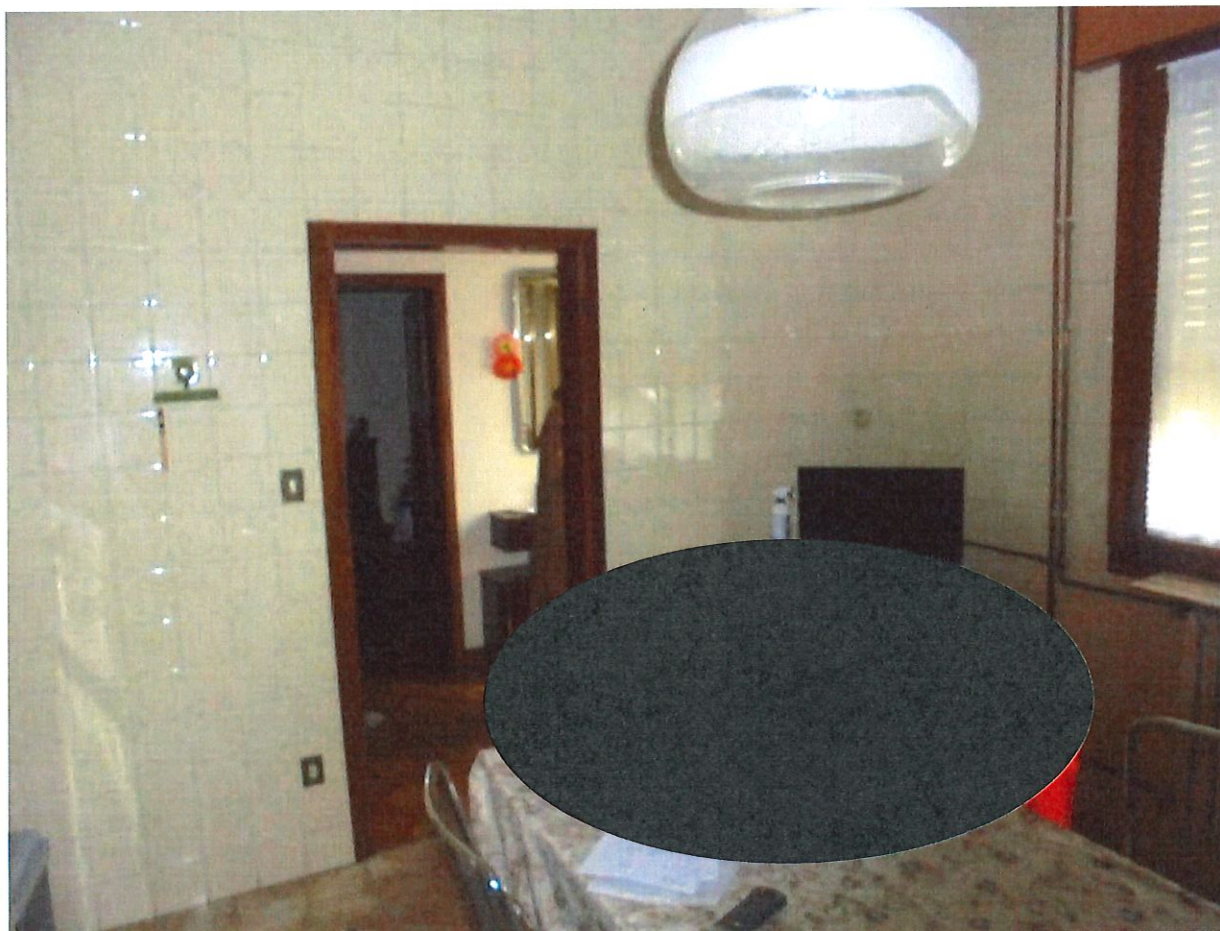
Foto 14. Abitazione. Particolare degli interni.