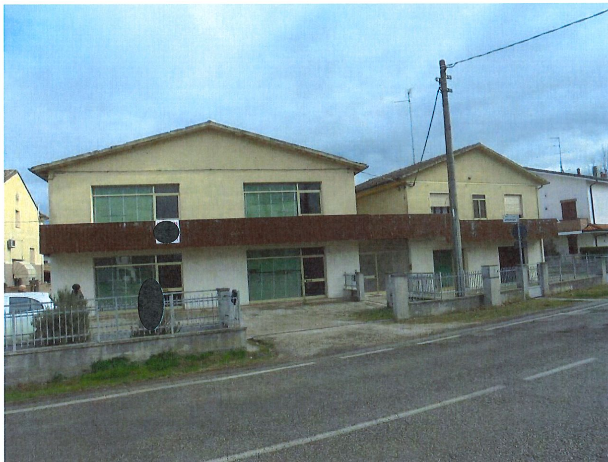
Foto 1. Ingresso. Vista da Via Provinciale.