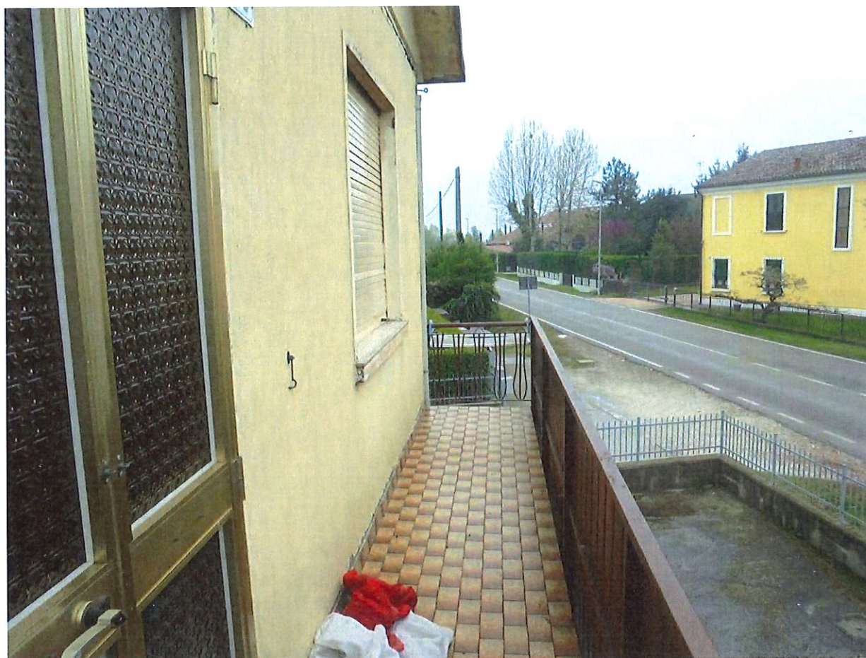
Foto 9. Abitazione. Particolare della terrazza