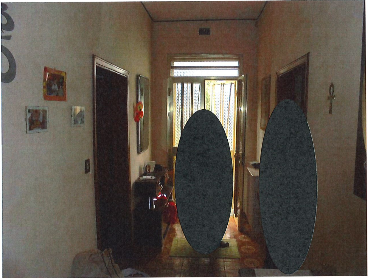
Foto 11. Abitazione. Particolare degli interni.