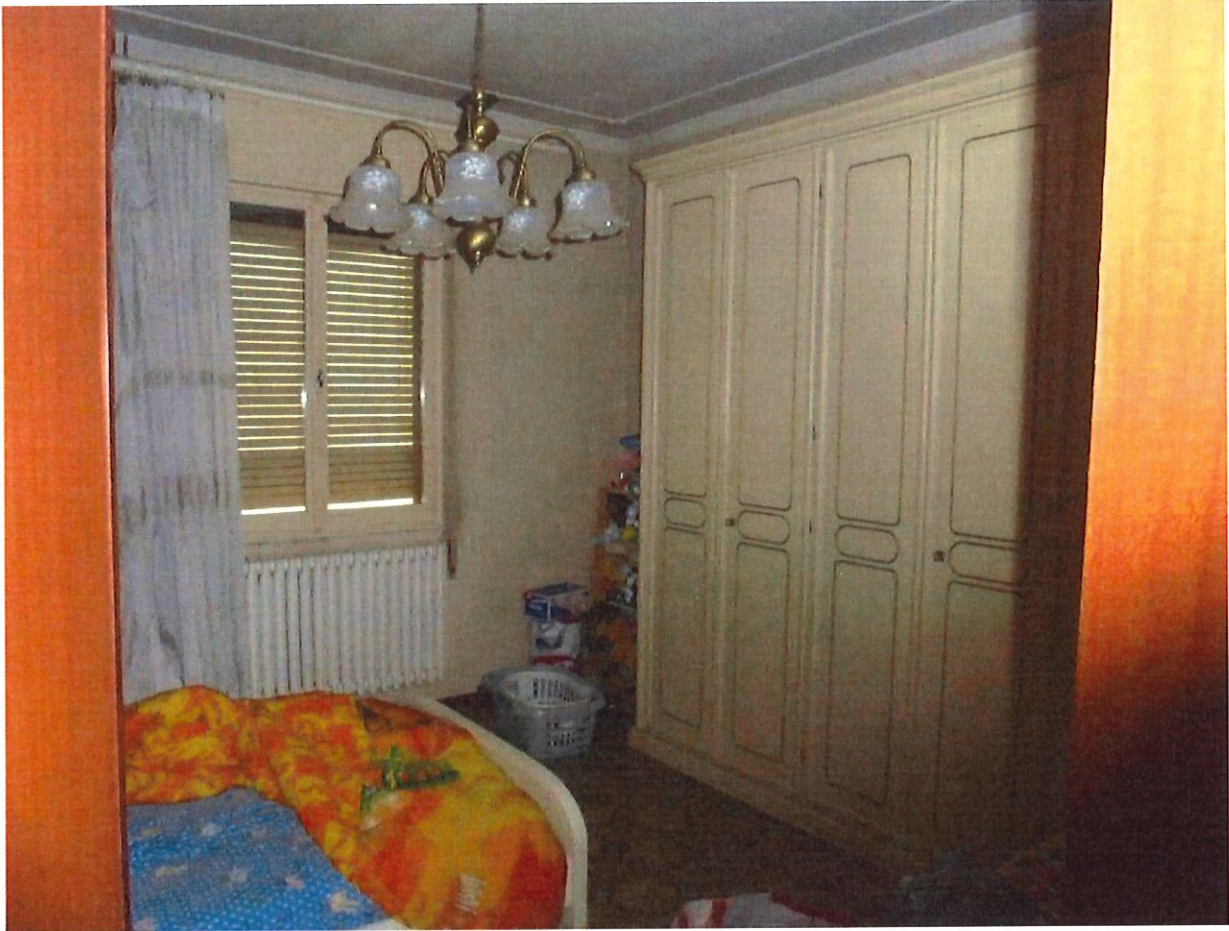
Foto 15. Abitazione. Particolare degli interni.