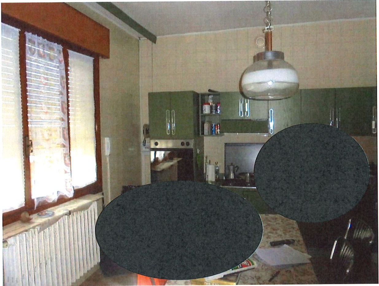
Foto 13. Abitazione. Particolare degli interni.