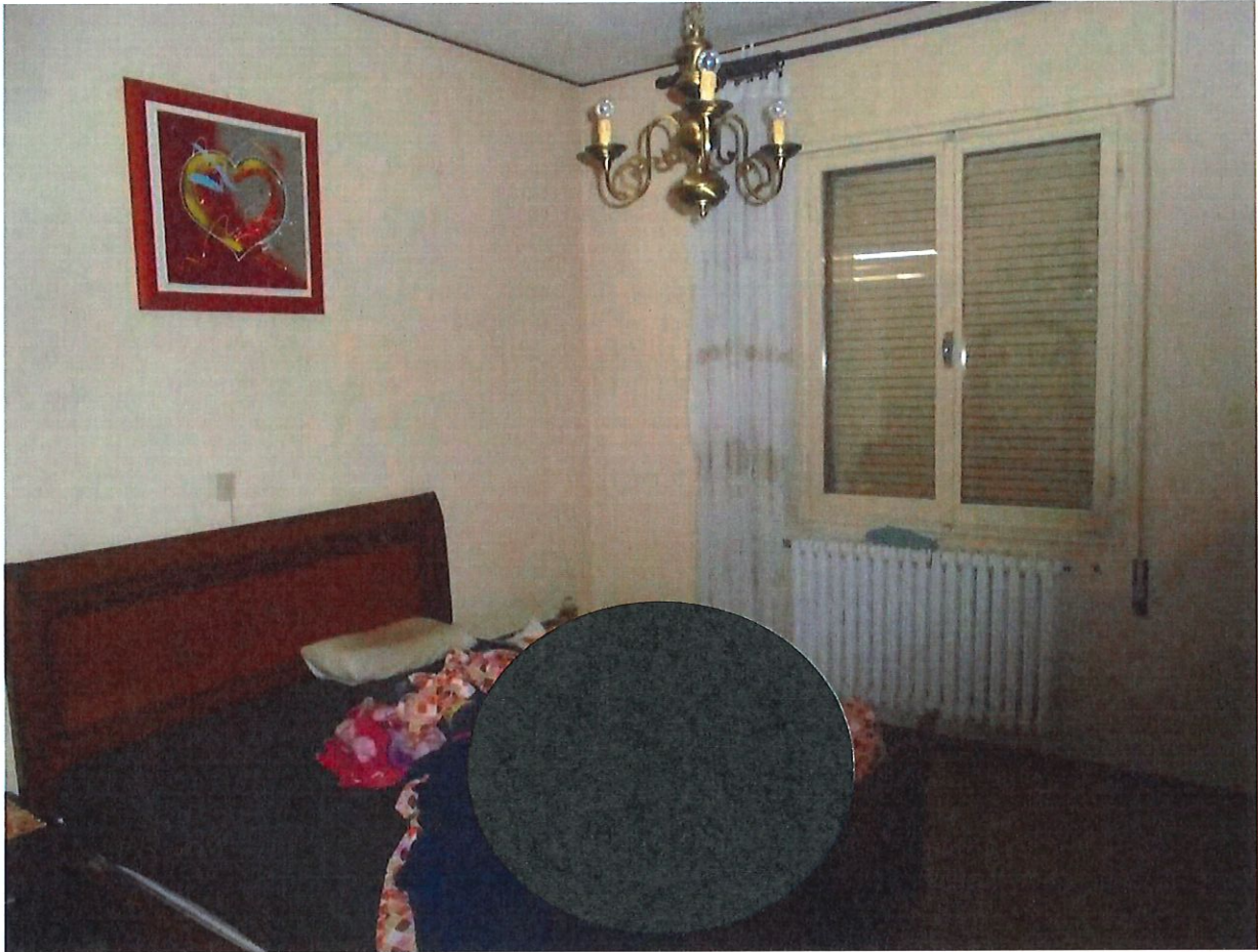
Foto 17. Abitazione. Particolare degli interni.