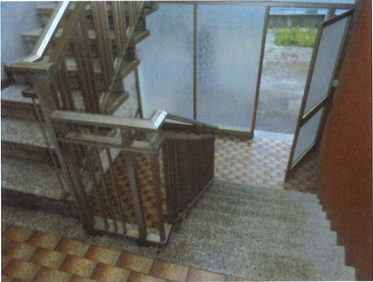
Foto 5. Particolare della scala di accesso al piano primo in comune con il lotto 5).