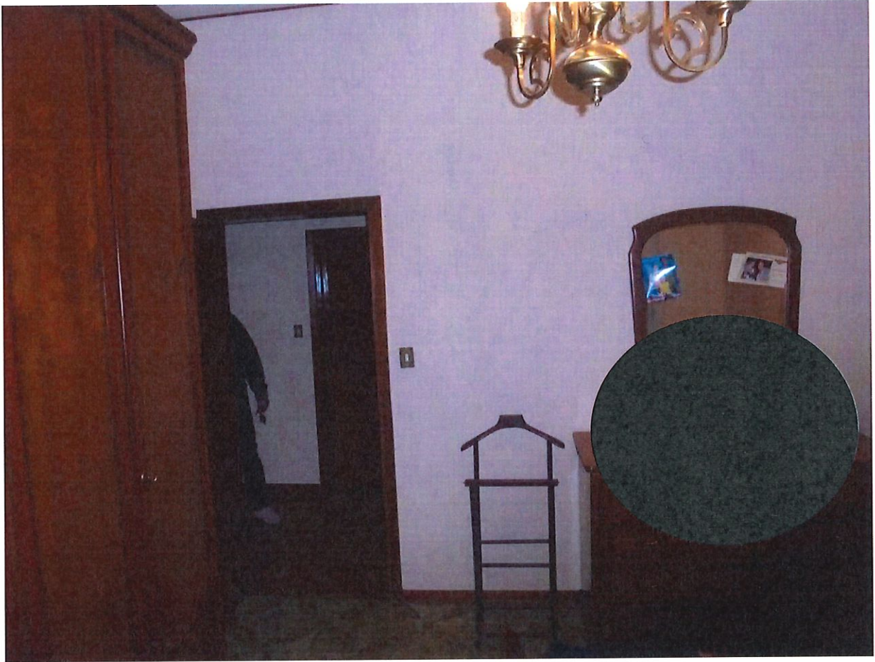
Foto 16. Abitazione. Particolare degli interni.