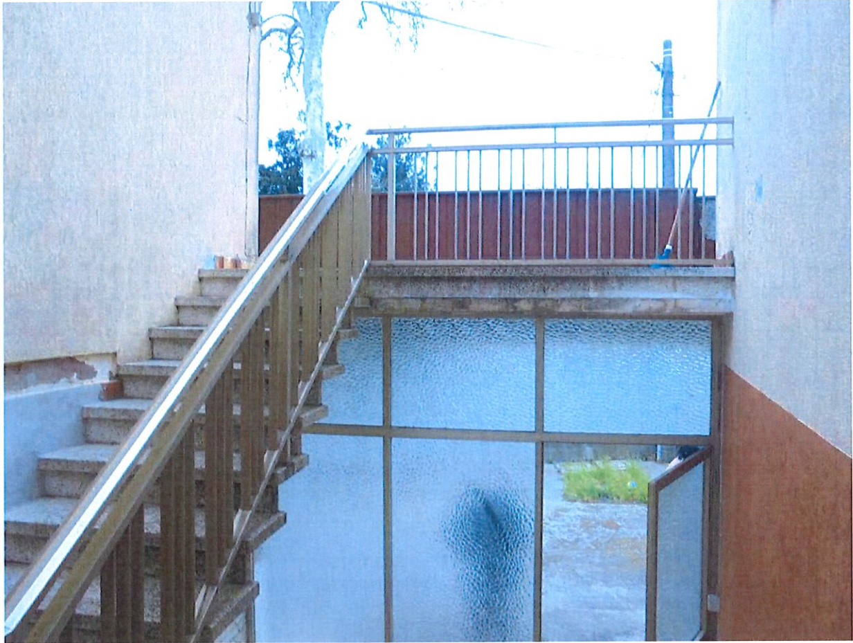
Foto 6. Particolare della scala di accesso al piano primo in comune con il lotto 5).