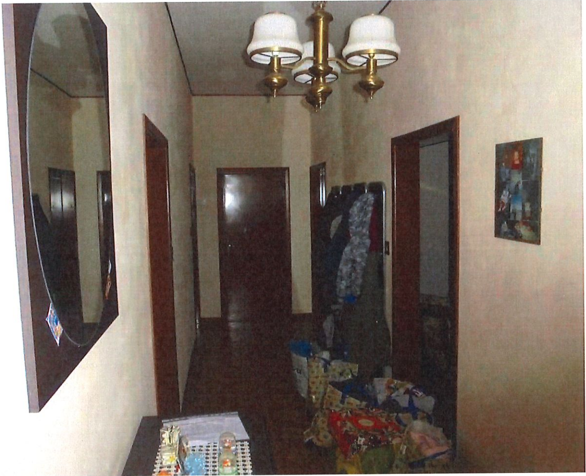
Foto 12. Abitazione. Particolare degli interni.