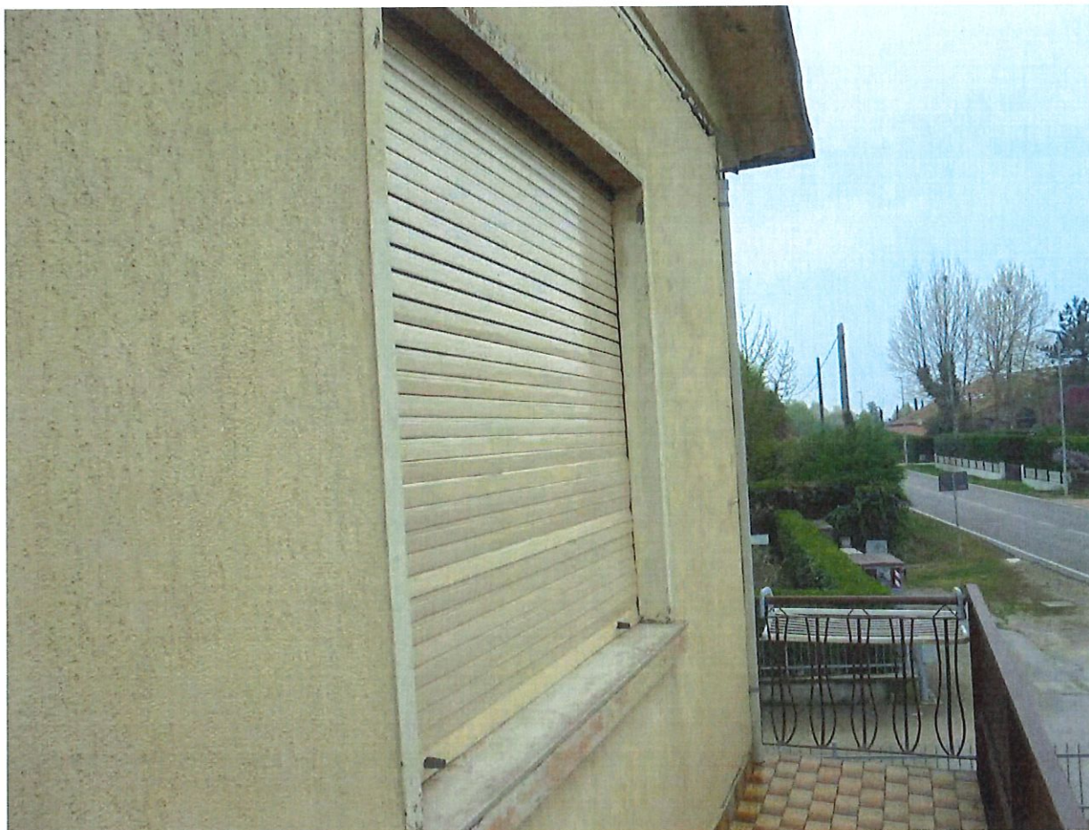
Foto 10. Abitazione. Particolare della terrazza