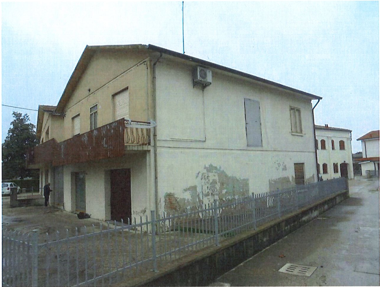
Foto 4. Prospetto Sud.