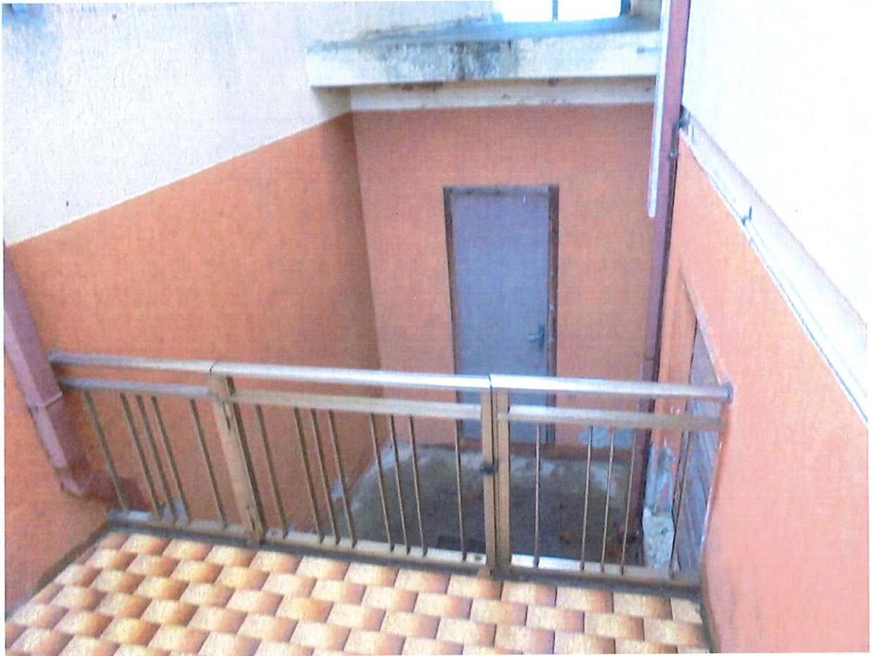
Foto 7. Particolare della scala di accesso al piano primo in comune con il lotto 5).