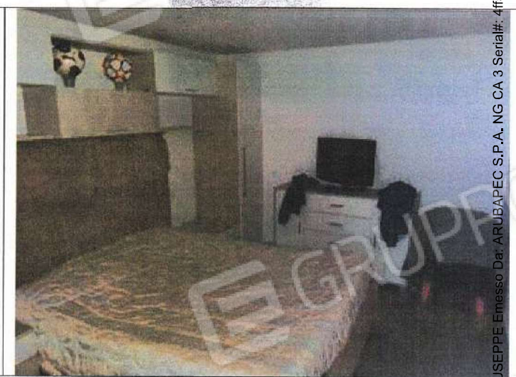
Unità abitativa al Foglio n° 28 - Particella n° 1054 sub. 35 e pertinenza sub. 36