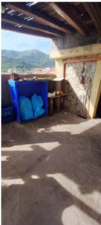
FOTO 15 LOGGIATO D'ACCESSO AL PIANO PRIMO ED AL LOCALE DI SGOMBERO