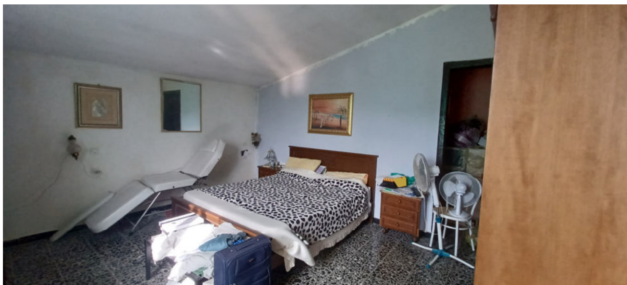
FOTO 24 - LETTO 5 E CABINA ARMADIO