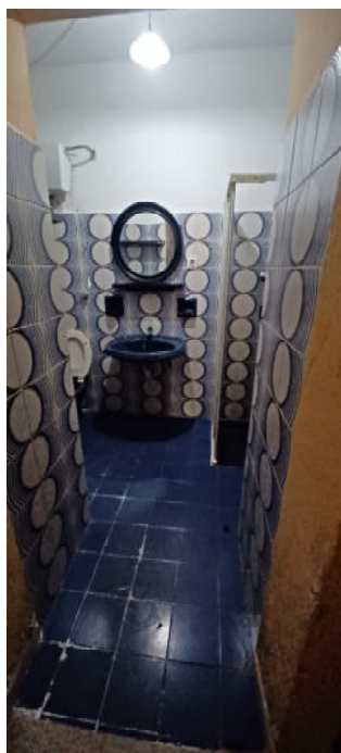
FOTO 11 BAGNO