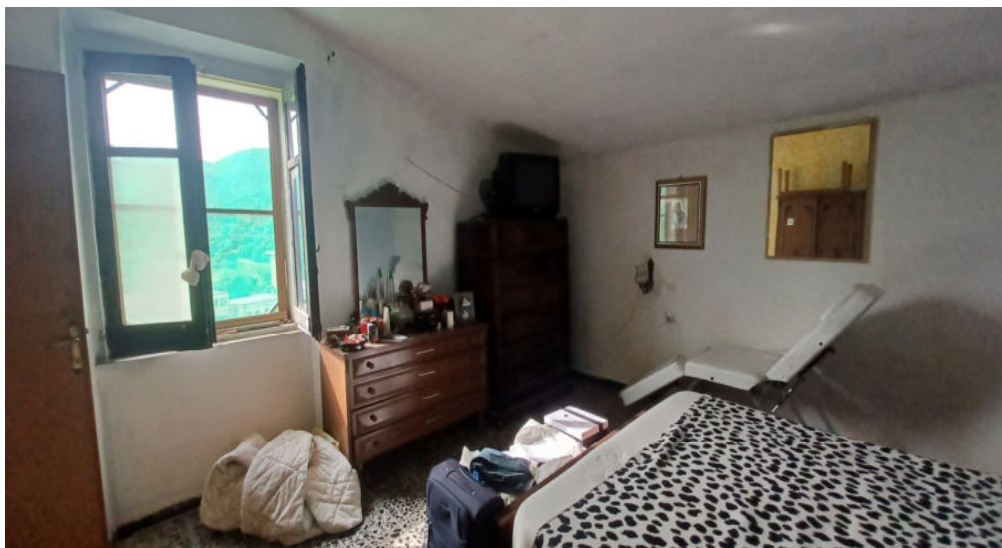
FOTO 25 - LETTO 5