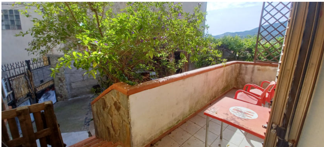
FOTO 05 BALCONE D'ACCESSO ALL'APPARTAMENTO