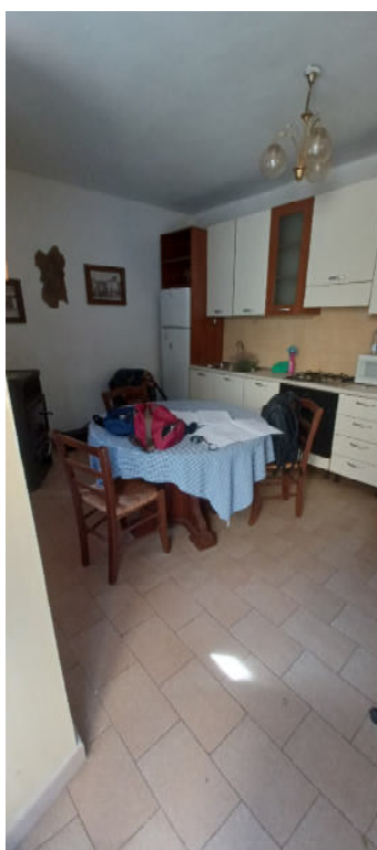
FOTO 06 PRANZO SOGGIORNO ANGOLO COTTURA