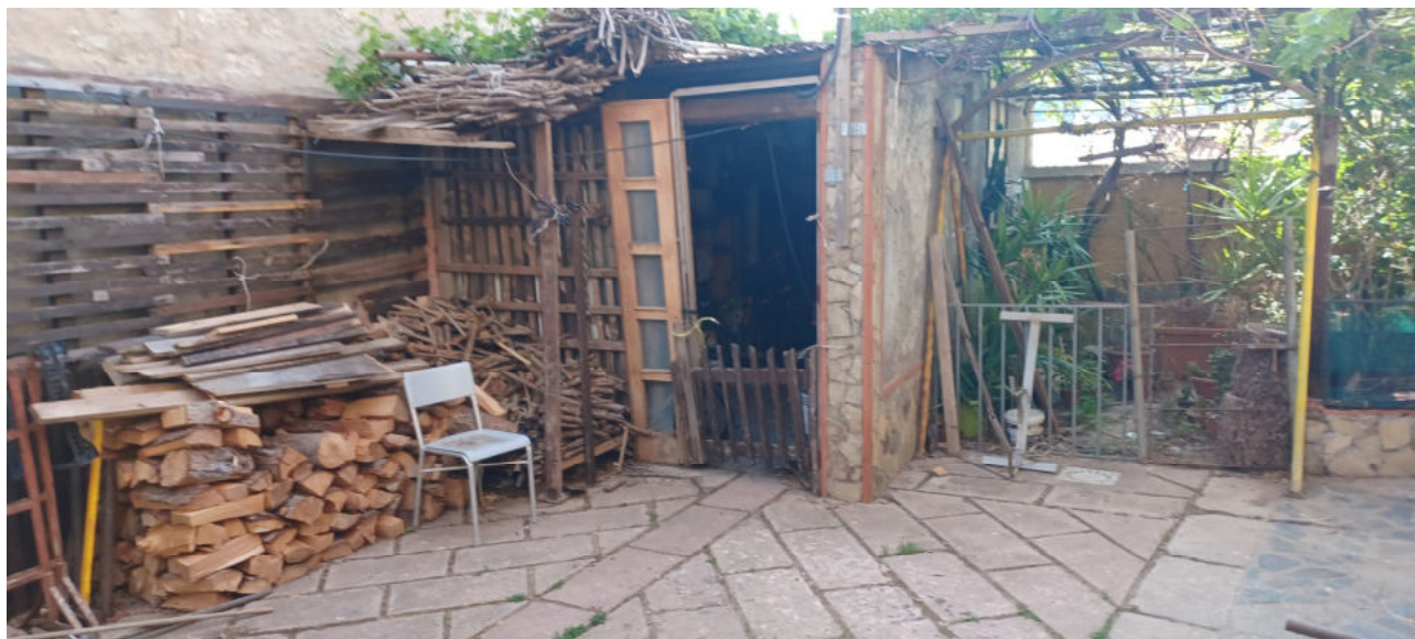
FOTO 04 - CORTILE E LEGNAIA