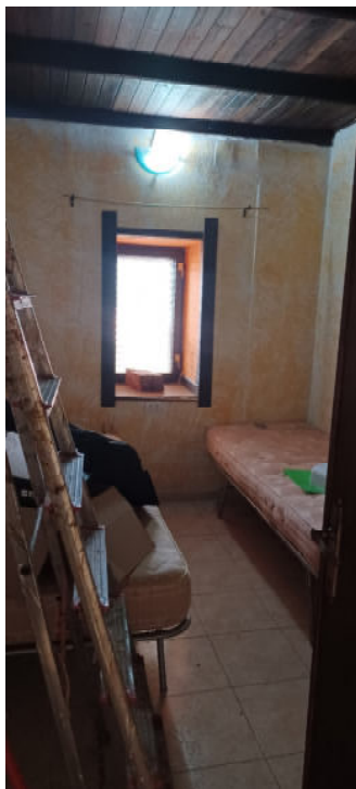
FOTO 09 CAMERA DA LETTO 1