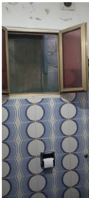
FOTO 12 APERTURA AL POZZO DI LUCE