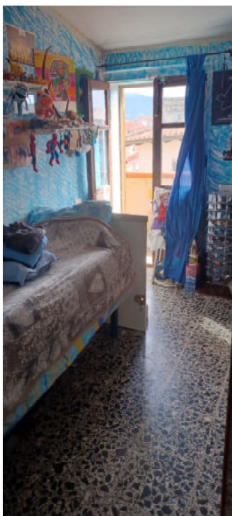
FOTO 23 - LETTO 4