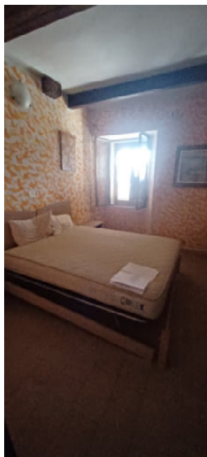
FOTO 10 CAMERA DA LETTO 2