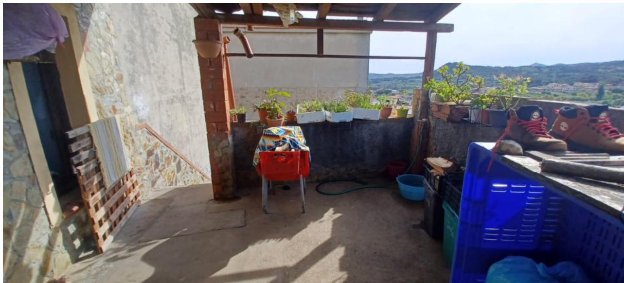
FOTO 14 TERRAZZA CON LOGGIATO D'ACCESSO AL PRIMO PIANO