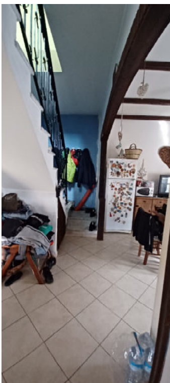
FOTO 19 - SCALA AL PIANO SECONDO