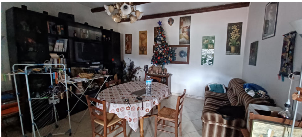
FOTO 16 PRANZO SOGGIORNO