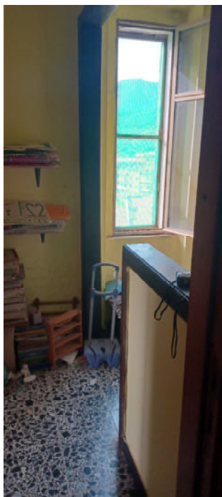
FOTO 21 - DISIMPEGNO