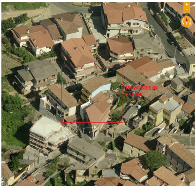
FOTO 02 - VISTA D'INSIEME DELL'IMMOBILE