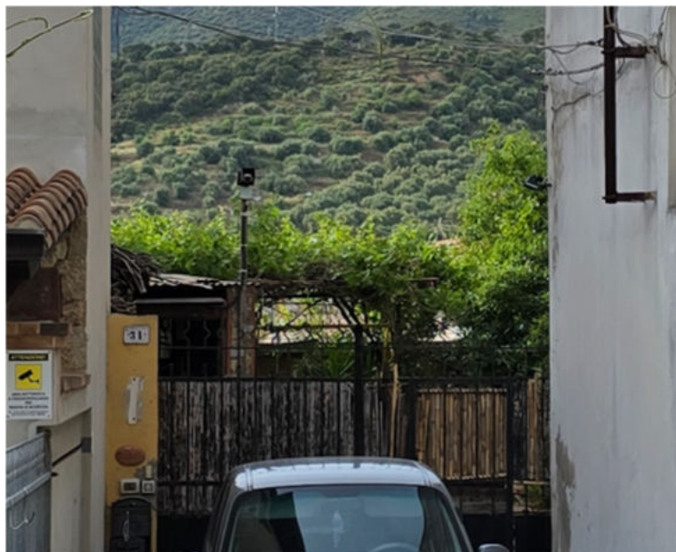
FOTO 26 - VICOLO ACCESSO E NUMERO CIVICO