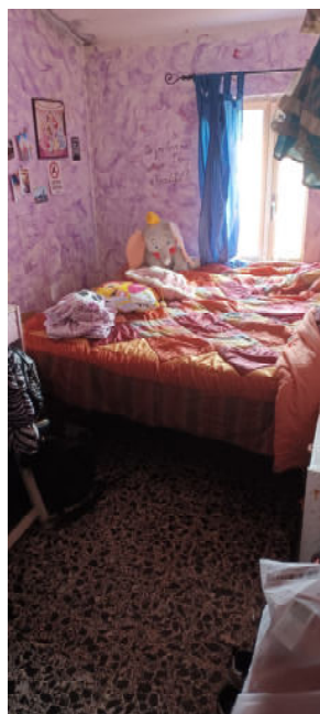
FOTO 22 - LETTO 3