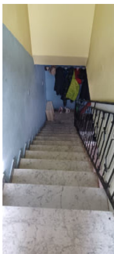
FOTO 20 - SCALA DAL PIANO SECONDO