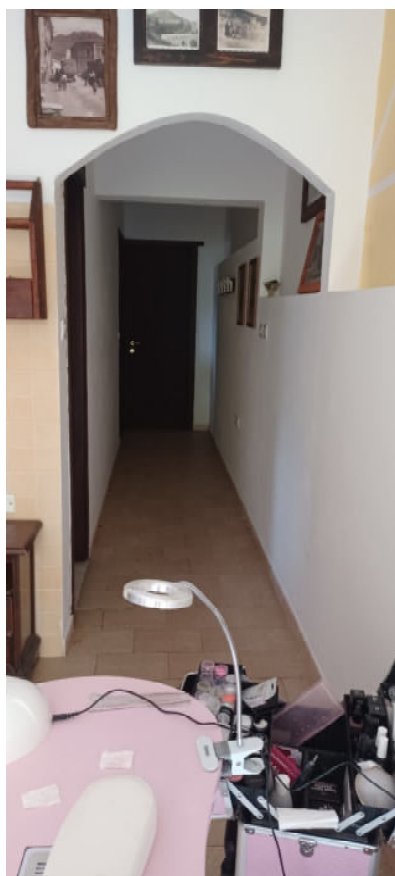
FOTO 08 CORRIDOIO