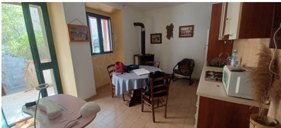
FOTO 07 PRANZO SOGGIORNO ANGOLO COTTURA