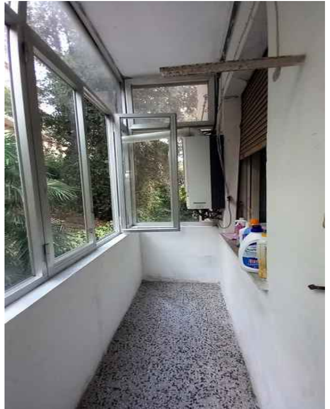
30 - BALCONE LATO CUCINA