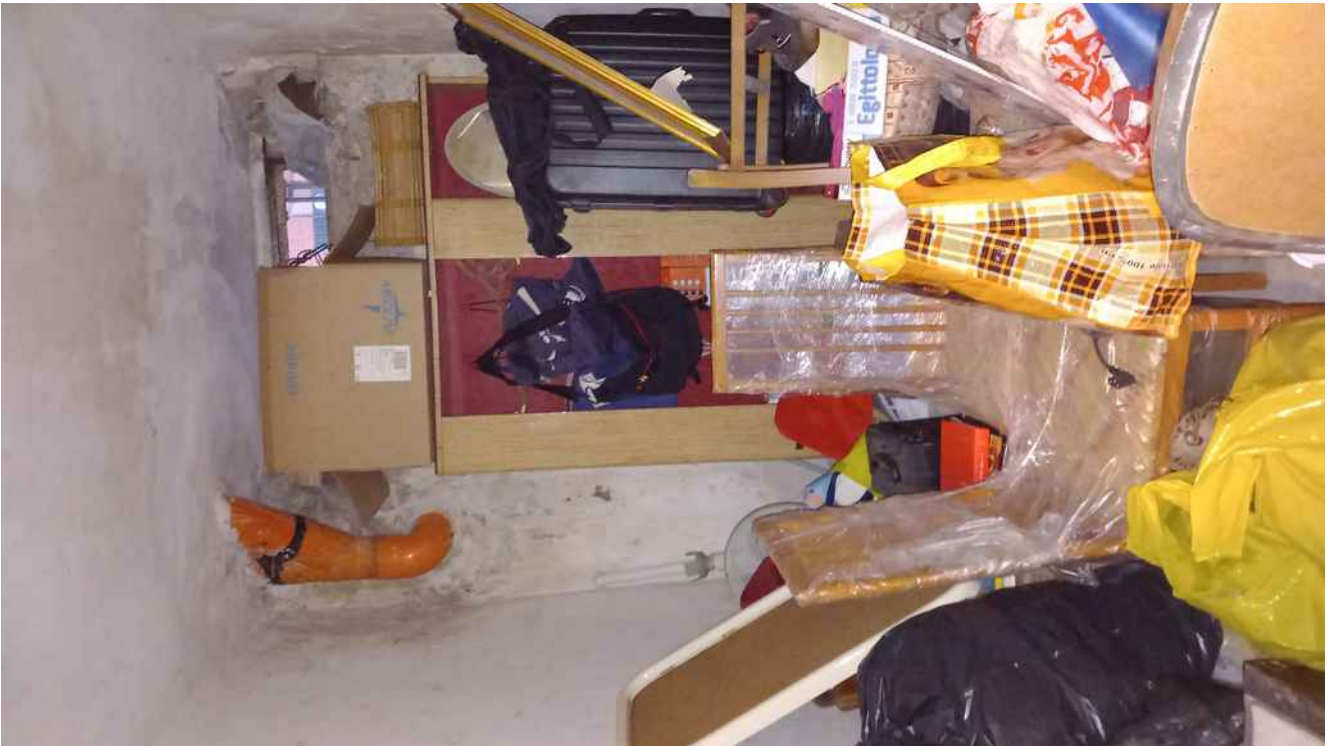
12 - CANTINA DEL SUB 6