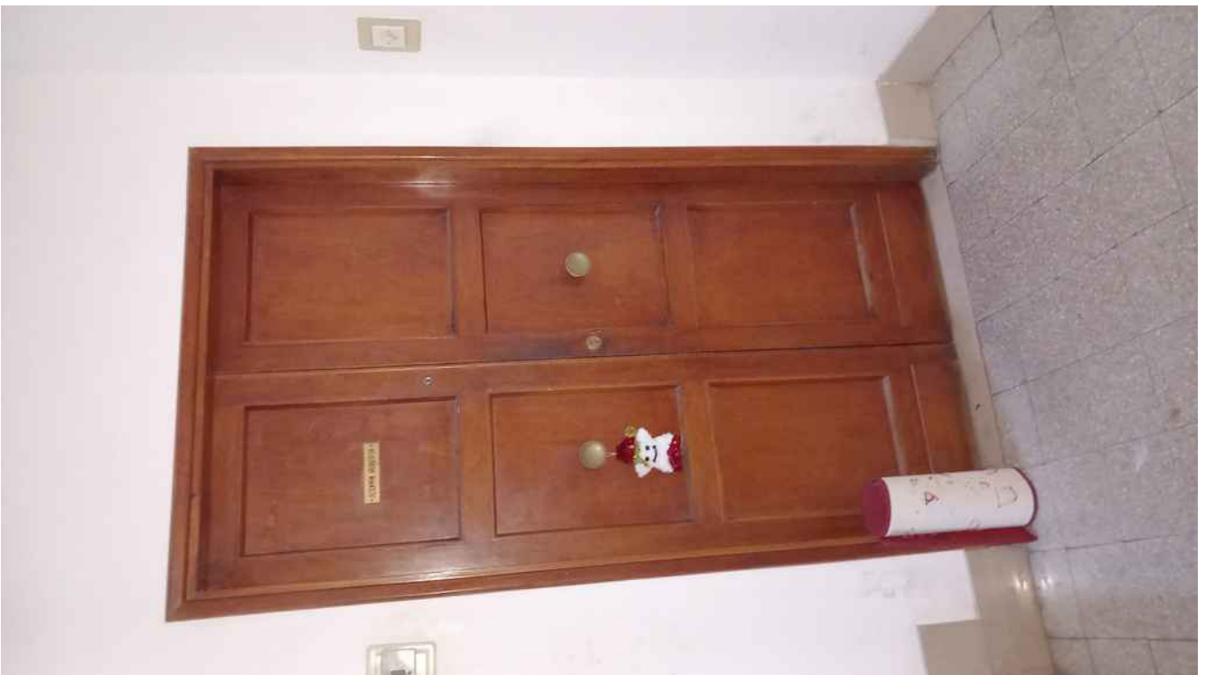
15 - INGRESSO ALL'APPARTAMENTO - SUB 6