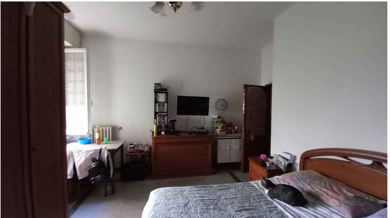
26 - CAMERA LATO EST - MQ 17,40