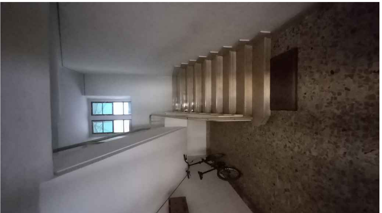
13 - SCALA CONDOMINIALE