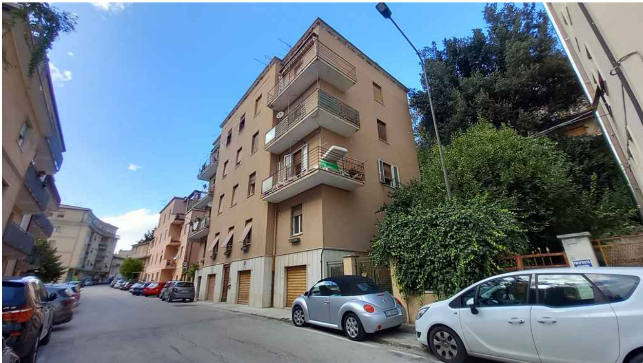
3 - CONDOMINIO VILLA ROSA – PROSPETTI SUD/EST E SUD/OVEST (SU VIALE CICCOLUNGO)