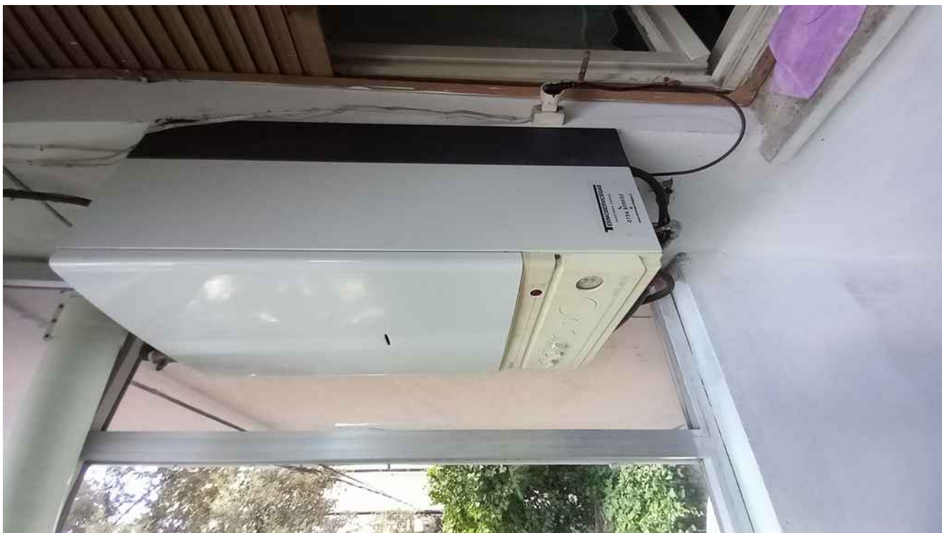
34 - CALDAIA A METANO