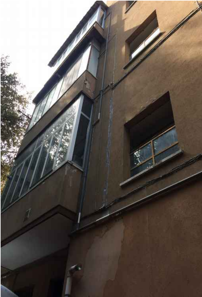
5 CONDOMINIO VILLA ROSA – PROSPETTO NORD/EST