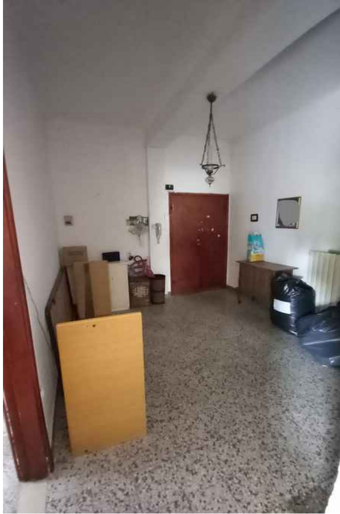
16 - INGRESSO - SUB 6