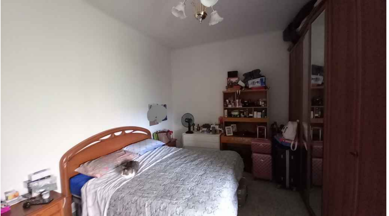
25 - CAMERA LATO EST - MQ 17,40