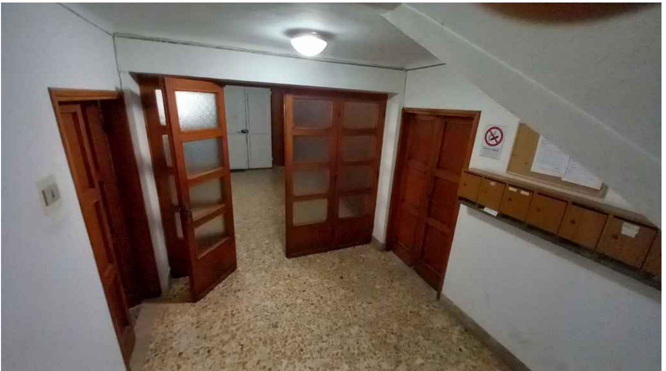
9 - VANO SCALA CON ACCESSI ALLE CANTINE