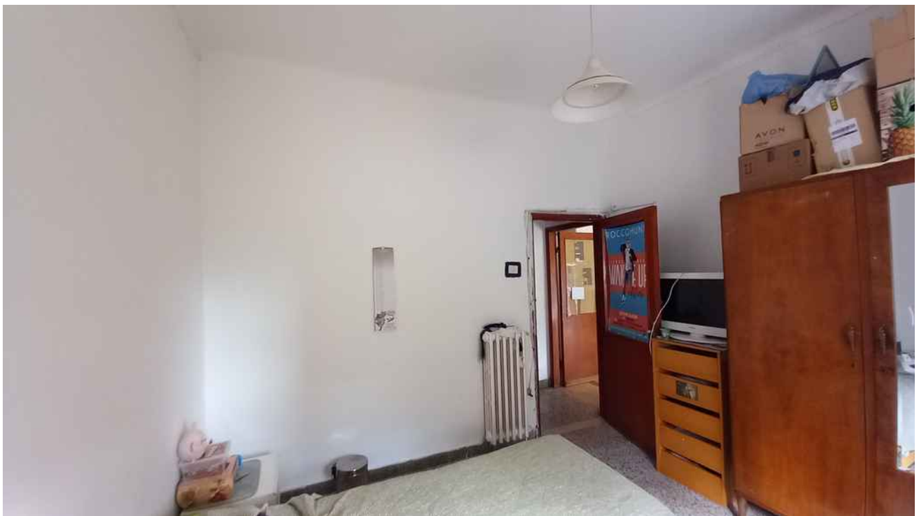
24 - CAMERA LATO OVEST – MQ 11,40