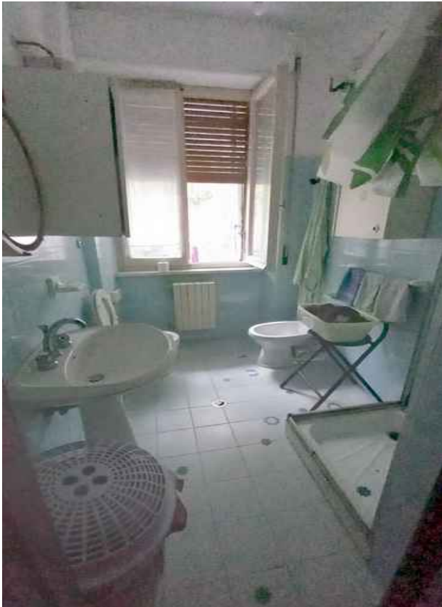
31 - BAGNO