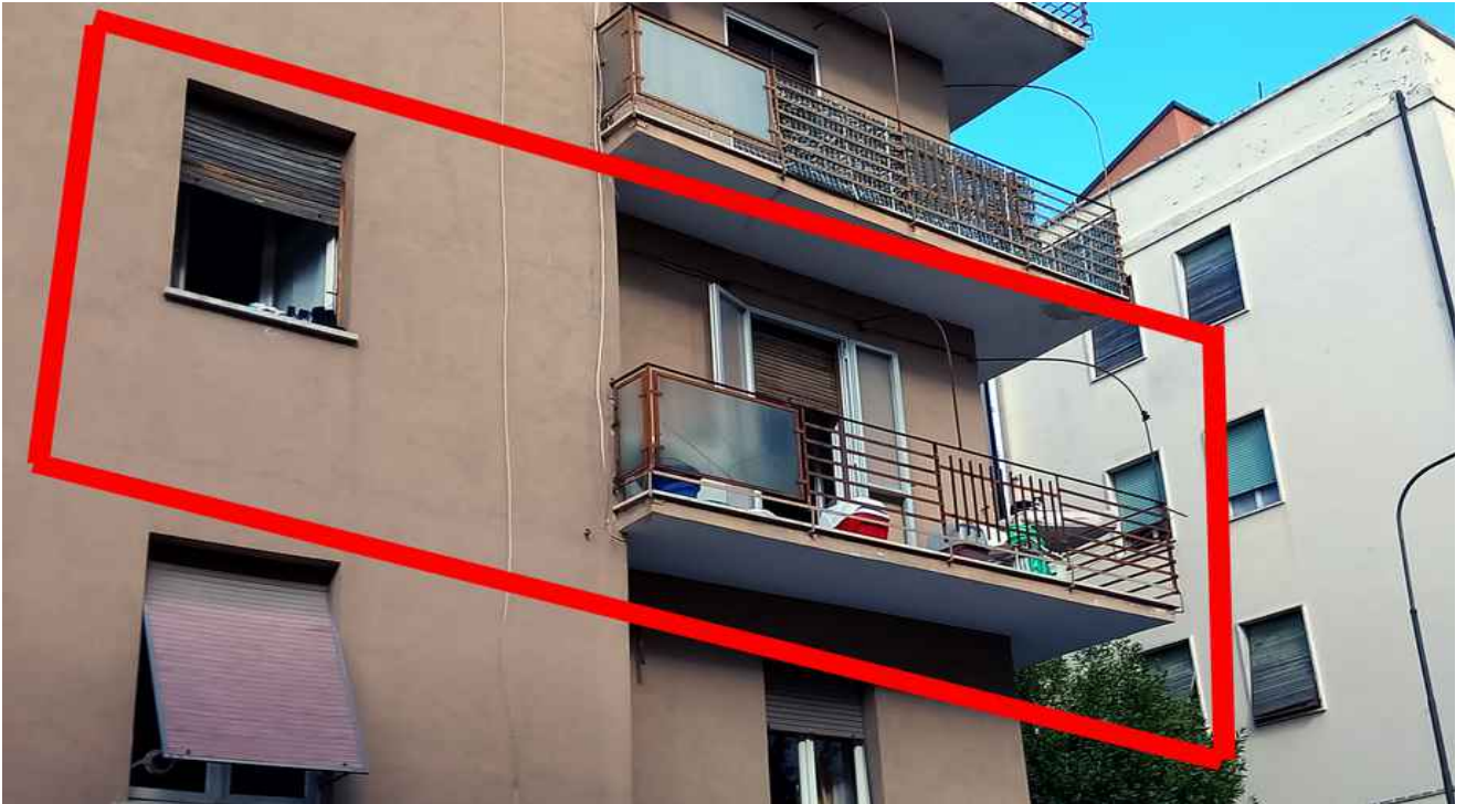
36 - STATO DI CONSERVAZIONE RINGHIERE E SERRANDE