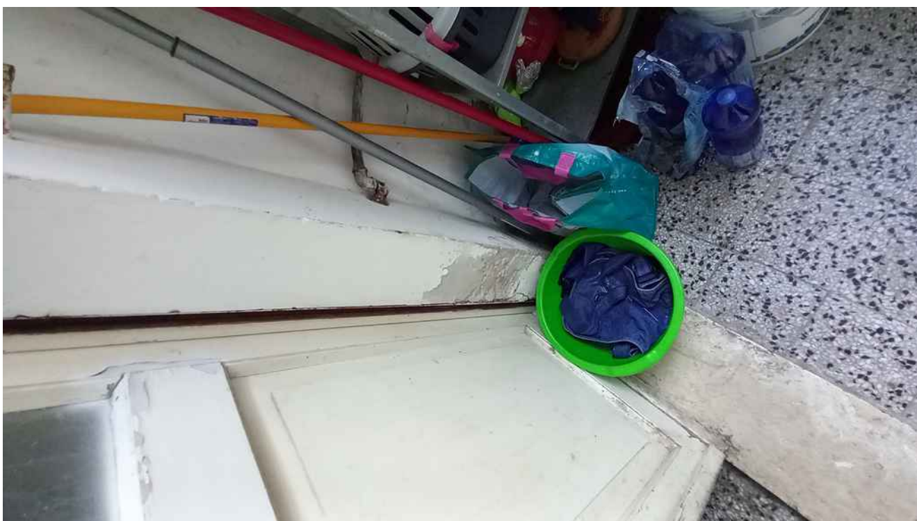
35 - STATO DI CONSERVAZIONE DI MURATURA, INFISSI E PAVIMENTAZIONE