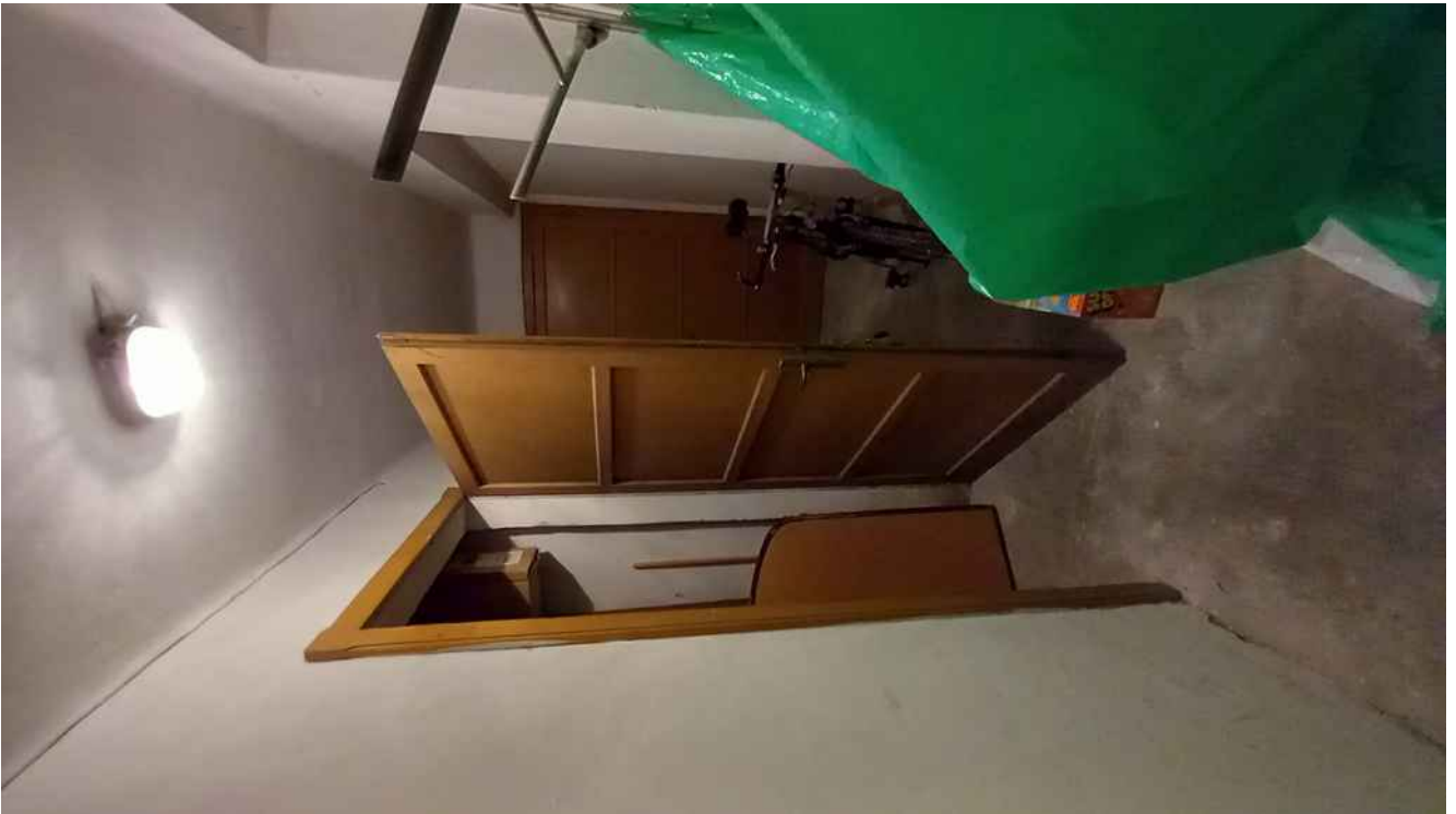
10 - CORRIDOIO CONDOMINIALE PIANO TERRA – ACCESSO ALLA CANTINA DEL SUB 6