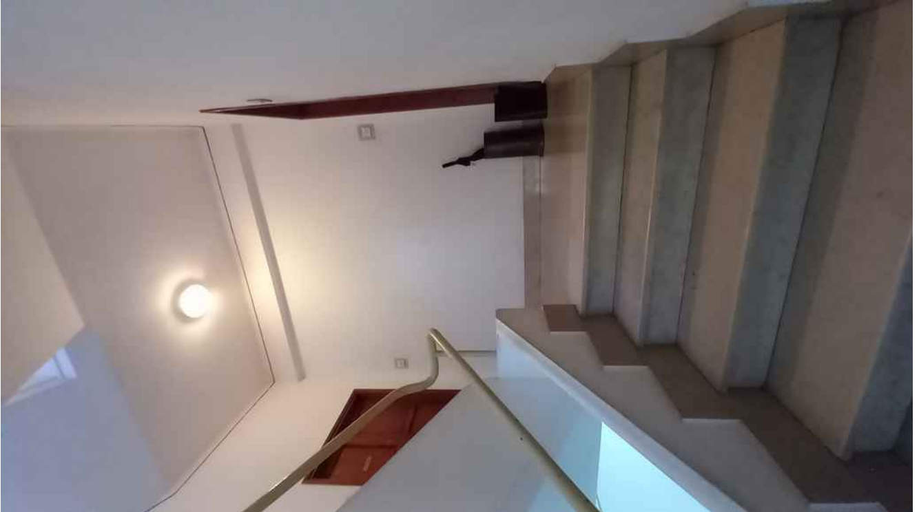
14 - PIANEROTTOLO DI ACCESSO ALLE UNITÀ ABITATIVE