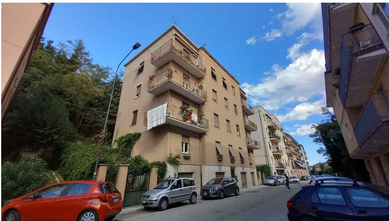
4 - CONDOMINIO VILLA ROSA–PROSPETTI SUD/OVEST (SU V. CICCOLUNGO) E NORD/OVEST