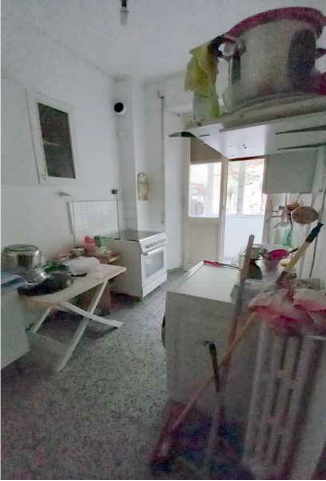
27 - CUCINA