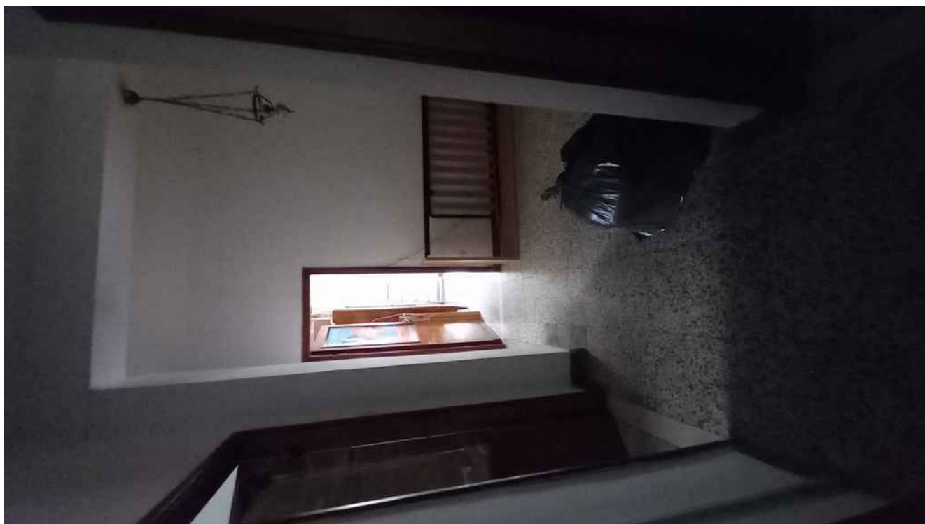
22 - INGRESSO - DISIMPEGNO