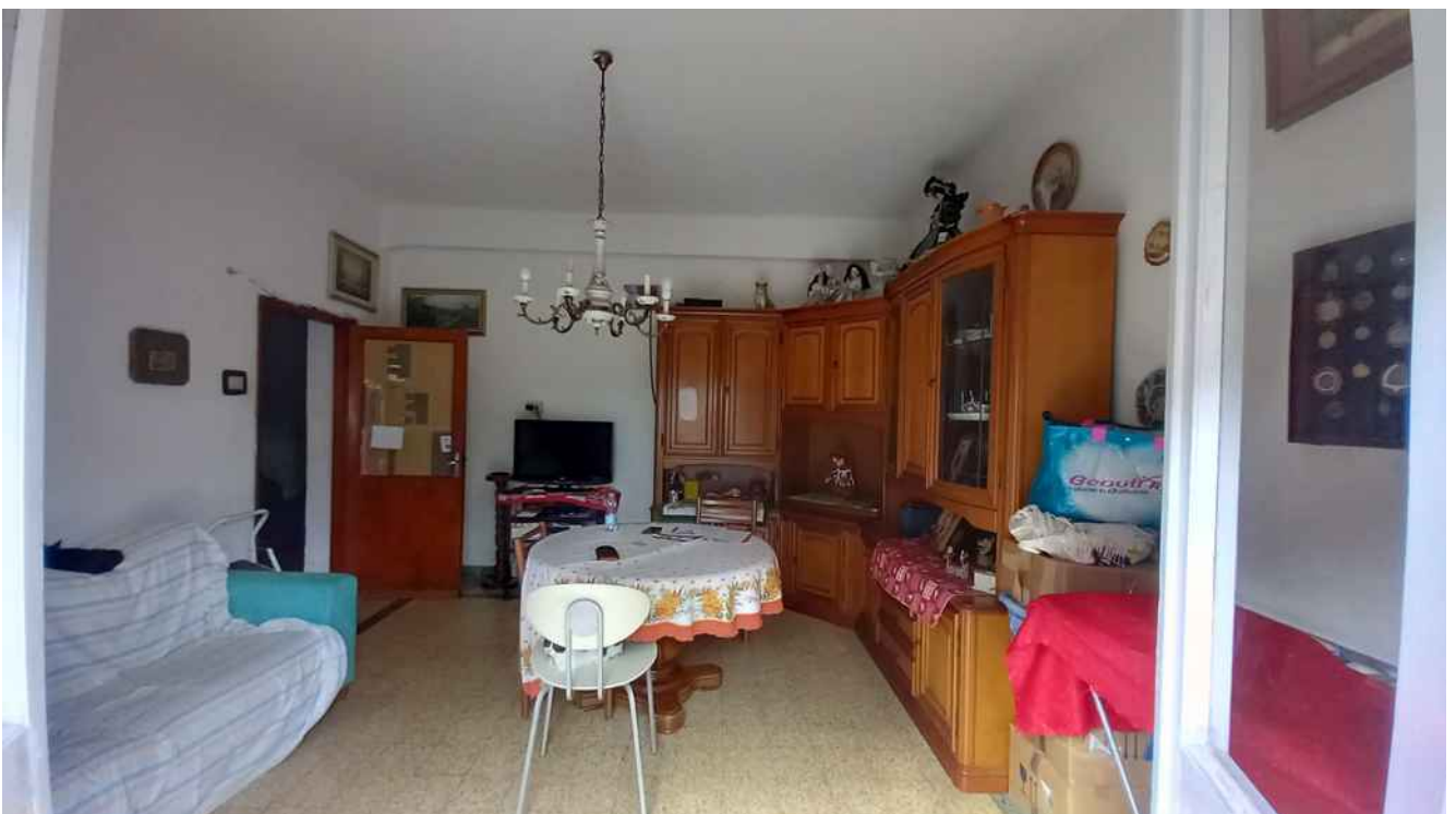
19 - SOGGIORNO