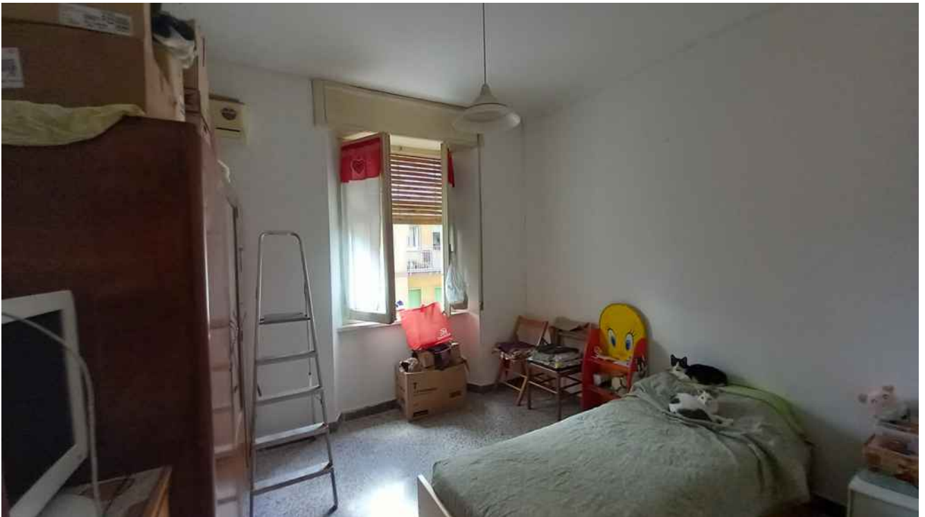
23 - CAMERA LATO OVEST – MQ 11,40