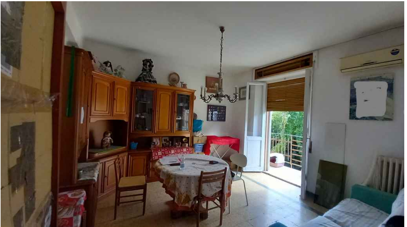
18 - SOGGIORNO