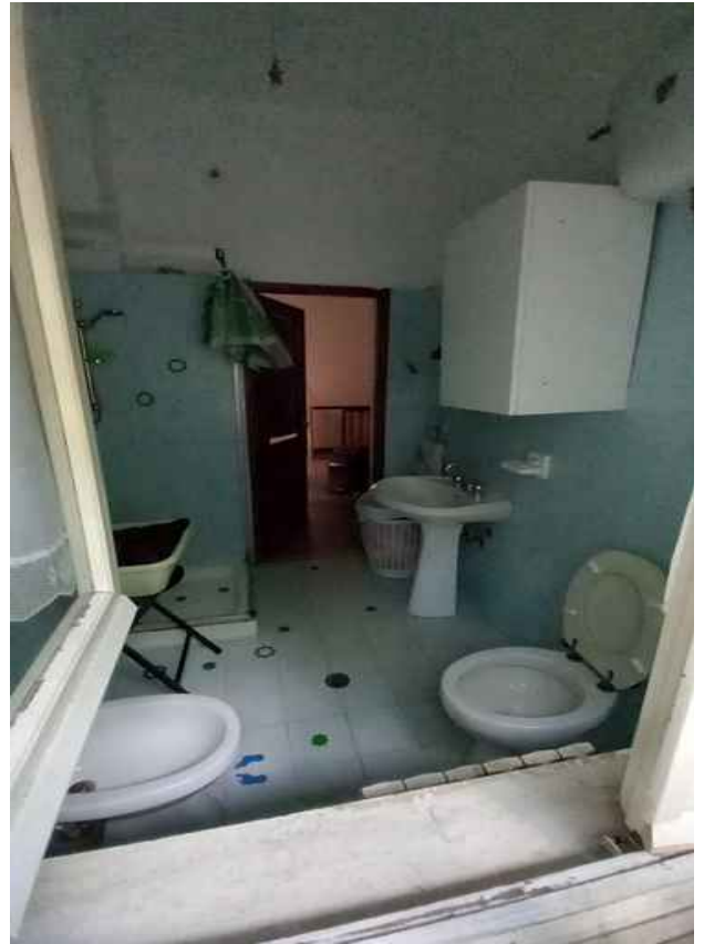
32 - BAGNO