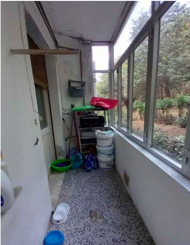
29 - BALCONE LATO CUCINA