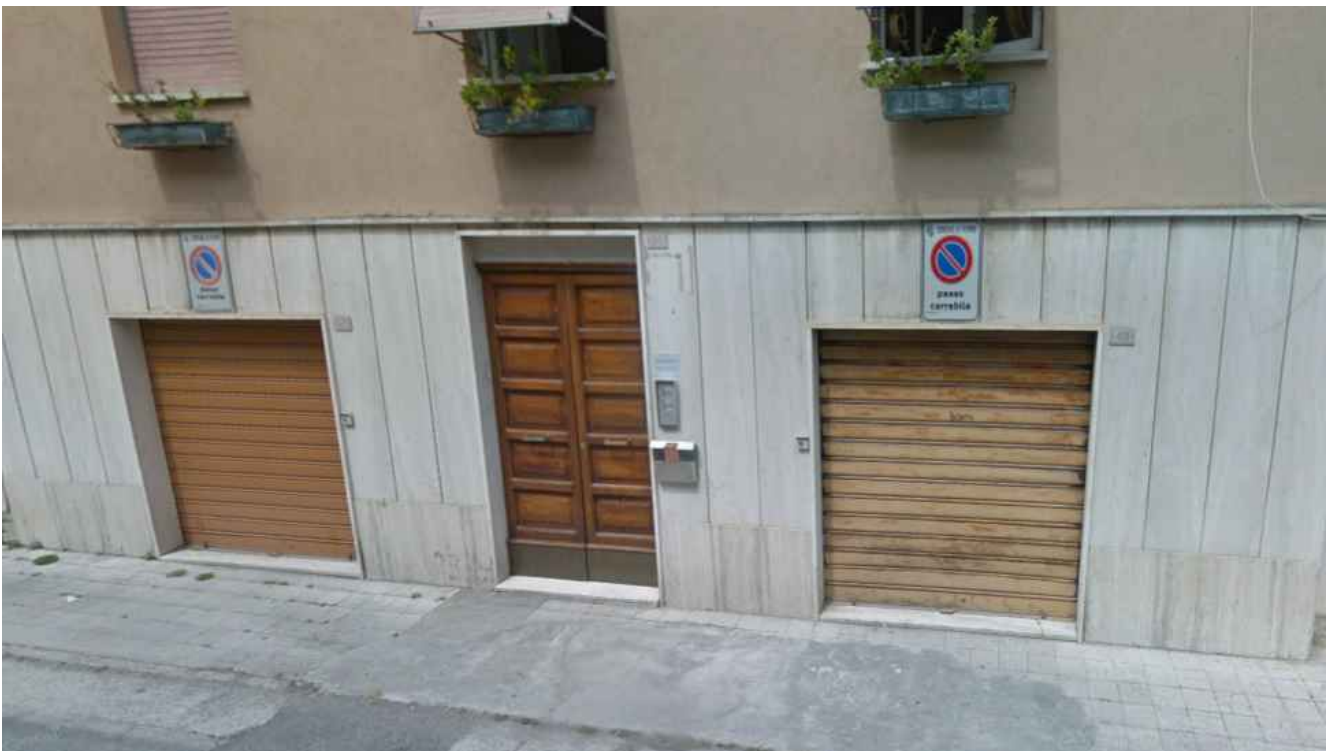
7 - PORTONE DI INGRESSO AL CONDOMINIO VILLA ROSA – VIALE CICCOLUNGO N. 51