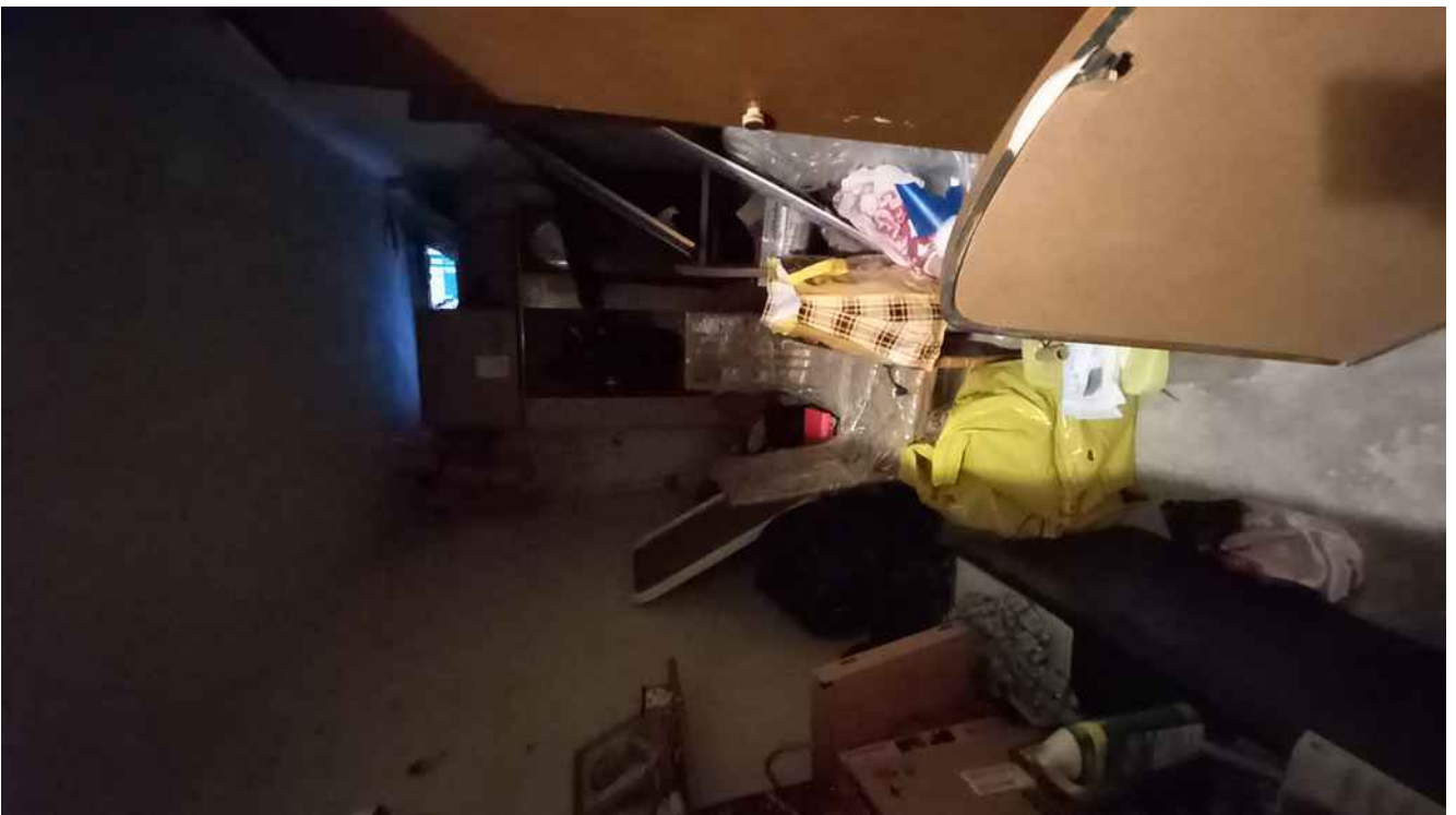
11 - CANTINA DEL SUB 6