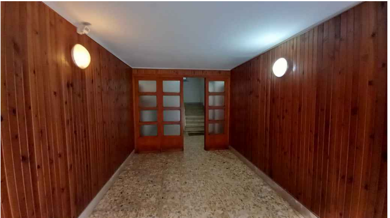
8 - INGRESSO CONDOMINIALE