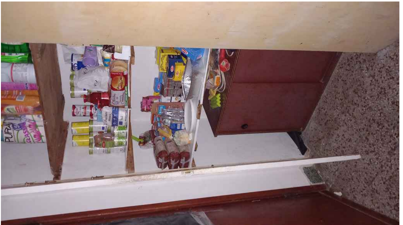
33 - RIPOSTIGLIO