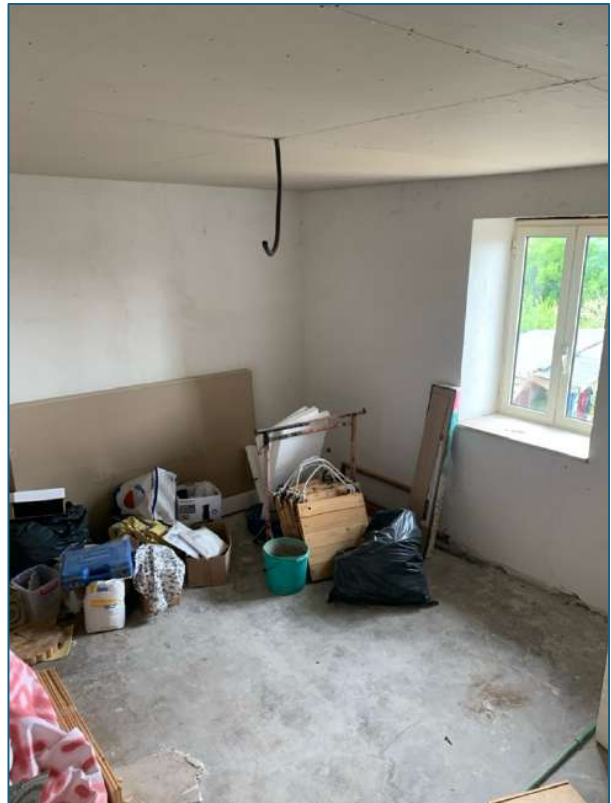
camera 2 (piano terra)