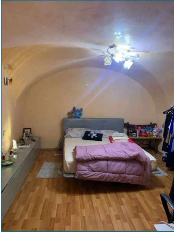
camera da letto 2 (piano S1)