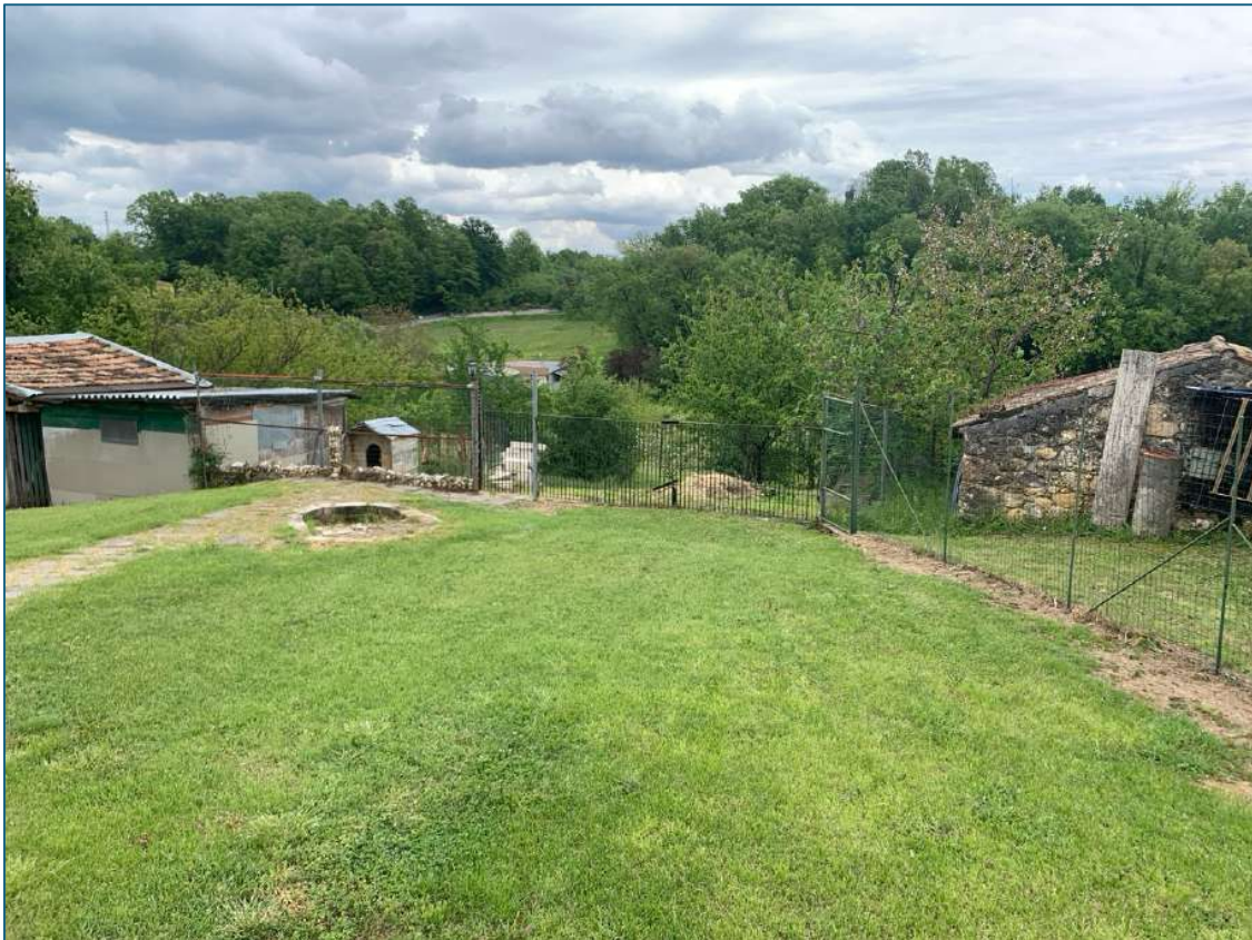
vista del terreno