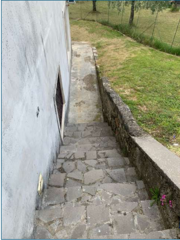
esterno – scala di accesso