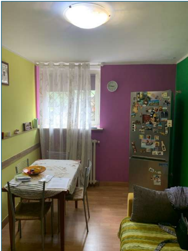
soggiorno (piano S1)