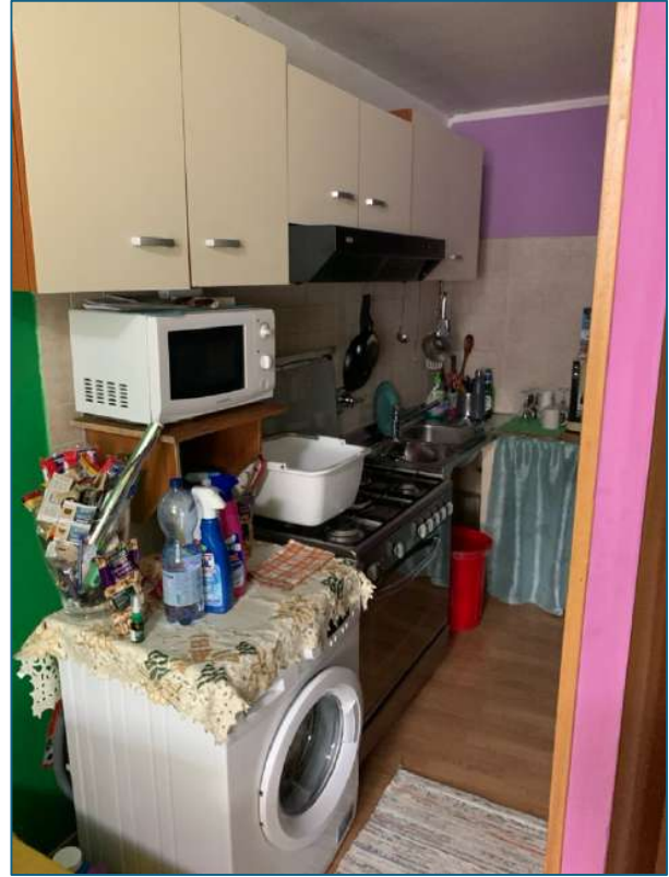
cucina (piano S1)