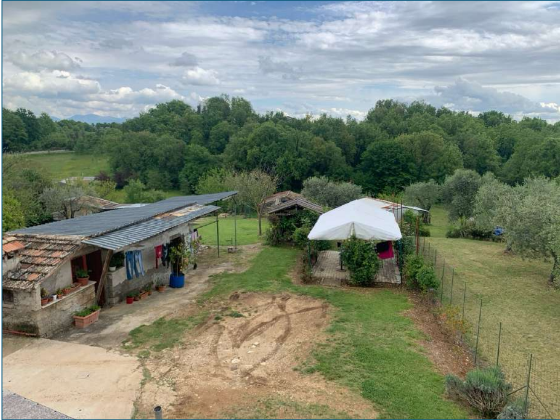
vista del terreno