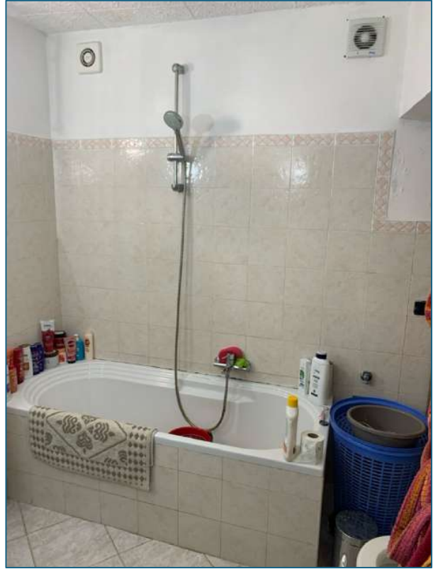
bagno (piano S1)