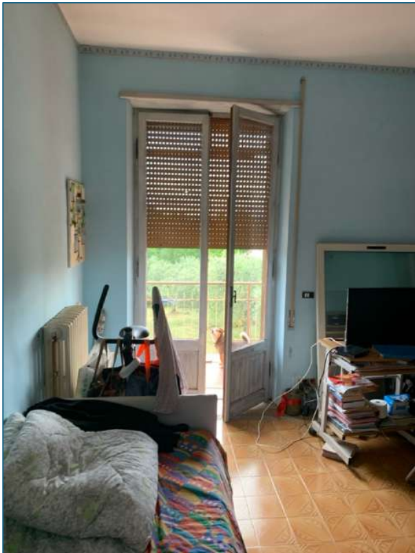
camera 1 (piano terra)