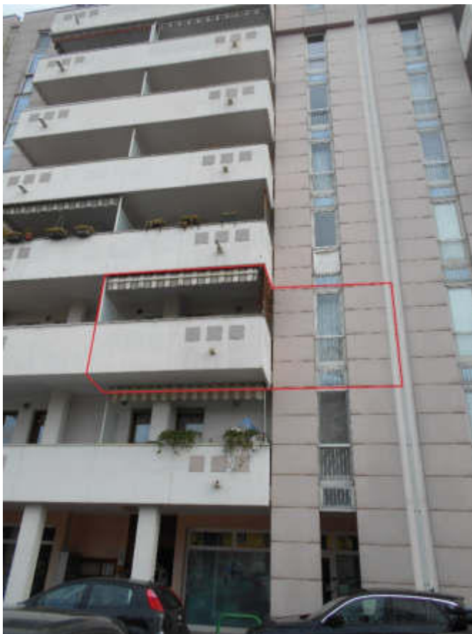
Foto 1 - Foto 2 - Foto 3: fabbricato condominiale di cui il l'appartamento fa parte, facciata sud-ovest verso via Montà. Riquadrata in rosso la porzione relativa all'appartamento in oggetto

via Santa Bertilla, 14 - 35030 Selvazzano D.(PD) email: claudiabonelli73@gmail.com PEC: claudia.bonelli@archiworldpec.it