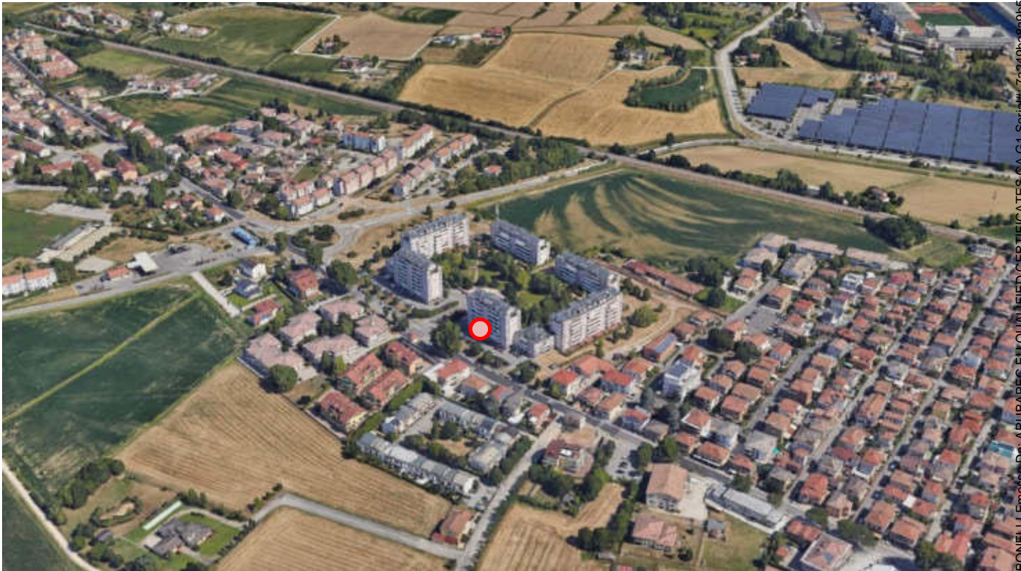
Immagine aerea estratta da google earth, individuata in rosso la porzione immobiliare in oggetto

mini Appartamento al Piano Secondo e Garage al Piano Primo Interrato, siti in 35136 Padova, facenti parte del fabbricato condominiale a destinazione residenziale e commerciale "Condominio Quercia" nel complesso immobiliare denominato "Parco Montà", con accesso dal civico n. 98/A di via Montà