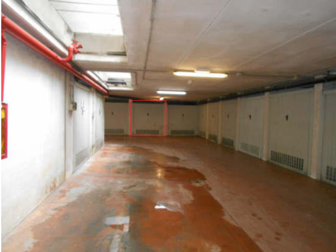
Foto 24: autorimessa interrata del compendio immobiliare, riquadrato in rosso il garage in oggetto