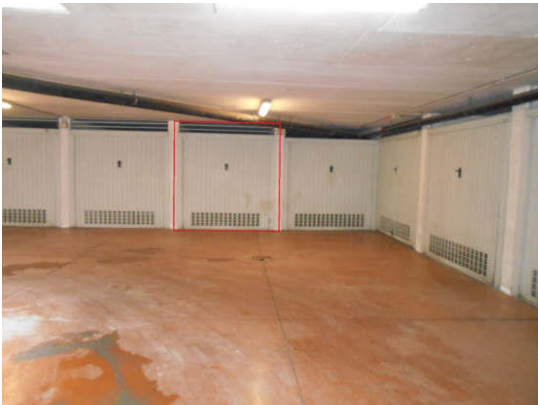
Foto 25: autorimessa interrata del compendio immobiliare, riquadrato in rosso il garage in oggetto

via Santa Bertilla, 14 - 35030 Selvazzano D.(PD) email: claudiabonelli73@gmail.com PEC: claudia.bonelli@archiworldpec.it