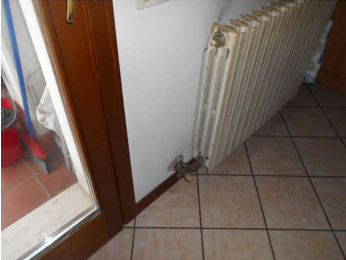
Foto 13: particolare finestra, termosifone e pavimentazione del soggiorno