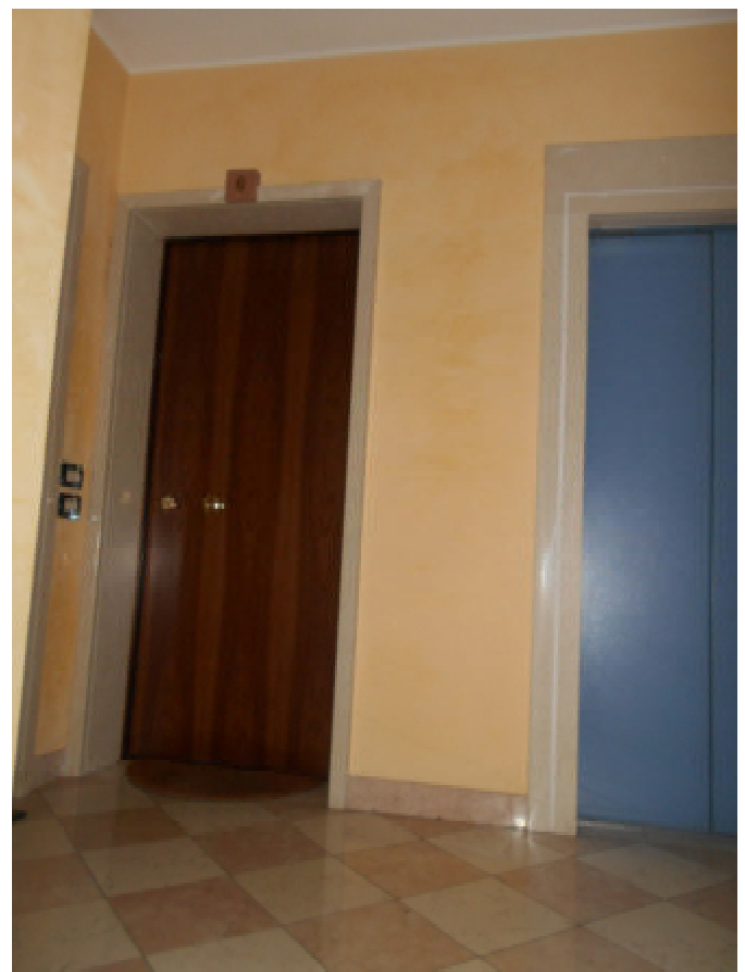
Foto 8: vano-scala condominiale, porta dell'appartamento in oggetto

via Santa Bertilla, 14 - 35030 Selvazzano D.(PD) email: claudiabonelli73@gmail.com PEC: claudia.bonelli@archiworldpec.it